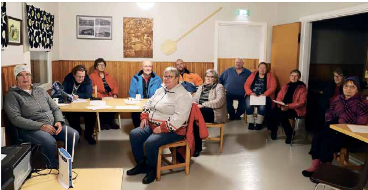
Kuivaniemen Nuorisoseuran syyskokoukseen osallistui 12 henkeä.

Seurojen taloa ja kalustoa vuokrataan eri tilaisuuksiin ja juhliin järjestetään tapahtumia ja juhlia tilauksesta. Seurantalokiinteistöä pidetään kunnossa ja tehdään tarvittavat remontit ja uudistukset. Nuorisoseuran lehti Kuivalainen julkaistaan yhteistyössä IiSanomien kanssa.