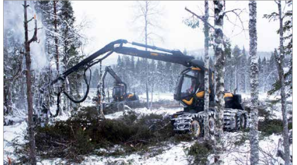
Metsä-Hyvönen metsäkoneet työssään Pohjois-Ruotsissa.