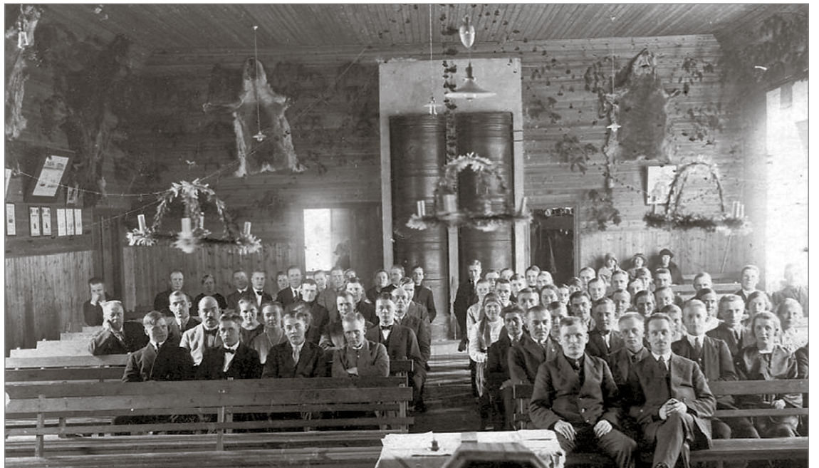
Vuonna 1926 Kuivaniemen seurantalolla pidetyn Pohjois-Pohjanmaan nuorisoseurojen liiton syyskokouksen osallistujia yhteiskuvassa.