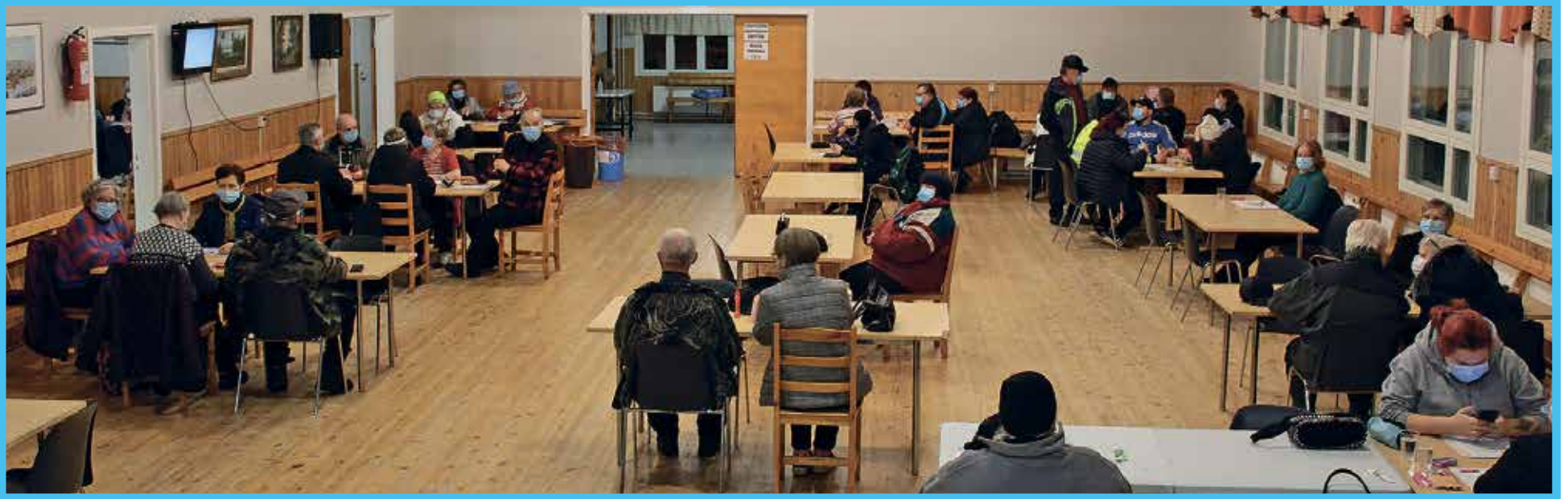
Laaja sali ja maskit mahdollistivat turvallisen pelaamisen