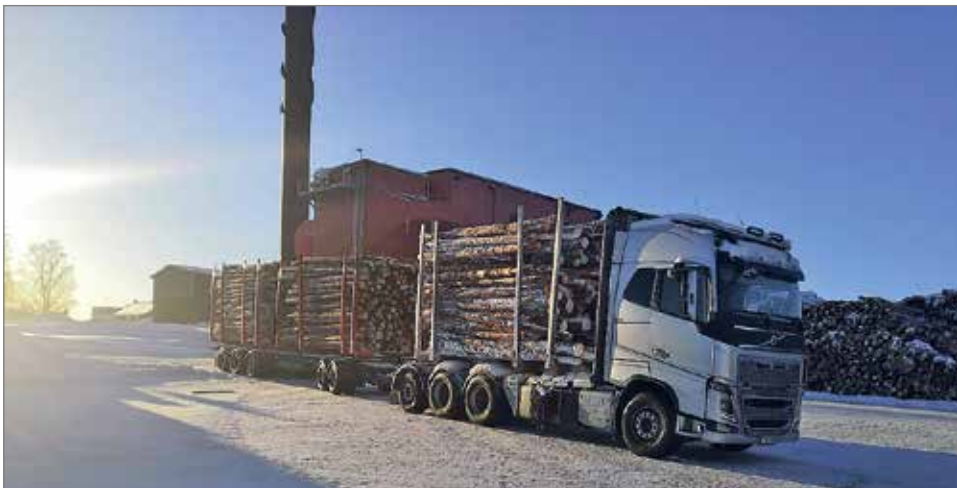
Hakutut puut kuljetetaan Stenvalls Trä sahalle Haaparantaan.

- Ostamme itsekin puuta Suomessa ja ajamme ne tänne Stenvallin sahalle. Vuodenvaihteessa yksi hakuketjuistamme palaakin takaisin Suomeen, jatkamaan urakointia kotipuolella. MTR