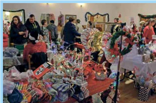
Joulumyyjäisissä 2019 sali täyttyi tuotteista ja ostajia riitti.