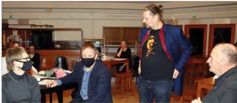
Kokouksessa yhteydessä yrittäjät vaihtoivat myös ajankohtaisia kuulumisia.