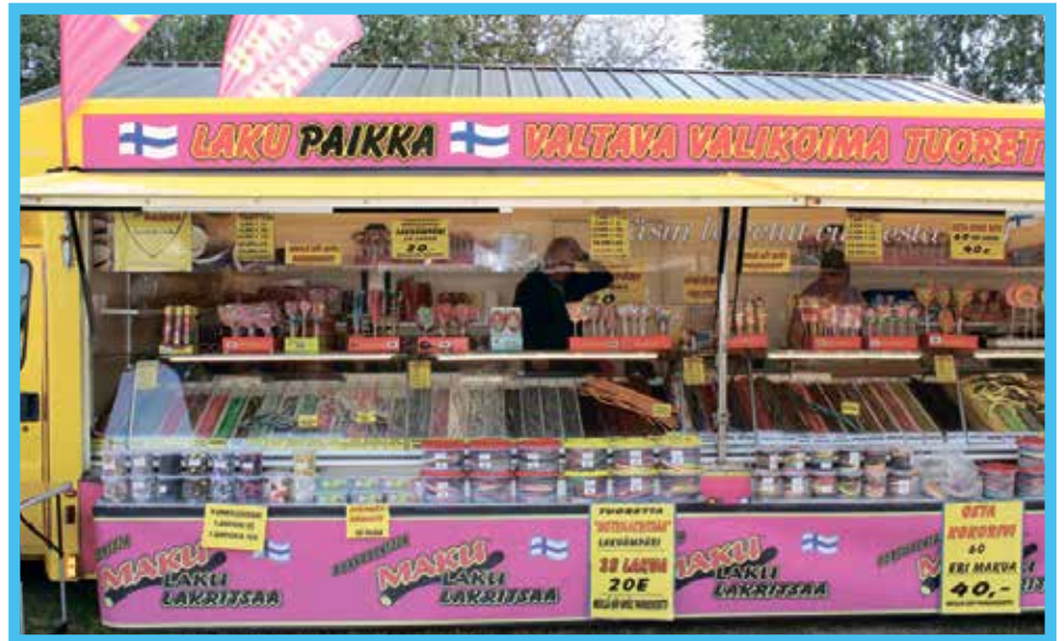
Lakut kuuluvat oleellisena osana markkinoille.