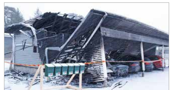
Rantakestilän tiellä tapahtunutta autokatospaloa tutkitaan tuhotyönä. Palossa tuhoutui täysin kaksi autoa ja useita muita vaurioitui.