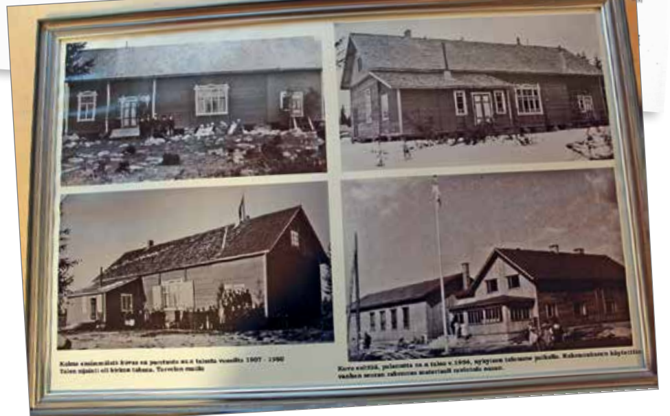
Yllä: Vuodelta 1926 oleva lehtileike kertoo Kuivaniemellä pidetystä Nuorisoseurojen liiton syyskokouksesta. Kuva on ennen julkaisematonta. Alla: Seurantalokahvion seinällä oleva kuva kertoo omasta tarinaansa talon historiasta.

sineet ikkunat ja ovet. Nyt saamme sähköt ja sisäpinnat kuntoon, joten tulevaisuuden suunnitelmissa voimme