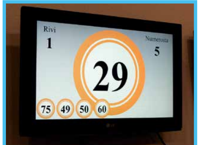
Salin seinällä olevasta taulusta voi tarkistaa huudetun numeron.