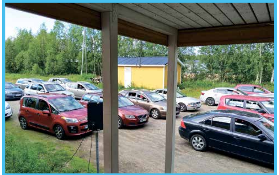
Korona-ajan autobingo sai suuren suosion.