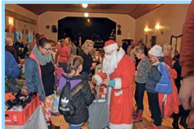
Jouluun kuuluu joulupukki jakamassa lapsille karkkeja.