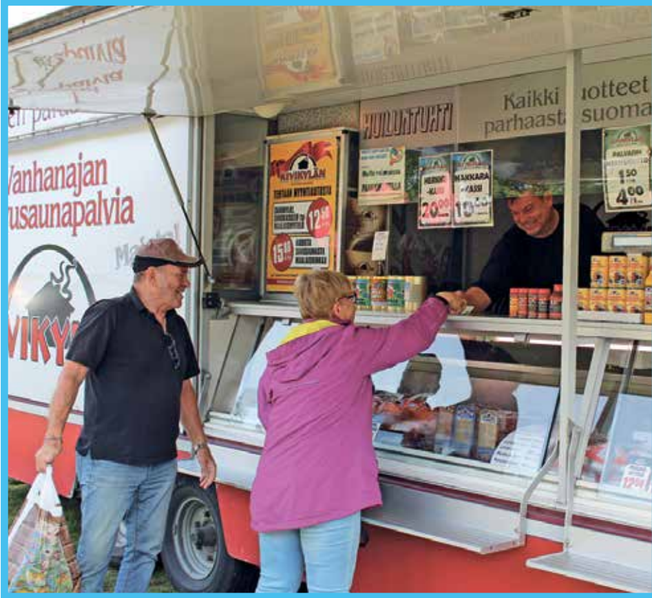
Syysmarkkinoilla kauppaa tehtiin hymyssä suin.

Kuivaniemen Nuorisoseura on kuluneen vuoden aikana organisoinut monia tapahtumia seurantalolle. Joulumyyjäiset ja syysmarkkinat keräsivät talon ja ympäristön täyteen myyjiä ja ostajia. Tänä jouluna myyjäisiä ei voida järjestää, mutta myyjille ja ostajille suunnitellaan turvallista tapaa kaupankäyntiin nuorisoseuran toimissa välittäjänä. Ohessa kuvakavalkadia viime vuoden joulumyyjäisistä ja tämän syksyn syysmarkkinoista ja autobingosta. MTR