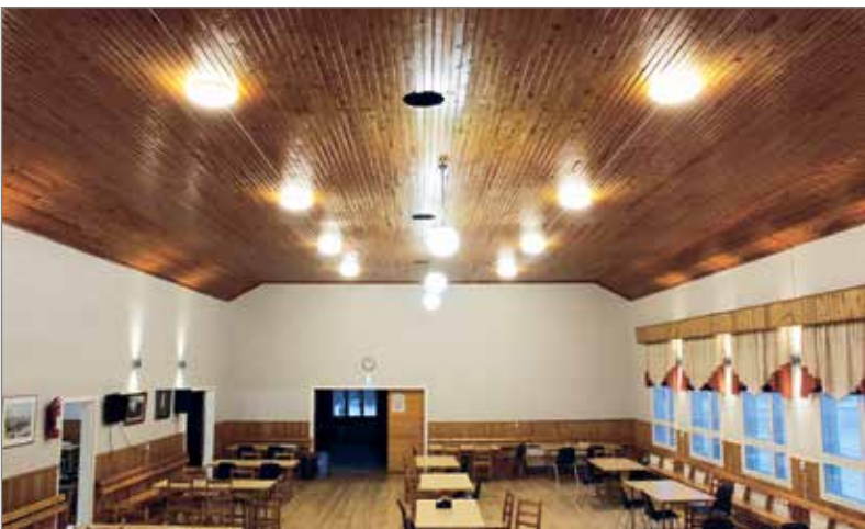
Salin kuten koko talon valaistus uusittiin perinteitä kunnioittaen.