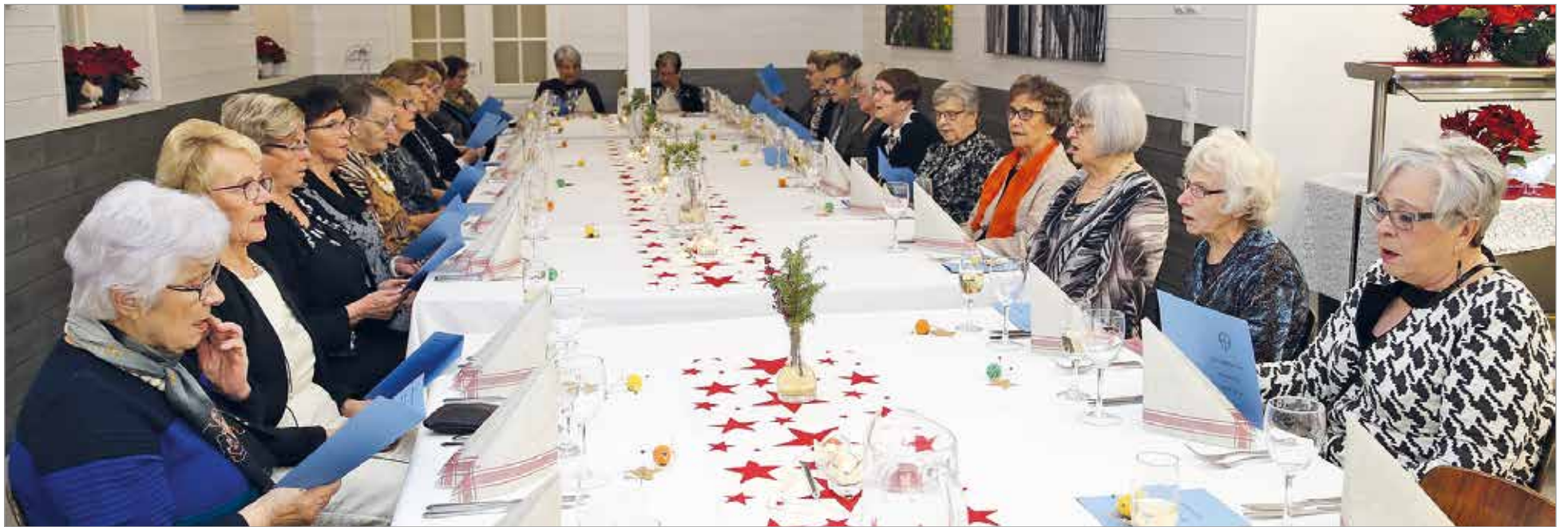
Iin Sillat oli juhlapaikkana, jossa tervetuliaissanojen jälkeen kajahti vuodelta 1927 peräisin oleva Marttalaulu.