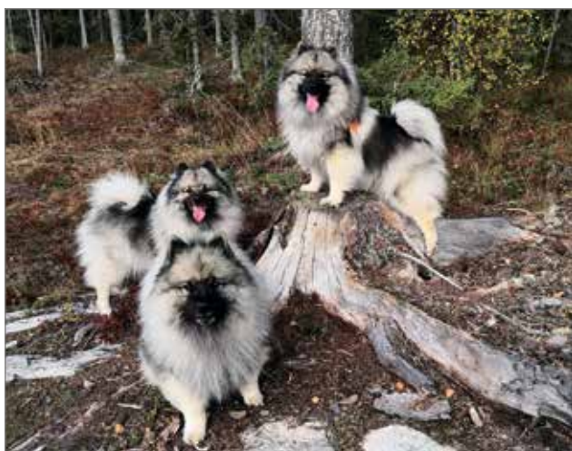
Keeshond rotuinen Opri fauske on Nordic muotovalio. Jare on kansainvälinen muotovalio. Jare -koira on menestynyt Norjan koiranäyttelyssä.