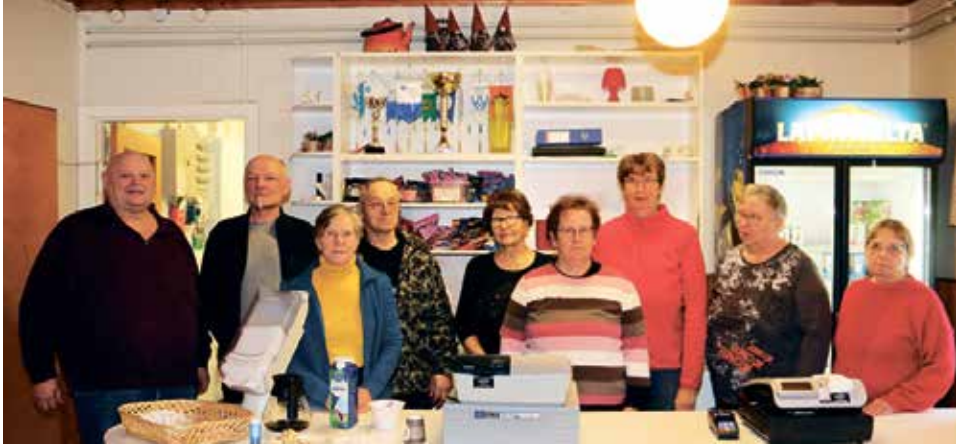
Kuivaniemen Nuorisoseuran syyskokoukseen osallistui 10 henkeä.