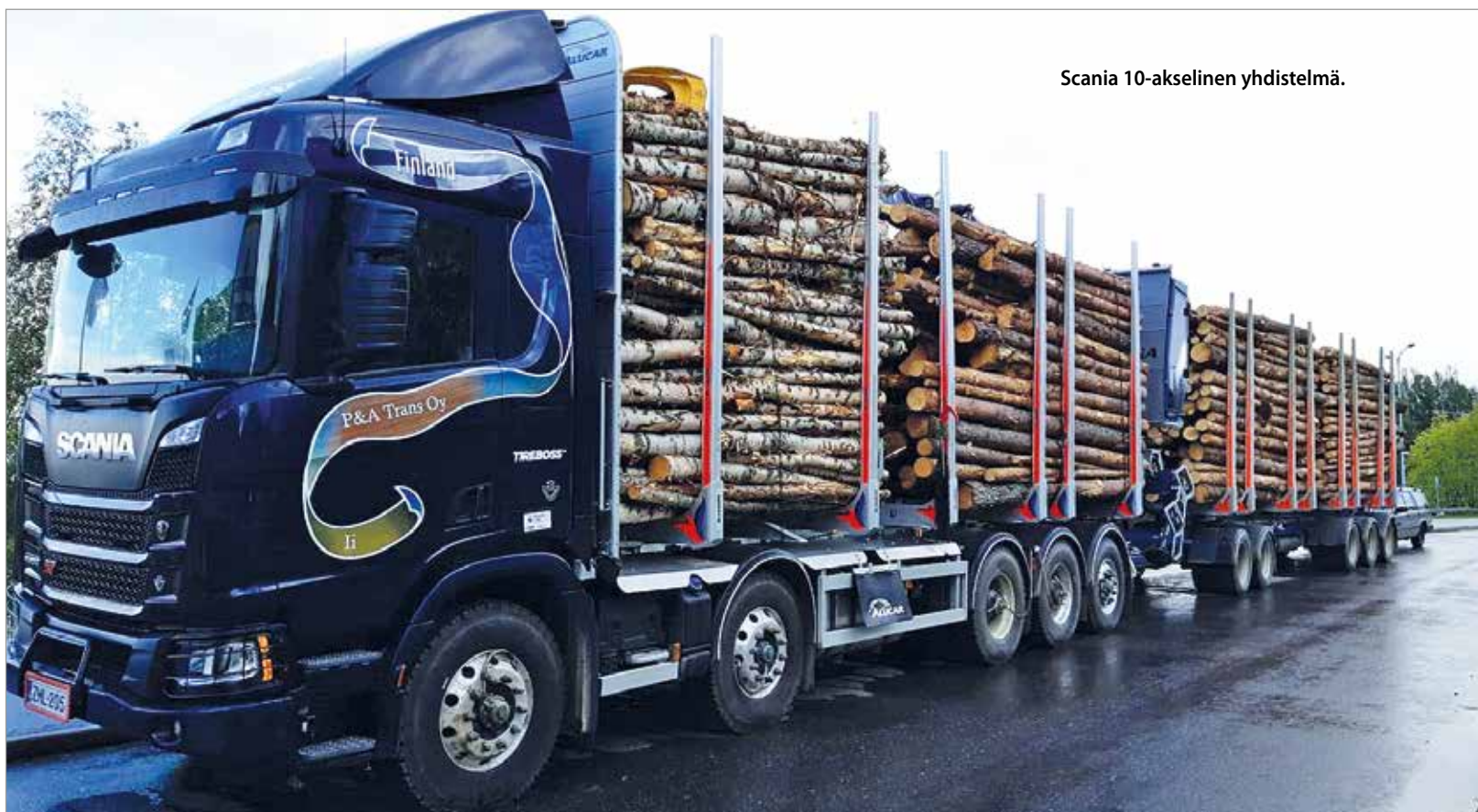
Scania 10-akselinen yhdistelmä.