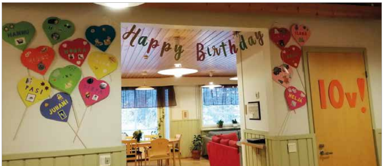
Startin sisääntuloaula koristeltu asukkaiden kanssa.

kuntoutujista sekä muista vajaakuntoisista asiakkaista. Yhteensä Iin erityisryhmien tuetun asumisen asiakkuudessa on n. 50 asiakasta, joista suurin piirtein puolet on kehitysvammaisia.