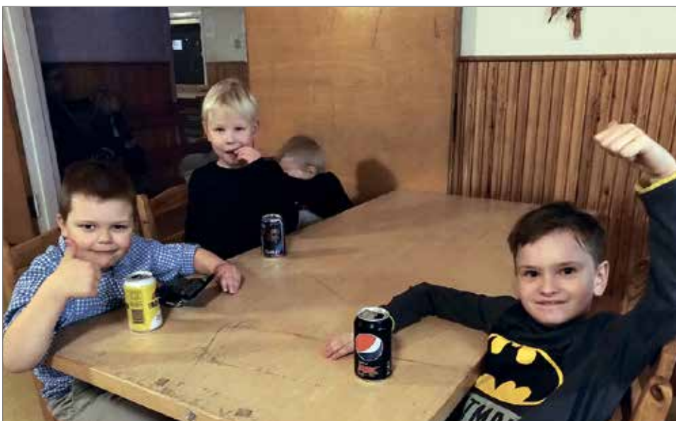
Pojat Seuralla discossa.