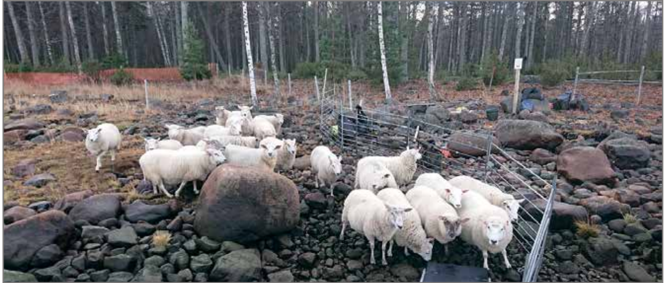
Lampaat ovat ketteriä eläimiä ja pärjäävät kivisemmälläkin laitumella.

Eskolan lammastilalla tuotetaan lampaanlihaa sekä teutetaan perinnebiotoopin ja maisemanhoitoa. Tilan nykyinen isäntä Ville Eskola jatkaa vanhempiensa aloittamaa lammastuotantoa Simonkyllällä sijaitsevalla tilalla. MTR