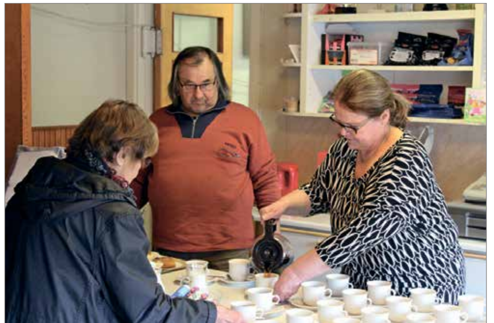
Nuorisoseuralaiset olivat tarjoilemassa kahvia Herra Alzheimer näytelmän tauolla Seurantalolla.