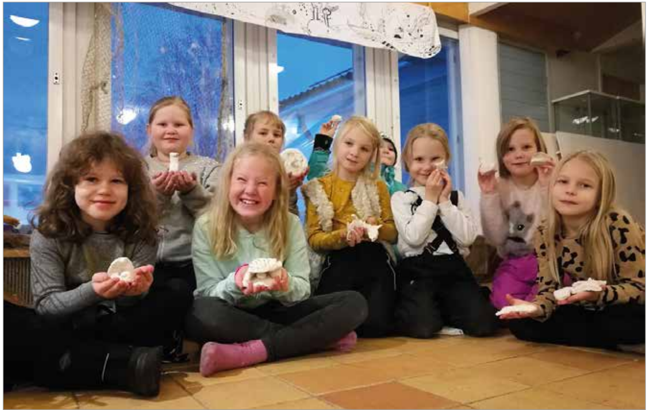
Kuvissa Haminan taidekoulun oppilaita. He tekivät vedeneläimiä savesta.

"SIILIN PESÄ" Kuoritut oksat, kanto ja savi. Kulttuurikauppilan iltaryhmä. Kullimme alkusyksyllä pihalla, etsien luonnonmateriaaleja. Löysimme myös siilin, jonka ympärille keräänyimme aika usein taidekoulun päätteeksi. Onko se oikeasti kuollut? Mitä siilille on käynyt? Siilistä tuli meille tärkeä ja yhdessä teimme sille pesän, pihalta kaadetun puun oksista. Naulasimme, sahasimme ja osa innostui puukolla vuolemista. Ja lopulta, savesta muotoilimme uusia siilejä, uutta elämää.