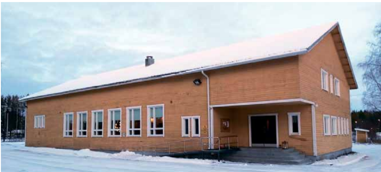
Kuivaniemen Nuorisoseuran talo, tutummin Seura, on valmistunut 62 vuotta sitten vuonna 1957.