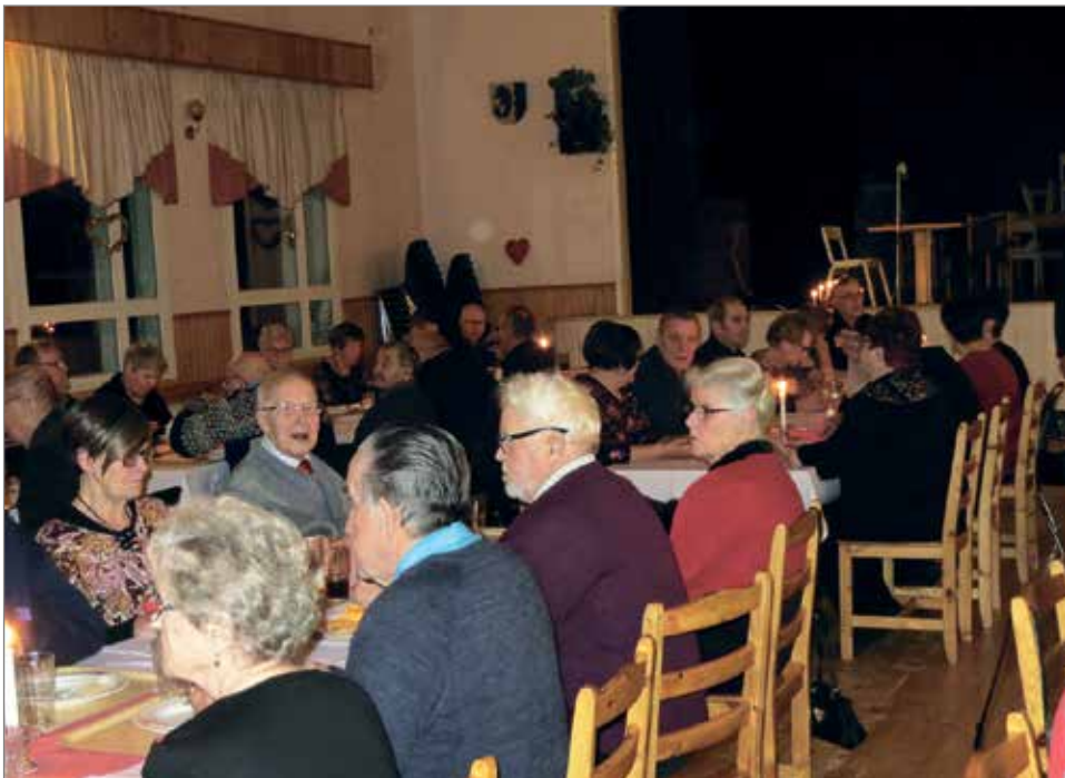
Kuivaniemen Eläkkeensaajat ovat pitäneet vuosien ajan pikkujoulu Seuran talolla, tänä vuonna pikkujouluväkeä Seuran tilavassa salissa perjantaina 29.11.