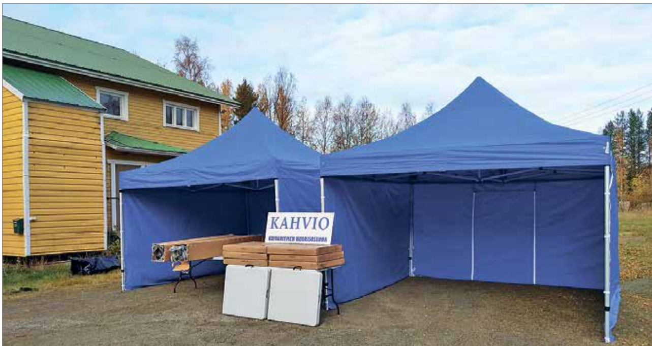
Seuran uudet teltat.