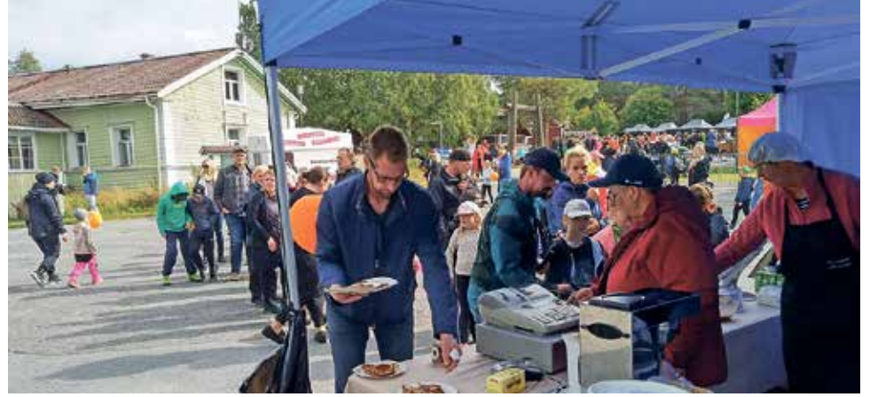
Pitkä oli jono nuorisoseuran läty kokille. Iissä ilmastoarena tapahtumassa