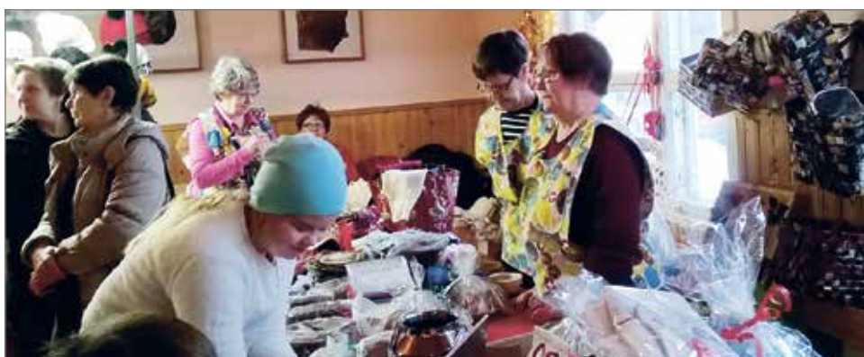
Eläkeliiton Kuivaniemen yhdistyksen väki on tänäkin vuonna Joulumarkkinoilla tutulla paikalla!