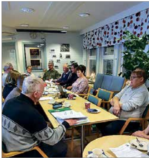
Kuivaniemen Kotiseutuyhdistyksen syyskokouksesta.

Jäsenmaksun voi maksaa yhdistyksen sihteerille, kesällä pitäjämärkinateltalle tai yhdistyksen www-sivuilla olevan ohjeen mukaan. AR