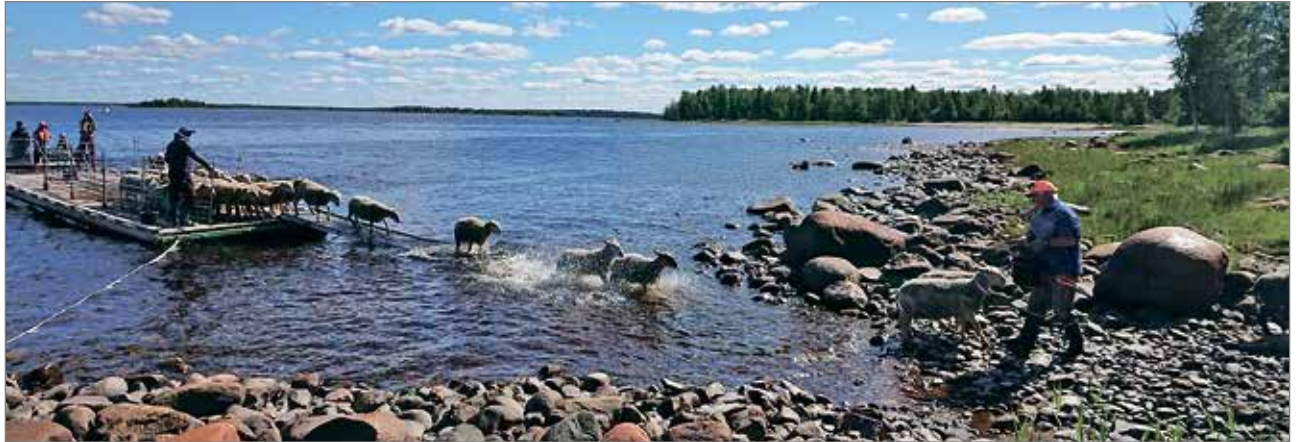
Vapaus koittaa ja kesän ajan lampaat laiduntavat maisemanhoidossa Satakarissa.