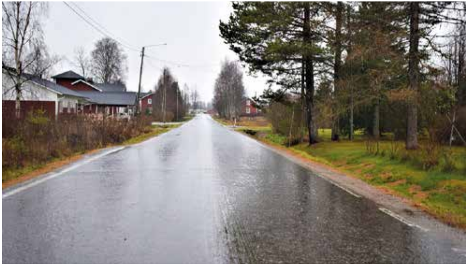
Konintielle on pitkään toivottu pyörätietä.

Ii valmistelee uutta kevyen liikenteen väylien suunnitelmaa ensi vuodeksi. Silloin kevyen liikenteen rakentamiseen ja parantamiseen ollaan varaamassa 120 000 euroa. Määrärahat ovat parhaillaan lautakuntakäsittelyssä. Kuntalaiset ovat pitkään toivoneet kevyenliikenteen väyliä esimerkiksi Virkkulantielle, Maalismaantielle ja Konintielle.