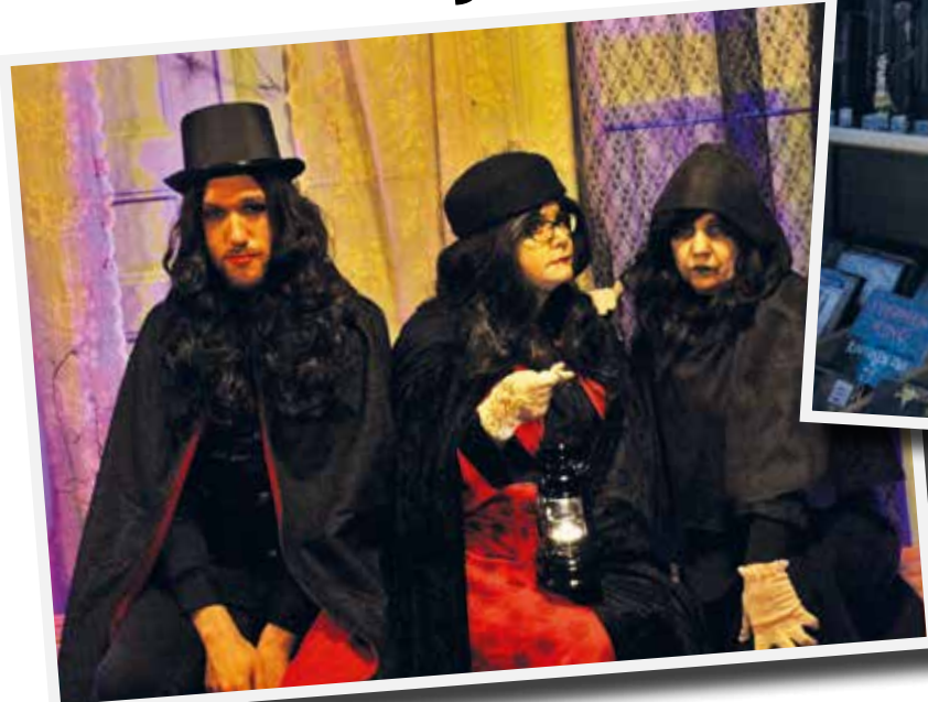
Sarvipöllö vartioi kirjaston kauhukokoomaa”