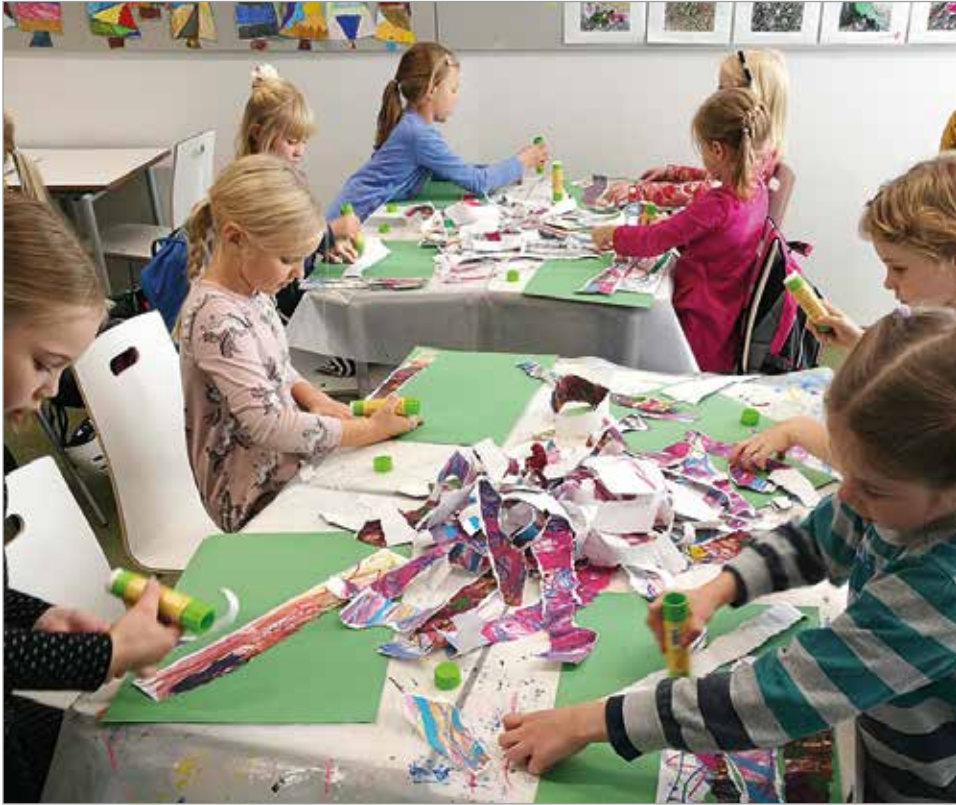
Piirtämistä ja maalaamista musiikin tahtiin sekä repimistä, liimaamista ja leikkaamista linnun muotoon Iin taidekoulun 7-8-vuotiaiden ryhmissä.