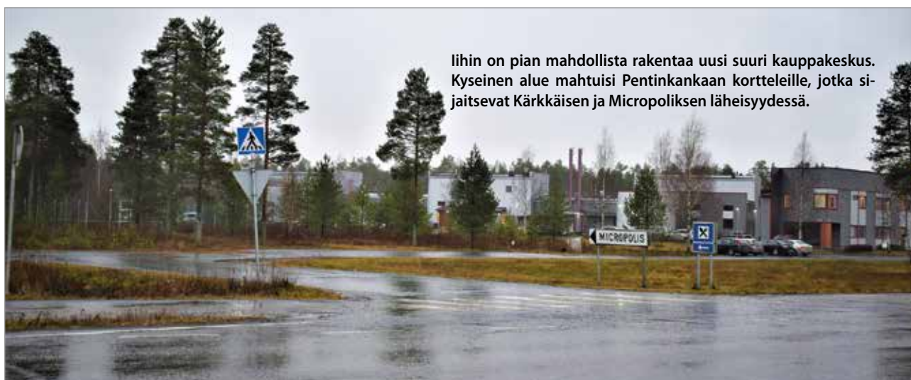
Iihin on pian mahdollista rakentaa uusi suuri kauppakeskus. Kyseinen alue mahtuisi Pentinkankaan kortteleille, jotka sijaitsevat Kärkkäisen ja Micropoliksen läheisyydessä.

Nelostien uuden linjauksen ajankohta on kuitenkin kaukana tulevaisuudessa. Kunnanjohtaja muistutti, että kyseessä on arvioista riippuen 110 - 130 miljoonan euron investointi. J-JR