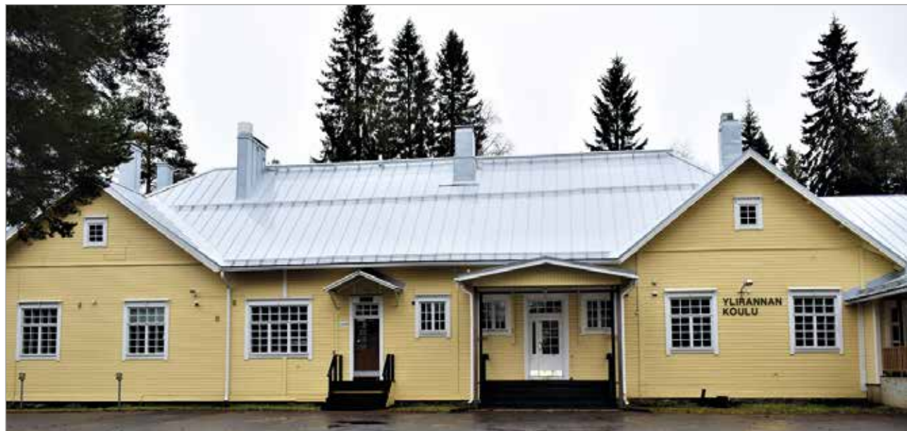
Ylirannan koulu lakkautetaan, jos valtuuston linjaus pysyy voimassa.

Lopuksi kokouksessa kuultiin vielä valtuutettu Eero Alaraasakan ponsilauseke. Sen mukaan esitettäisiin, että Iin kunta neuvottelee VR:n kanssa mahdollisuudesta parantaa rautatiesillan itäpuolen kevyenliikenteen väylää koululaisille leveämmäksi ja turvallisemmaksi. Valtuusto oli yksimielisesti ponnentavana. J-JR