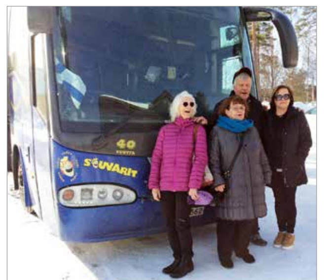
Runnin kylpylään retki. Helmikuun lopulla talven taitteeksi vietimme viikonloppua Runnin kylpylässä Kiuruvedellä. Vaikka oli kylmää, tarkeni kuitenkin ulkoilla Runnin poluilla. Kylpylässä oli vesiliikuntaa, nautimme maukaista ruokaa, lauloimme karaokea ja lauantai-iltana pyörähdimme Souvareiden tahdissa. Mutta mikä parasta, meidän iloinen Skibbo porukka nauratti kaikkia hotellissa olijoita. Jopa henkilökunta kiinnostui pelaajista siten, että kävivät kysymässä naurun ja ilon aihetta, kun heitäkin alkoi naurattaa ja tulivat iloisiksi. Toki henkilökunta oli muutoinkin ystävällistä ja palveluallista. Niinpä taas nivelet sai liikettä ja nauru pidentää ikää.