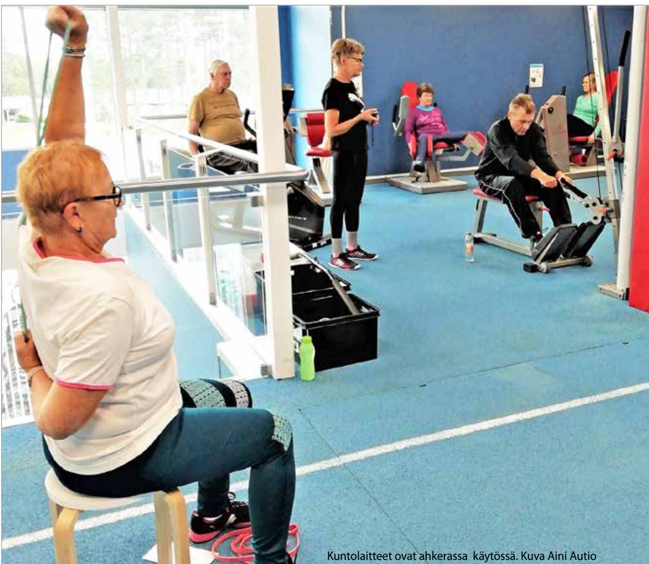
Kuntolaitteet ovat ahkerassa käytössä.