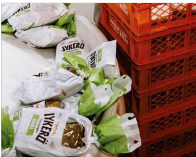
Putaan Pullan Jykerö on pala aamua ja iltaa, lounasrauhaa ja kahvihetkeä. Se on jälkiuunileipä, jossa on luonnetta pohjoisesta ja voimaa kotimaisesta viljasta.