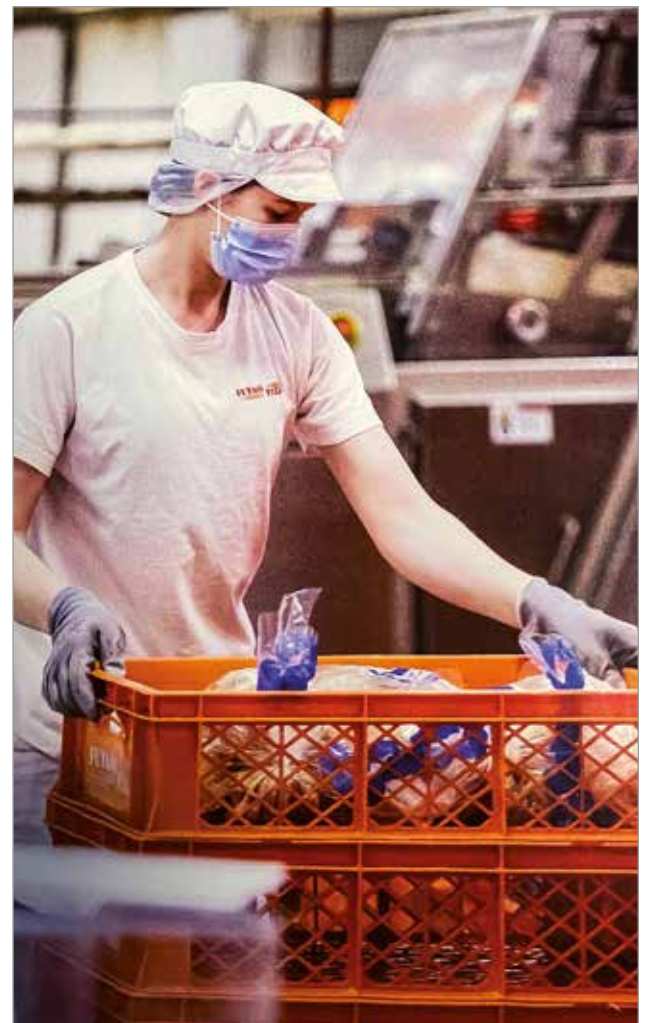
Putaan pullan tuotteita saa kaikista Iin alueen kaupoista.