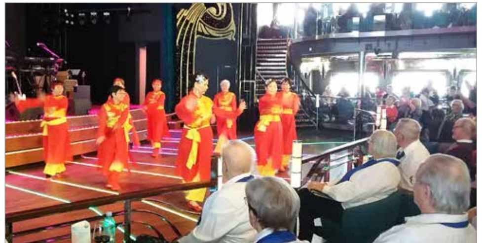
Kiinalaisen tanssiryhmän esitys Eläkeläiset ry:n risteilyllä.