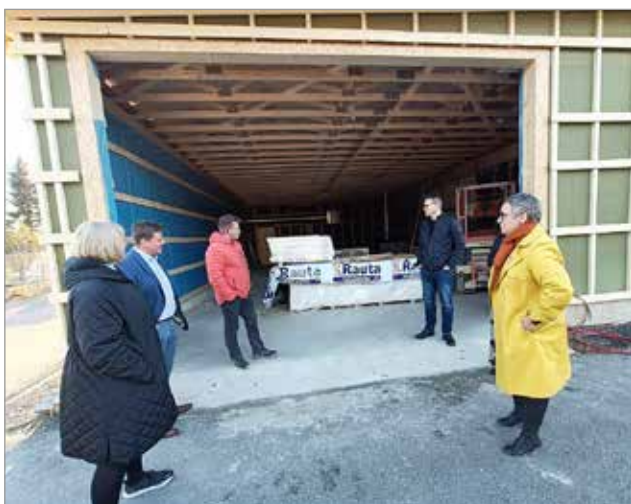
Iin Automaalaamon uusin osa eli pesulaosasto asuntoautoille ja -vaunuille otetaan käyttöön marraskuun lopulla.

Maanantaina 17.10. Iin kunnan, Micropoliksen, Iin yrittäjien sekä Pohjois-Pohjanmaan yrittäjien yhteistyödelegaatio jalkautui Iissä yrityksiin kuulemaan ajankohtaisia kuulumisia. Vierailulla käytiin V.A.V. Group Oy:n hallilla Paneelitiellä sekä Iin Automaalaamolla.