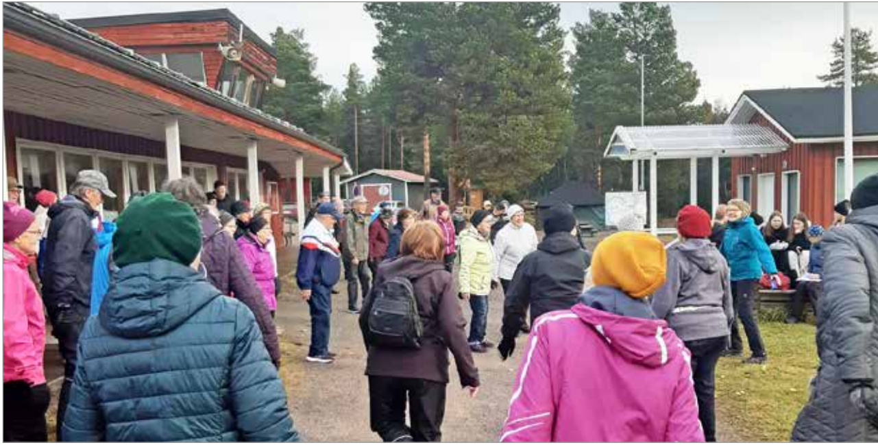
Kolmen eläkeläiset yhdistyksen yhteinen liikuntapäivä Ilin hiihtomajalla. Eläkeliitto, Eläkkeen saajat ja Iin Eläkeläiset kahvin, laulun, jumpan sekä makkaran paiston kera oli saapunut paikalle. Yhteensä noin 100 innokasta eläkeläistä.