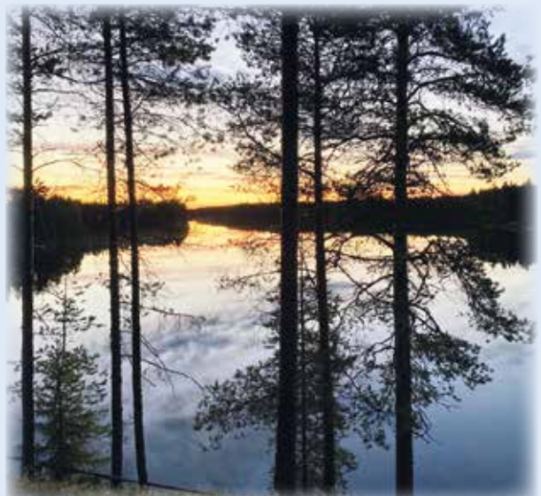
PIAN TÄMÄ ON MUISTO VAIN!

lukijoiden palaute ja jutut: vkkmedia@vkkmedia.fi