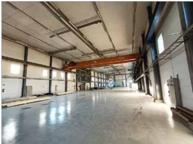
V.A.V. Groupin uuteen hallitilaan on tilattu vuosi sitten uusia linjastoja. Ensimmäinen uusi linjasto asennus aloitetaan pian, testaamaan päästään marraskuun puolivälin jälkeen. Toisen uuden linjaston toimitusta odotellaan ensi vuoden puolelle.