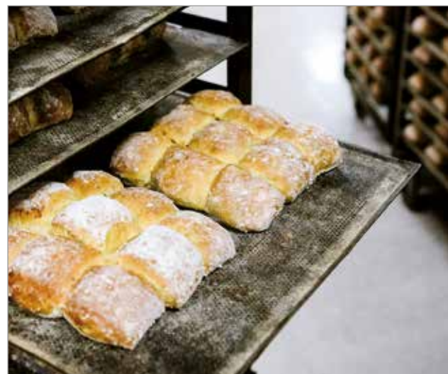
Putaan Pullan Nyhtöpalat ovat monikäyttöisyytensä vuoksi monen keustosuosikki.