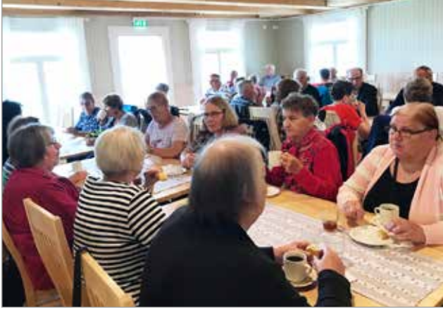
Saijan lomakartanon ravintolassa nautittiin lounas ja kuultiin Saijan historiaa.

jakaantuvat noin puoliksi ulkomaalaisten ja suomalaisten kesken.