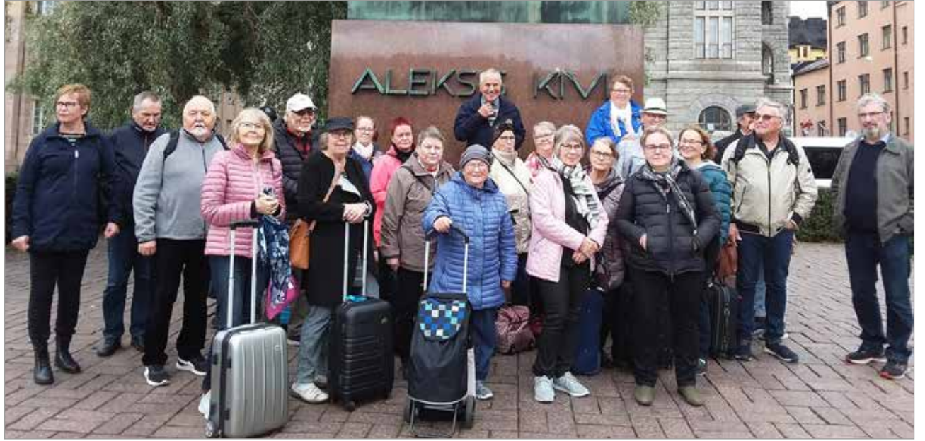
Innostunutta eläkeläisporukkaa Aleksis Kiven patsaalla odottamassa risteilylle lähtöä.