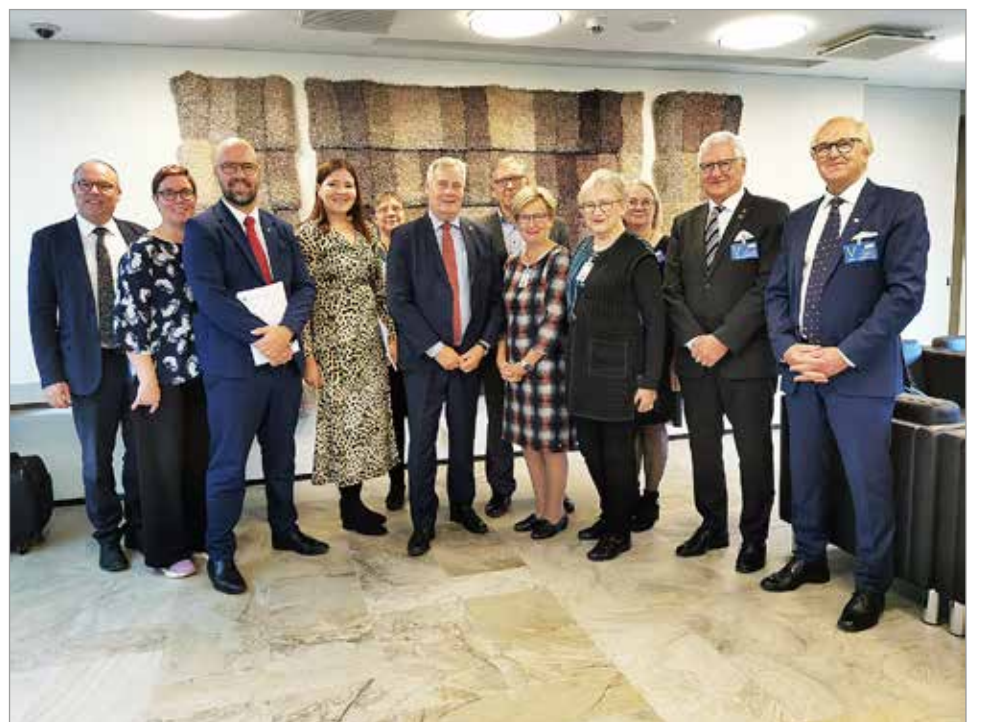
Kuuden valtakunnallisen eläkeläisjärjestön edustajat tapasivat kansaedustajia budjettiasioiden merkeissä lokakuun alussa.