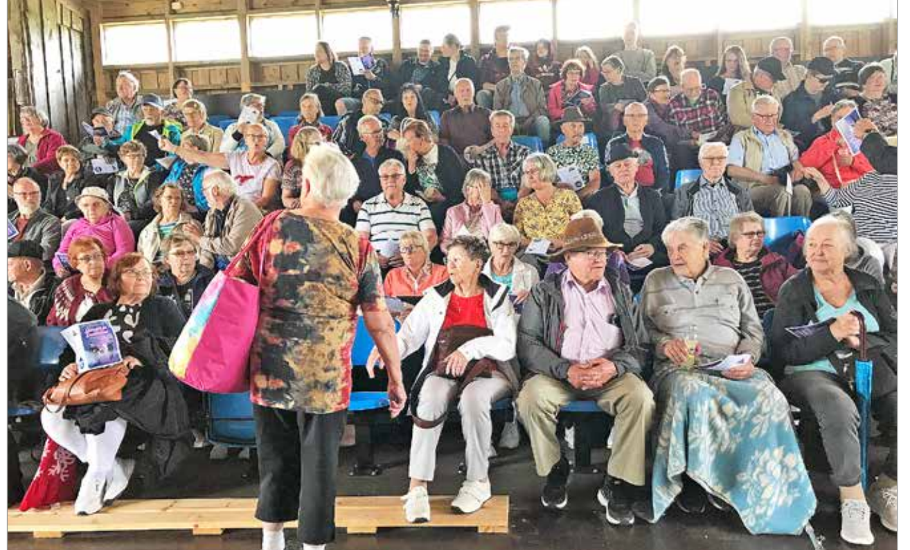
Kesäpäiväretkelle Pölkkyteatteriin osallistui 57 reissaajaa.