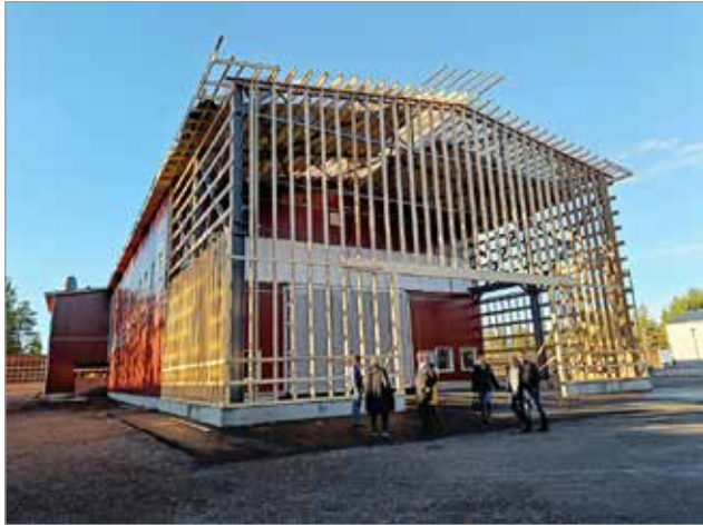
V.A.V. Groupin tehdas laajentuu ja saa 1800 neliötä uutta hallitilaa, jonka päätyyn rakennetaan vielä uutta kylmää varastotilaa. Vanha tehdashalli yhdistetään käytävällä uuteen ja vanha puoli toimii jatkossa mm. varastona.