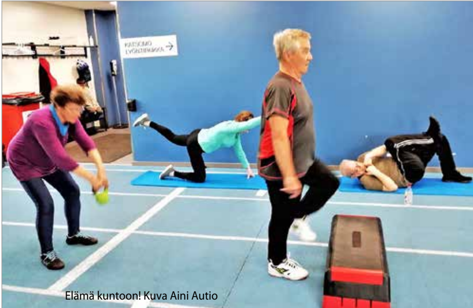
Elämä kuntoon!

Iin kunnan liikuntakeskus Iisi-areena tarjoaa kuntosalimahdollisuuden myös eläkeläisille. Iin Eläkeläiset ry on varannut tiistaisin kahdelle ryhmälle ajan seniorien kuntosalilta. Ohjaaja Kylli Kaikkonen kertoo, että kummassakin ryhmässä on 12 innokasta kuntoilijaa ja ryhmät ovat täynnä.