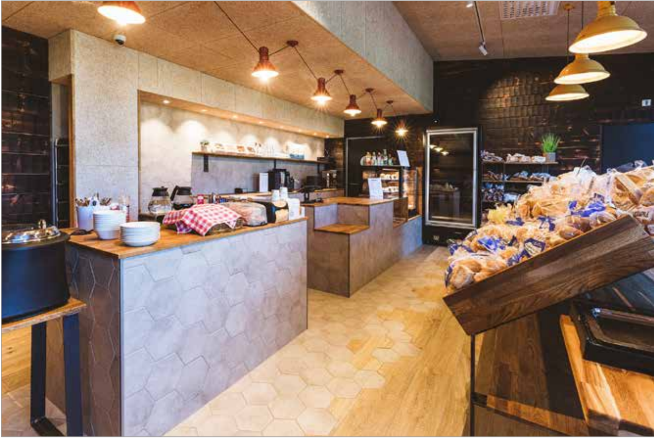
Putaan Pullan uusittu viihtyisä myymälä avattiin kesällä leipomon yhteyteen Martinniemessä.