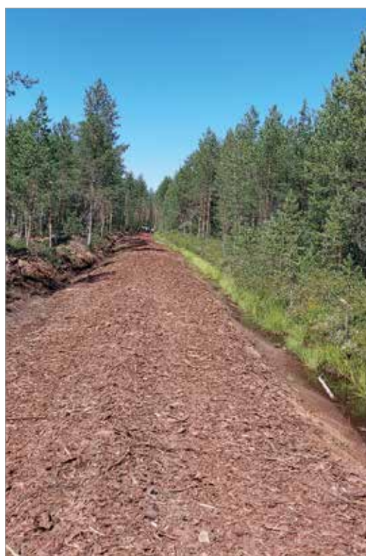
Kuorikatteen päälle ei tarvita paljon lunta ennen kuin Jakkukylässä taas hiihdetään. Siihen saakka poluilla pärjää lenkkareilla.