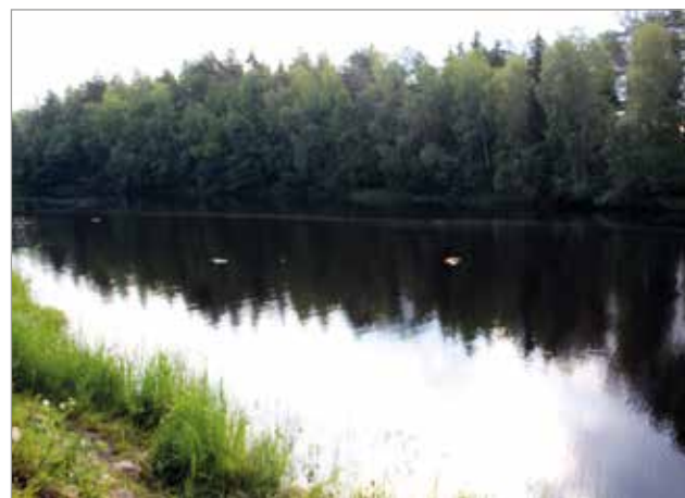
Jätesäkkejä kellui laajalla alueella Iinperukassa.