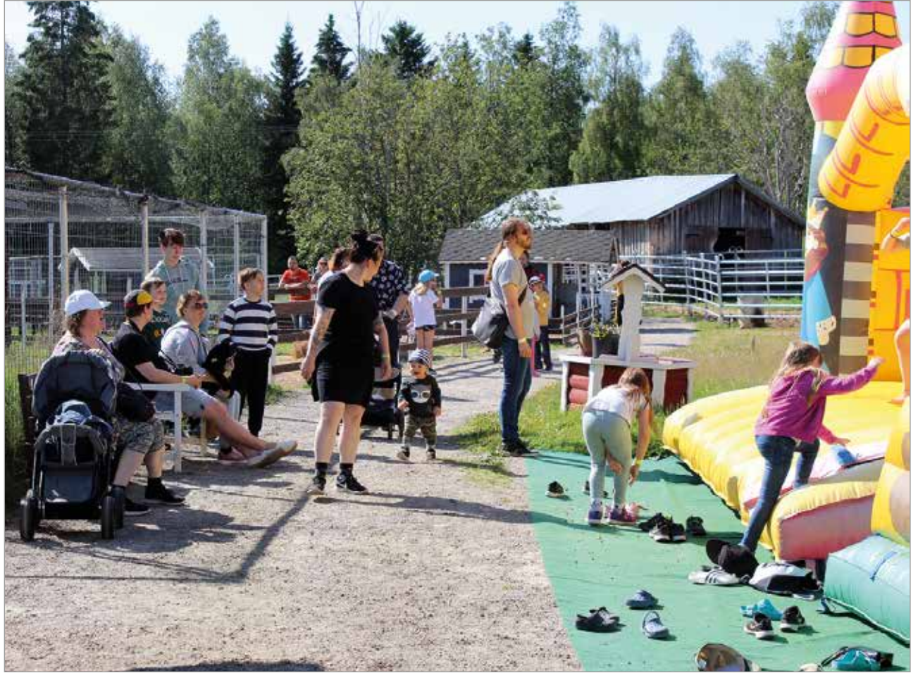
Kotieläinpuisto Arkadia on oiva vierailukohde etenkin lapsiperheille.

Simon Maksniemessä sijaitseva kotieläinpuisto Arkadia on monipuolinen lähimatkailukohde, jossa löytyy tekemistä ja näkemistä koko perheelle. Arkadia avautui yleisölle kesäksi 2016 ja on laajentunut ja monipuolistunut vuosien kuluessa. Kotieläinpuistosta löytyy 70 eri eläinlajia, jouskossa eksoottisempiakin eläimiä kuten papukaijat, laamat, emut ja aasit sekä kameli.