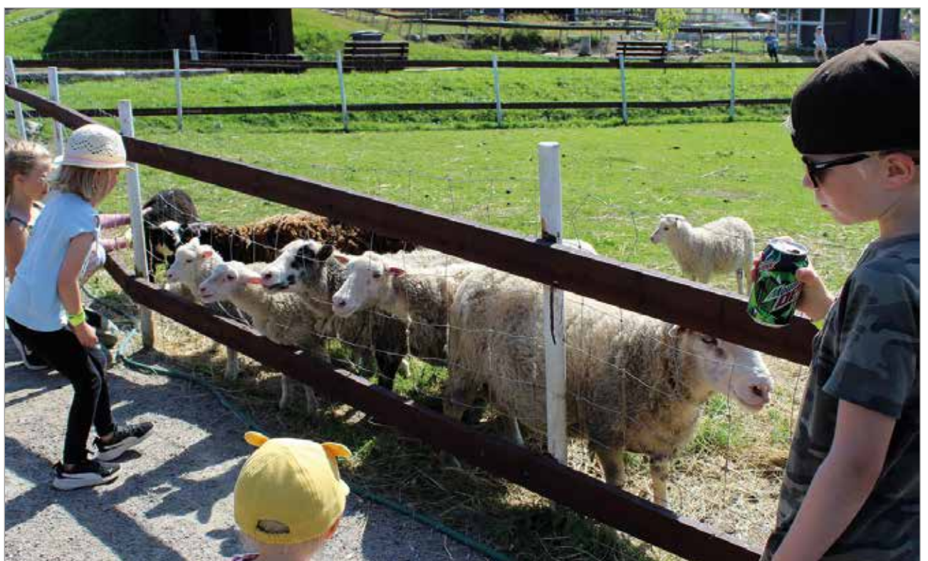
Lampaita vierailijoiden on mahdollista myös ruokkia.

Heinäkuisena perjantaina puistossa oli runsaasti etenkin lapsiperheitä vierailulla. Uudistetut tilat osoittivat toimivuutensa ja hampurilainen, jos toinenkin löysi nopsasti tiensä nälkäisten vatsojen täytteeksi. MTR