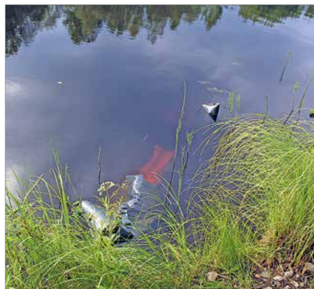
Rantaveteen ajautuneista jätesäkeistä pystyi näkemään kyseessä olevan suuren eläimen teurastusjätteistä.

Vihkosaaren uimarannan läheisyydessä havaittiin ympäristörikos illalla 6.7. Kalastajat löysivät vedestä lukuisia jätettä täynnä teurastusjätteitä. Säkit oli heitetty Iijokeen maanantaina tai tiistaina, sillä sunnuntaina alueella järjestettyjen onkikilpailujen aikaan niitä ei vedessä ollut. Löydöstä tehtiin ilmoitus poliisille, joka tutkii asiaa ympäristörikoksena. Vihkosaaren uimaranta suljettiin teurastusjätteen vedestä puhdistaminen ajaksi ja varotoimena, kunnes vesinäytteistä saatiin tulokset 11.7. Ne osoittivat veden olevan uimakelpoista.