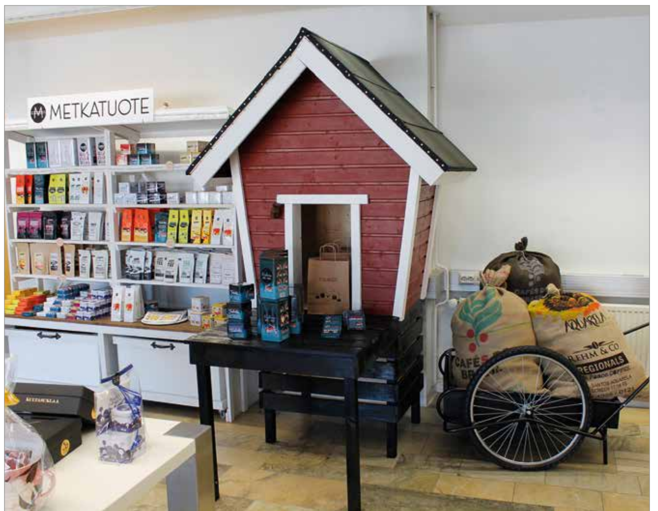
Moni sisustuselementti on yrittäjän aviomiehen nikkaroima. Kahvisäkkejä maitokärryssä ja monenlaisia herkkuja maitolaiturilla.

- Edellisessä työpaikassani töiden vähentyessä korona-aikana heräsi kiinnostus taas palata yrittäjäksi. Korona-aika on tuonut omat haasteensa, mutta en ole niistä lannistunut, vaan kehittänyt ja laajentanut liiketoimintaa, Korkala kertoo. JK