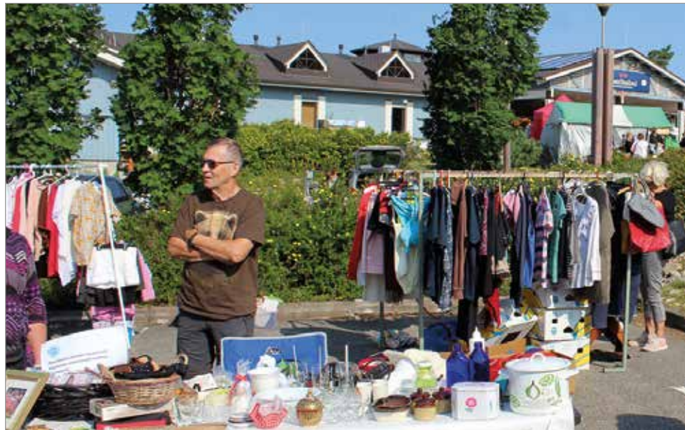
Kirpputorilla oli monenlaista tarjontaa.