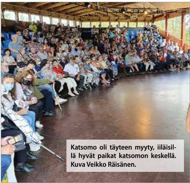
Katsomo oli täyteen myyty, iiläisillä hyvät paikat katsomon keskellä.

Keväällä päätetty ja koronan vuoksi peruutusuhana alla ollut innolla odotettu kesäteatterimatka Kalle Pääntalon lapsuusmaisemiin Pölkkyteatteri Taivalkosken Jokijärvelle toteutui sunnuntaina 11.7. Hekkasan onnikalla matkaan lähti 46 henkilöä. Matka suuntautui Kiimingin kautta Pudasjärvelle, jonka keskusta oli kokenut huomattavan rakennemuutoksen sitten edellisen ohi suuntautuneen matkan, lounaalle pysähdyimme kuitenkin aiemminkin reissuilla tuttuun paikkaan Pudasjärven Nesteelle.