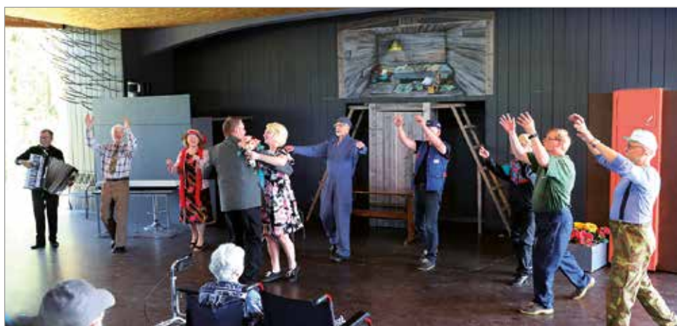
Ja he saivat toisensa, josta seurasi häävällsin tanssiminen muiden näyttelijöiden ympäröimänä. Esitykset jatkuvat vielä su 25.7, ke 28.7, la 31.7 ja su 1.8.