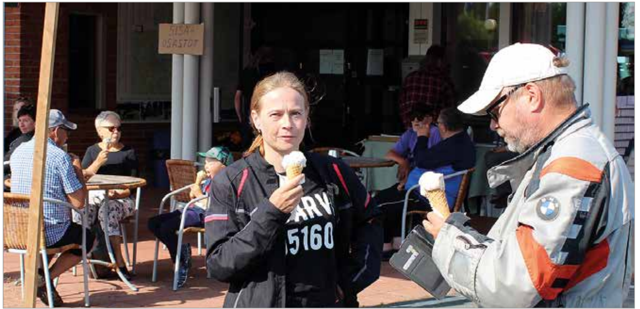
Jäätelö maistui lämpimänä kesäpäivänä.