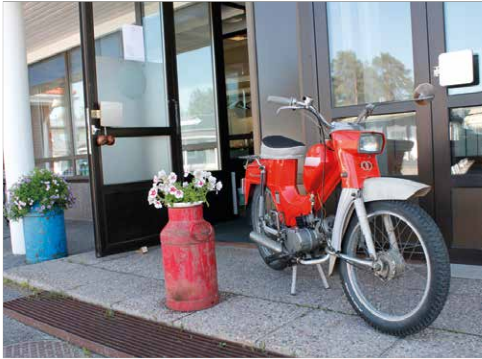
Tehtaanmyymälän ja kahvilan tunnistaa ovensuuhun parkkeeratus Pappa-tunturista ja maitotoni-kista.