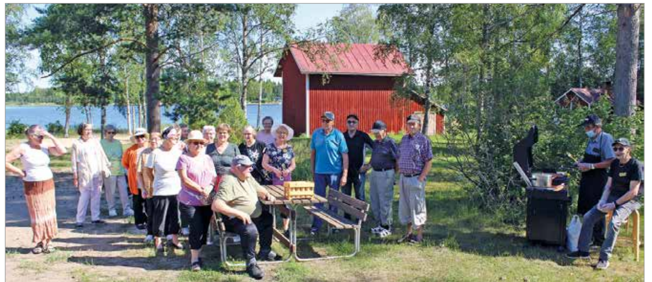
Hermannin päivän tapahtumaa vietettiin perinteiseen tapaan Karhun leirikeskuksessa.