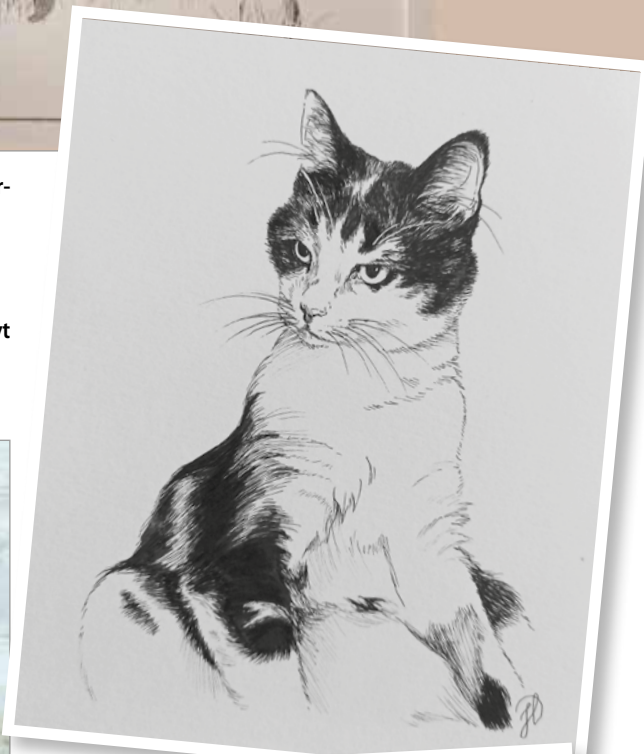
Kissakuvan Julie on piirtänyt tussilla.