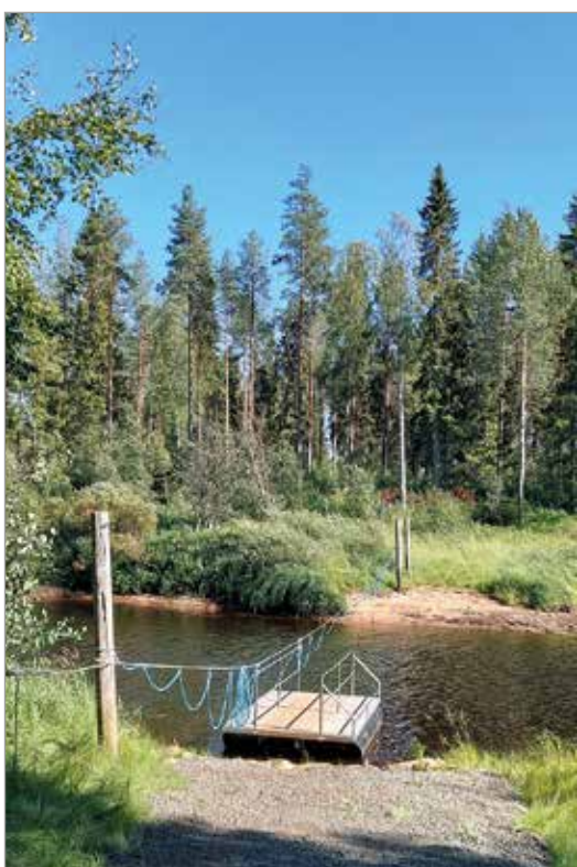
Purusaareen pääsee lossin ansiosta myös kesällä.

Purusaari on Pohjolan Voiman omistama saari Iijosta, jonka käytöstä Jakkukylän kyläyhdistys on tehnyt vuokrasopimuksen. Pian valmistuvan kunnostusprojektin aikana saareen on saatu kulkuyhteys lossilla, rakennettu laavu ja puuliiteri sekä kunnostettu kulkureittejä. Leader-rahoitteisen projektin kustannukset ovat suuruusluokkaa 25 000 euroa, josta on saatu avustusta 50 prosenttia. Loppuosasta kyläyhdistys on maksanut 10 prosenttia ja loput on katettu talkootyöllä. MTR