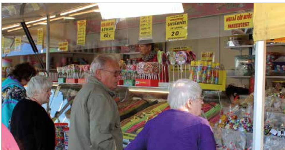
Lakut kuuluvat markkinoille ja kauppa kävi vilkkaana.