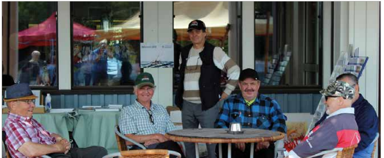
Markkinoiden paluu Kuivaniemelle toi iloisia ihmisiä Merihelmeen.