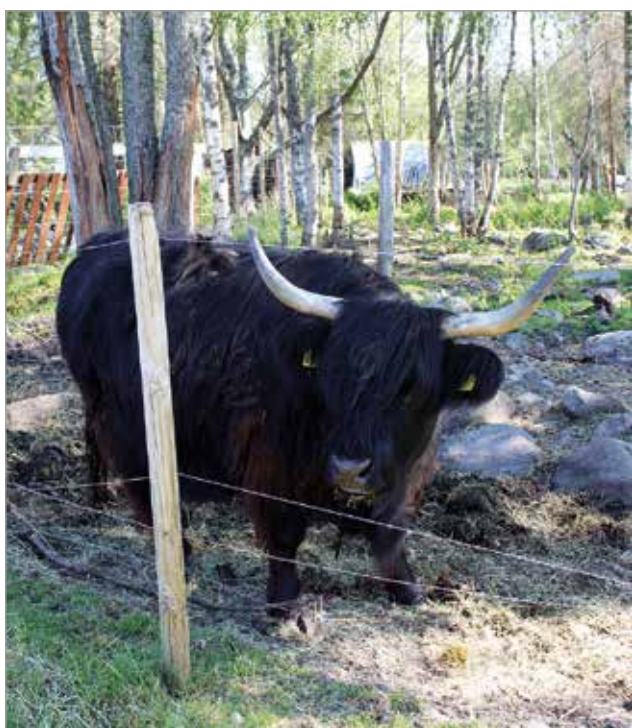
Ylämaan karja on kookasta ja tottunut selviämään ulkona ympäri vuoden.