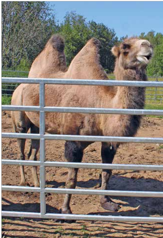
Puiston eksoottisimpiin eläimiin kuuluu kameli.