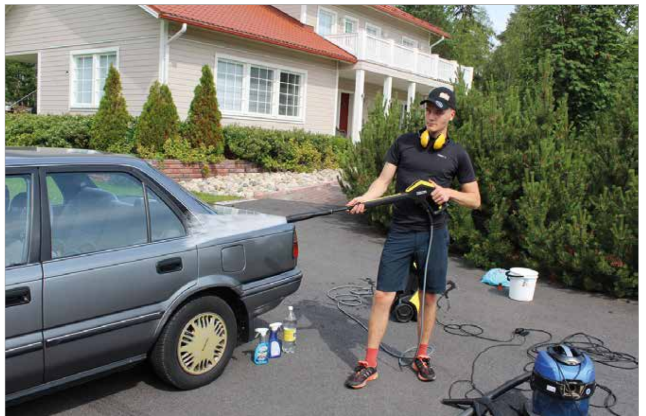
Painepesuri ja muut tarvittavat välineet kulkevat liikkuvan autonpesijän mukana. Asiakkaalta tarvitaan vain sähkö ja vesi.