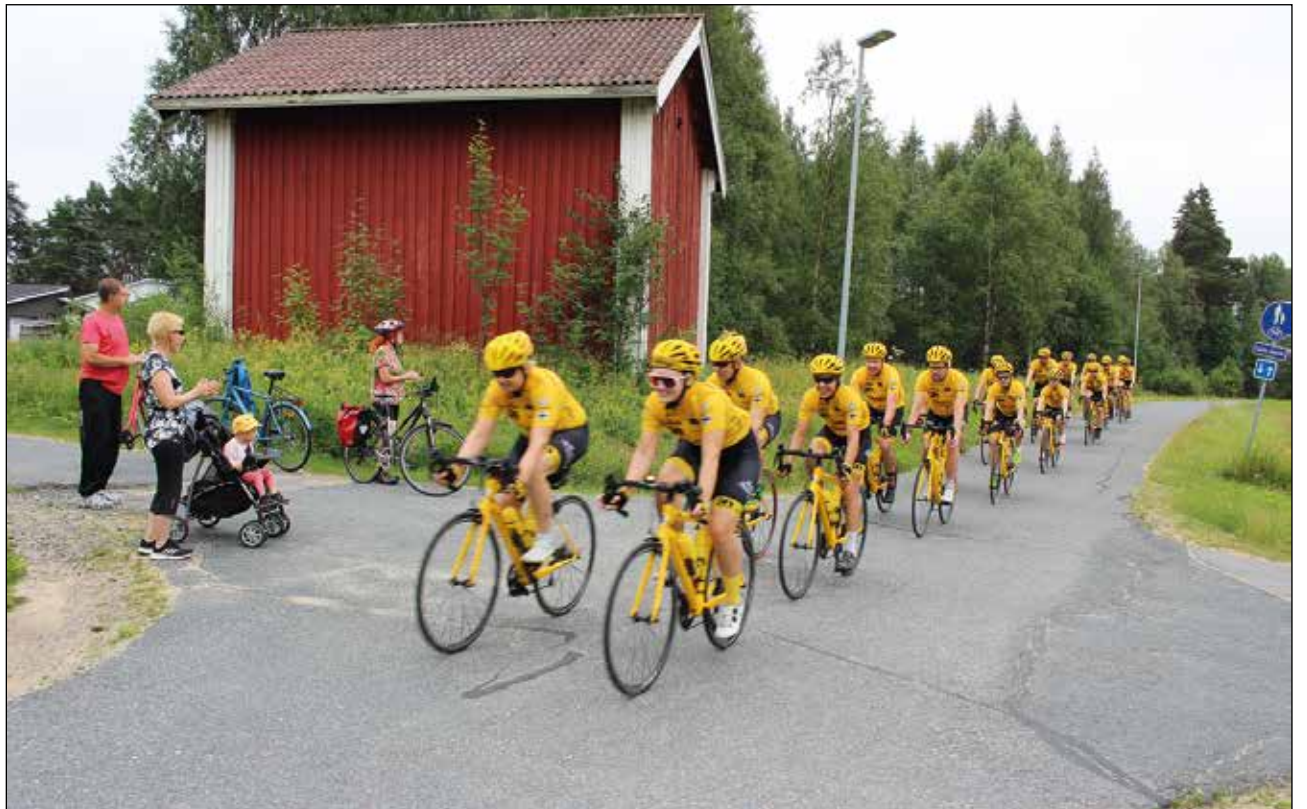
Team Rynkeby – God Morgon Vantaan joukkueen saapumista lihin kannustettiin reitin varrella.