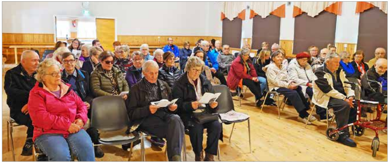
Keskiviikkona 5.10. Kuivaniemen nuorisoseuralla nähtiin Roolinvaihtajien näytelmä Unun kuumat puumat, jota katsomaan saapui mukavasti väkeä.