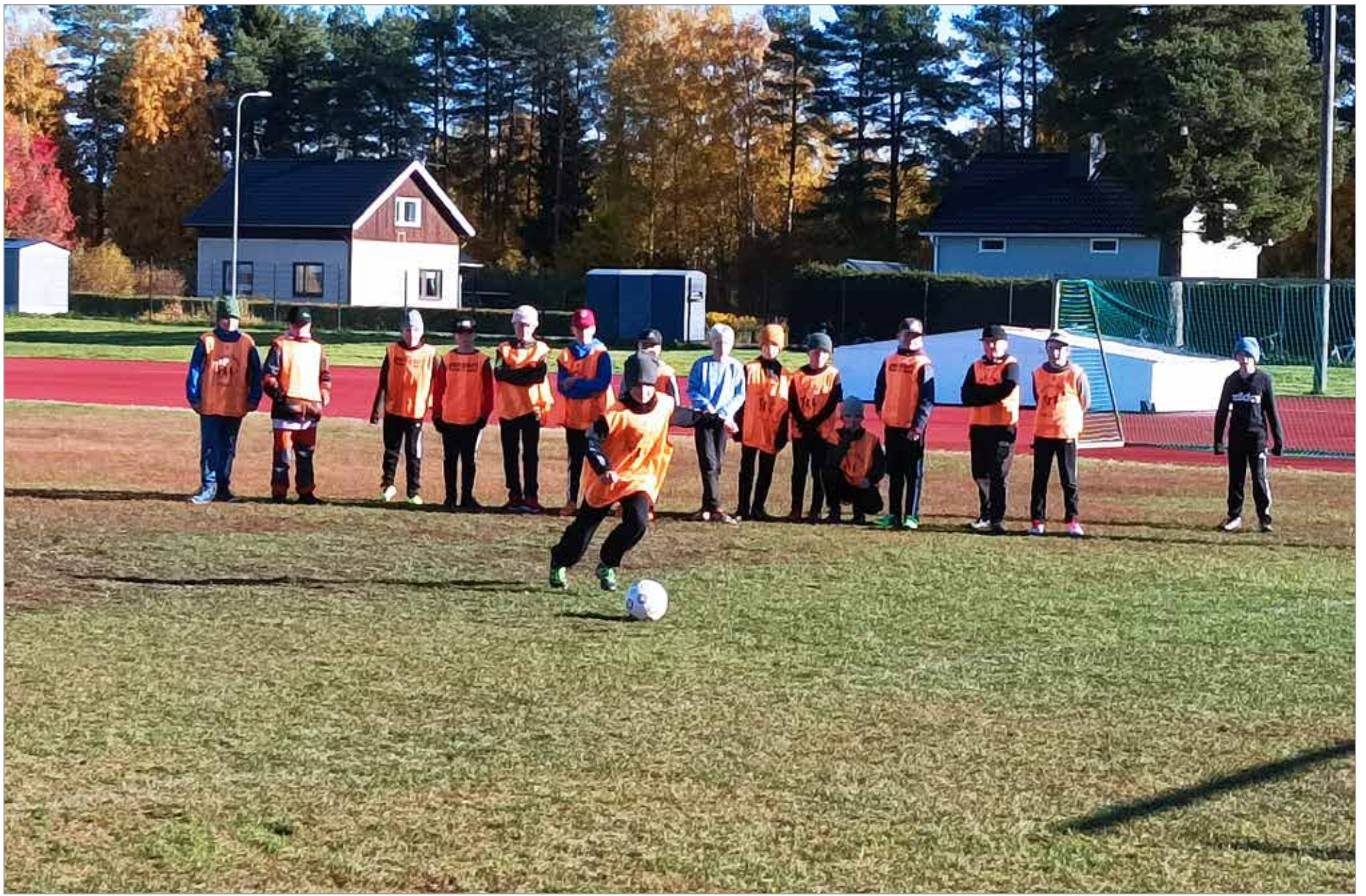
Poikien turnauspäivän pronssipeli ratkottiin rankkarikierroksella, jossa Hamina voitti Alarannan.