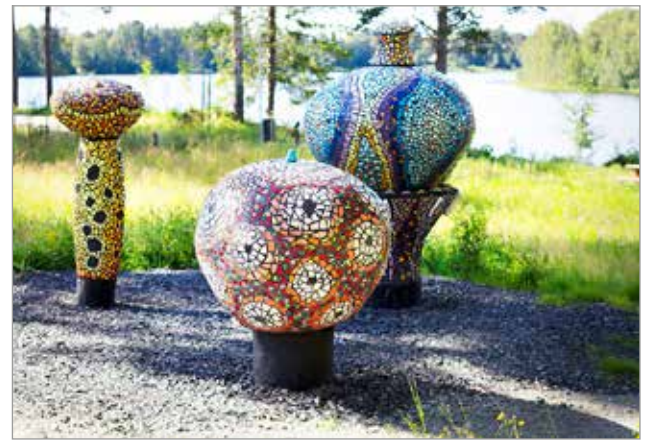
Paula Suomisen teos Kummalliset kukat. Lähdepuistossa sijaitseva kolmen mosaiikkiveistoksen kokonaisuus, ilmentää kasvien elinvoimaa, selviytymistä ja sopeutumista.