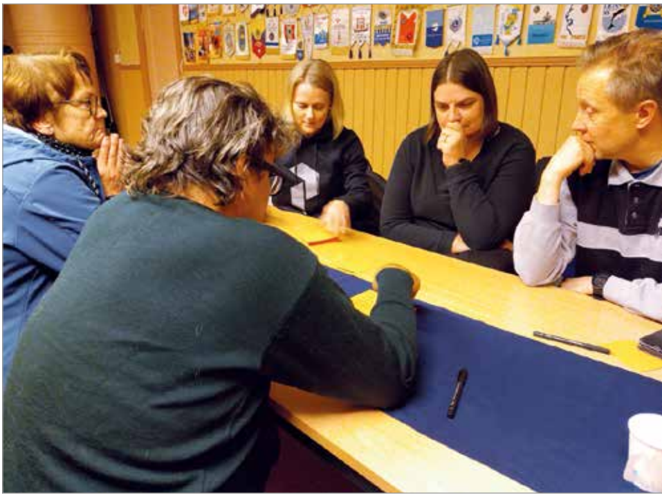
Iin kylillä meidän porukasa -hankkeen työpajassa Iin Urheilijoiden talolla 5.10. osallistujat pääsivät pohtimaan miten yhdistyksillä olisi paremmin mahdollisuuksia työllistää.