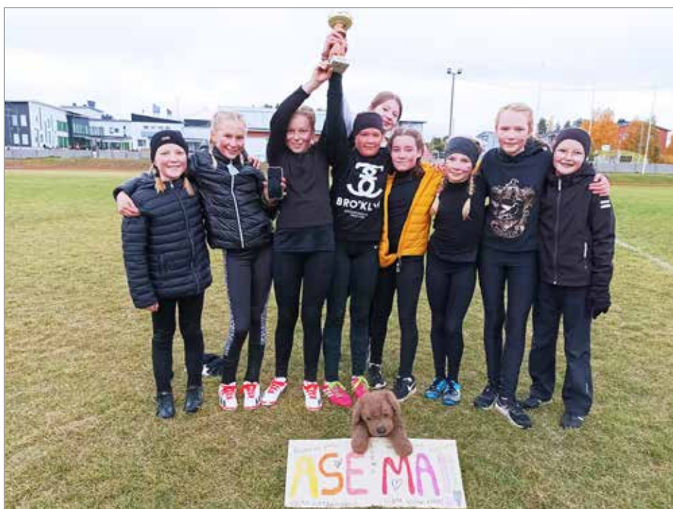
Tyttöjen turnauspäivän voitokain joukkue oli Aseman koulun joukkue!

Iissä järjestetään paljon urheilutapahtumia, ja koulujen välisiä kisoja jatketaan marraskuussa sählykisojen muodossa. Alkuvuodesta vuorossa ovat sitten kaukalo- ja koripalloturnaukset. JK