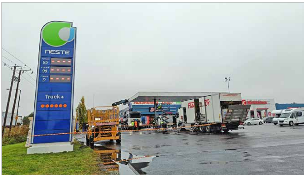
Maanantaina 3.10. Iin Autokeitaan tankkauspiste vaihdettiin Nesteen kuosiin. Uuden toimijan tankkauspiste otettiin käyttöön lokakuun ensimmäisellä viikolla.