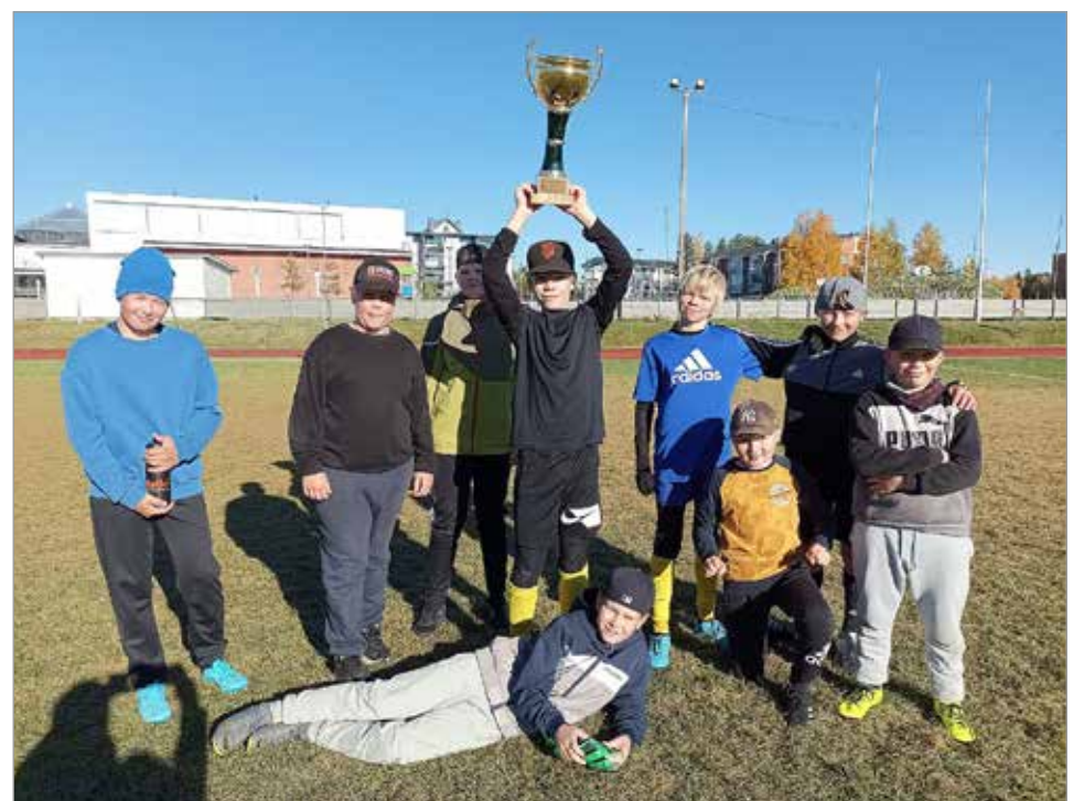
Poikien turnauspäivän kiivaan finaalin voitti Pohjois-Iin Pojat!