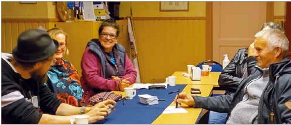
Iin kylillä meidän porukasa -hankkeen työpajoissa on näkynyt kyläläisten vahva yhteishenki ja rakkaus omaan kotialueeseen.