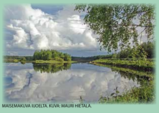
MAISEMAKUVU IJUOELTA.

lukijoiden palaute ja jutut: vkkmedia@vkkmedia.fi