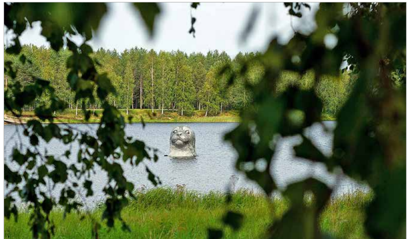
Sanna Koiviston teos Norppa. Vuoden 2019 IlmastoAreena -tapahtumaan kierrätysmateriaalista valmistettu Norppa kurkistaa lijoista ja ilahduttaa Nelostietä kulkevia kesäisin.