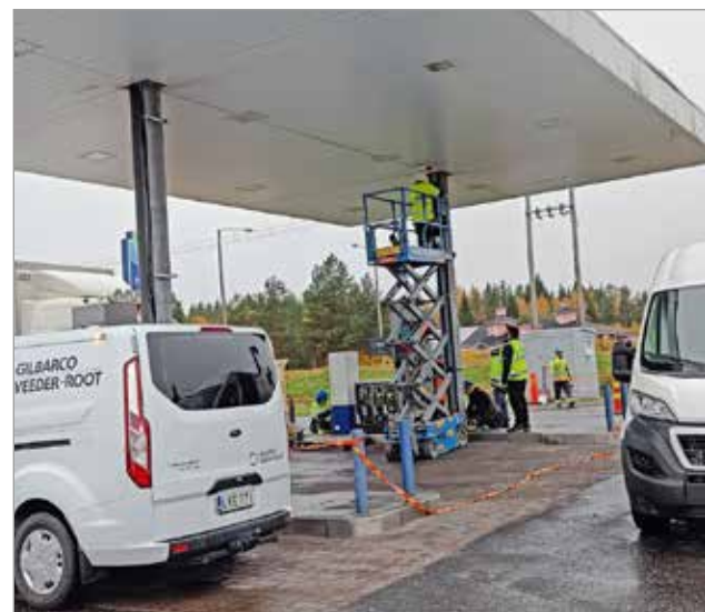
Iin Autokeitaan pihalla työskenneltiin uutterasti.