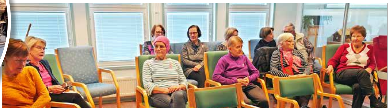
Osallistujia Kuivaniemen kirjastolla seniorikino-tapahtumassa, jossa katsottiin elokuva Isä.