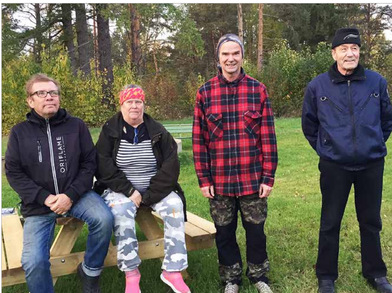
Tulkaa rohkeasti mukaan A-killaan, toivottavat Iin A-killan aktiivit Pappilan pihassa.

Kirsi Mäki järjestökoordinaattori- koulutus suunnittelija A-Kiltojen Liitto ry