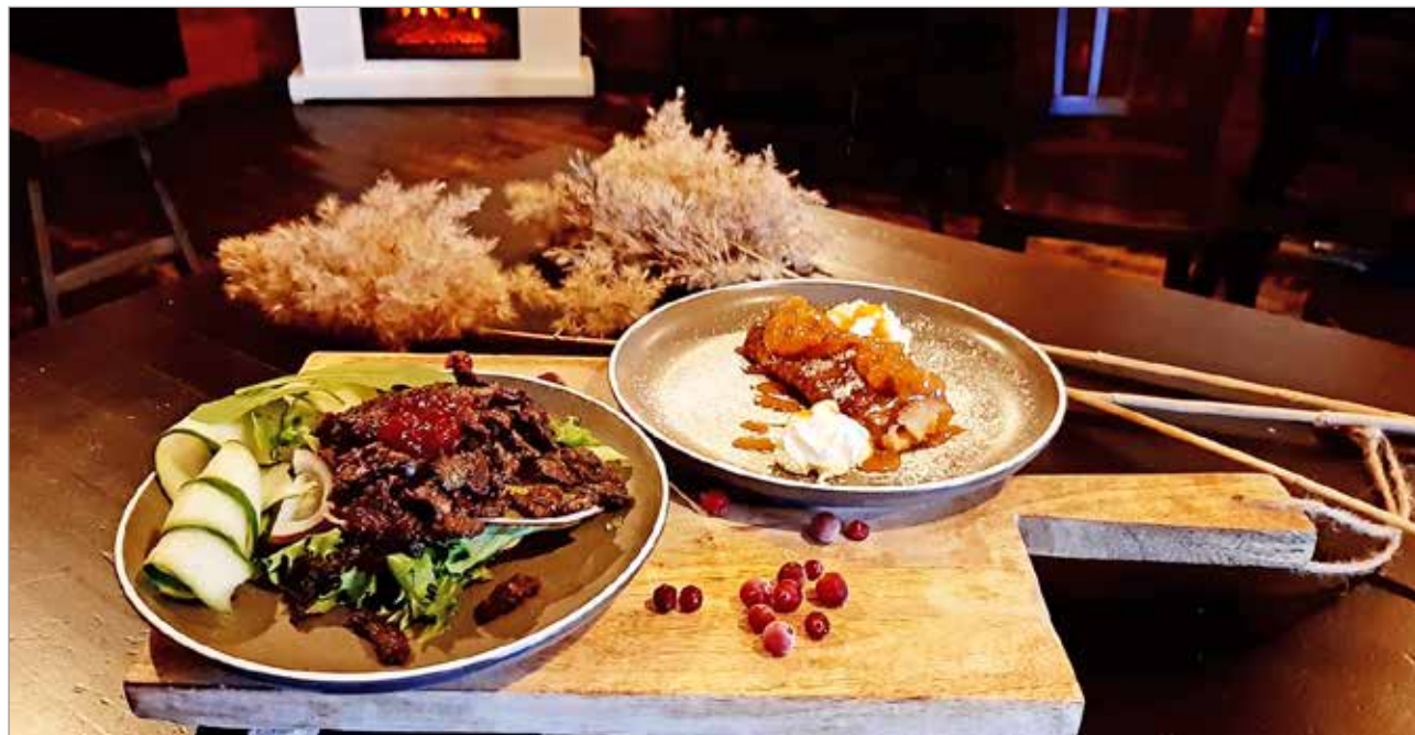
Cafe Aitta9 voitti ylivoimaisesti yleisökilpailun Arctic Food -festivaalin Makuseikkailussa kuvassa näkyvillä annoksilla.

Cafe Aitta9 sijaitsee Oulussa Kauppatorilla punaisessa aitassa.