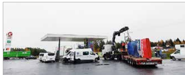
Viimeiset kymmenen vuotta Autokeitaalla oli Teboilin tankkausasema, jonka mainokset purettiin alueelta muutoksen yhteydessä.