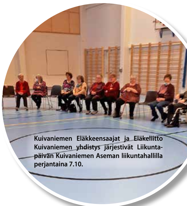
Kuivaniemen Eläkkeensaajat ja Eläkeliitto Kuivaniemen yhdistys järjestävät Liikuntapäivän Kuivaniemen Aseman liikuntahallilla perjantaina 7.10.