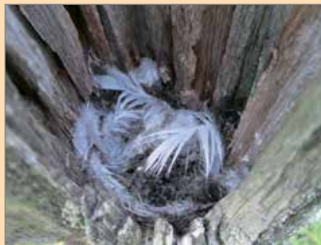
Tuula Hurskainen kuvasi linnunpesää.