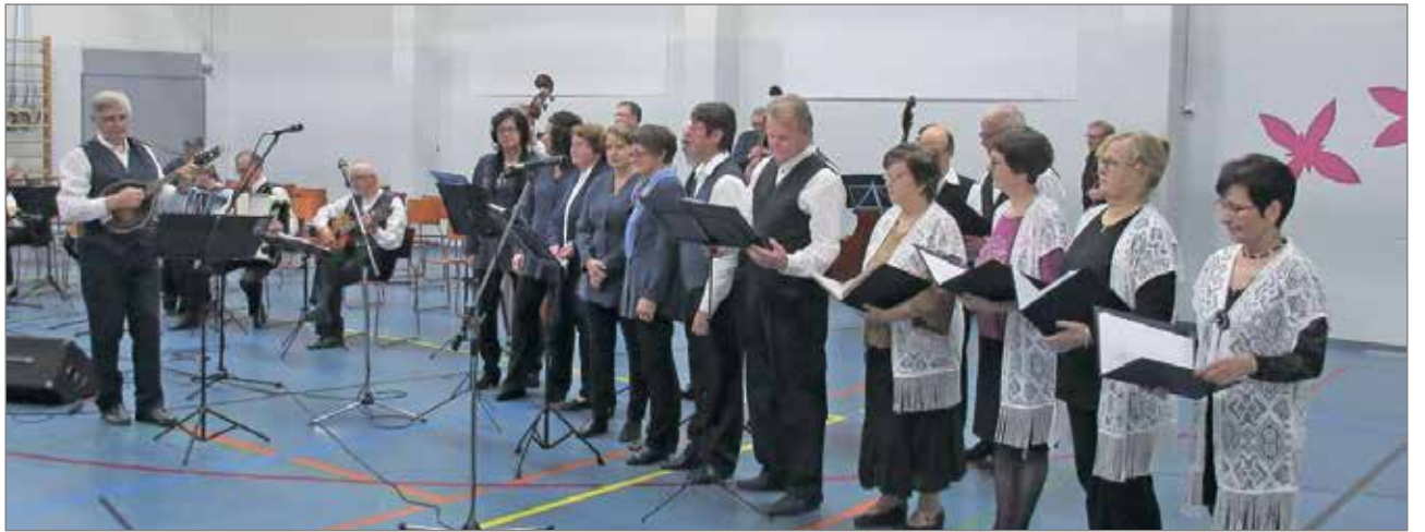
lin Syyssoitto-konsertti on sunnuntaina 22.10. Konsertin järjestää lin Laulupelimannit yhdessä Pohjois-Pohjanmaan kansanmusiikkiyhdistyksen kanssa.