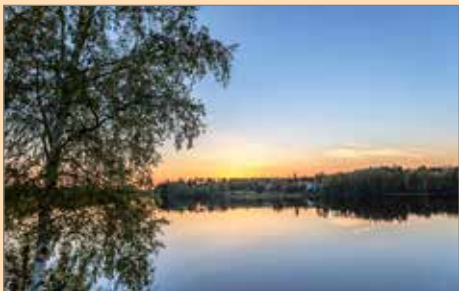
Jorma Kauppi nappasi kuvan luonnon väriloistosta.

Nämä kuvat osallistuivat Luontokokemuksia Iissä -kilpailuun ja ovat parhaillaan nähtävissä KulttuuriKauppilassa 17.10. saakka.