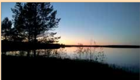
Teija Pakanen kuvasi maiseman Ylirannalta.