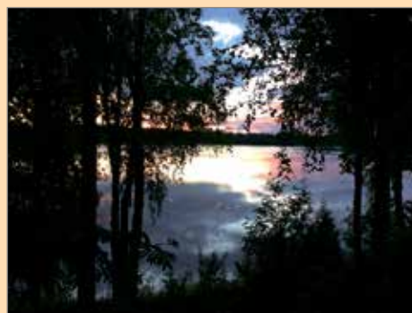
Aila Paason kuvassa esiintyy leppoisa kesäilta.