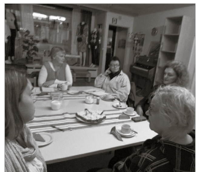
Ystävätoiminnassa mukana olevia koolla Iin SPR:n Pointin tiloissa.

Ystävänä voisi toimia vaikka 'kertaluontoisesti', vaikkapa jonkinlaisen vanhuksille järjestettävän ulkoiluttamistempauksen tms. myötä. Tai sitten voi todella löytää itselleen hyvän ystä-