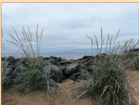
Merja Jeronen tallensi näkymän merenrannalta.