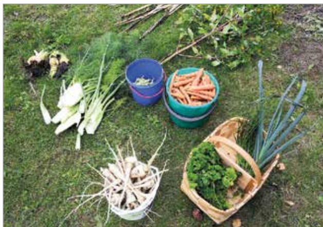
Syksyllä korjattiin runsas sato.