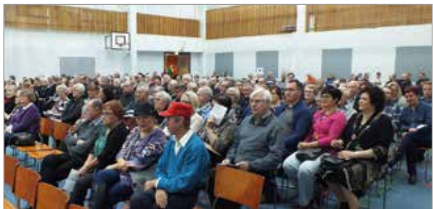
Viime vuoden Syysoitossa oli yleisöä salin täydeltä.

Iin Laulupelimannien järjestämä Iin Syysoitto -konsertti on sunnuntaina 13.10. kello 14 Valtarin koululla. Järjestyksessään 22. syyskonsertti, sisältää runsaasti monipuolista kansanmusiikkia ja kuorolaulua eri soitin- ja lauluryhmien esittämänä.