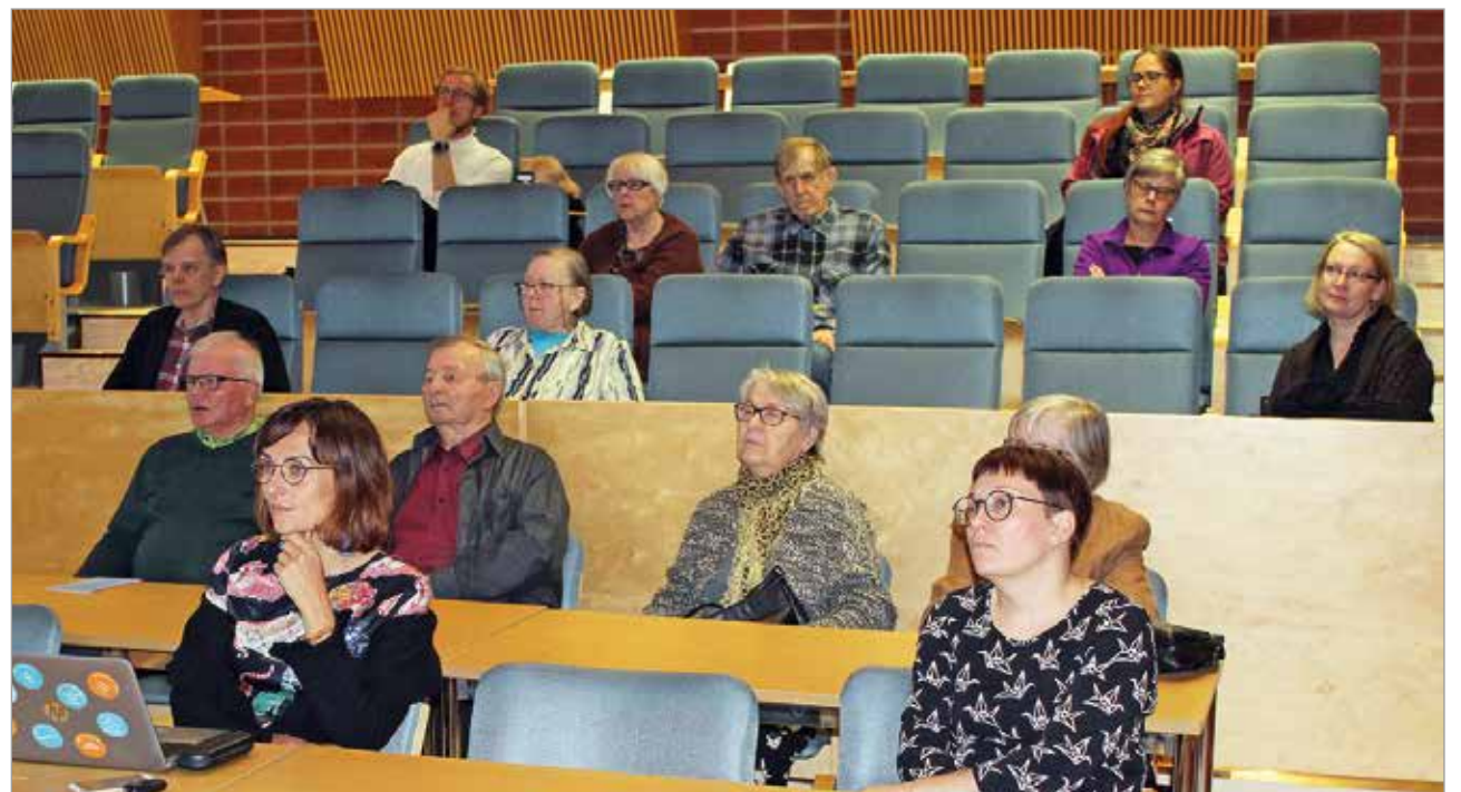
Evakkomuistoja Pohjois-Suomesta avasi ”Elämänmeno -kulttuuria, tietoa ja tarinoita” luentosarjan.

Keskusteluissa todettiin Iissä olleen evakoita muun muassa Petsamosta. Paasilinnan kirjailijaveljeksistä Erno ja Arto kuuluivat Lapista Iihin evakuoituihin. Molempien muisteltiin olla lähellä hukkumista Iijokeen evakkoajana, Ernon uittotöissä ja Arton tiputtua veneestä. MTR