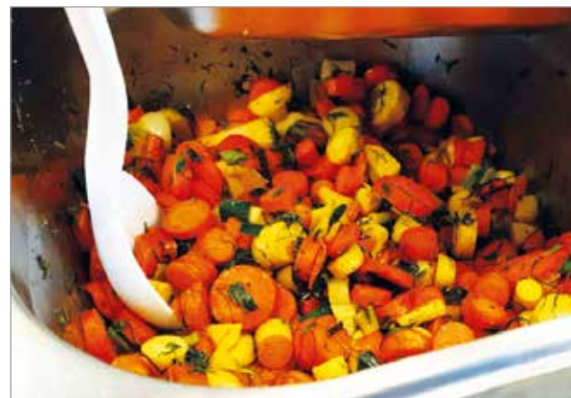
Oman maan tuotteista tehty juurespaistos maistui oppilaille.