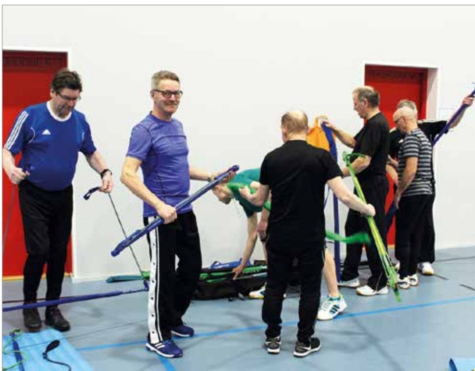
Miesten liikuntaryhmään osallistuu viikoittain reilut kymmenen miestä.

Pohjois-Iin kyläyhdistyksen viime kaudella lanseeraama "liiku maanantaisin Pohjois-Iissä" liikuntakampanja jatkuu. Tanjan salissa temmelletään, jumpataan ja pelataan kello kuudestatoista iltakymmeneen, useissa eri ryhmissä.