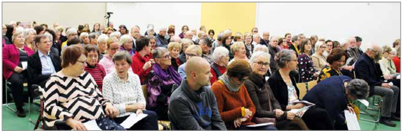
Iin Mieslaulajien 55-vuotisjuhlakonsertissa oli runsaasti yleisöä.