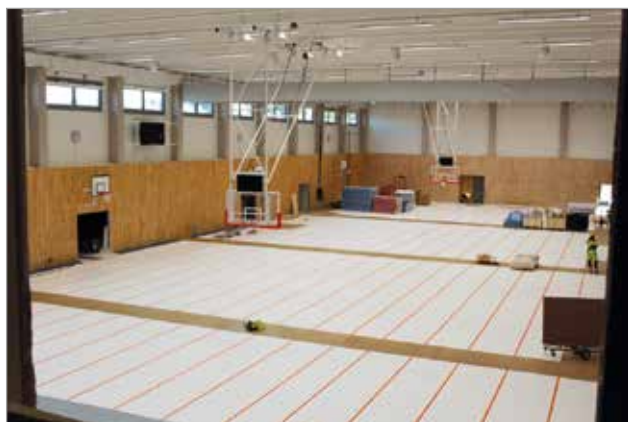
Harjoituskäytössä halli on jaettavissa neljään lohkokoon, joilla jokaisella on omat pukeutumis- ja peseytymistilat naisille ja miehille.