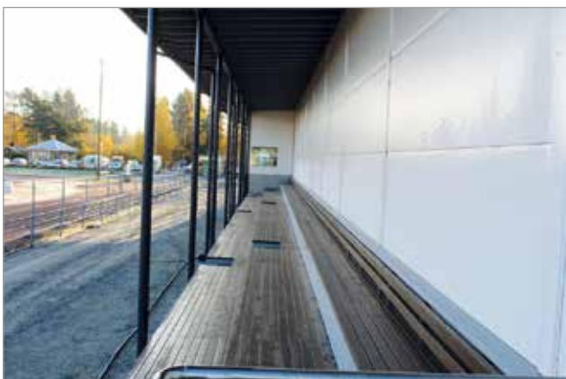
Urheilukentän puoleiselle hallin seinustalle on rakennettu katettu katsomo yleisurheilukilpailujen yleisölle.

-Liikuntahalli valmistuu kuluvaan kuun lopussa. Sen jälkeen vuorossa ovat laitteistojen testaukset ja koekäytöt. Yleisölle halli avautuu tulevan vuoden alkupuolella, vapaa-aikapäällikkö kertoo. MTR