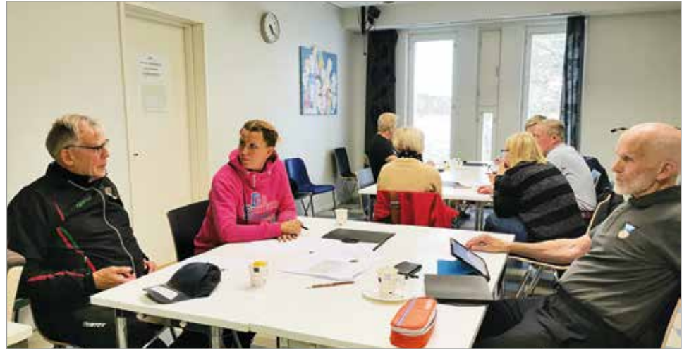
Iiläiset urheiluseura-aktiivit Hyvinvointityöpajassa.