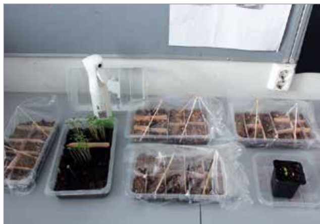
Keväällä istutettiin siemenet, joista hyötykasvihuutarhan kasvien taival ruokapöytään alkoi.

Biokompostorin ansiosta koululla saadaan hyötykasvihuutarhaan katekompostia ja kompostimultaa omista biojätteistä tuotettuna. Pohjois-Iissä syödään tulevana-kin syksynä oman maan antimia alusta saakka itse tuotettuna. MTR