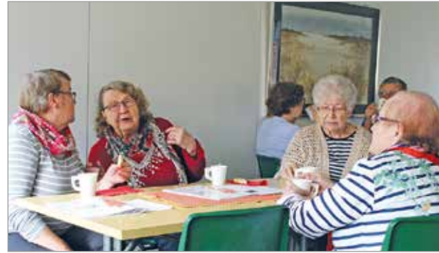
Toimintapäivänä vaihdetaan kuulumisia ja parannetaan maailmaa.

Toimintapäivänä tarjottavat kahvit ja muut tarvikkeet puolestaan hankkii Oulunkaaren seutukunnan