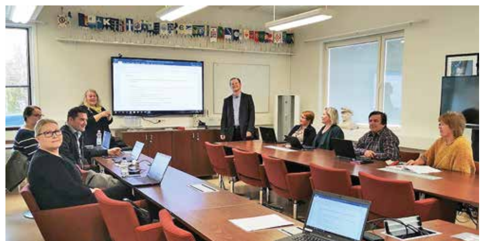
Iin Hyte-työryhmä on asettanut tavoitteet, jotka tulevat näkymään Iin kunnan talousarviossa vuodelle 2020.