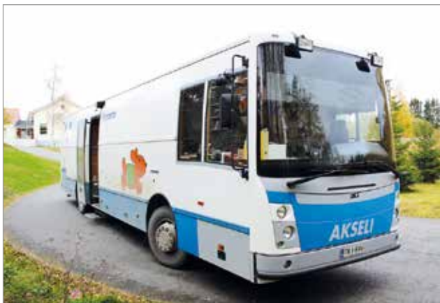
Kirjastoauto Akseli on tarkoitus korvata uudella autolla. Samalla sen toimintoja pyritään laajentamaan monien palvelujen tuojaksi Iin eri kylille.

Iin kirjastoauto Akseli on muutaman vuoden kuluttua käyttöikänsä päässä. Valtionavustusten saamisen vaikeutuminen auton uusintaan