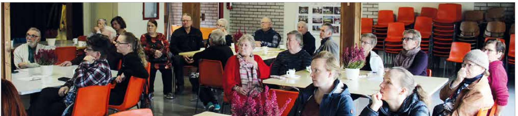
Iin ensimmäinen ommaisraati kokosi omaishoitajia yhteisten pöytien ääreen.

Alustuspuheenvuorojen jälkeen omaishoitajat jakaantuivat ryhmiin pohtimaan jaksamiseen ja tarvittaviin tukitoimiin liittyviä kysymyksiä. Ryhmätöiden yhteenvedot kootaan marraskuussa kokoontuvan yhteistyöfoorummin käyttöön. Yhteistyöfoorumissa kuntapäättäjät ja omaiset pohtivat yhdessä ommaisraadissa esille nostettuja asioita omaishoitajien aseman parantamiseksi. MTR