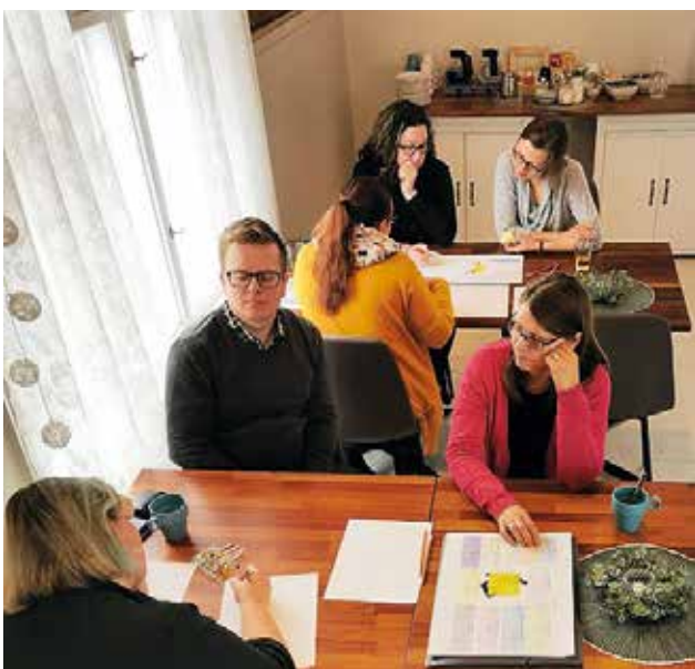
Hyvinvointi näkyy Iin kunnan talousarviossa 2020. Hyvinvointityöpajassa Iin kunnan hallinnon ja elinvoiman työntekijöitä.

Kuntalain 1 § mukaan kunnan tehtävänä on edistää asukkaidensa hyvinvointia ja kestävä kehitystä alueellaan. Kunnan on seurattava asukkaidensa terveyttä ja hyvinvointia sekä