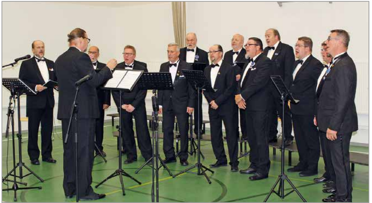
Konsertin aluksi kuultiin "Laulajan tervehdys" niminen kappale.