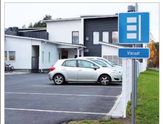
Koulun p-alue kaipaa selkeämpää opastusta invapaisköiden sijainnista.