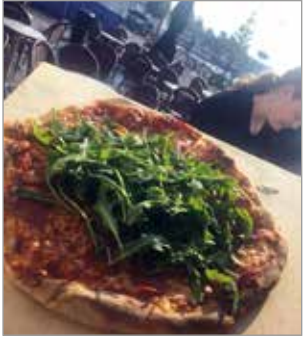
Italiaiset pitsat tehdään Torin Kipparissa paikallisista raaka-aineista.