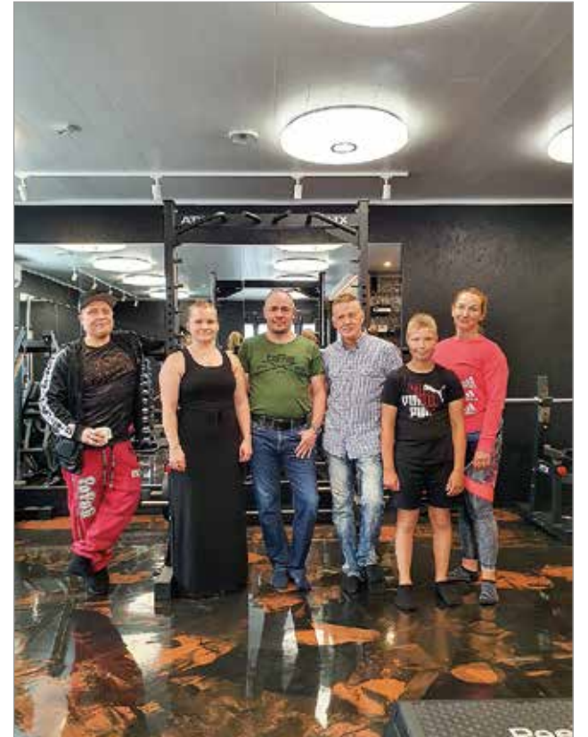
Kuvissa yllä ja alla on vierailijoita, mm. iiläisiä yrittäjiä ja nykyisiä sekä tulevia valmennettavia.