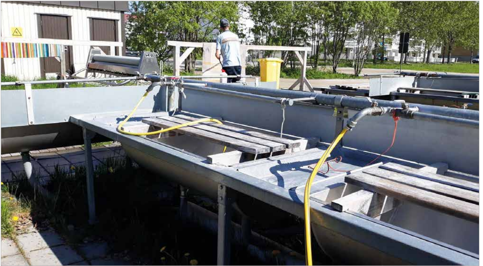
Matonpesupaikka voisi olla vaikka tällainen.