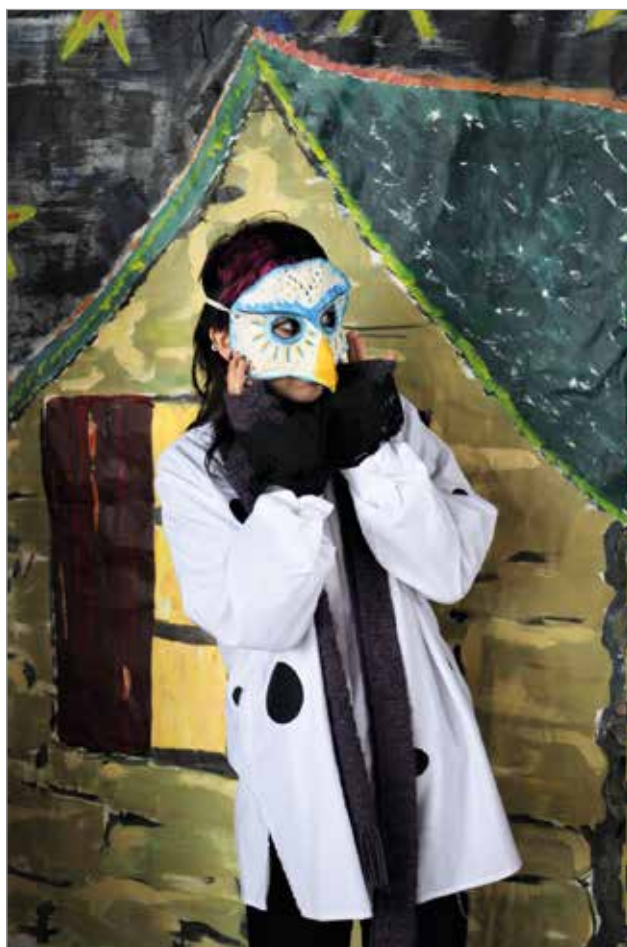
Työryhmä on laatinut näytelmän lavasteet sekä puvut ja puolinaamiot.

Lippuja voi ostaa paikan päältä käteisellä.