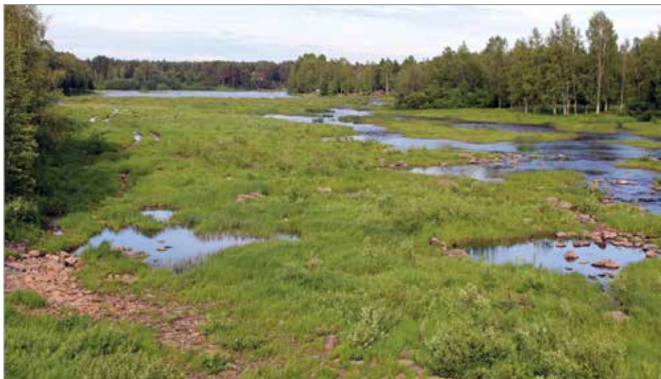
Näkymä Illinkoskesta ei nykyisellään luo kuvaa suuresta joesta.