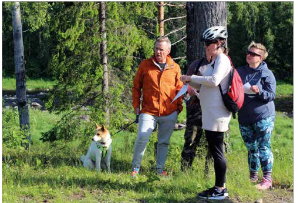
Etenkin rantapolku ja nuotiopaikka arveluttivat osaa asukkaista.