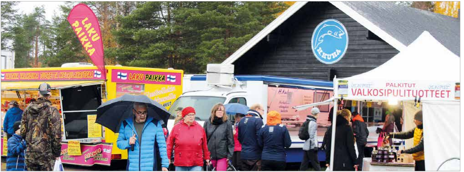
Syyskalaaseilla riitti yleisöä, vaikka aika ajoon satoi rankasti.