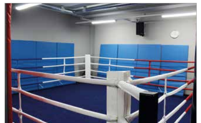
Väestösuojatiloissa on monipuolinen nyrkkeilyalue.