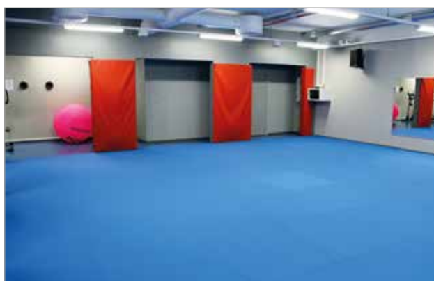
Budo- ja kamppailutila on järjestöjen ja ryhmien käytössä.