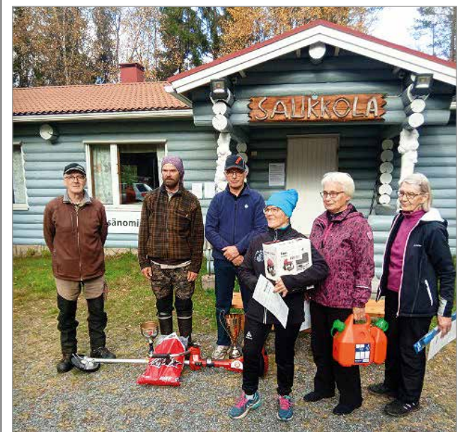
Palintojen saajat yhteiskuvassa.