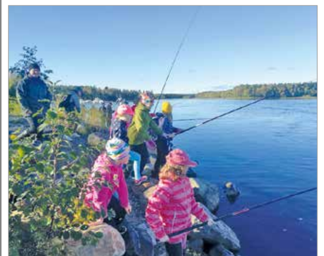
Koululaisten mielestä kalastuspäivä tapahtuma oli tosi mukava ja onnistunut.

Terkuin Haminan koulun 4A ja 4C oppilaat