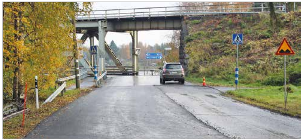
Ii-lintie saa uuden päällysteen Aseman rautasillalle saakka.

deksan kilometriä teitä. Iissä hankkeiden toteutumista tervehditään ilolla, kuoppaisten osuuksien saadessa uuden tasaisen pinnoitteen. MTR