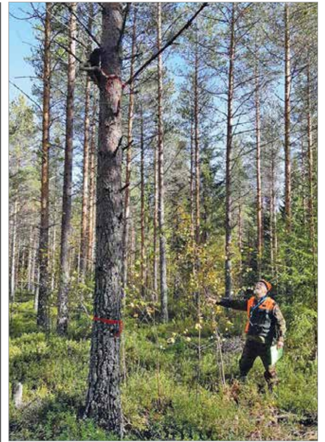
Lajitunnistamistehtävä. Puussa minkki, jota kaikki eivät tunnista.