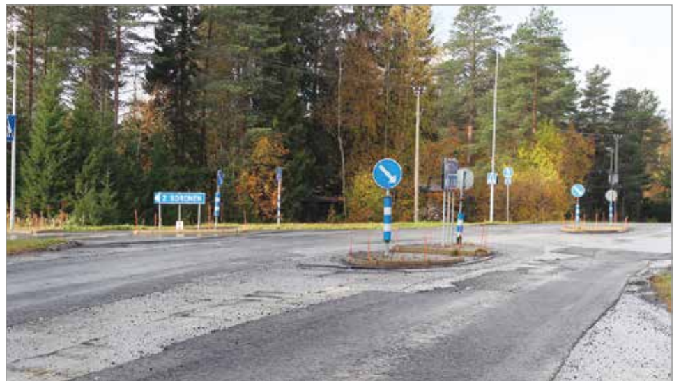
Sorosentien risteyksessä on useana syksynä ja talvena moni auto vaurioitunut kuoppiin ajon seurauksena. Pian kuopat ovat muisto vain. Pohjatöiden jälkeen risteysalue päällystetään.