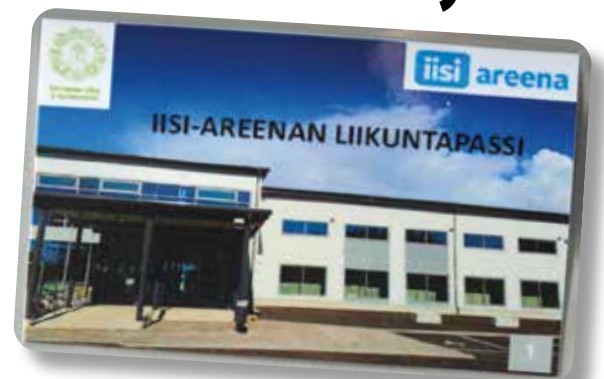
"Liikuntapassi" on voimassa vuoden ostopäivästä kaikissa Iisi-areenan varattavissa tiloissa. Passi on henkilökohtainen.

Aktivoidakseen eläkeläisiä, opiskelijoita ja työttömiä, sekä asevelvollisia käyttämään Iisi-areenan liikuntamahdollisuuksia, on Ii-instituutti-lautakunta päättänyt ottaa käyttöön heille suunnatun "Liikuntapassin". Passit tulivat myyntiin Iisi-areenalle maanantaina 21.8. Passin hinta