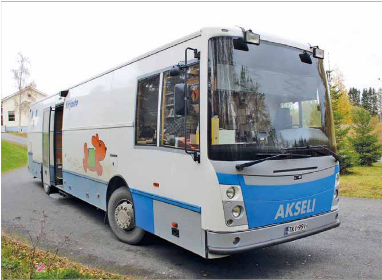
Kirjastoautotoimintaa ollaan lakkauttamassa tulevan huhtikuun alusta. Aiemmin suunniteltiin kirjastoauto Akselin uusimista.