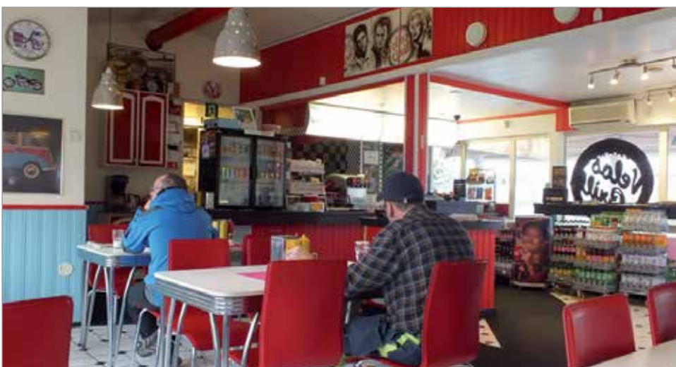
Amerikkalaistyyllisesti sisutetulla Nelos-Grillillä riittää asiakkaita lomasesonkien ulkopuolellakin.