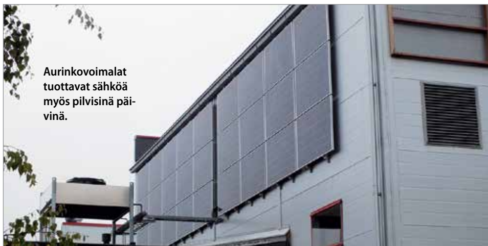
Aurinkovoimalat tuottavat sähköä myös pilvisinä päivinä.