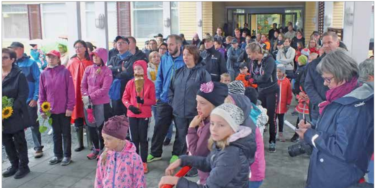
Avajaisjuhlaan osallistui runsaasti kyläläisiä.