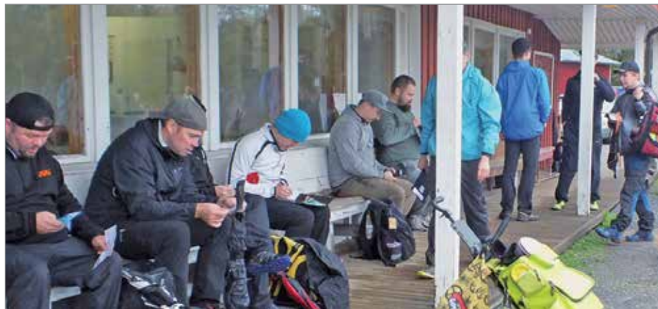
Aamupäivän kierros on takana ja kilpailijat kokoontuvat ruokatauolle hiihtomajalle.

Illinsaaren frisbeegolfrata on saanut kiitosta lajin harrastajilta. Lauantaina 22.9.