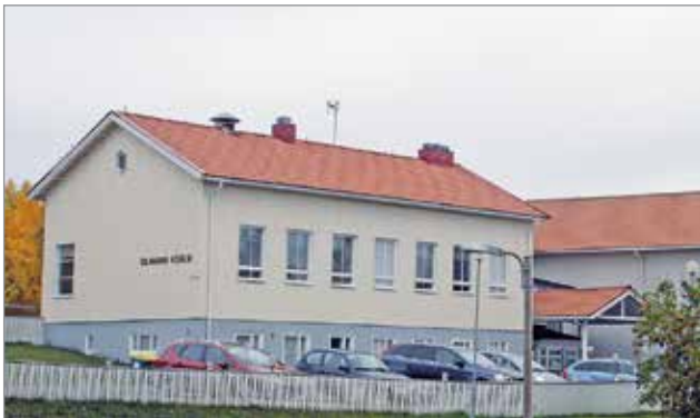
Olhavan koulu on toiminut 125 vuotta.