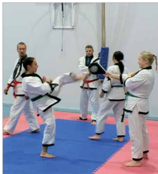
Iin Hapkidoseuran näytöksessä oli vauhtia.