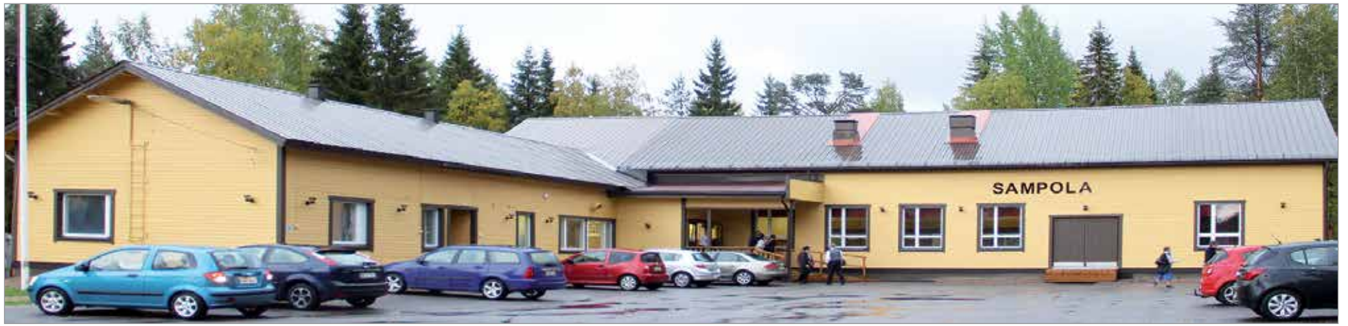
Nuorisoseuran talo Sampola on palvellut kyläläisten toiminta-, harrastus- ja kokoontumispaikkana 1960 luvulta lähtien. Talossa on tehty historian aikana jatkuvasti laajennus- ja kunnostustöitä ja ne jatkuvat edelleen lähitulevaisuudessa mm. lämmitysratkaisuksi tulee maalämpö.