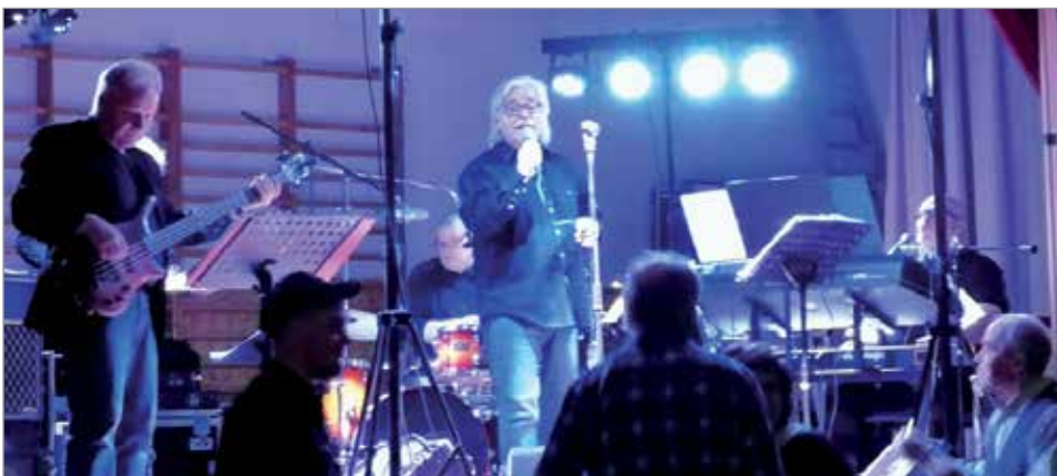
Juhlatansseissa esiintyi iskelmälaulaja Matti Esko.