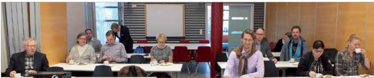
Iin Yrittäjien aamukahvitilaisuus kiinnostaa yrittäjiä.

tyväinen tilaisuuden antiin, sekä osanottajamäärään. Paikalle oli saapunut lähes kaksikymmentä yrittäjää. MTR