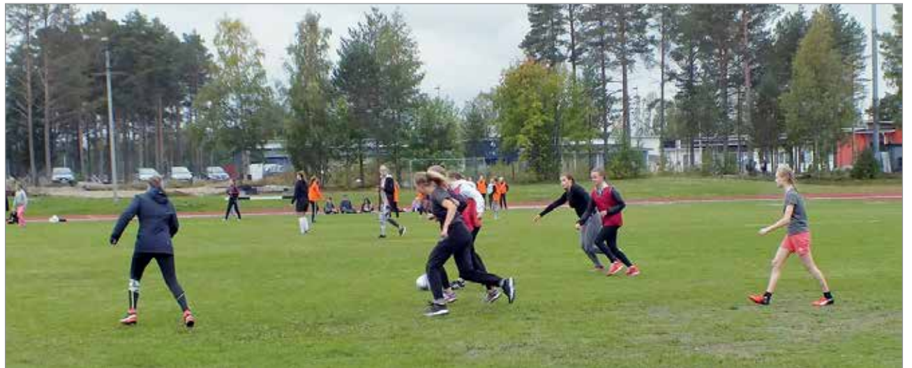
Tyttöjen pelissä on vauhtia ja vaarallisia tilanteita.

Valtarin koulussa ja Iin lukiossa vietettiin tiistaina 11.9. liikuntapäivää. Oppilaat saivat valita jalkapallon ja muiden toimintojen, kuten geokätköily, frisbeegolf, onginta, puolukanpoiminta, luontoretkeily, välillä.