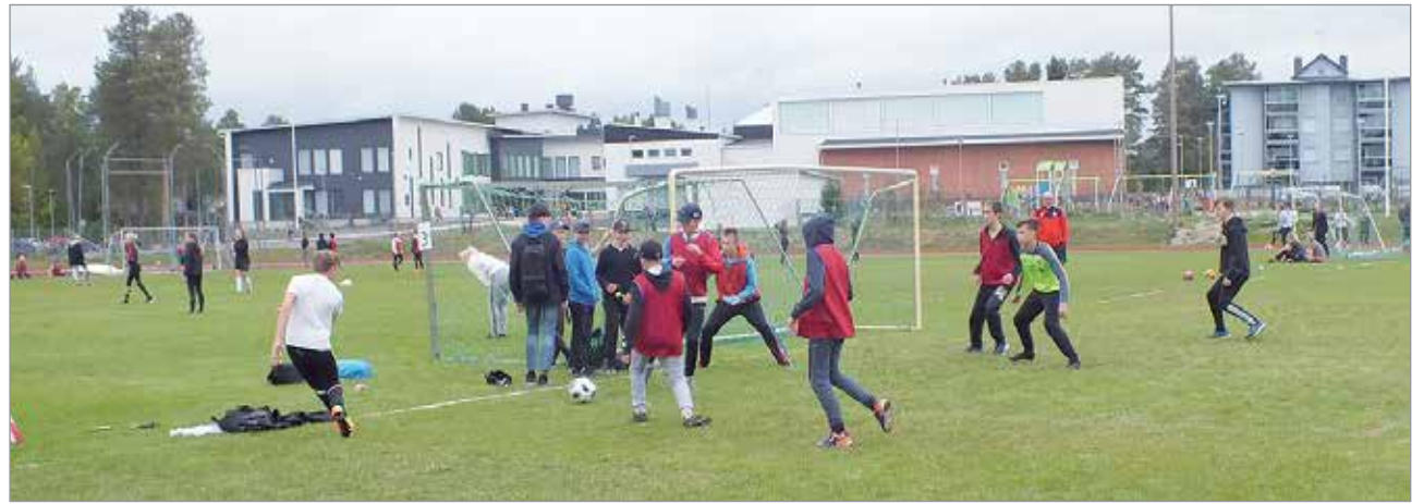
Keskitykset luovat aina vaarallisia tilanteita maalinedustalle.