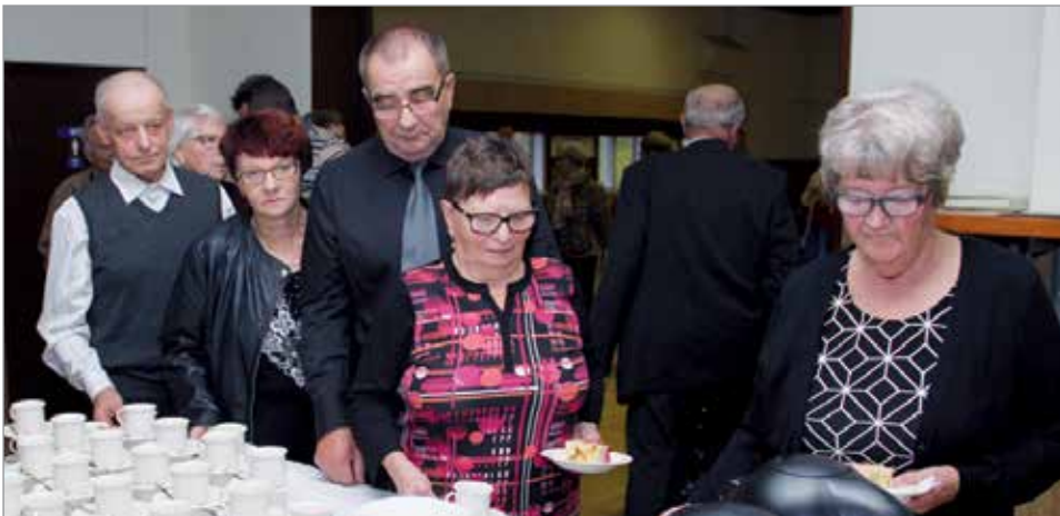
Juhlan jälkeen tarjottiin täytekakkukahvit.