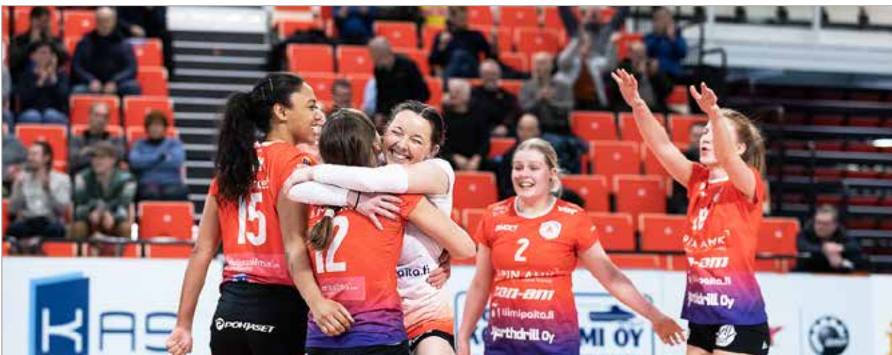
Arctic Volley Rovaniemeltä saapuu pelaamaan Iisi-areenalle 29.1. naisten lentopallon mestaruusliigan otteluun.

täkuntana hyvää palautetta pelaajilta. Iisi-areenalla yleisö oli tuotu mukavasti lähelle pelaajia, mutta salin valaistuksessa olisi hieman toivomisen varaa. Myös vapaa-aikapalveluiden osaava ja avulias henkilökunta sai kehuja.