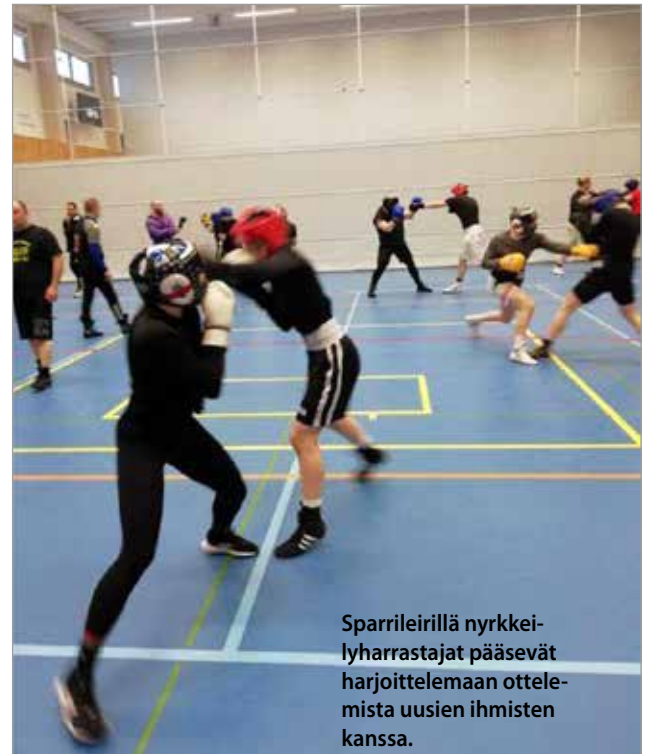
Sparrileirillä nyrkkeilyharrastajat pääsevät harjoittelemaan ottelemissa uusien ihmisten kanssa.