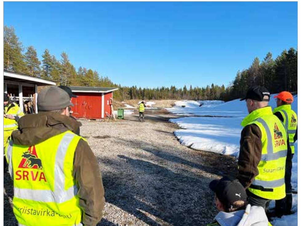
SRVA-ryhmä harjoittelemassa ampumaradalla.