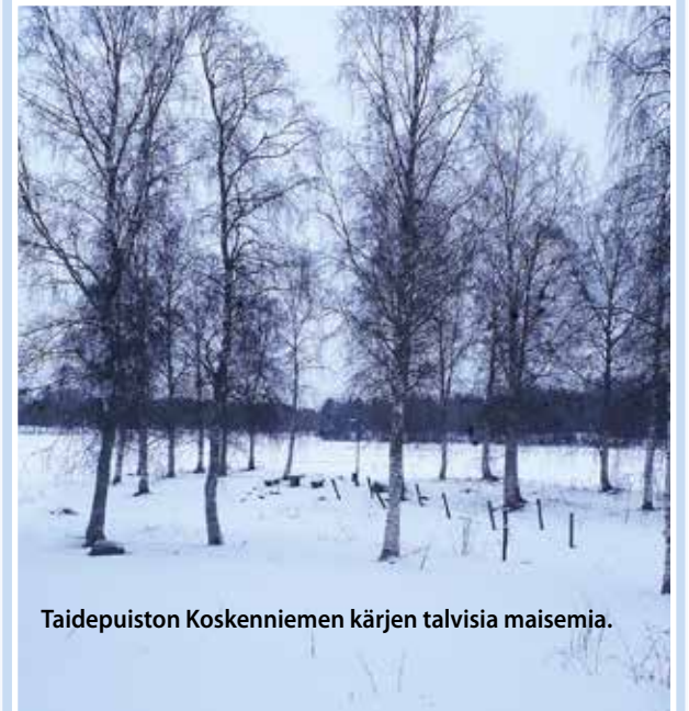
Taidepuiston Koskenniemen kärjen talvisia maisemia.