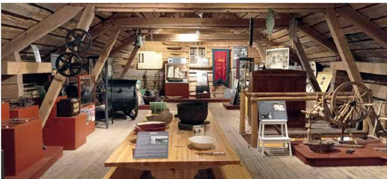
Pohjolan Rengastien kohteisiin kuuluu myös li kulttuurikohteineen, kuten Iin kotiseutumuseo.

Ota yhteys p 0400 845 666,, tai 0400 385 281 info@iinlehti.fi