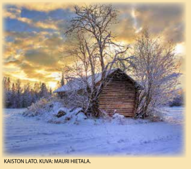
KAISTON LATO.

lukijoiden palaute ja jutut: vkkmedia@vkkmedia.fi