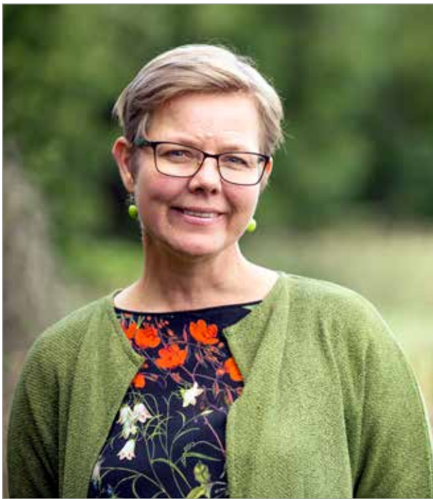
Iin Vihreiden 10-vuotisjuhlan vieraaksi saapuu sisäministeri Krista Mikkonen.