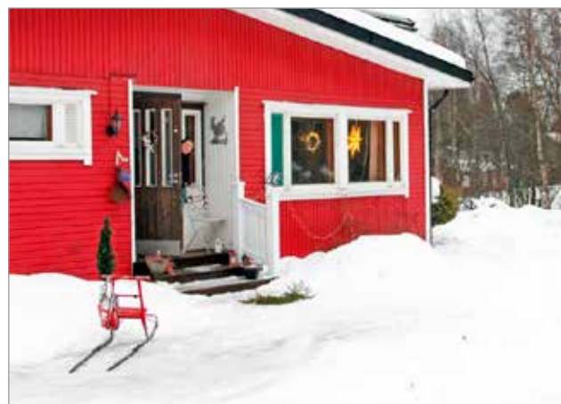
Kulttuurikoti Salmela sijaitsee Iin Huoviskylässä. Kodikkaan tuvan yläkerrassa on myös mahdollisuus majoitustoiminnan järjestämiseen.

- Uskomme, että Salmela tulee elävöittämään Iin asemanseudun elämää. Salmela elää hyvin vahvasti nykyajassa, mutta kantaa mukanaan paljon kulttuuriperintöä, jota halutaan säilyttää ja siirtää jälkipolville. JK