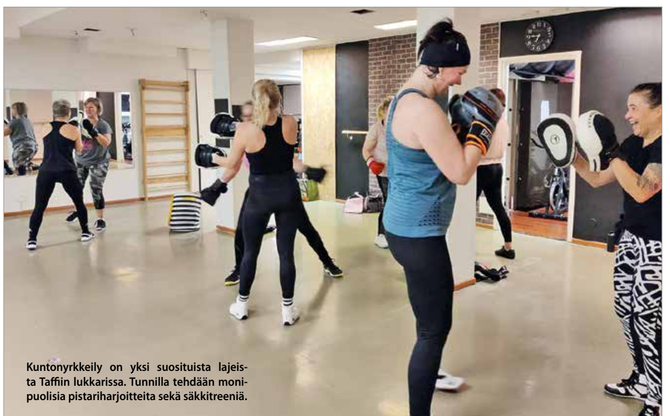
Kuntonyrkkeily on yksi suosituista lajeista Taffiin lukkarissa. Tunnilla tehdään monipuolisia pistariharjoitteita sekä säkkitreeniä.