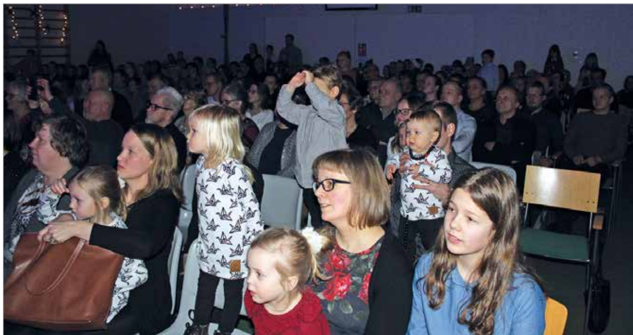
Kylän elinvoimaisuutta ja koulun valoisa tulevaisuutta kuvastaen juhlaan osallistui paljon alle kouluikäisiä lapsia.