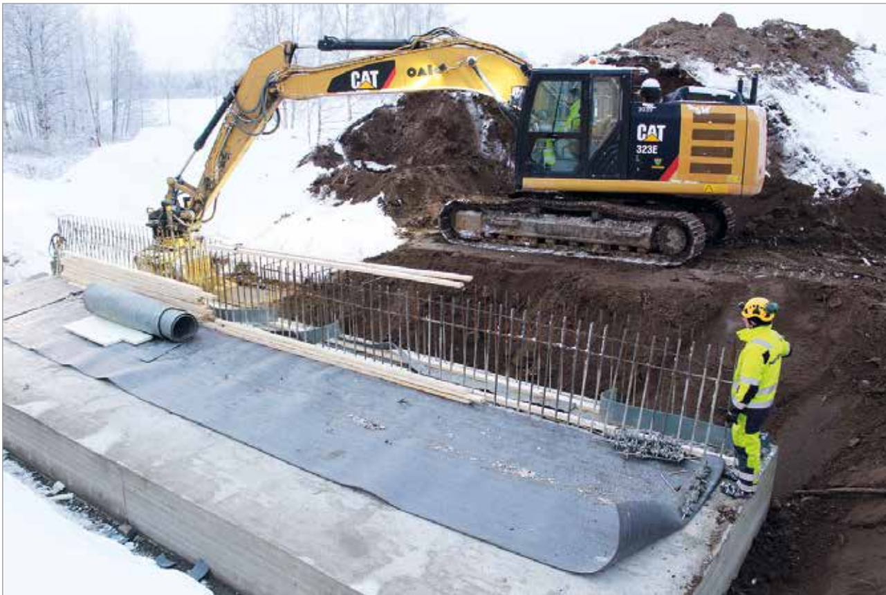
Jarkko Orava valvoo kaivinkoneen työskentelyä Jakkukylän koulun nurkalla tapahtuvan valutyön osalta.