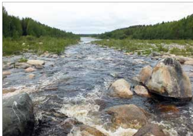
Uiskarin kalatien on koekalastuksin voitu todeta toimivan.

Hän toivoisikin vanhaan uomaan panostamista vaihtoehtona Raasakan kalatiele, jonka kustannukset ovat useita miljoonia euroja, eikä kalatien toimivuudesta ole varmuutta. MTR