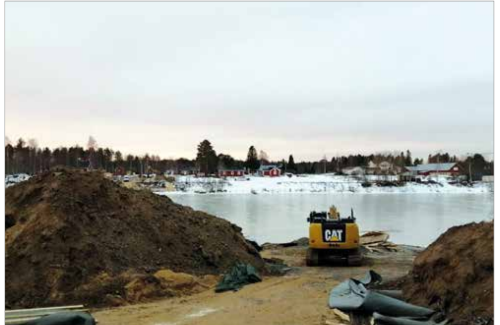
Näkymä samasta ikkunasta siltatyömaalle 9.1.2020