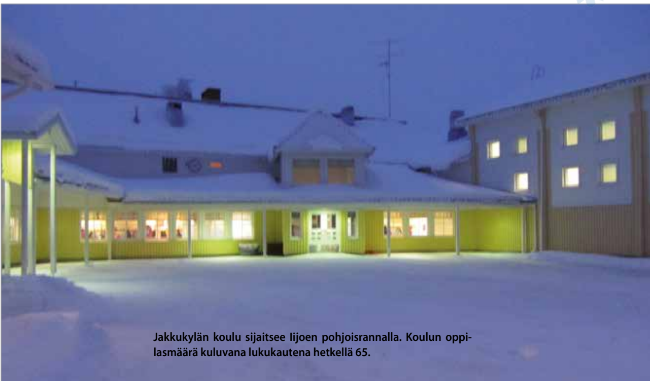
Jakkukylän koulu sijaitsee lijoen pohjoisrannalla. Koulun oppilasmäärä kuluvaan lukuvuotena hetkellä 65.

Paljon tykättiin myös makaronilaatikosta, lohkopurunoista, nakkikeitosta, lihapullista, spagetista, pinaattilätyistä jne.