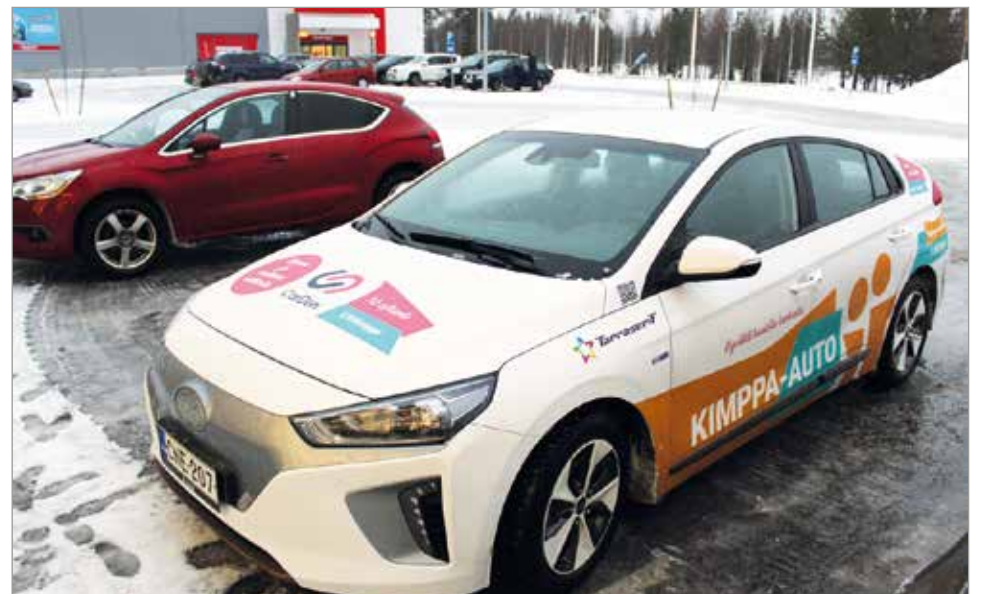
Kimppa-autona toimiva Iin kunnan täyssähköauto on helppo ajettava haastavissakin olosuhteissa ja toimintasäde on riittävä asiointiin naapurikunnissakin.

gelmien suhteen asiakaspalvelu on puhelinoiton päässä ja pystyy etänä esimerkiksi lukkiutuneet ovet avaamaan. Kimppa-auto tarjoaakin kuntalaisille uuden ja mielenkiintoisen tavan osallistua ilmastonmuutoksen vastaisiin toimiin. Helmikuun alusta kimppa-auton voi varata viikonloppuisin myös koko päiväksi tai viikonloppuksi edullisilla tutustumishinnoilla. MTR