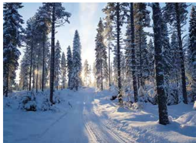
Purusaaren reittiä.