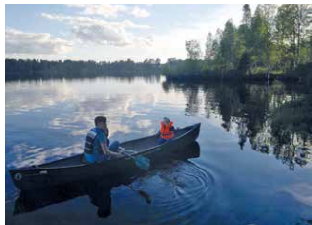
Melomassa Iijoen. Jakkukylässä hurjemmat pääsee myös laskemaan koskea kevättulvien aikaan ”vanhalla uomalla”.