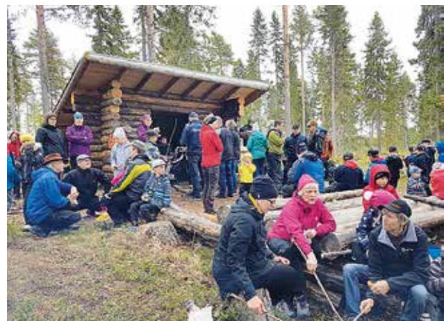
Kylälaisten retki Purusaaren laavulle.