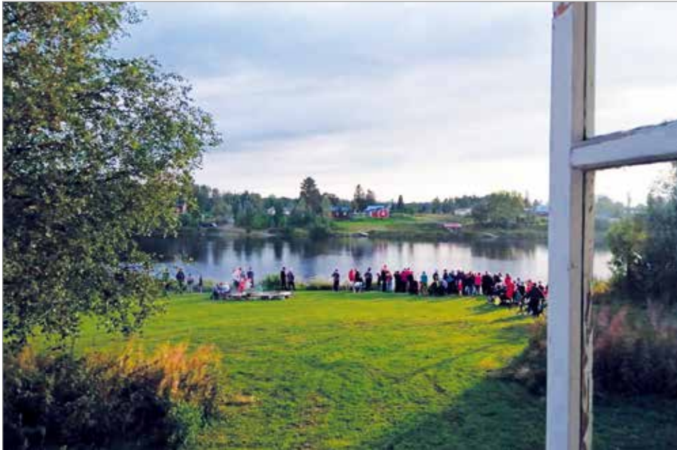
Näkymä luokan ikkunasta lijoelle venetsialaistapahtumassa elokuussa 2019.