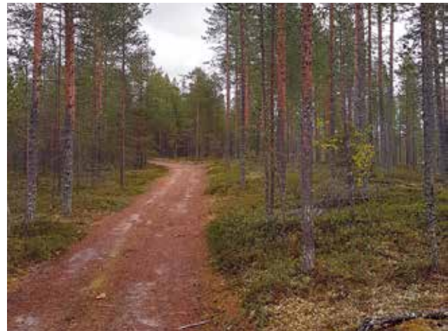
Kuntoilija pääsee nauttimaan Jakkukylässä porrasjuoksusta ja mukavista metsäpoluista.