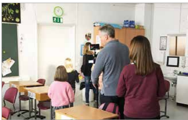
Aseman koululla Saksan suurimman kaupallisen tv-kanavan RTL:n toimittaja tutustui kouluilla tehtävään kierrätykseen.