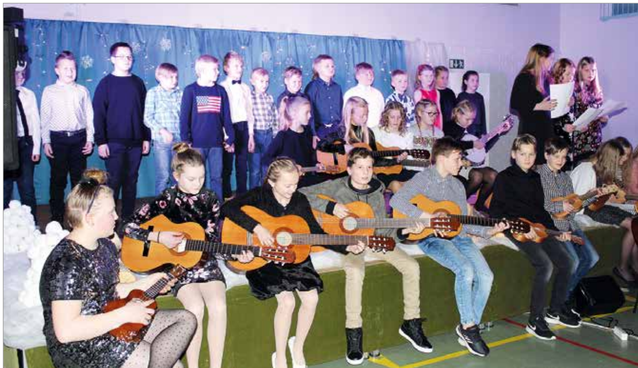
Koulun 3-4 luokkalaist esiintymässä 5-6 luokkalaisten säestäminä.