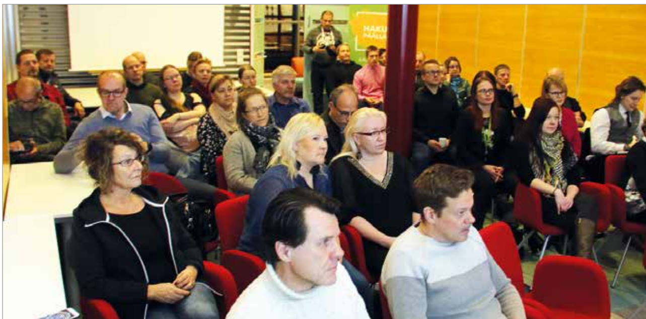
Aamupalatilaisuudessa oli liki 40 kuulijaa. Seuraava järjestetään Kuivaniemellä 21.2. yhdessä Kuivaniemen Yrittäjien kanssa.

Vuoden 2020 hallituksen jäsenet haluavat muistuttaa, että innokkaita vapaaehtoisia otetaan avosylin vastaan. Yhdistyksessä voi toimia näkyvästi tai näkymättömästi, vaikkei hallitukseen kuuluisikaan. MTR