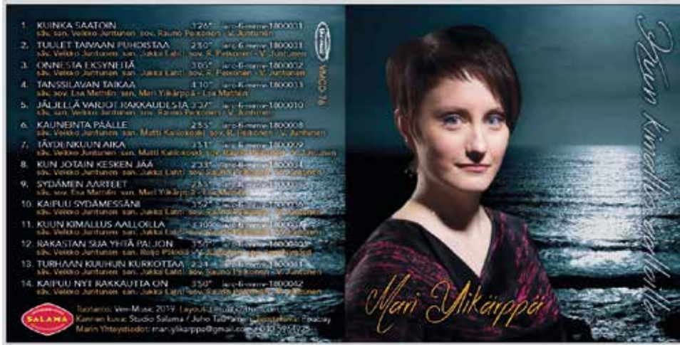
Kuun kimallus aalloilla levy ilmestyi tammikuun alkupuolella.

riskunnan yhdessä tekemää kappaletta ”Tanssilavan taikaa” ja Sydämen aarteet” jotka ovat Esan säveltämiä ja sovittamia, sekä Marin ja Esan yhdessä sanoittamia. Muut levyn neljästätoista kappaleesta ovat Veikko Juntusen sävellyksiä. Levyn tuottaja Jukka Lahti puoles-