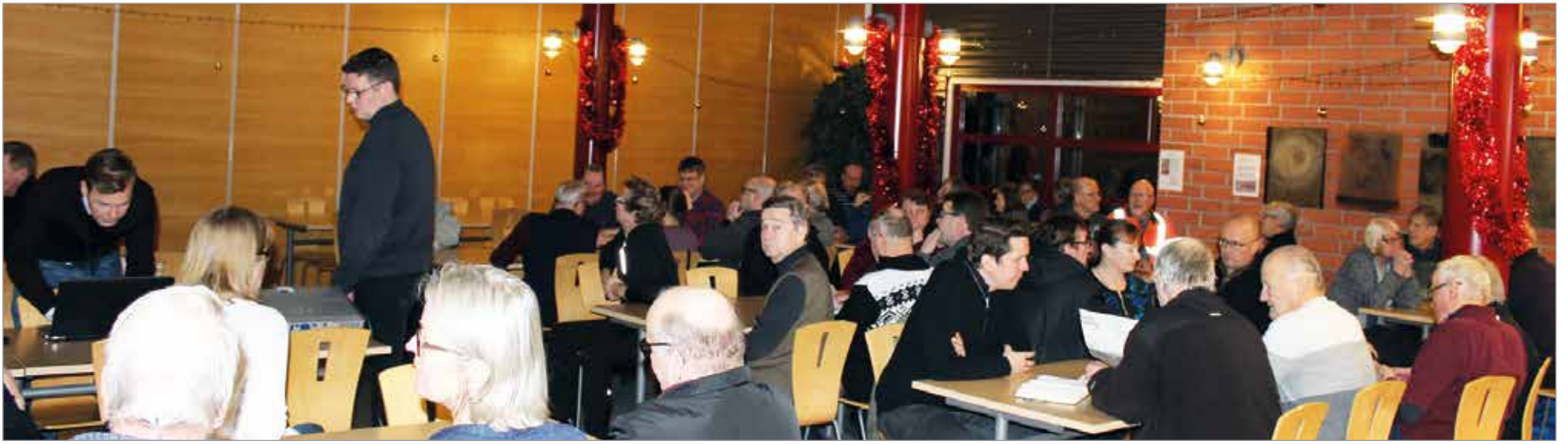
Ollinkorven tuulivoimapuiston suunnitelman kiinnostivat maanomistajia.

Ollinkorven tuulipuistosta merkittävä energiantuottaja ja työllistäjä