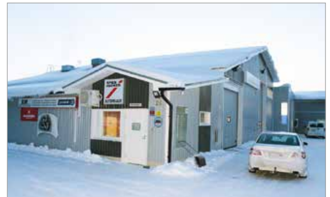
Iin Automaalaamon modernit tilat löytyvät Iin keskustan liepeiltä, osoitteesta Pentintie 26.