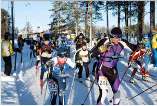
Hiihtosuunnistus on vauhdikas laji. Etenkin viestien lähdössä riittää säpinää.