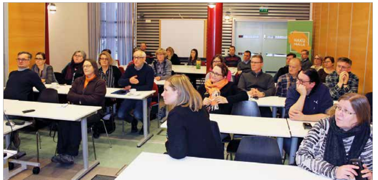
Miniseminaariin osallistui noin kolmekymmentä henkilöä.