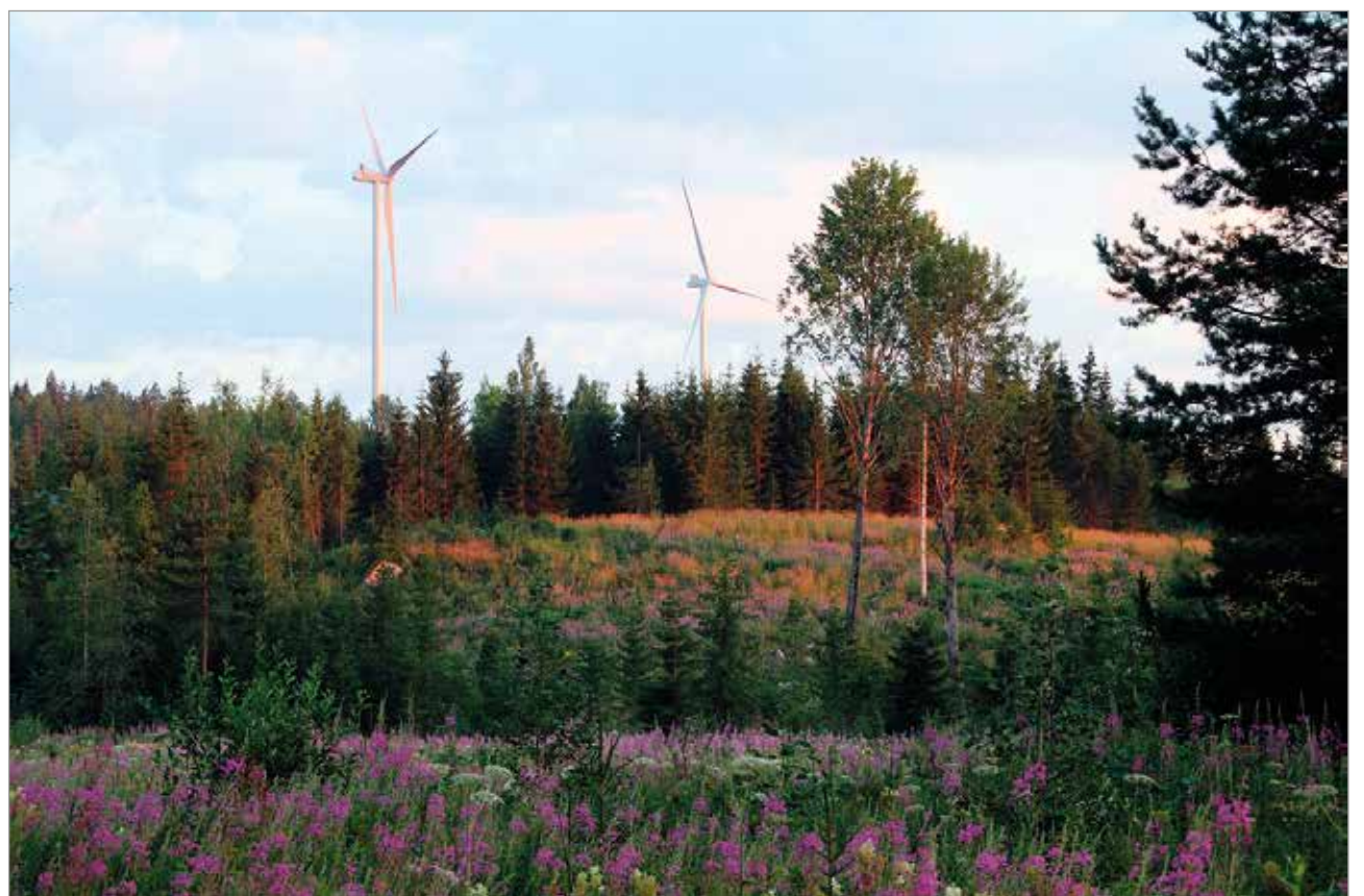
Ilmatar Oy:n tuulivoimaloita Luhangan Latamäen ilta-auringossa. Ollinkorven tuulivoimaloiden korkeudeksi tulee 300 metriä.