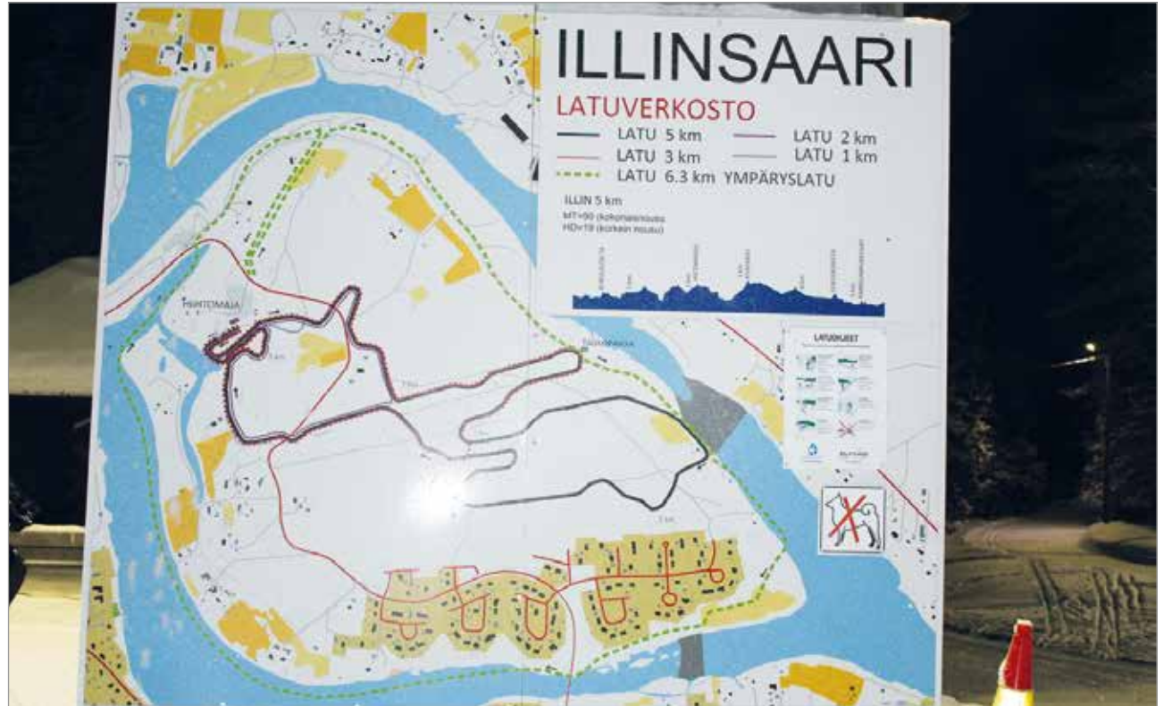
Illinsaaren latuverkosta tarjoaa hyvän alustan järjestää tulevan viikonlopun hiihtosuunnistukset. Latuverkoston lisäksi maastoon on ajettu yli kymmenen kilometriä kelkkauria.