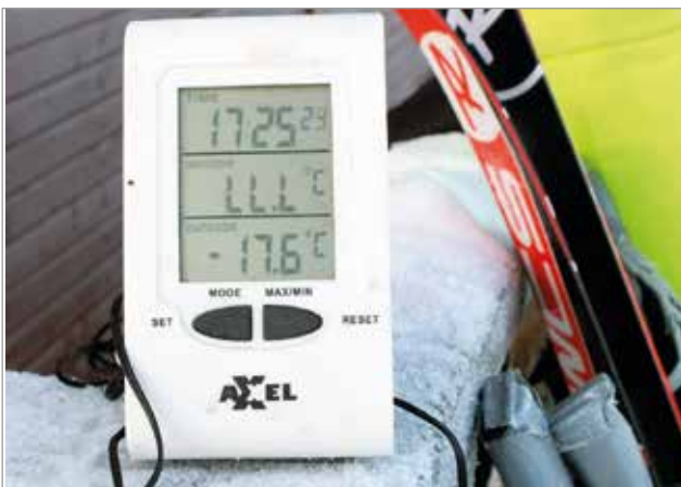
Usein pakkasen on kireää alkutalven hiihtosuunnistuksissa, kuten lissä helmikuussa 2018.