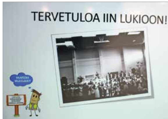
Iin lukion avointen ovien päivää vietettiin tänä vuonna 17.1.

Iin, Kuivaniemen ja Yli-Iin yhdeksännet luokat tutustuivat kouluun