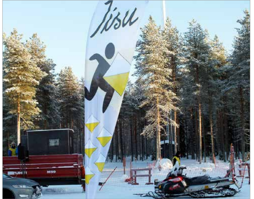
Iisun lippu on liehunut jo vuodesta 1971.