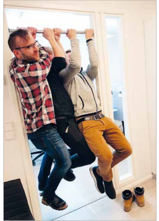
Pystysuunnassa ovikarmi kestää todella suuria kuormituksia.

-Mikä sen näppärämpää koululle kuin tanko, jonka korkeutta voi hetkessä muuttaa. Enää ei tarvita pulpettia