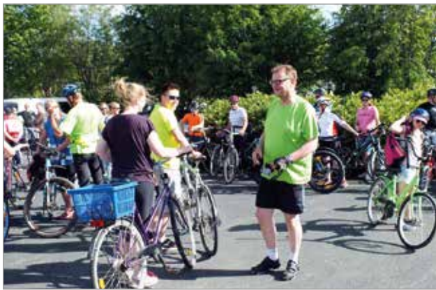
Siltahanketta vauhditettiin muun muassa pääministeri Juha Sipilän johdolla järjestetyillä Jakkukyläpyöräilyillä.

Jakkukylän koulun kohdalle rakennettavalla riippusillalla on pituutta lähes 250 metriä, sillan jännevälin ollessa 180 metriä. Sillan pylonien korkeus on 20 metriä. Silta on suunniteltu riippusillak-