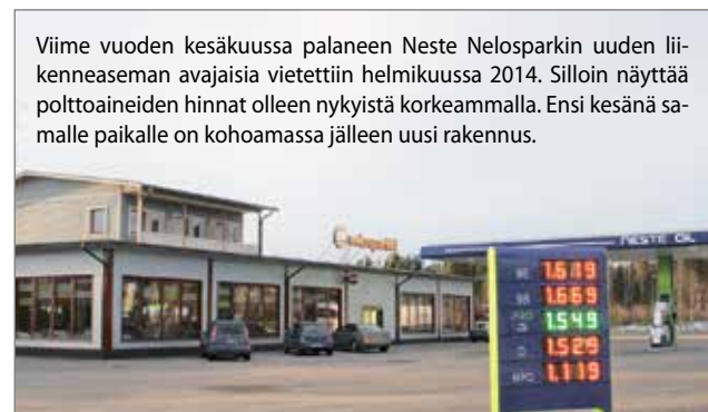
Viime vuoden kesäkuussa palaneen Neste Nelosparkin uuden liikenneaseman avajaisia vietettiin helmikuussa 2014. Silloin näyttää polttoaineiden hinnat olleen nykyistä korkeammalla. Ensi kesänä samalle paikalle on kohoamassa jälleen uusi rakennus.