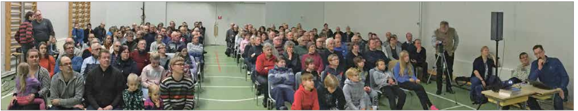
Jakun koulun liikuntasali täyttyi seiinä myöten kiinnostuneesta yleisöstä