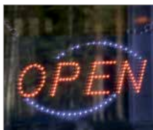
Uudella liikeasemalla "open" valo syttyy ja uusi yrityksen mainosvalo nostetaan katolle tämän hetken tiedon mukaan ensi kesänä.

Neste Nelosparkki liikenneasema Kuivaniemellä rakennetaan uudelleen kesäkuussa 2016 tapahtuneen palamisen jälkeen. Rakennustyöt aloitetaan parin viikon sisällä eli helmikuun puoleen väliin mennessä. Uusi rakennus tulee entisen kiinteistön paikalle, mutta uusilla piirustuksilla.