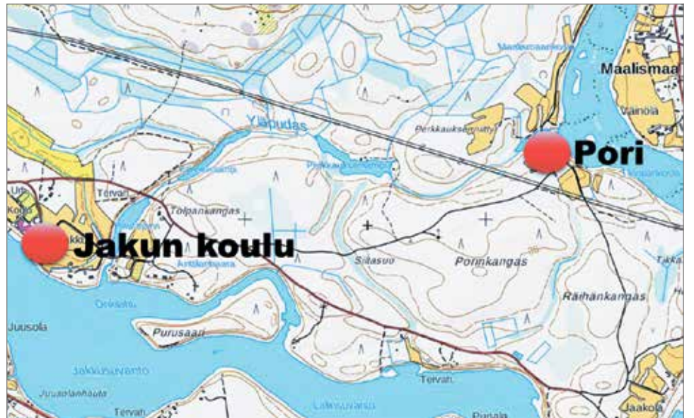
Pori sijaitsee Jakkukylässä Maalismaan vanhan uoman rannalla.