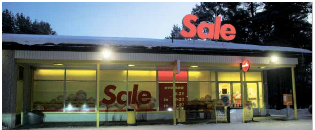
Kuivaniemen Salen kiinteistössä on tehty kauppa 80-luvulta lähtien, 2004 lähtien Sale-myymlän.