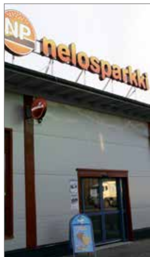
Nelosparkin kyltti nousee uuden rakennuksen katolle ensi kesänä.