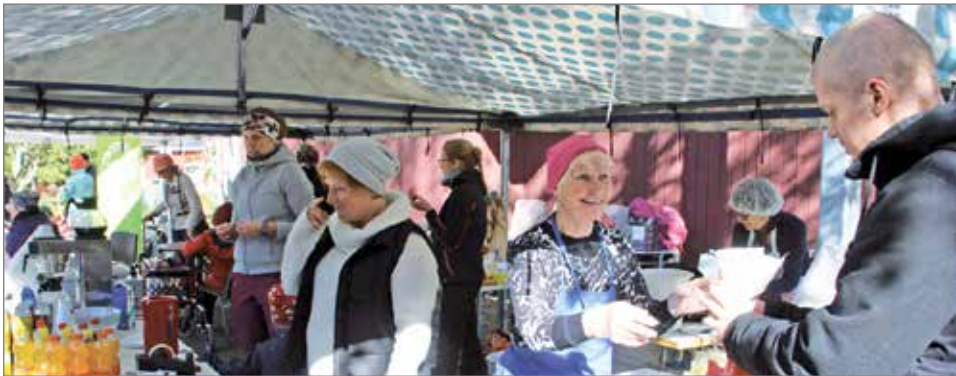
Iin Vanhan Haminan markkinoilla viime syyskuussa Kuivaniemen Nuorisoseura oli järjestäjänä ja seuralla oli myös oma vilkkaasti toimiva kahvilateltta.