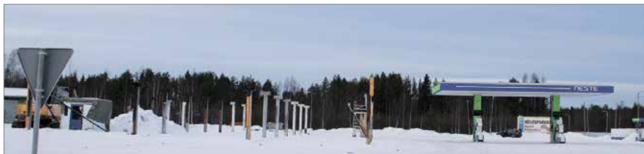
Palopaikka on raivattu ja pylväät muistuttavat lähes uudesta palaneesta liikenneasemasta. Mittarikenttä säilyi ja siitä aloitetaan polttoainemyynti helmikuun alkupuolella. Vasemmalle puolelle on tulossa ensi kesänä Neste Oilin raskaan kaluston D-tankkauspaiste.