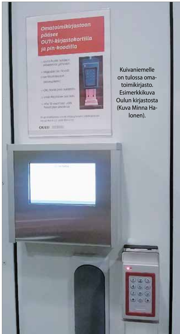
Kuivaniemelle on tulossa omatoimikirjasto. Esimerkkikuva Oulun kirjastosta.

Kuivaniemen kirjastosta on tulossa omatoimikirjasto eli kirjaston aukioloajat laajenevat nykyisestään. Muutos tapahtuu tämän kevään aikana.