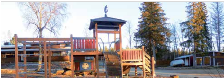
Merihelmi Campingin leikkikenttää. Merihelmi Camping toimii ympäri vuorokauden. Upea alue meren rannalle tarjoaa hienot puitteet lomailijoille.

Nykyisin alueella, joka toimii ympäri vuoden, on kesäisin noin 50 vuodepaikkaa ja kolmellekymmenelle karavaanarille tarkoitettu alue lisää kapasiteettia. Merihelmi Camping tarjoaa myös yhteiset keittiö-, pesu-, grillaus- ja leikkutilat ja tilausaunat. Talvisin pienimmät mökit eivät ole käytettävissä.