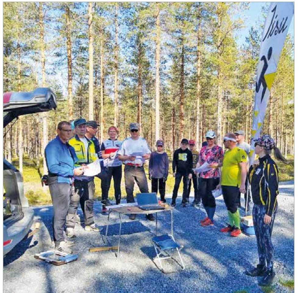
Iirasteilla rasteja etsi parikymmentä suunnistajaa.

Iisun toimesta Jakkukylä on saanut uuden monipuolisen liikuntapaikan. Seuran aktiivit tarttuivat kylästä tulleiden toiveiden pohjalta työhön ja Jakkurannan alueesta on valmistunut uusi suunnistuskartta.