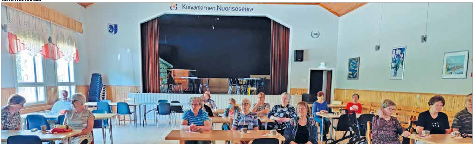
Live-lähetystä seurattiin Kuivaniemen Nuorisoseuralle kahvista nauttien.