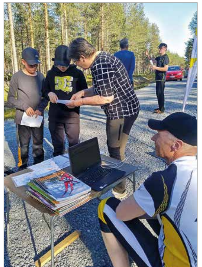
Alku aina hankalaa, onneksi opastusta löytyy.