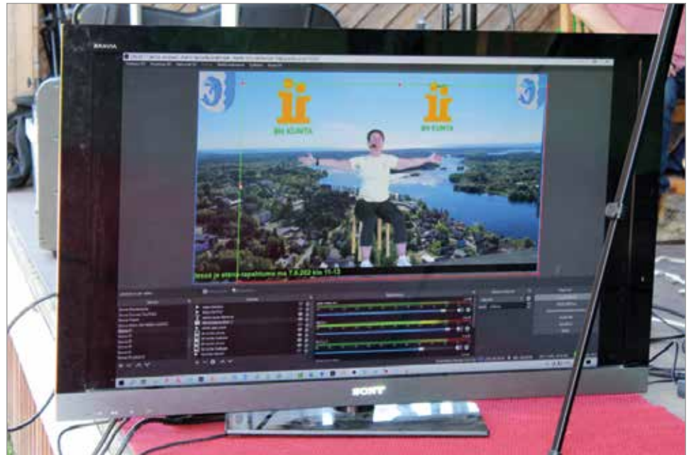
Kotikatsomoihin päivän ohjelma streamattiin liVision Youtube kanavalle.