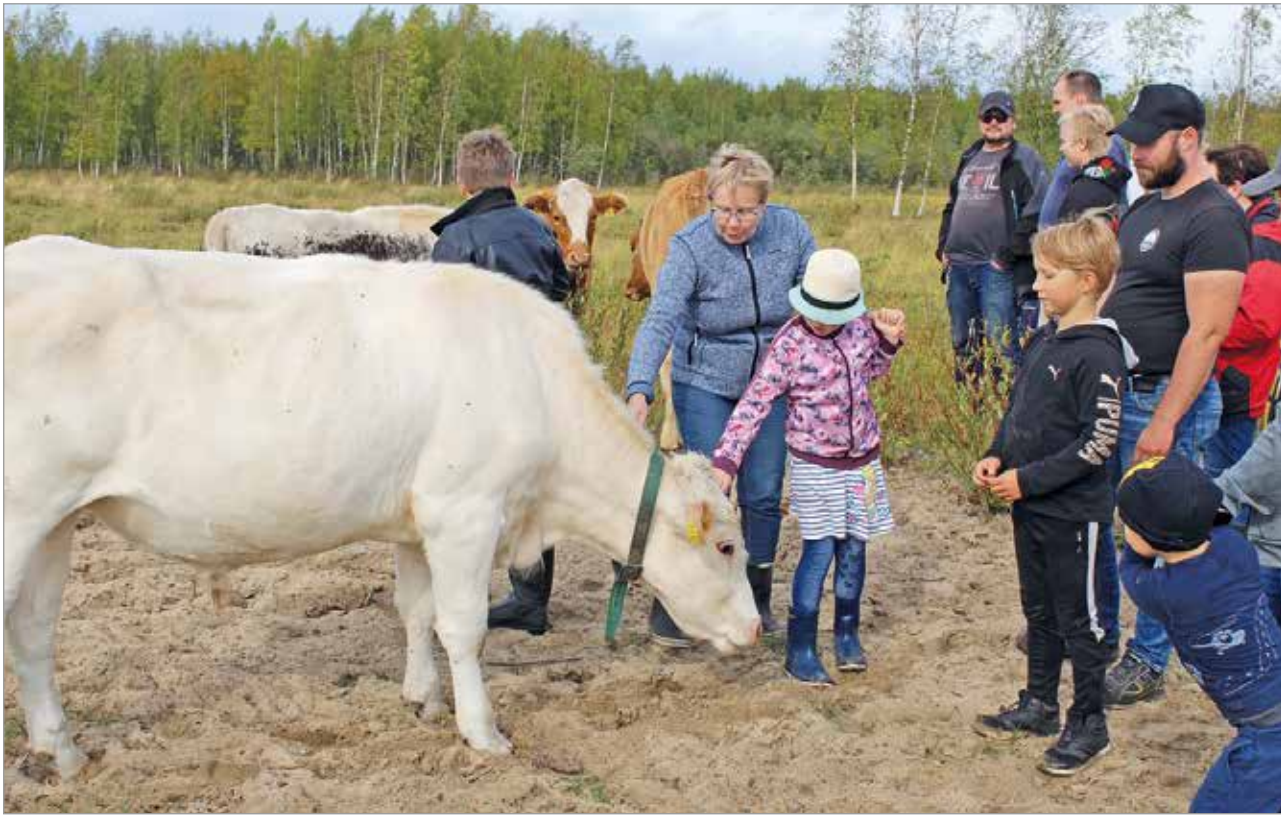
Rantaniityllä pääsi tutustumaan lapinlehmisiin lähietäisyydeltä.