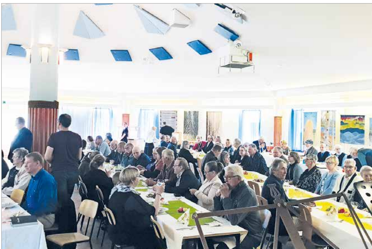
Vieraita oli paikalla runsaslukuisesti ympäri maakuntaa