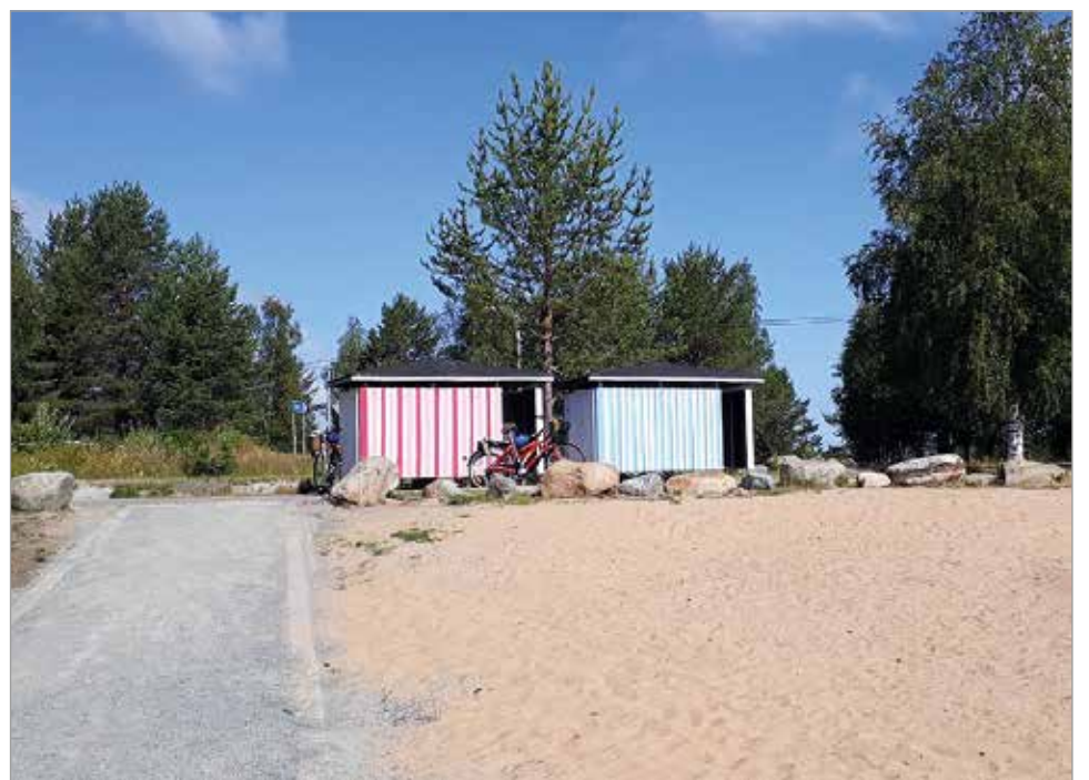
Kesän aikana rakennettu Vihkosaaren uimalan oleskelualue ja kunnostettu ranta otetaan virallisesti käyttöön.