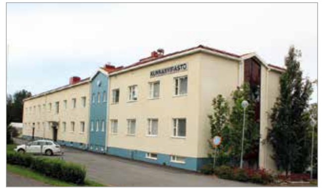
1990-luvun alkuvuosina laajennettu ja saneerattu Iin kunnanvirasto kärsii vakavista sisätilaongelmista.