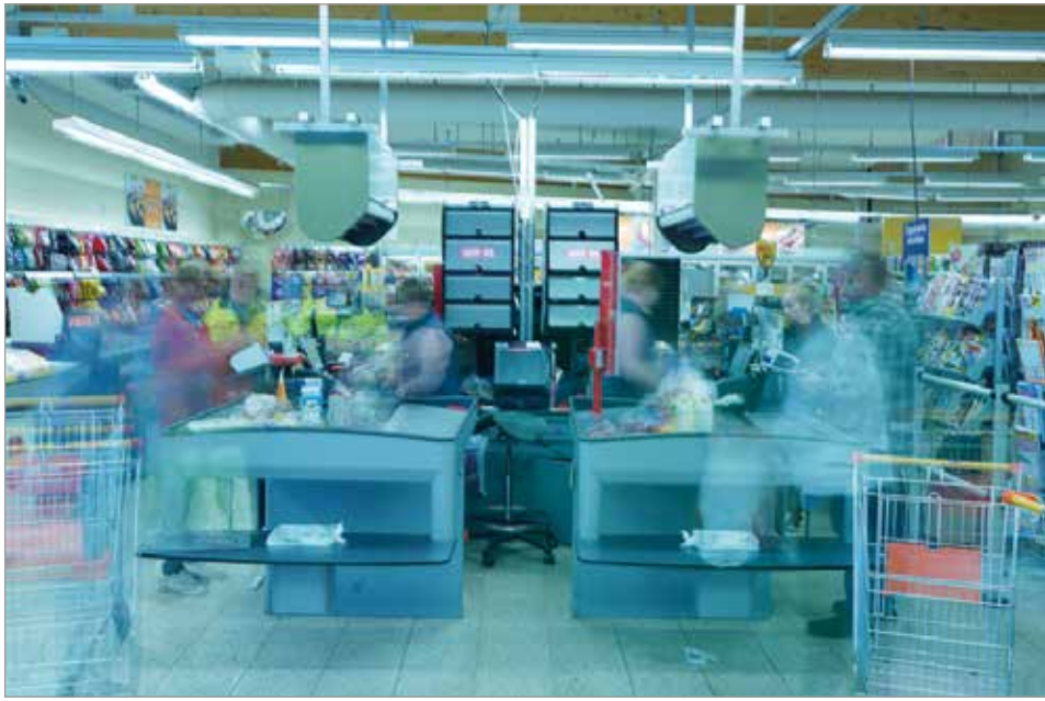
Vesa Rannan valokuva voittaneesta kuvasarjasta