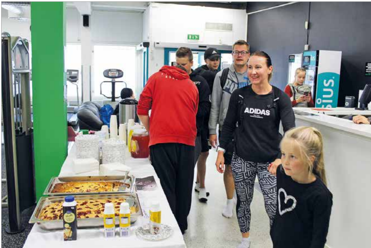
Avajaispäivänä salia kävi ihastelemassa satoja kuntalaisia.