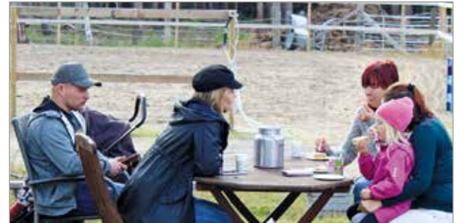
Laidunkierroksen jälkeen kesäkahvilan herkut maistuivat.