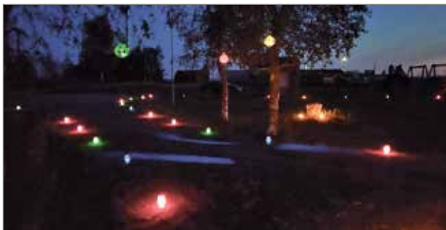
Pookin kesä päättyi venetsialaisiin elokuun viimeinen päivä.

-Osan tavaroista jätän valmiiksi Pookiin, hän nauhraa. MTR