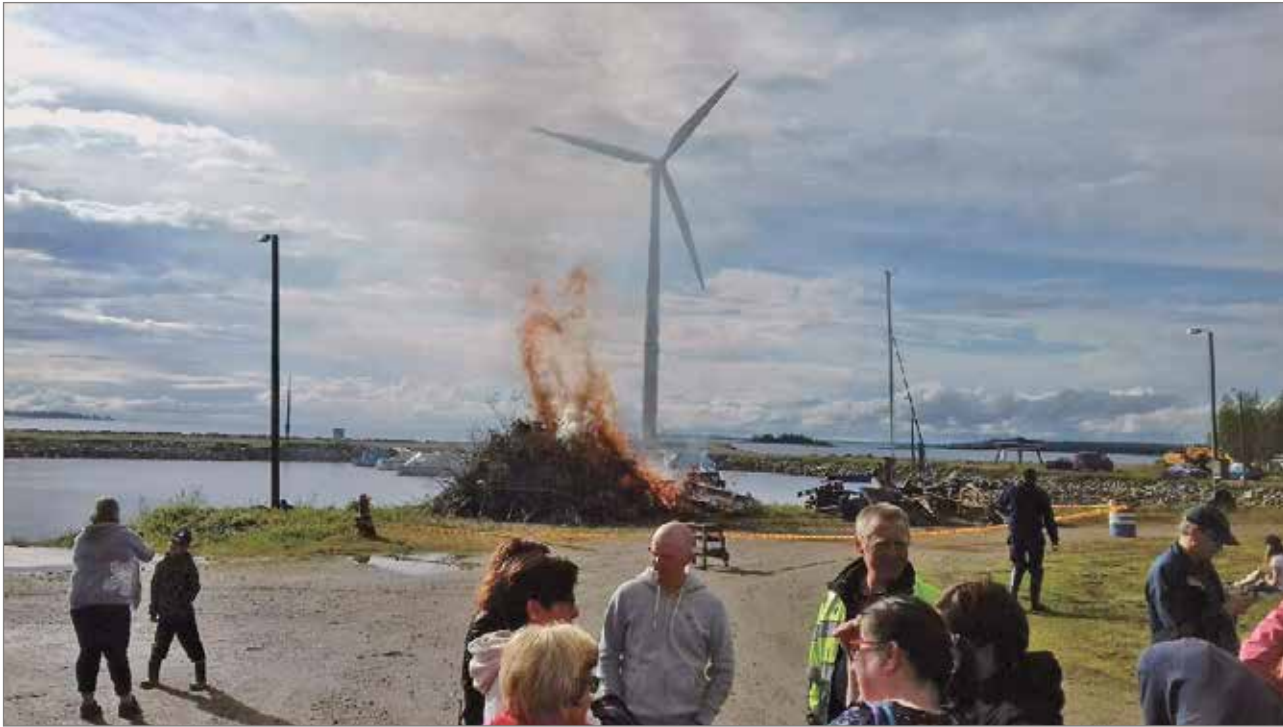
Juhannusta juhliittiin Vatungissa perheittäin.