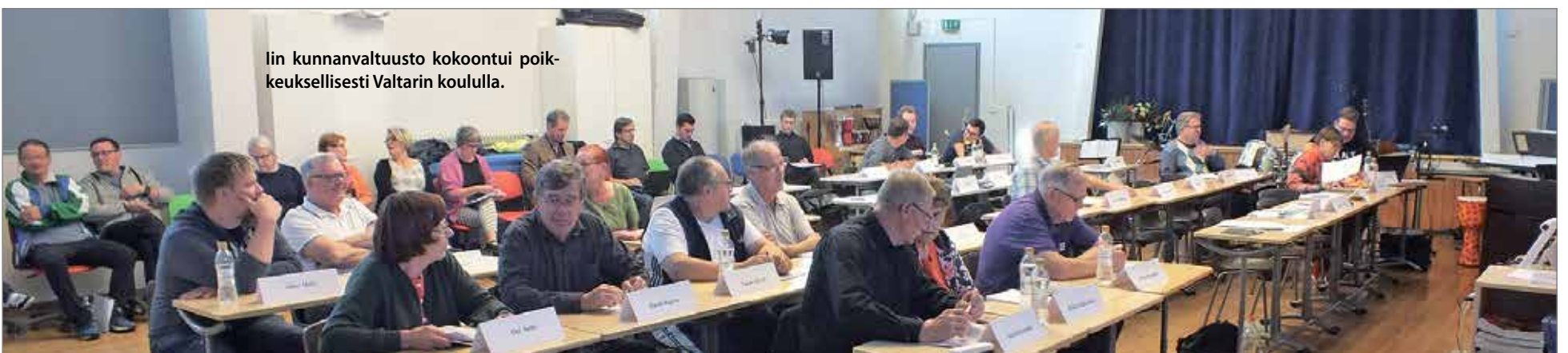
Iin kunnanvaltuusto kokoontui poikkeuksellisesti Valtarin koululla.