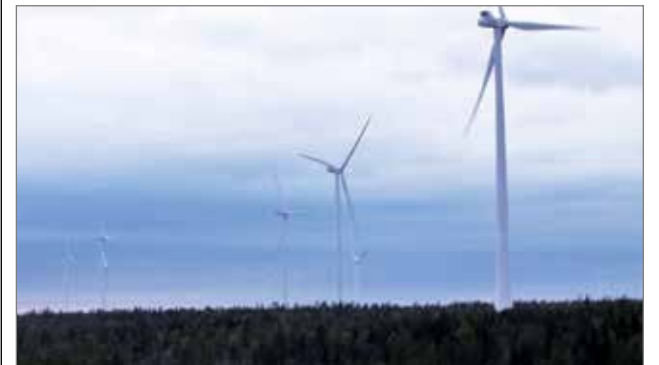
Maailman nollapäiväpäästöpäivänä tavoitteena on antaa maapallolle vapaapäivä fossiilisten polttoaineiden käytöstä ja kiinnittää huomiota omien valintojemme aiheuttamiin ilmastovaikutuksiin.

Nollapäästöpäivän iltana Iisisti Energinen -hanke tarjoaa kuntalaisille ilmaisen elokuvaillan Nätteporin auditoriossa klo 18. Dokumenttelokuvassa kuljetaan pienten keltaisten kumi-saappaiden mukana tulevaisuuden rantamaisemiin ja pohditaan, minkälaisen perinnön jätämme ihmisille, jotka tulevat meidän jälkeemme. Elokuvasa on suomenkielinen tekstitys. Elokuvaillasta lisätietoa osoitteessa: ii.fi/kalenteri . MTR