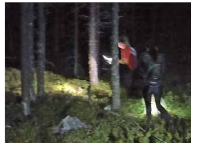
Otsalamppujen valokeilat valaisevat maastoa naisten lähtiessä metsään.

OLHAVAN OSAKILPAILUN TULOKSET A-PITKÄ 1 5.7 KM (Lähti: 5, Keskeytti: 0, Hylätty: 2) 1. Mika Seppänen 1.00.31. 2. Olli Nikkari 1.14.00 +13.29 3. Esa Hietala 1.21.43 +21.12 Hyl Nissi Markus Hylätty Hyl Erkki Isokoski Hylätty A-PITKÄ 2 5.7 KM (Lähti: 3, Keskeytti: 0, Hylätty: 1) 1. Sami Härkönen 57.29 2. Mika Säkkinen 1.26.34 +29.05