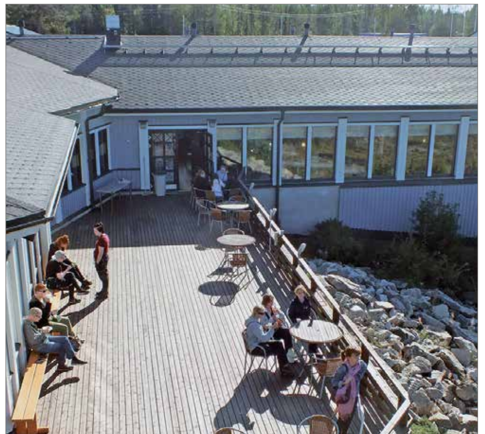
Tänä vuonna ulkoterasseille on käyttöä ruska-aikanakin.