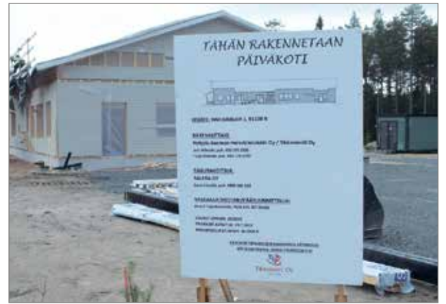
Päiväkoti Harjuntähti sijaitsee keskeisellä paikalla Harjungkujalla.