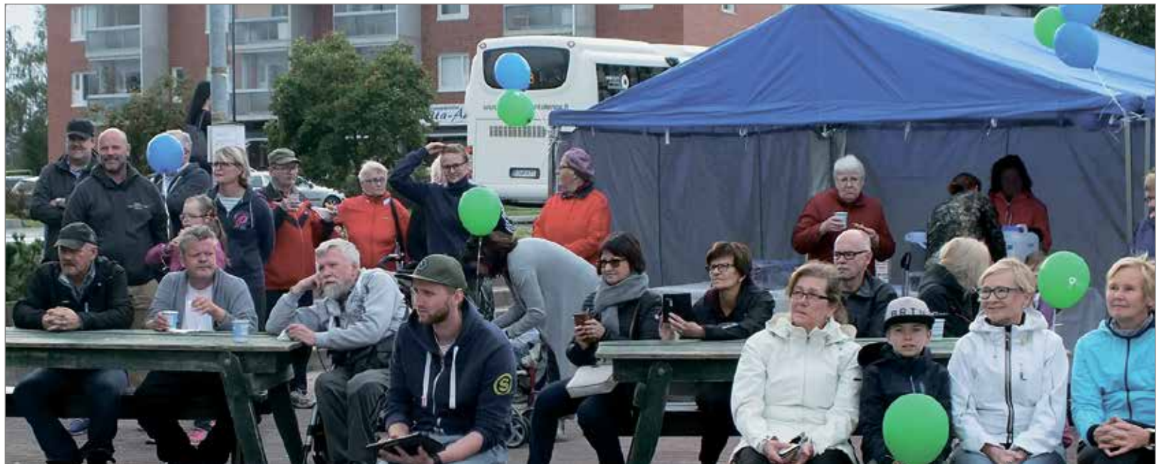
Yrittäjäpäivän toriyleisö sai nauttia kahvista ja hyvästä musiikista