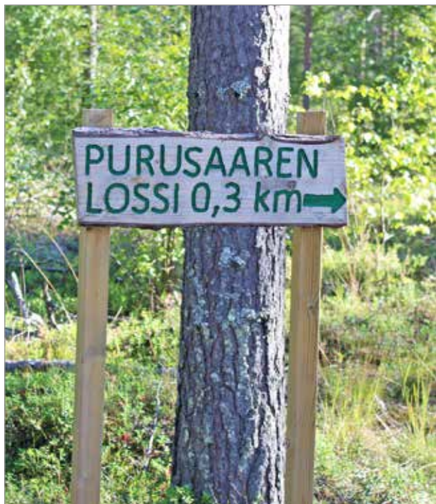
Purusaari on helppo saavuttaa ja autolla pääsee lähes lauttarantaan. Saaresta löytyy laavu ja sen ympäristössä on hyvät lenkkeilymaastot.

Jakkukylän riippusilta on muodostunut Iin suosituimmaksi turistikohteeksi. Kesän aikana sillaan on käynyt tutustumassa noin 10 000