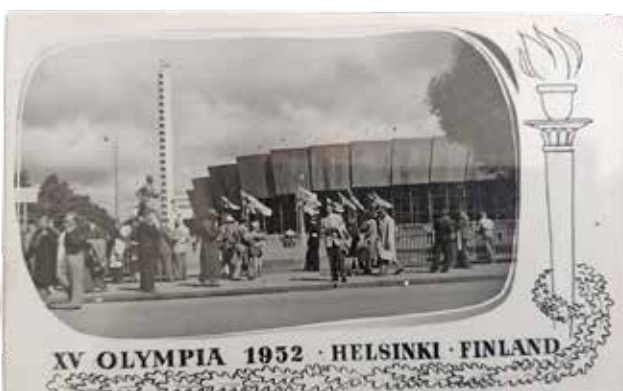
Helsingin vuoden 1952 kesäolympialaisten postikortti.

liin erityisesti avajaisistaan, missä juoksijalegenda Paa- vo Nurmi syytti olympia- tulien. Helsinki oli alkujaan saanut järjestettäväkseen kesäolympialaiset 1940, jota kuitenkin peruttiin talvi- sodan takia. Sodan jälkeen Helsingille myönnettiin vuoden 1952 kesäolympia- laisten järjestäminen, jonka vuoksi tapahtumalle kymmenen vuotta aiemmin suunniteltuun logoon vaih- dettiin ainoastaan vuosiluku.