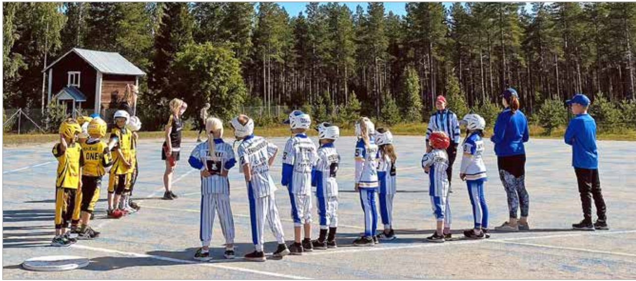
IiUn G-junnut aloittamassa turnauksen ensimmäistä peliä Lippoa vastaan.