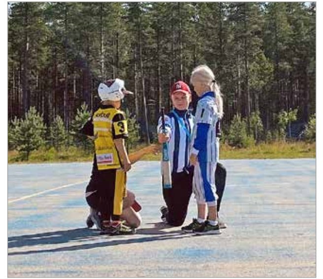
G-junioreiden tiukka hutunkeitto Lippoa vastaan.

Sunnuntai 24.7. oli monelle pienelle pesäpallolijalle odotettu päivä. Iin Urheilijat olivat järjestäneet Rysän pesäpallokentälle G-junnuille oman turnauksen, jossa pelattiin kahdella junnukentällä. Turnaukseen osallistui Iin oman joukkueen lisäksi Kempeleen Kiri, Oulun Lippo kahdella joukkueella sekä Pattijoen Urheilijat.