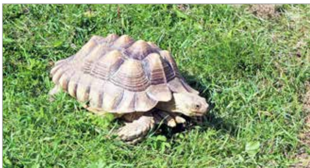
Arkadian jättiläiskilpikonnat painavat 10kiloa, mutta voivat kasvaa 90 kiloiseksi.