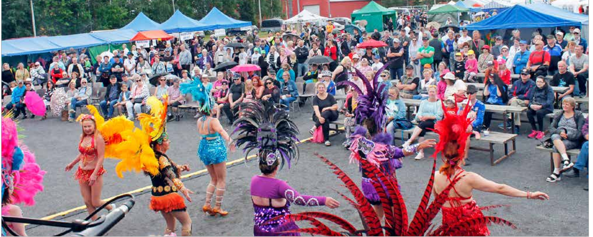
Samba-tytöt toivat lämpöä tapahtumaan, juuri kun muutama vesipisara yllätti Kesämarkkinat. Onneksi suuremmat sadekuurot pysyivät poissa.