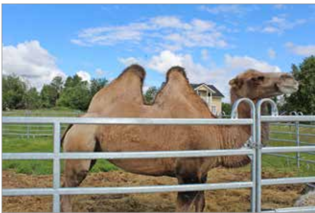
Kameli on yksi puiston eksoottisista eläimistä.

Simon Maksniemessä sijaitsevassa kotieläinpuisto Arkadiassa on tänä kesänä riittänyt vilskettä ja vilinää. Eläinpuisto on saanut uusia eksoottisia eläimiä ja kävijöitä on riittänyt ruuhkaksi asti.