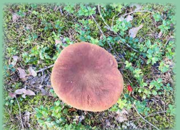
LUONNON OMAA LUOMUA.

lukijoiden palaute ja jutut: www.vkkmedia.fi