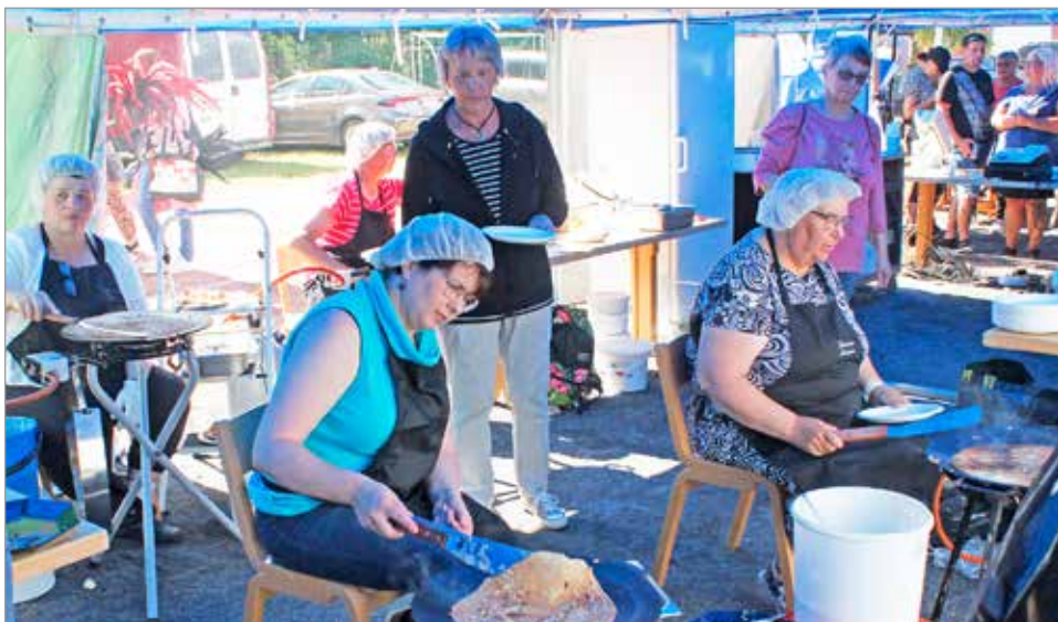
Kuivaniemen Nuorisoseuran lettukojulla pannut kuumina. Pitkistä jonoista päätellen lettukojut ja jäätelökauppias vetivät kesäpäivänä eniten kävijöitä.

Kahden vuoden tauon jälkeen Kuivaniemelle saatiin jälleen markkinatunnelmaa, kun lauantaina 16.7. Kuivaniemen kesämarkkinat järjestettiin Kuivaniemen urheilukentällä. Pääjärjestäjänä tapahtumassa oli Kuivaniemen Nuorisoseura.