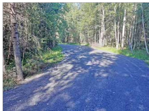
Illinsaaren yhden kilometrin kuntorata on saanut uuden kivituhkapiinnan.