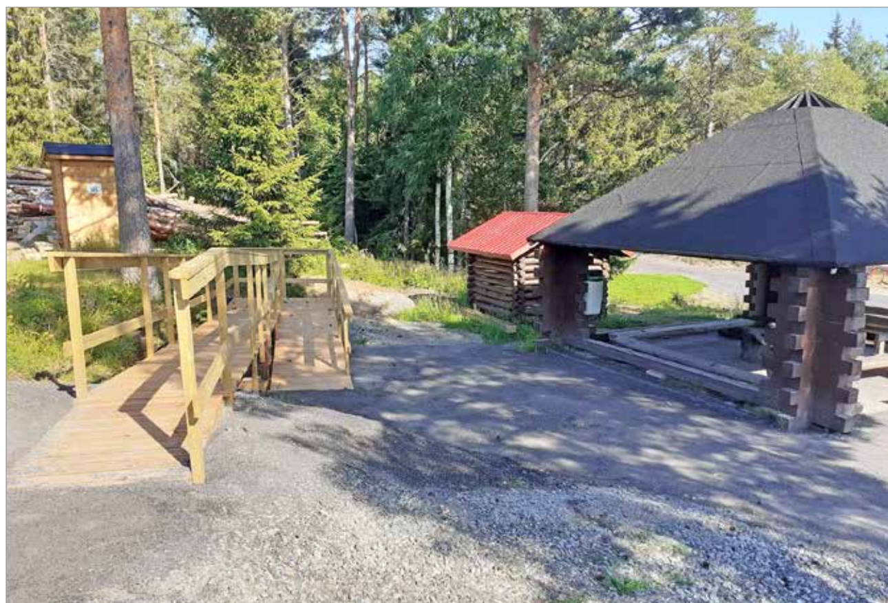
Hiihtomajan luona olevalle laavulle on liikuntaesteisten helppo saapua ramppia hyödyntäen.