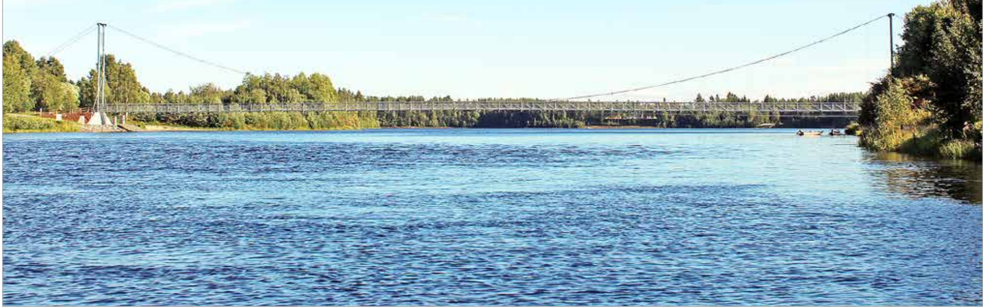
Pentti Lanton veneen kyytiin päässyt toimittaja sai kuvattua riippusillan uudesta kuvakulmasta. Kuva alajuoksulta päin otettu.