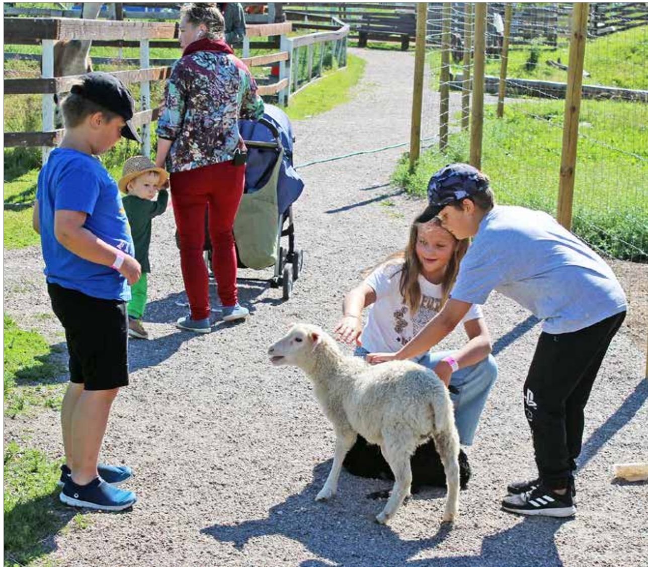
Lampaat ovat lasten kestopuosikkeja kotieläinpuistossa.

Suotuisien sääolojen lisäksi kävijämäärää ovat kasvattaneet uudet eläinlajit, kengurut etunenässä. Nämä