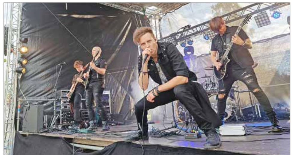
Kokkolalainen Everture yllätti Piippurockin yleisön energisellä lavameiningillä.