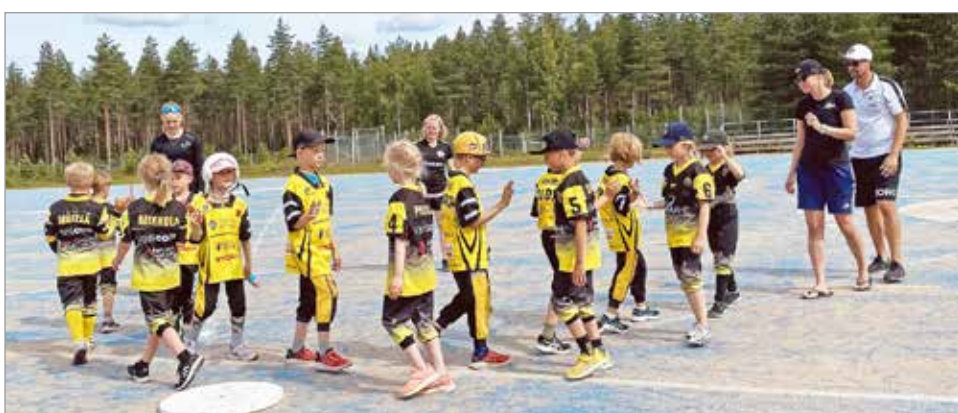
Iiläisten päivän viimeinen peli G-junnujen turnauksessa hävittiin niukasti yhden juoksun erolla Pattijolle.