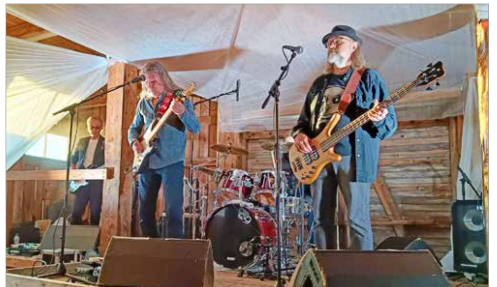
Paikallinen cover-yhtye Stinkfoot kuuluu Piippurockin vakiokalustoon, esiinnyttyään vuodesta 2014 lähtien joka kerta tapahtumassa.