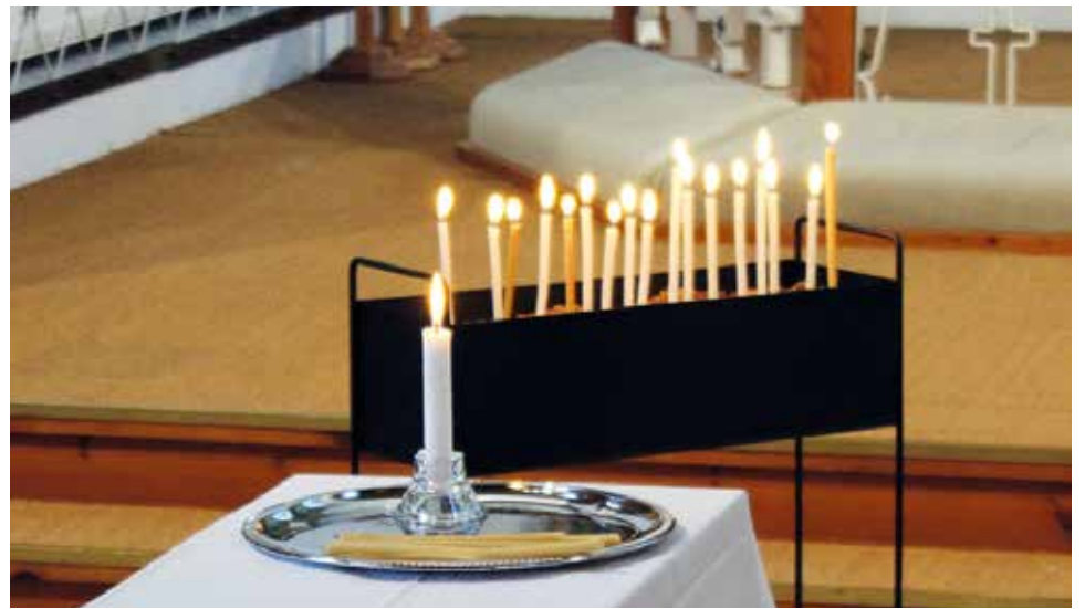
Hiljaisten rukousten kera tuodut kynttilät Iin kirkossa.

Nuorille tarjottiin ehtoollisen koronarajoitusten vuoksi siten että viiniin kastetun ehtoollisleivän jokin