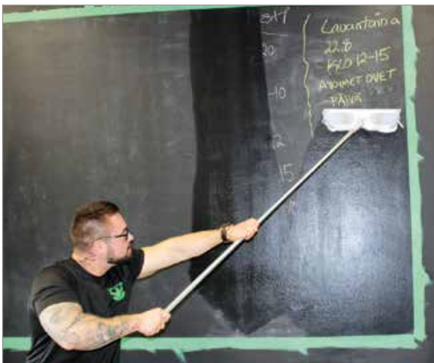
Liitutaalumaalilla seinälle saatiin tila tiedottaa ja opastaa salin asiakkaita. Edellisen viikon ohjelma saa väistyä uuden tieltä.

- Sopiva määrä stressiä pitää virkeystason kohdallaan ja saa minut toimimaan parhaiten, Alekski naurahdaa. MTR