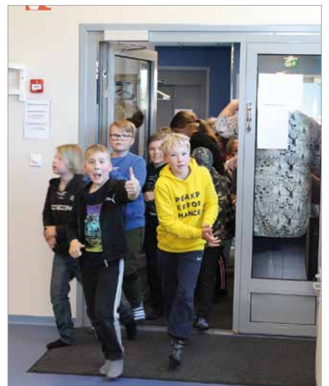
On tätä odotettukin kuului ovelta Iisi-areenan nuorisotilan avautuessa.