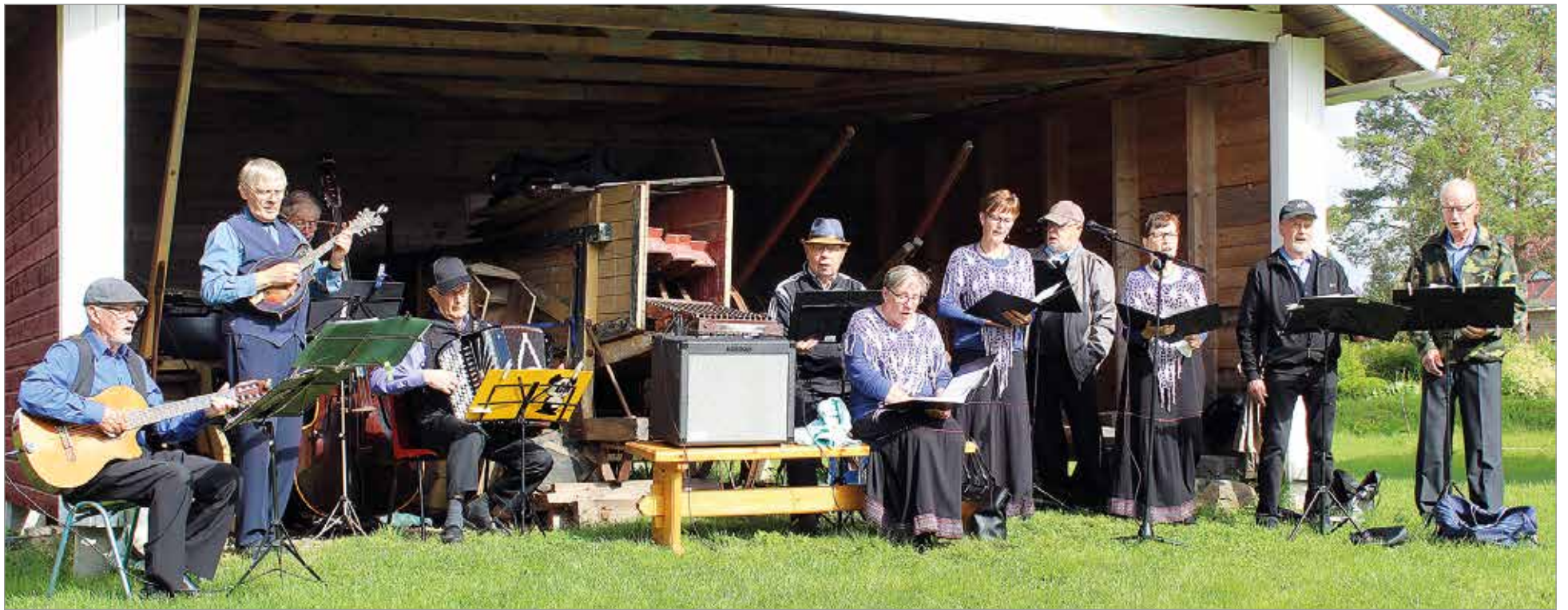
Kuivaniemen ja Simon Pelimannit laulattivat yhteislauluja ja esittivät muun muassa "Hyvästi kultaseni" matkallelähtölaulun parin sadan vuoden takaa.