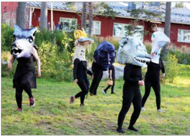
Mudwoman -naamioiteatteriesityksessä nähtiin upeita paperimassasta valmistettuja naamioita, joita esiintyjät hienosti hyödynsivät kerronnassa.