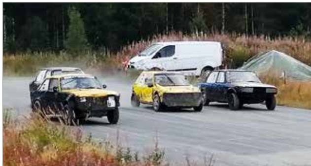
Jokkiksessa sora lentää ja taistelu on tiukkaa lähdistä maaliin.

JR Pohjanmaa Cup 2020 käsittää kuusi osakilpailua, joista Kuivaniemi oli kolmas. Kausi huipentuu Oulun Zonen osakilpailuun 10.10. Hyvissä olosuhteissa ajettu Kuivaniemen osakilpailu keräsi paikalle 89 autoa ja sora lensi tiukoissa taistoissa. Tulokset löytyvät: https://www.jokkisrace.net/phpBB3/viewtopic.php?p=511#p511 MTR