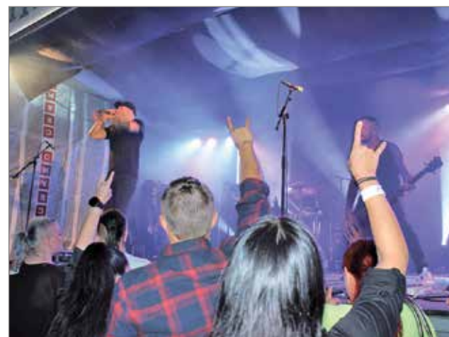
Sonic Syndicaten energinen esitys ei jättänyt yleisöä kylmäksi.