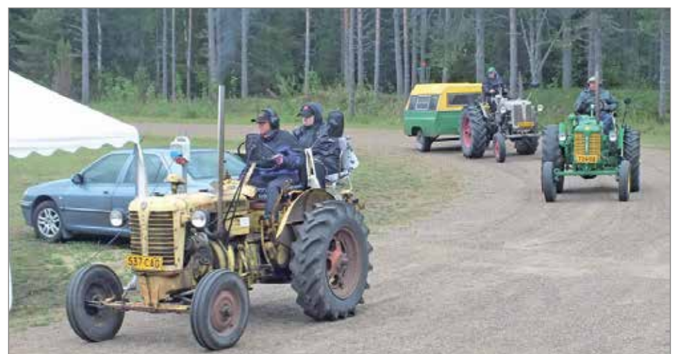
Zetorit suorittivat näyttävän paraatijon Olhavan Areenan ympäri.