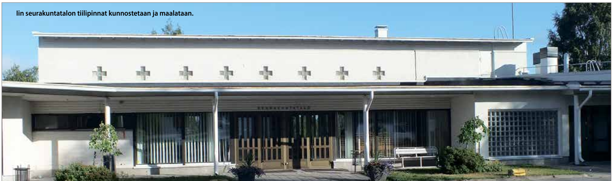
Iin seurakuntatalon tiilipinnat kunnostetaan ja maalataan.