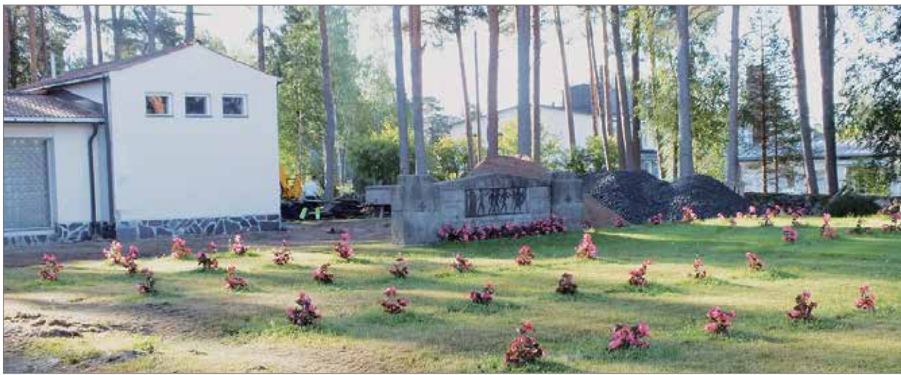
Sankarihaudat ja hautakivet kunnostetaan Iin kirkon piha-alueen kunnostuksen yhteydessä.