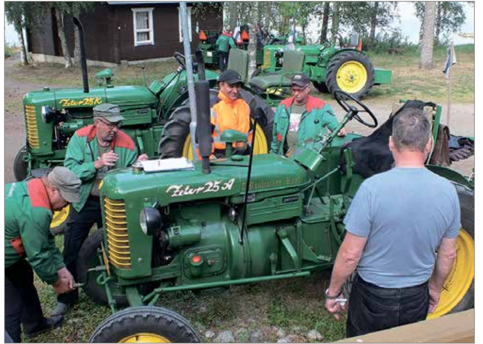
Yli 1000 kilometrin marssilla kalusto vaatii huoltoakin, kuten Merihelmessä matkan viimeisenä aamuna.