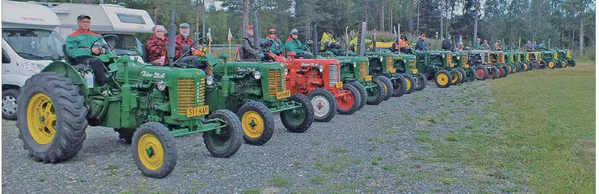
Ylläkseltä Raaheen matkanneet Zetorit pysähtyivät Olhava Arenalla.

Olhava Arenalla järjestetty kirpputoripäivä sai yllätysvieraita sununtaina 5.8. Ylläkseltä kohti Raahea matkanneet yhdeksäntoista Zetoria pysähtyivät ja suorittivat näyttävän paraatijon Olhava Arenalla.