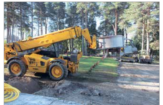
Pihaa kunnostettaessa Iin kirkon ympärillä liikkuu suuria työkohteita.