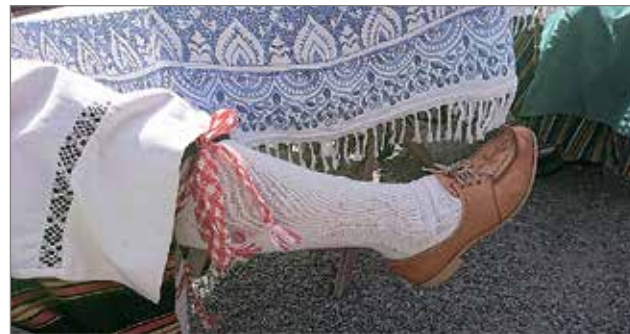
Kansallispuvuissa riittää pieniä yksityiskohtia!