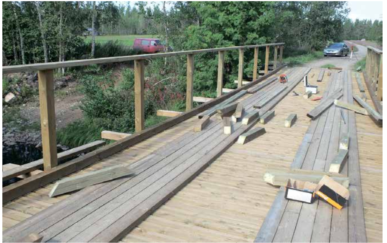
Vanhalantien silta on saanut uudet kansirakenteet kaiteineen.