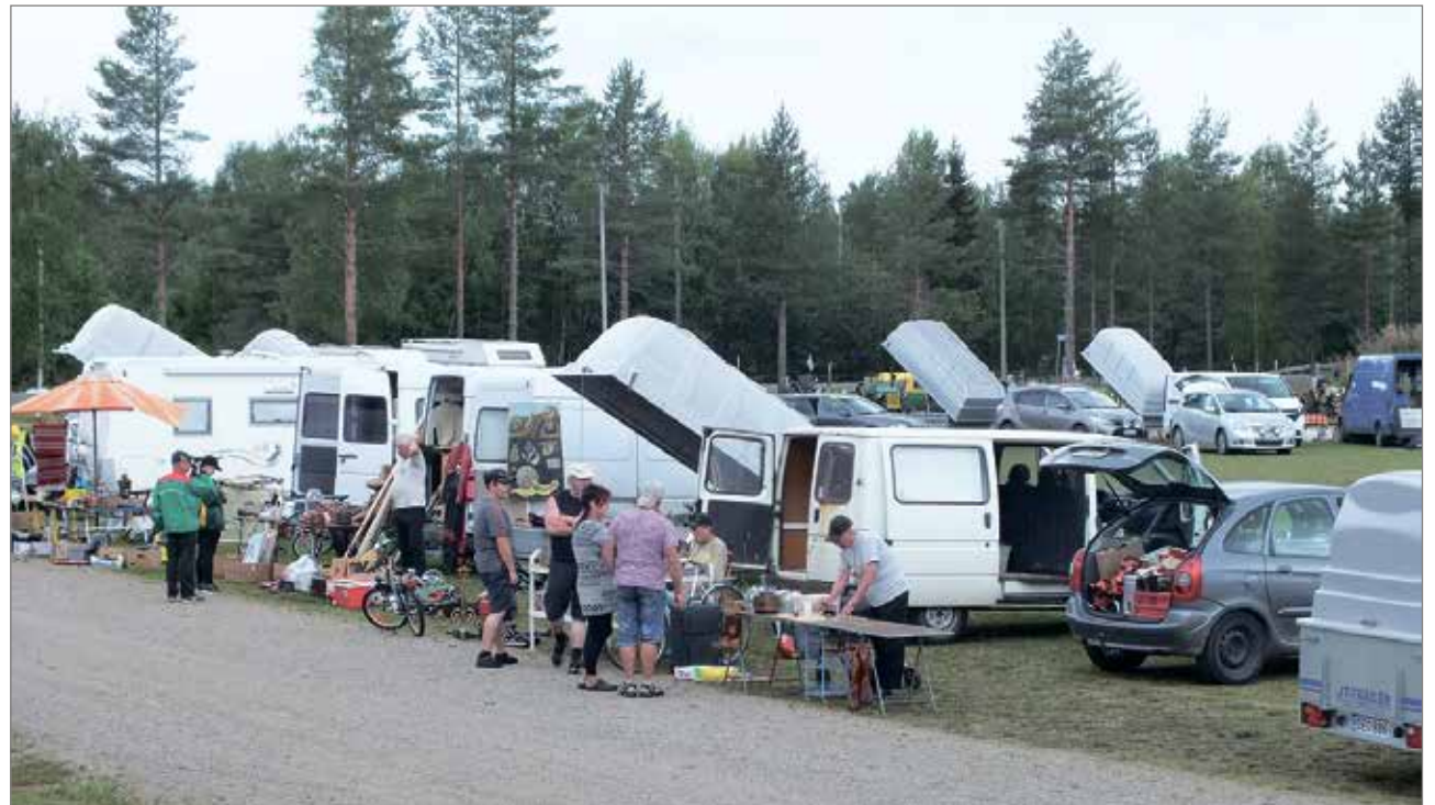
Olhavan Kirpputoripäivät ovat keränneet runsaasti sekä myyjiä, että ostajia. Tälläkin kertaa Areena oli täynnä myyjien peräkärryjä ja kauppa kävi päivän mittaan vilkkaana.