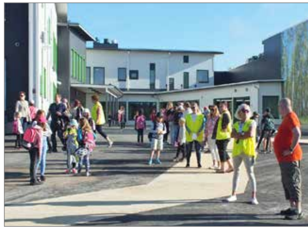
Haminan koulussa on turvallista opiskella. Ensimmäisenä koulupäivänä pihalla oli kymmenen ohjaajaa opastamassa ja ohjaamassa.