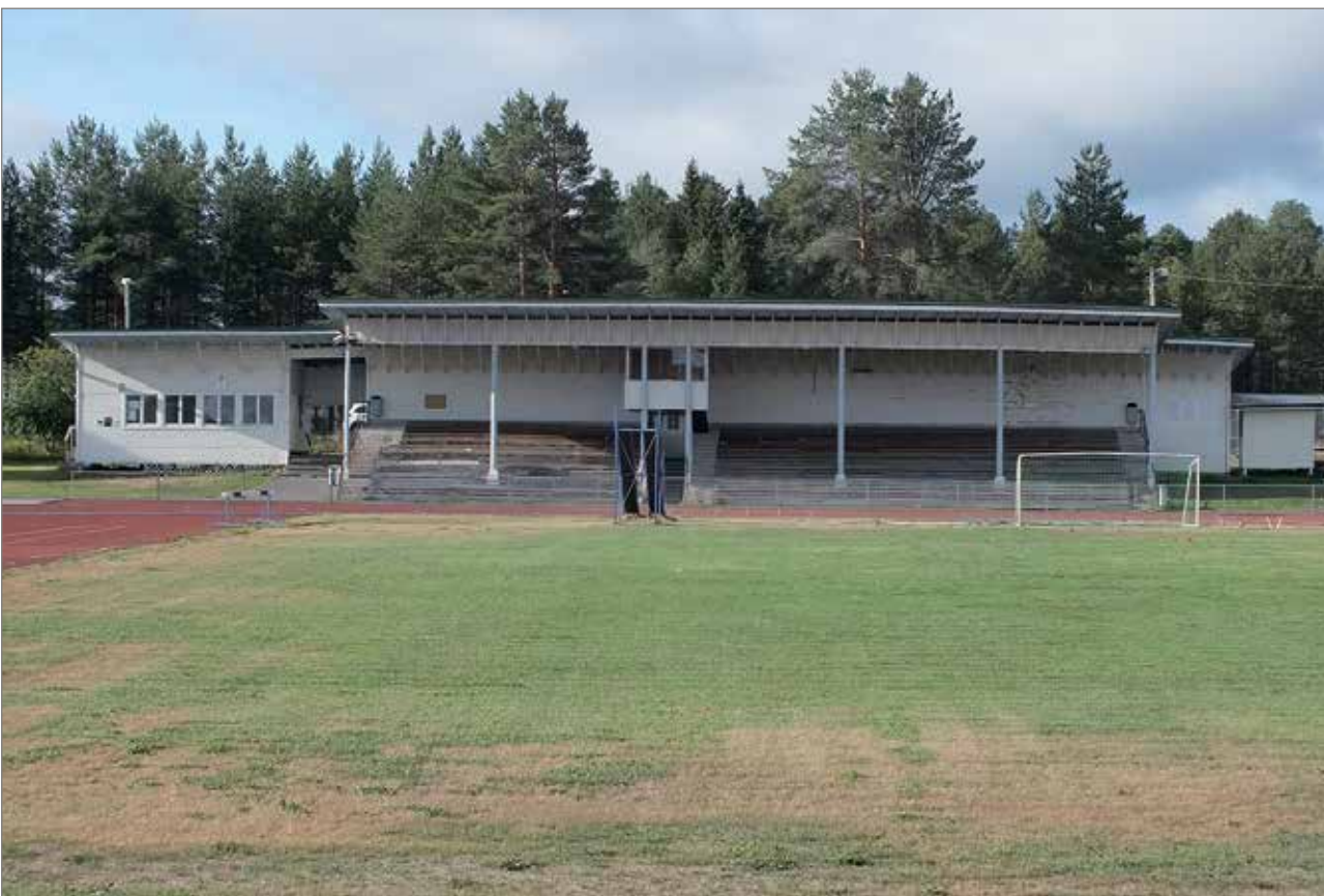
Iin keskusurheilukentän katsomorakennus väistyy liikuntahallin tieltä. Rakennus on vuodelta 1956.

Toimittaja on juttua tehdessään hyödyntänyt Pertti Huovisen kotiarkistoa. MTR