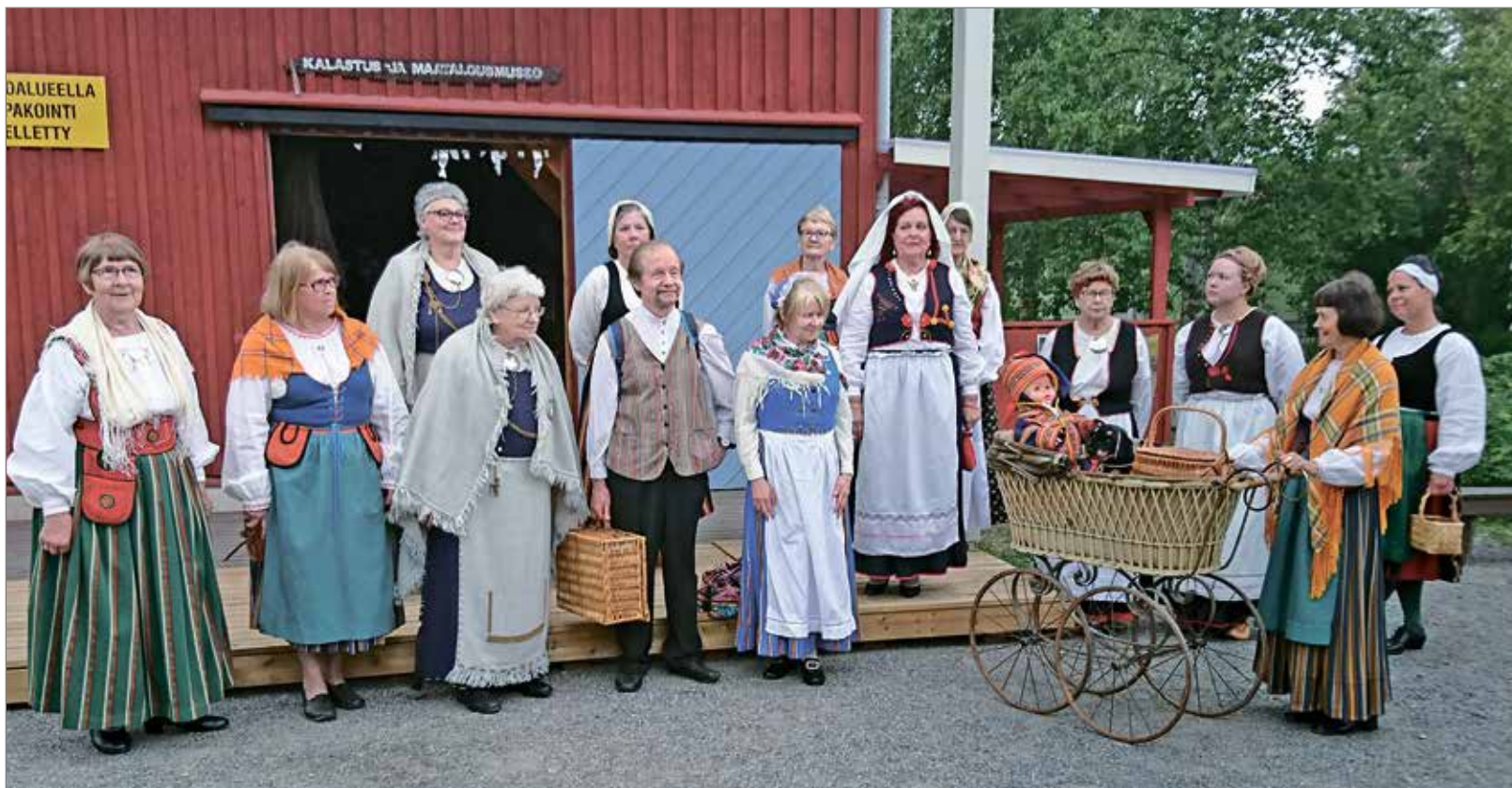
Kansallispuukuisten komea joukko Iin kotiseutumuseon edessä.