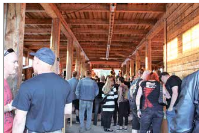
Navettalavalla on tunnelmaa, esiintymässä Stinkfoot.

-Ensi vuonna tullaan varmasti uudestaan, he toteavat lähes yhdestä suusta. RT