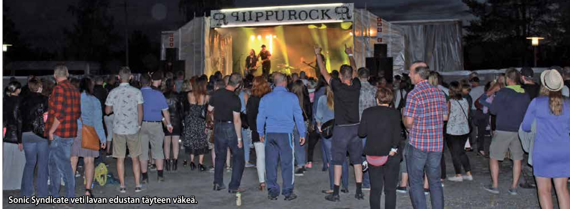
Sonic Syndicate veti lavan edustan täyteen väkeä.