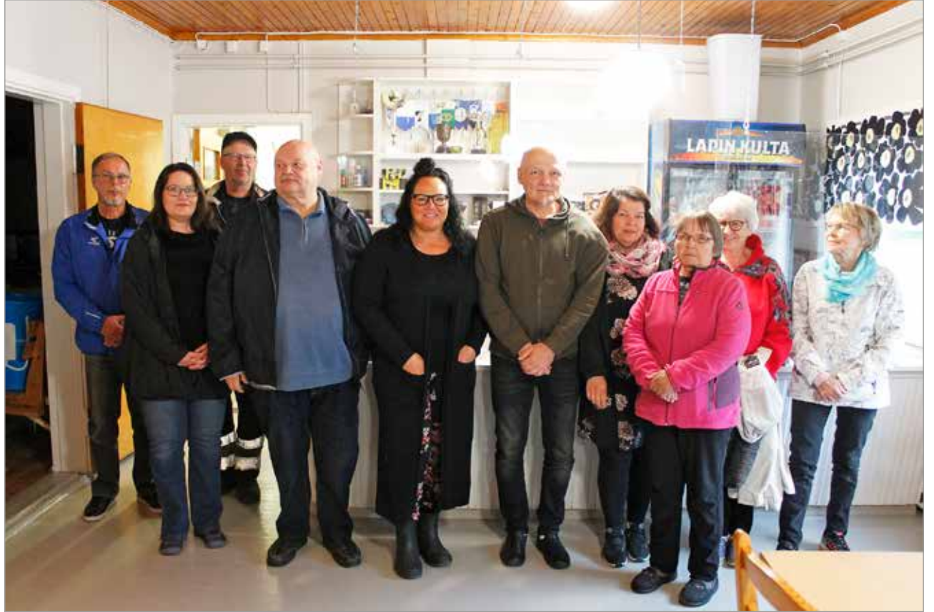
Positiivinen markkinahenki on vallannut kyläläiset Kuivaniemellä: talkoolaisia Kuivaniemen nuorisoseuran talolla suunnittelemassa Kuivaniemen markkinoita 16.6.

Kuivaniemen pitäjämarkkinat oli yksi alueen vetovoimaisimmista tapahtumista, jonka järjestämisestä vastasi pitkään Kuivaniemen Yrittäjät ry yhdessä Iin kun-