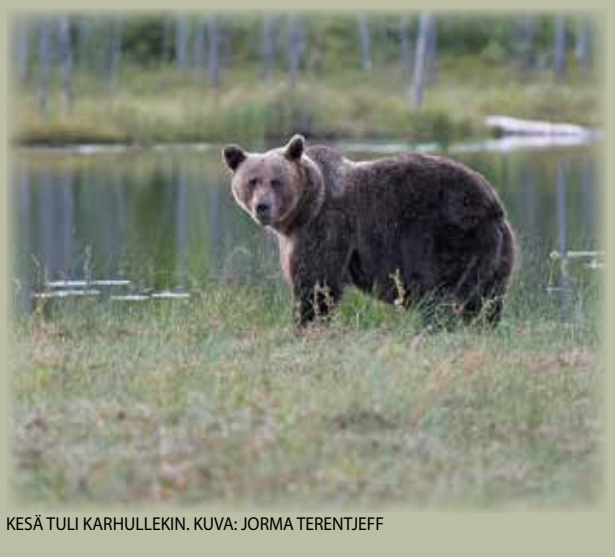
KESÄ TULI KARHULLEKIN.

lukijoiden palaute ja jutut: vkkmedia@vkkmedia.fi