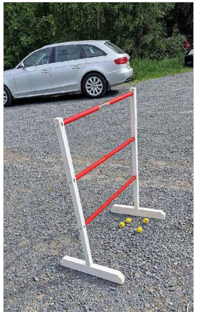
Rimagolf on hauska ja vaativa laji.