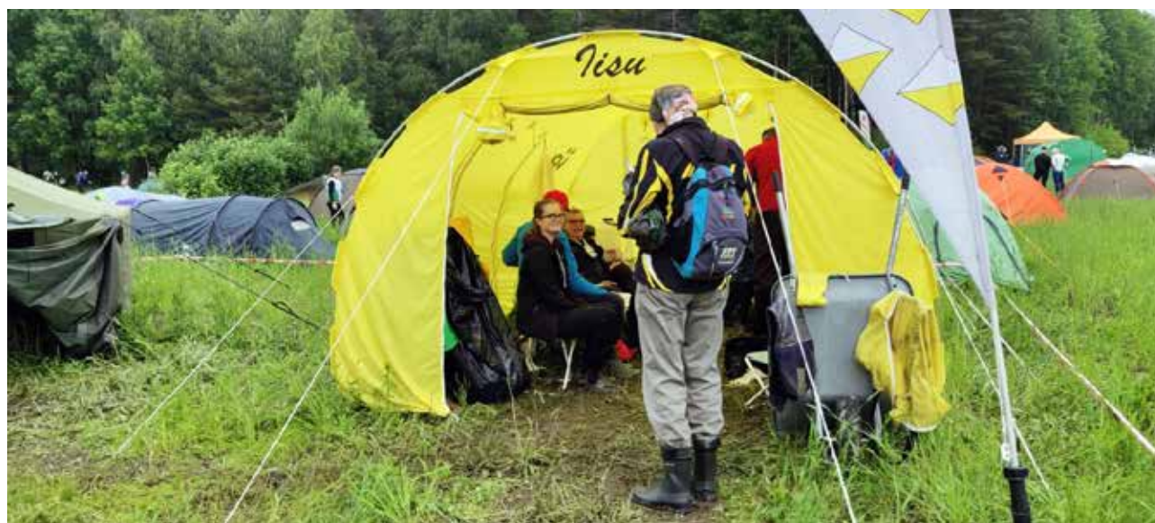
Seurateltalla valmistaudutaan kisaan ja vaihdetaan kuulumisia.