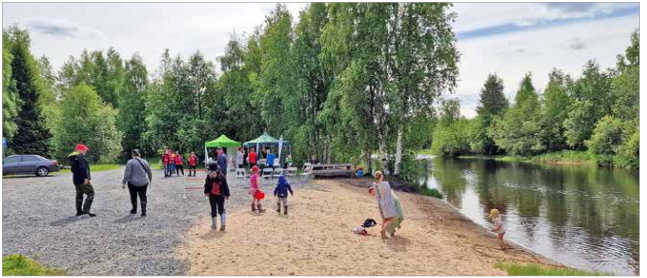
Luonnonlaidunpäivänä Navettarannassa riitti vipinää.