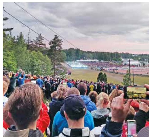
Jukolan viestin lähtö on näyttävä, otsalamppujen valaistessa pimeää iltaa.