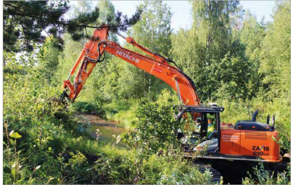
Kaivinkoneella poistetaan kosken kasvaneita pusikoita ja siirrellään kiviä ohjaamaan vedenvirtauksia. Lisäksi joenpohjaan laitetaan kutusoraa, sekä tarvittaessa kuusipuita.

Iin kunta toteuttaa kesän 2020 aikana kaksi kalataloudellista kunnostushanketta. Lapin ELY-keskus on myöntänyt avustusta kalataloudellisten toimenpiteiden toteuttamiseen sekä Kuivajoen ja Olhavanjoella.