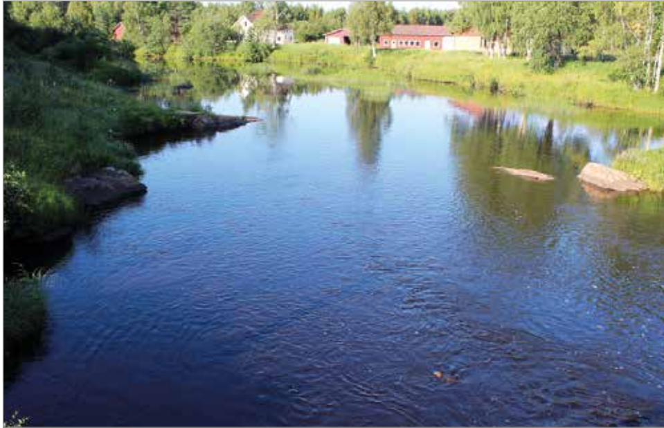
Tuliaronkosken yläpuolella sijaitsee leveä Tuliaronsvanto.