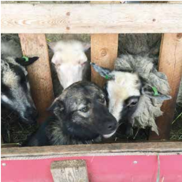
Kallion Lammas tuo alueelle lampaitaan ilahduttamaan markkinavieraita.

- Korona aiheuttaa järjestäjille edelleen lisätöitä ja markkinavieraiden tulee muistaa turvavälit, sekä hygieniaohteet, runsasta osanottoa markkinoille toivova Ikonen toteaa. MTR