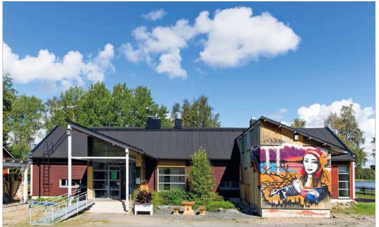
Hankkeeseen rekrytoitavan projektipäällikön työpaikka sijaitsee Iin Taidekeskus KulttuuriKauppilassa. Kuva Antti J. Leinonen.