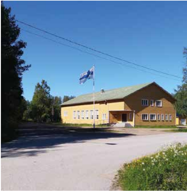
Nuorisoseuran markkinat järjestetään seurantalolla ja piha-alueella.