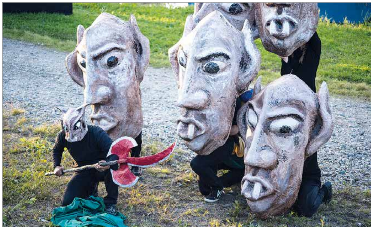
Teatterin teossa käytetään isoja paperimassanaamioita, joita on nähty Iissä aikaisempinakin kesinä.