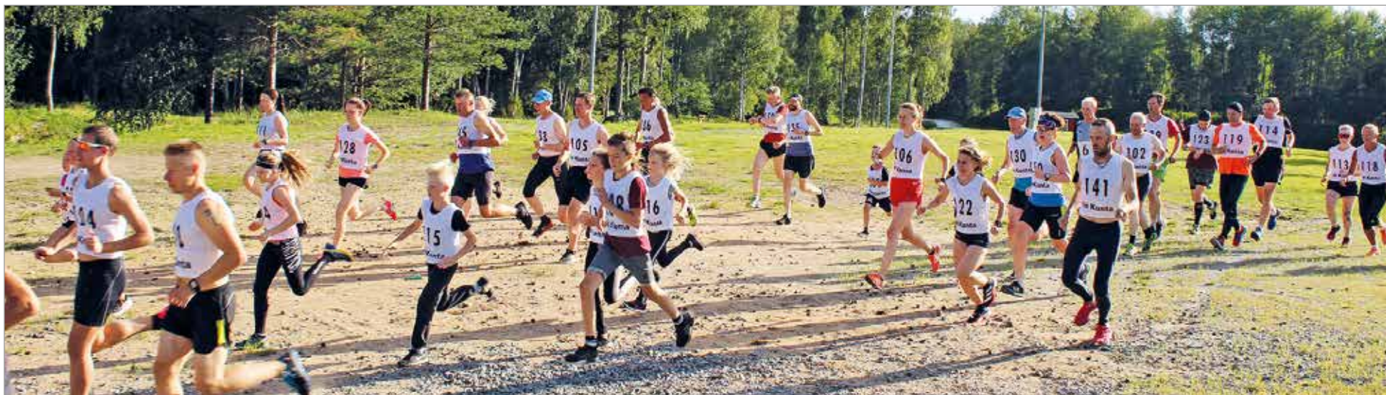
Illinjuoksussa kaiken ikäiset lähtevät sulassa sovussa matkaan.