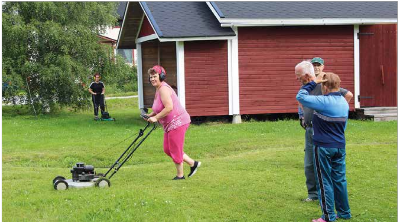
Pihatalkoissa naisenergia on valttia.