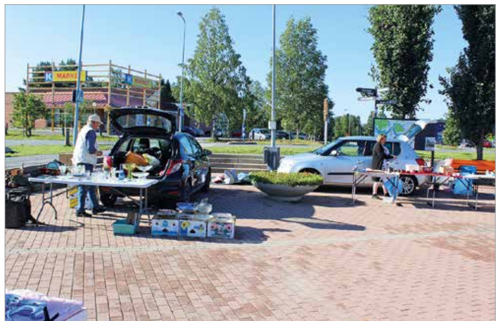
Myyjät olivat korona-aikaan sopivasti levittäytyneet eri puolille laajaa toria.