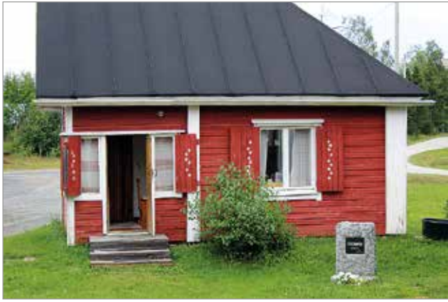
Ollikaisen talo kunnostettiin 2006-2007.