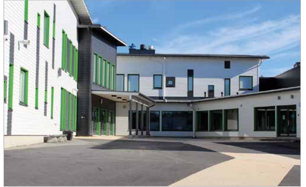
Haminan koulussa opiskelee alkavana lukuvuonna ennätyselliset 485 oppilasta.

nopeutemme sen mukaan, Jokela painottaa aikuisten vastuuta. MTR