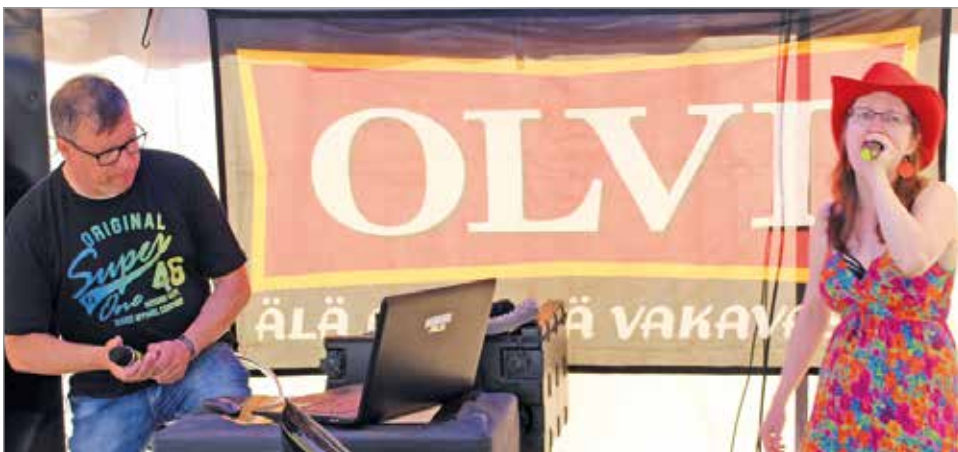
Kuivaniemen Yrittäjien teltalla laulettiin karaokea.