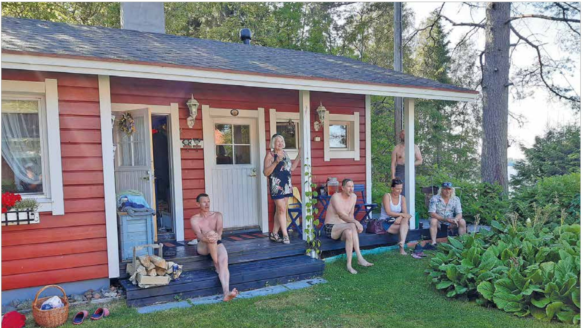
Leppisaaren leppoinen löyly sai Saunapäivänä vieraita mantereelta.