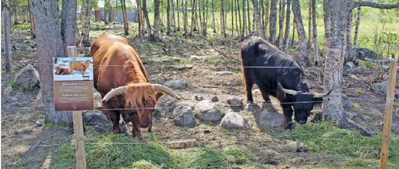
Kotieläinpuisto Arkadiassa voi tutustua Ylämaankarjaan.