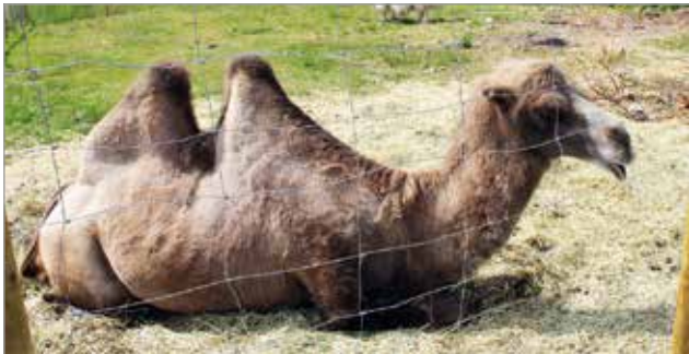
Kameli edustaa puiston eksoottisimpia eläimiä.