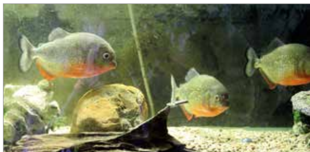
Myös erilaisia kaloja löytyy.

Kotieläinpuiston porot käyskentelevät kesällä lähinnä talvikäytössä olevan kodan lähetyvillä. Yleisöllä on mahdollisuus tutustua poroihin ja nähdä pari viikkoa sitten syntynyt vasakin. Toimittajan kotieläinpuisto Arkadia yllätti iloisesti monipuolisuudellaan, osoittautuen oivaksi kohteeksi lähimatkailuun. MTR