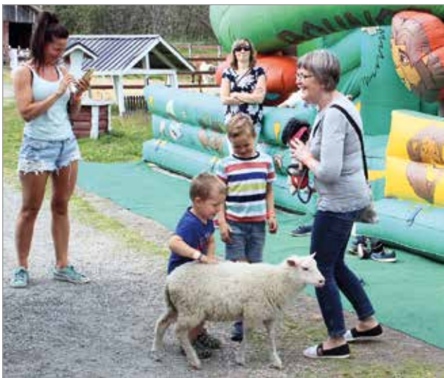
Kotieläinpuistossa viihdytään koko perheellä.