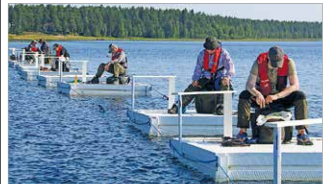
Kesäpilikin MM-kisassa pilkkiminen tapahtuu styroksilauttaan tehdyn reiän kautta. Kilpailussa pilkitään kolme tuntia.