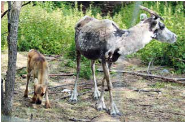
Pari viikkoinen poronvasa pysyttelee emän suojissa.