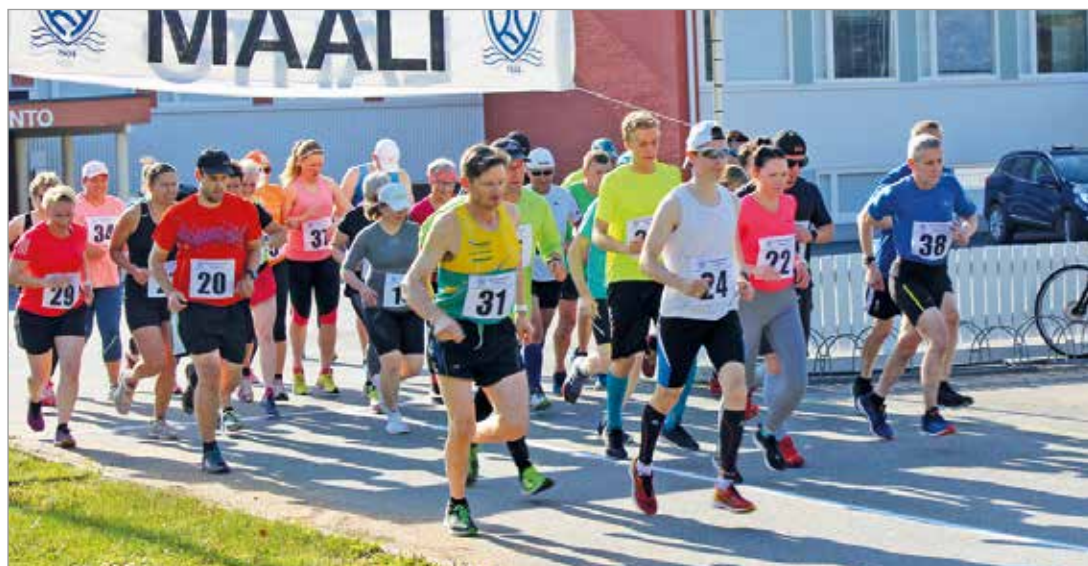
Kuivaniemen Yrityksen perinteinen markkinahölkä juostiin hyvässä olosuhteissa.