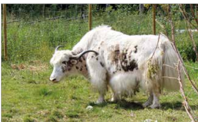
Jakki on myös harvemmin nähty eksoottinen nautaeläin.