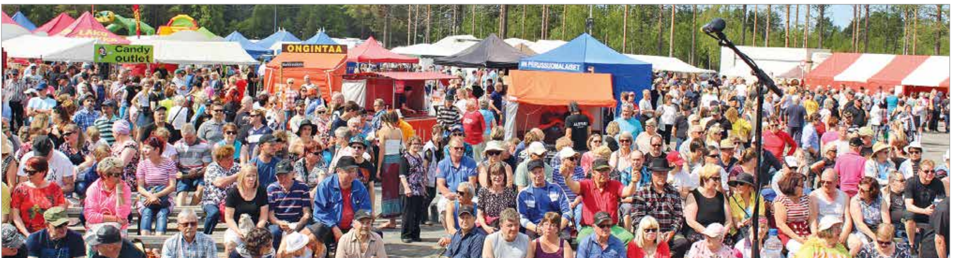
Markkinoilla kävi runsaasti yleisöä, joka kokoontui esitysten aikaan lavan lähetyville.