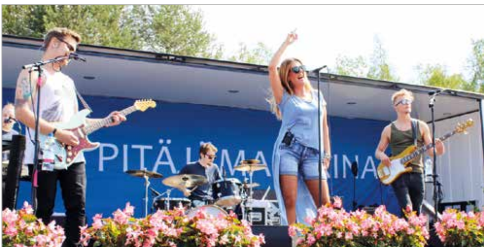
Lauantain pääesiintyjä Eini sai kansan laulamaan ja liikkumaan.