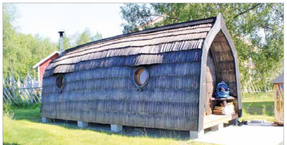
VillaKauppilan päresaunassa riitti saunoja koko päiväksi.