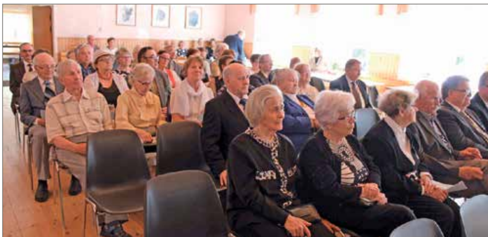
Kuivaniemen nuorisoseurantalotäyttyi juhlayleisöstä.