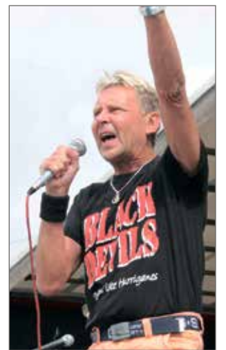
Matti Nykänen esiintyi energisesti.