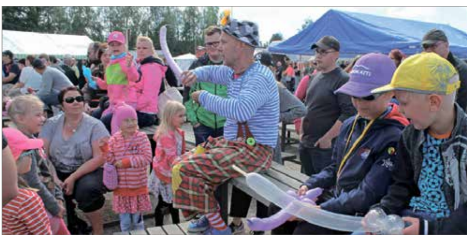
Teatteri Kolme Korppia teki lapsille ilmapalloja.