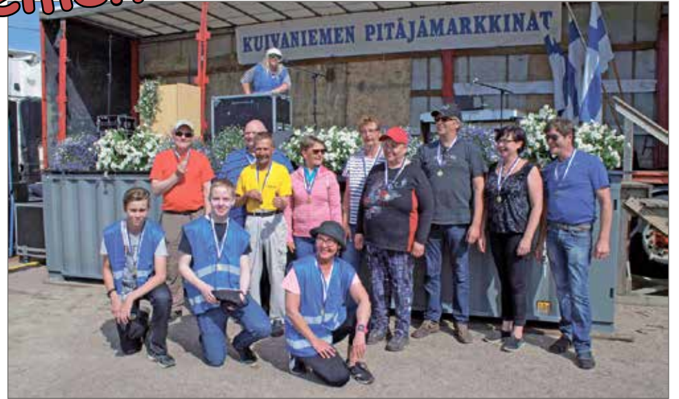
Sokkoämpärikisaan osallistuneet joukkueet palkittiin mitaleilla.

- Jospa ostaisin täältä metrilakua. Tietysti katson Mat-