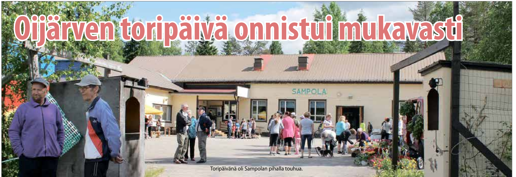
Toripäivänä oli Sampolan pihalla touhua.