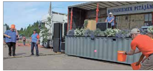
Sokkoämpäripallo on vaativa laji. Tässä Kuivaniemen Palleroiden taidonnäyte.