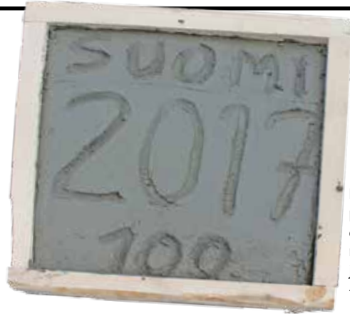
Karhun sillan peruskiveen on kaiverrettu rakennusvuosi ja "Suomi 100" -maininta.