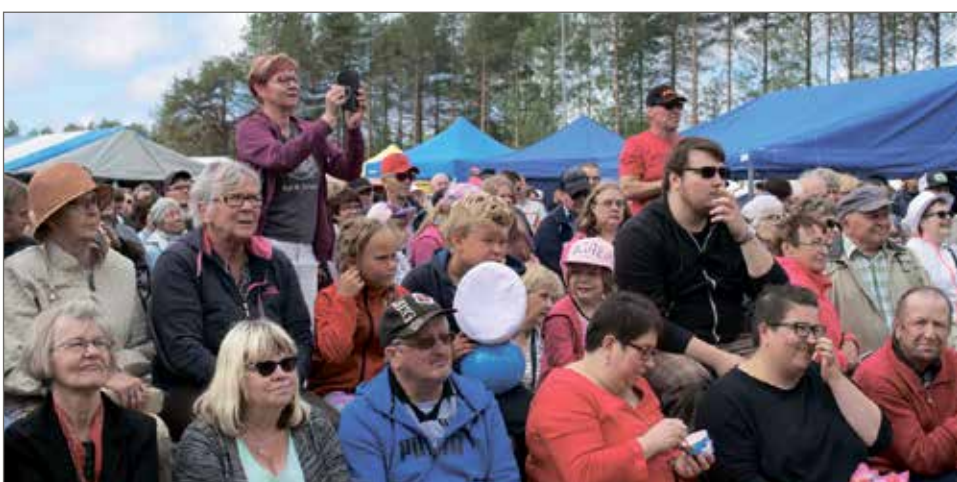
Matti Nykänen keräsi markkinoille ennätysyleisön.