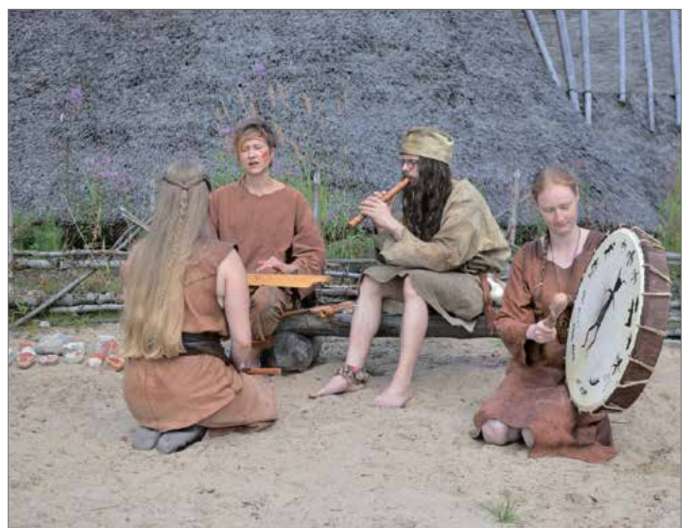
Muinaismarkkinoilla on luvassa muinaismusiikkiesityksiä.