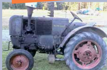
Esillä: BM-10 vm. 1949

Vanhat traktorit, mopedit, maamoottorit, nostalgiset autot, näyttelyt, perinnevaatteet jne.