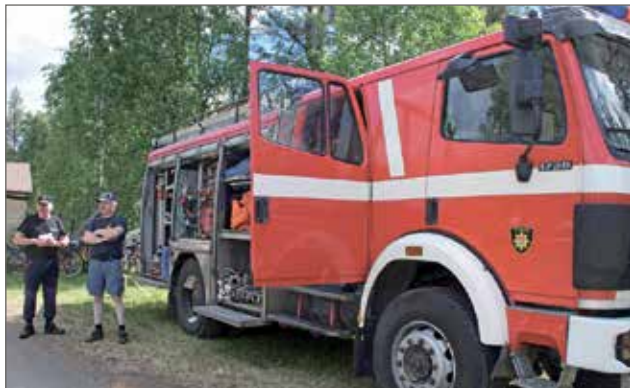
Oijärven VPK esitteli kalustoa. Auton vieressä ovat Tapio Hirvansieni (vas.) ja Seppo Tuohino.