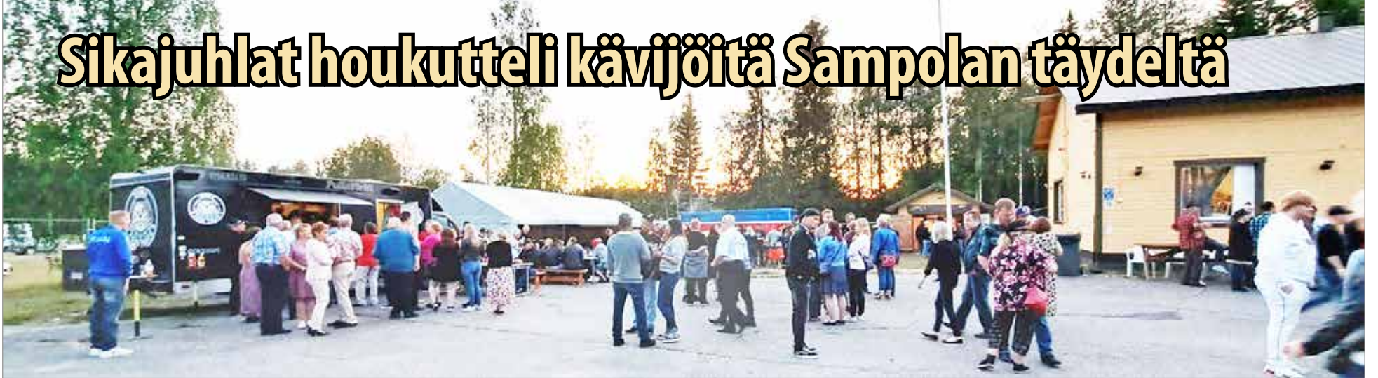
Sää suosi Oijärven Sampolan Sikajuhlia ja piha-alueella väki sai nauttia karaokesta sekä Terwa Foodtruckin possuburgereista.

Oijärven Nuorisoseuran 95-vuotisjuhlatanssit ja samalla perinteiset Sikajuhlat järjestettiin heinäkuun alussa lauantaina 8.7. Tanssittajana oli Suomen iskelmätaivaan eturivin artisti Saija Tuupanen ja eXmiehet-orkesteri, jota saapui seuraamaan noin 650 asiakasta.