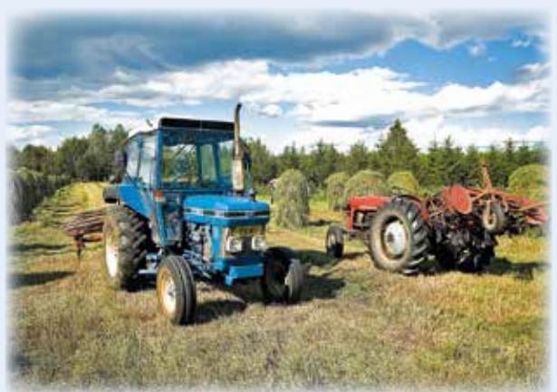
"SADE ON HYVÄKSI MEIDÄN PERUNOILLEMME JA NAAPURIN HEINILLE!"

lukijoiden palaute ja jutut: vkkmedia@vkkmedia.fi