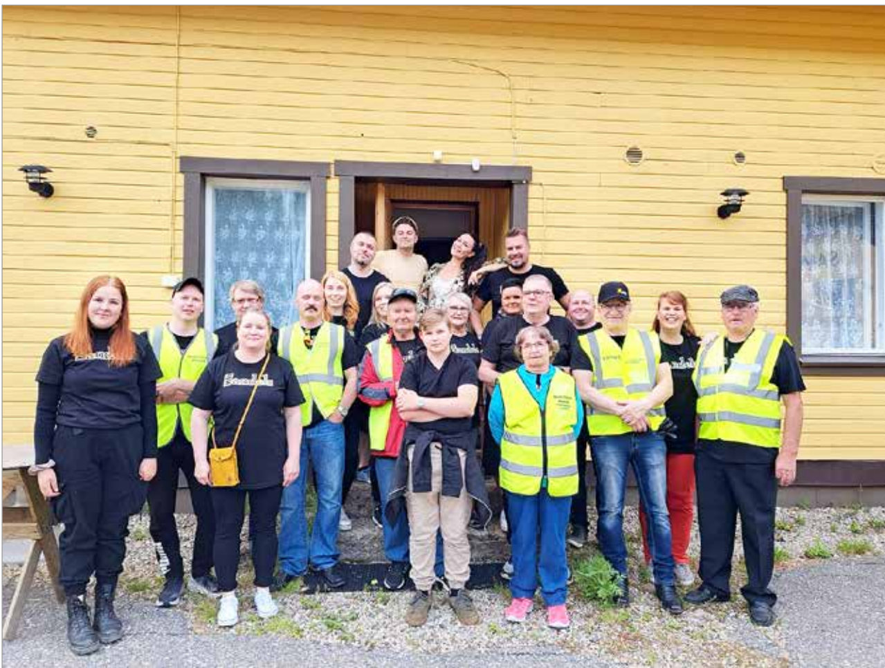
Onnistuneiden Sikajuhlien takana on aktiivinen ja reipas talkooporukka. Kiitokset panoksesta kaikille!