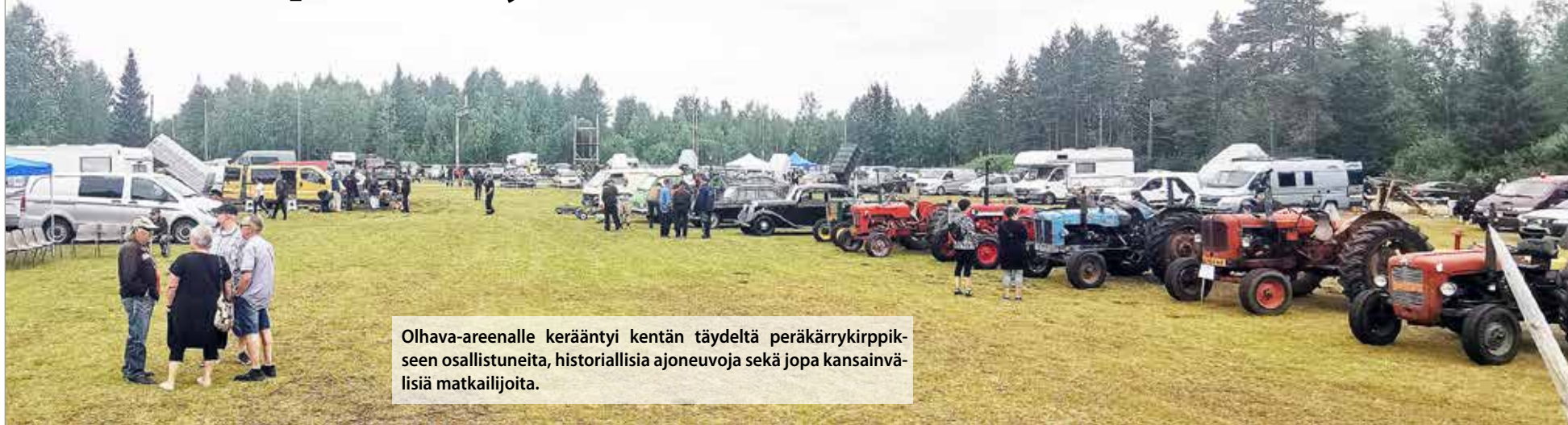
Olhava-areenalle kerääntyi kentän täydeltä peräkärrykirppikseen osallistuneita, historiallisia ajoneuvoja sekä jopa kansainvälisiä matkailijoita.

Olhava- Kylä keskellä kaikkea - toivotti heinäkuun toisena lauantaina 8.7.2023 ihmiset lämpimästi tervetulleiksi Olhava Areenalla järjestettyyn Olhavapäivään.