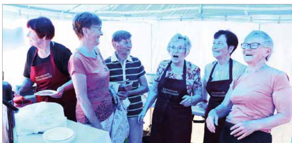
Kuivaniemen Eläkkeensaajien teltalla tarjoilu pelasi iloisella ilmeellä.