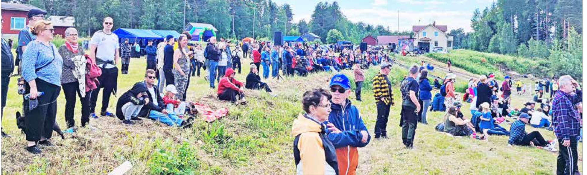
Raasakkakosken rannalle kokoontui arviolta lähes 800 katsojaa seuraamaan tukkilaiskisoja.

Kesän tukkilaiskiset polkaisiin käyntiin Iissä lauantaina 1.7. Iin Kuningajätkä-tapahtuma keräsi Raasakkakosken rannoille arviolta lähes 800 katsojaa. Iin Urheilijat ry järjesti tapahtuman kolmen vuoden tauon jälkeen.