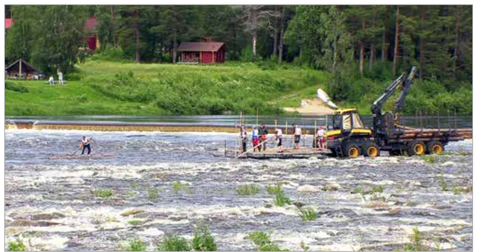
Iin Urheilijat ry järjesti Iin Kuningajätkä-tapahtuman kolmen vuoden tauon jälkeen.

- Järjestelyt saivat kiitosta varsinkin kilpai-