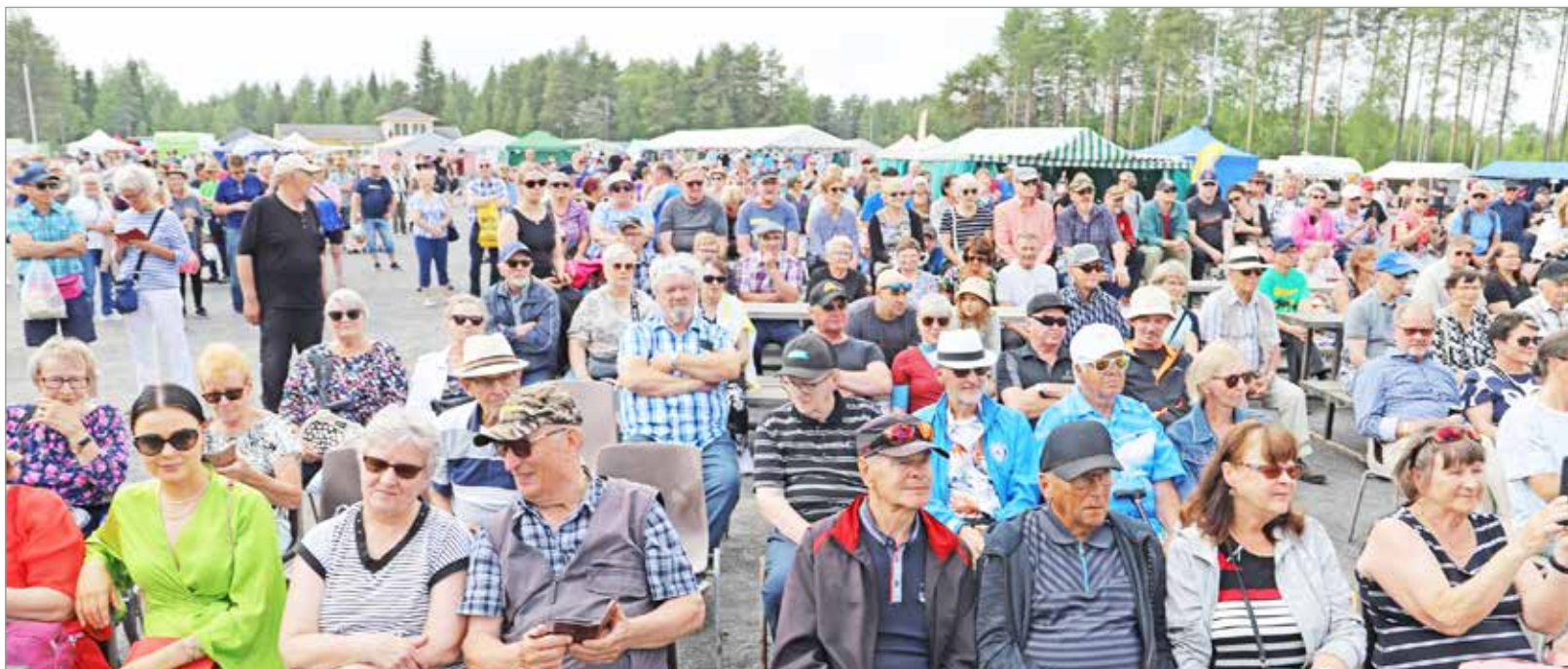
Kaunis ja kesäinen sää oli vetänyt omalta osaltaan markkinoille runsaasti yleisöä.