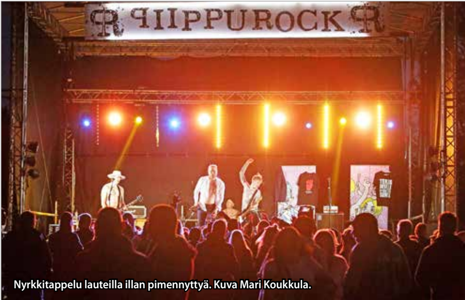
Nyrkkitappelu lauteilla illan pimennyttyä.

-Piippurock on saanut hyvin järjestetyn, rähinättömän festivaalin maineen ja tätä haluamme vaalia jatkossakin, Johanna totesi yleisön joukossa liikkueensa. MTR