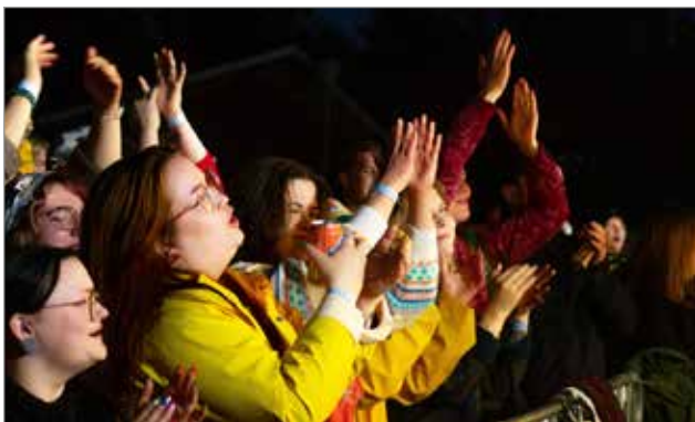
Esiintyjät villitsivät noin 200-päistä rokkiyleisöä sateesta huolimatta.

- Kiitos jokaiselle kävijälle! Toivottavasti pääsemme yhdessä rokkaamaan myös ensi vuonna, toivottaa tapahtumajärjestäjät.