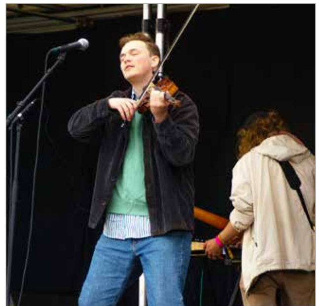
Mekhan yhtye yhdistelee musiikissaan tuoreita äänimaisemia ja menneen ajan nostalgialla.