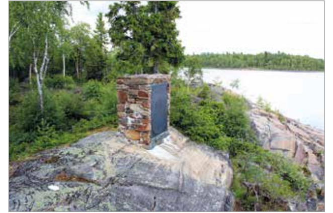
Muistomerkki kertoo Oolannin sodan taistelujen koskettaneen aluetta.

Oolannin luontopolun alussa kulkija voi nähdä tuulivoimapuiston ja kuulla tuulimyllyjen kohinan. Matkalla on mahdollista virkistyä Perämeren aalloissa tai nauttia auringosta hiekkarannalla. Laavulla nautitut nuotiomakkarat ja kahvit kruunaavat retkipäivän. MTR