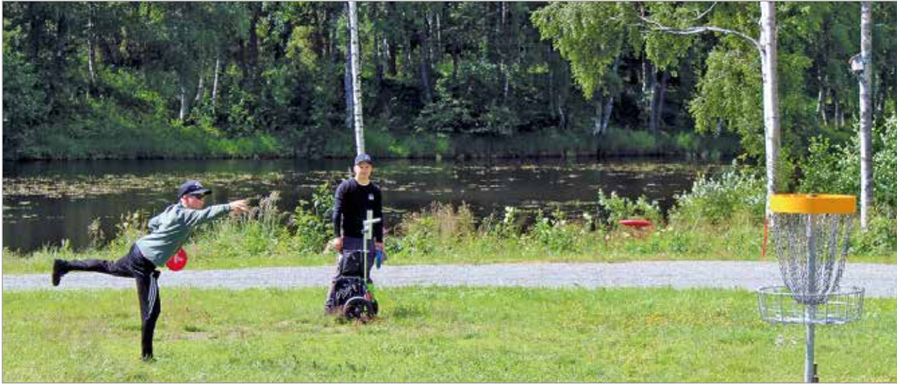
Illinsaaren frisbeegolfrata tarjoaa vaihtelevat olosuhteet väylästä riippuen. Tässä juniorit lijoen rantamaisemassa puttaamassa.