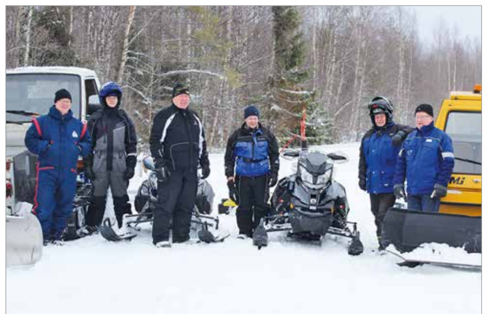
Iissä on runsaasti moottorikelkkailijoita, jotka kunnossapitävät moottorikelkkauria. Kelkkailijoiden toive on jo vuosia ollut saada kuntaan virallinen moottorikelkkareitistö.

Yhdyskuntalautakunta päätti edellä oleviin seikkoihin viitaten keskeyttää moottorikelkkareitistön valmistelun kunnan nykyisen taloudellisen tilanteen johdosta. MTR