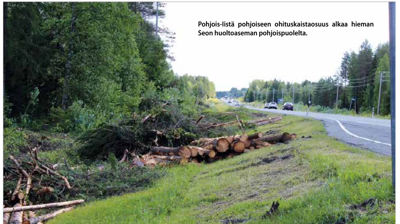
Pohjois-Iistä pohjoiseen ohituskaistaosuus alkaa hieman Seon huoltoaseman pohjoispuolelta.