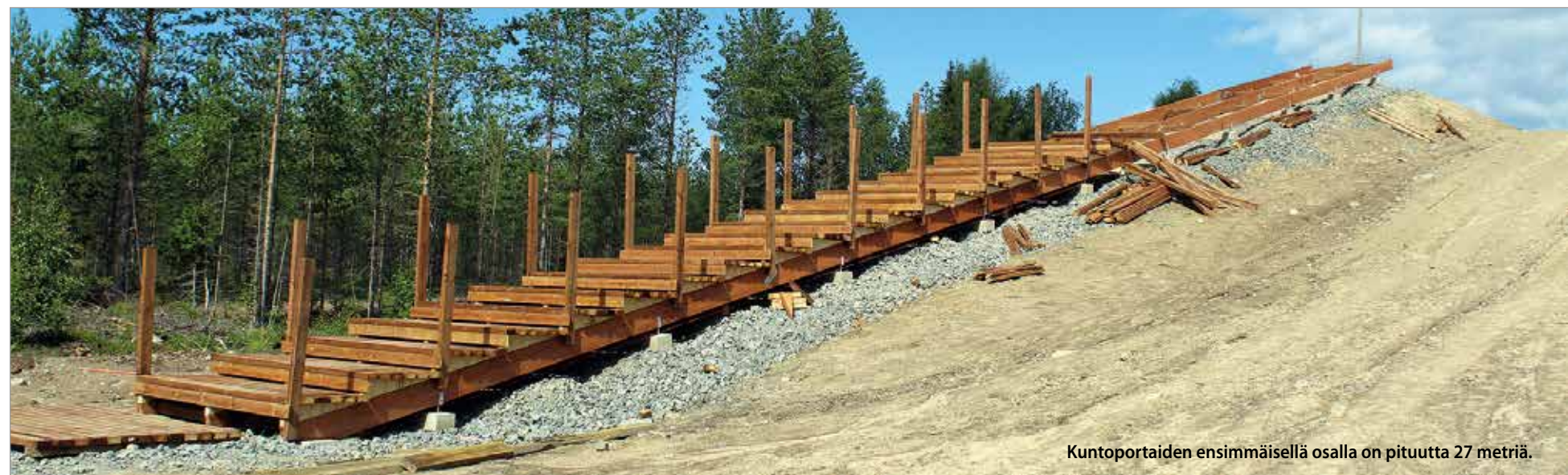
Kuntoportaiden ensimmäisellä osalla on pituutta 27 metriä.