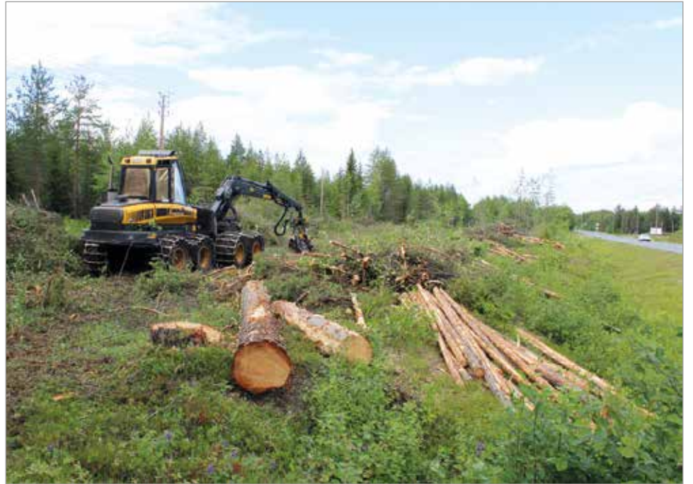
Olhavasta etelään ohituskaista tulee alkamaan Lahdenperänristeyksestä.

Valtatie 4 parantaminen Oulun ja Kemin välillä etenee. Iin eteläpuolella ohituskaistat moottoritien saakka ovat viimeistelyvaiheessa ja Kiiminkijoen sillan rakentaminen on käynnissä. Kuivaniemeltä pohjoiseen ohituskaistat valmistuvat tulevan syksyn aikana, samoin väli Viantienjoki-Maksniemi. Viimeinen pullonkaulaosuus Pohjois-Iistä Olhavaan on myös työn alla. Ohituskaistojen rakentaminen välille käynnistyy varsinaisten rakennustöiden osalta loppukesästä. Puuston poisto ja johtosiirrot aloitettiin kesäkuun alussa. Välille tulee kaksi ohituskaistaosuutta molempiin suuntiin. Urakka on kaksi vuotinen ja valmistuu syyskuussa 2021. MTR