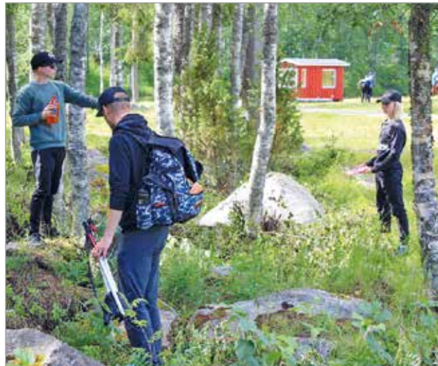
Etenkin väylä 17 oli kilpailijoille pituutensa ja metsään kaventuen todella haasteellinen. Avausheittojen jälkeen kiekkojen etsintään osallistuivat ryhmän jäsenet joukolla.

Kyseessä oli viimeinen mahdollisuus lunastaa kisapaikka Jyväskylässä 1.-2.8. järjestettäviin juniorien tai Virpiniemessä 14.-16.8. järjestettäviin aikuisten SM-