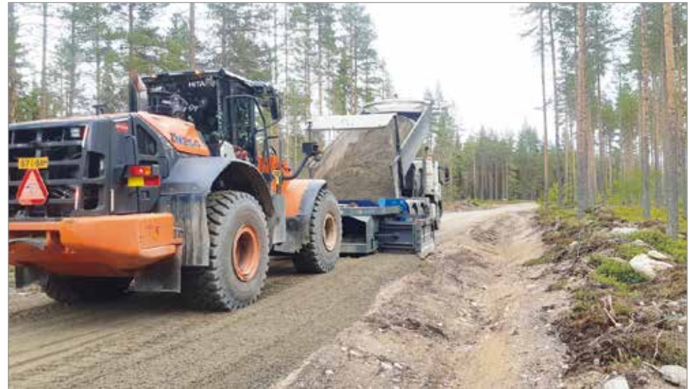
Kivimaantie on suljettuna elokuun loppuun saakka Palosuon ja Vesisuon väliseltä osuudelta tien perusparannustöiden vuoksi. Tien runko muotoillaan mm. tiehöylällä ja kauhakuormaajalla, jonka jälkeen tehdään murskeet levitys ja jyräys.

neet eivät väistä henkilöautoliikennettä. Tien sulkeminen on toteutettu muovisin työmaa-aidoin, mutta mikäli liikennettä on sulusta huolimatta, sulkeminen tehdään järeämmillä rakenteilla. Pää toteuttaja sekä urakoitsija pahoittelevat tilannetta ja siitä aiheutuvaa haittaa tien käyttäjille. HT