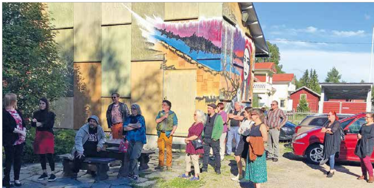
Kotitaitelijoiden näyttely kiinnostaa yleisöä, joten avajaisiin oli saapunut runsaasti vieraita.