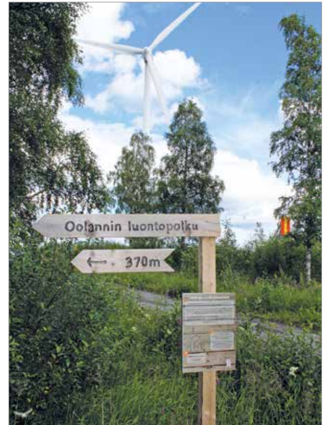
Vatungin parkkipaikalta lähettäessä Oolannin luontopolku alkaa tuulivoimapuiston vierestä.