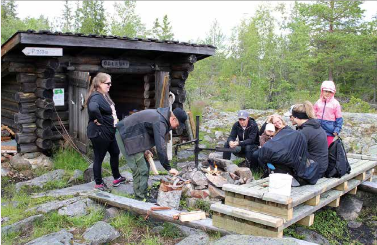
Oolannin laavulla retkipäivää viettäneet kolme perhettä kertoivat tullessaan listä ja vierailleen Oolannin luontopolulla aiemminkin.

Oolannin luontopolku sijaitsee Vatunginnokalla, lähellä kalasatamaa. Kesällä 2018 kunnostetun Oolannin luontopolun pituus on noin 500 metriä. Luontopolun päästä löytyy laavu, tulipaikka, puucee sekä Oolannin sodasta kertova muistomerkki. Polun varrella voit tutustua opastaulujen avulla alueen luontoon ja historiaan. Auton voi pysäköidä Vatungin alueen parkkipaikalle. Alueelta löytyy opaste luontopolun lähtöpisteelle. Etenkin lasten kanssa liikuttaessa auto kannattaa jättää