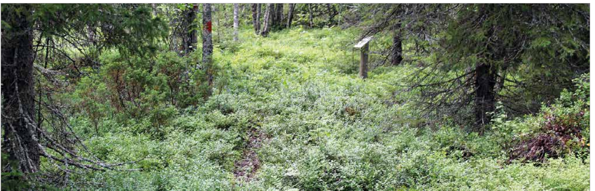
Avokallioiden vastapainona polku kulkee läpi rehevien kosteikkojen.