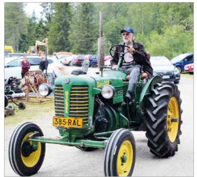
Paraatijaoon osallistui myös Zetor vuodelta 1957. Taustalla maamoottoreita ja muita koneita vuosikymmenten takaa.

Leikkimielisiä kilpailuja oli tarjolla niin Yli-Olhavan Maamiessseuran organisoinnissa Nännikumien heittokisassa, kuin kepparikisassa tai bingossa. MTR