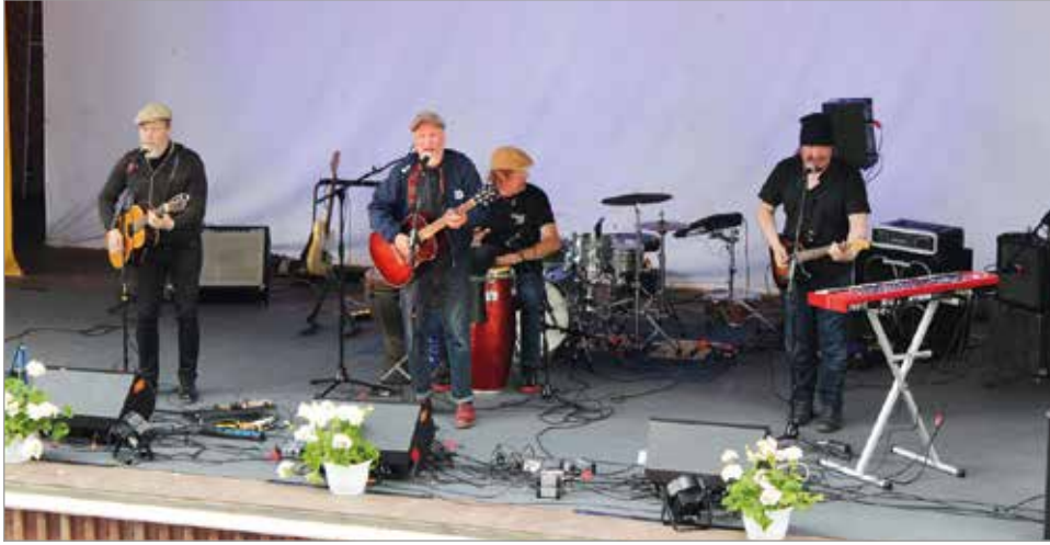
The Skandinistas saapui Oulusta viihdyttämään Huilinki Soi tapahtumaan.