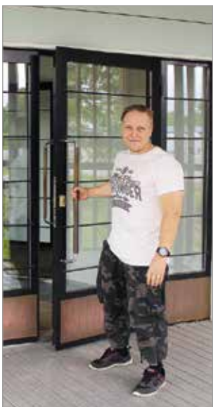
Liikuntakeskus Moven ovet ovat jo raollaan uudessa osoitteessa Karpalotie 15. Sali avautuu käyttöön elokuun alussa.

Laitakujalla Iissä toimivan liikuntakeskus Moven tilat ovat käyneet ahtaiksi, joten toiminta siirtyy elokuun alussa uusiin hylpeisiin tiloihin Karpalotie 15 sijaitsevaan entiseen Fasadin toimitaloon.