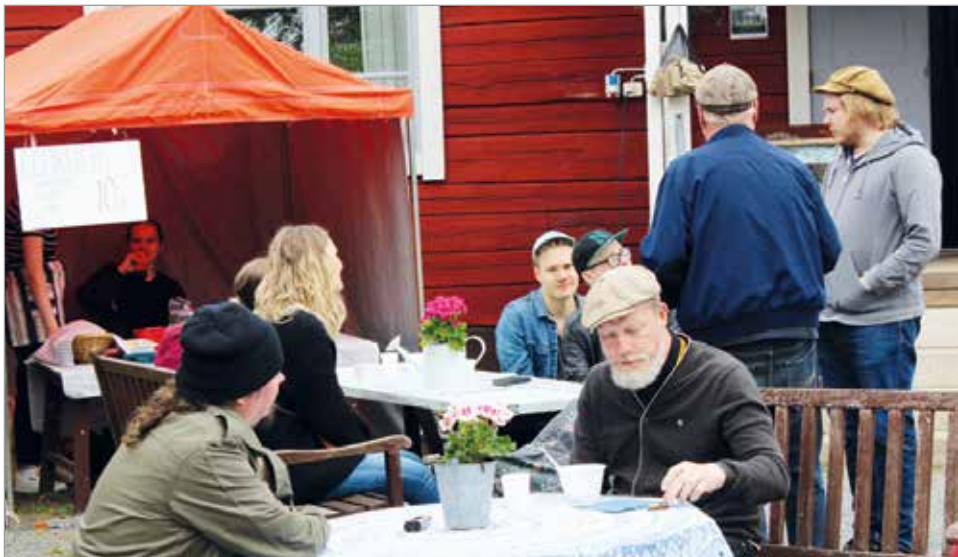
Lohisoppa maistui ykeisölle.

Vieraslajeilla tarkoitetaan lajeja, jotka ovat levinneet luontaiselta levinneisyys-alueeltaan uudelle aluelle ihmisen mukana joko tahattomasti tai tarkoituksella.