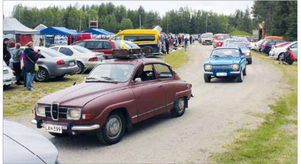
Perinteiseen tapaan paraatijao kiersi Olhava Areenan.