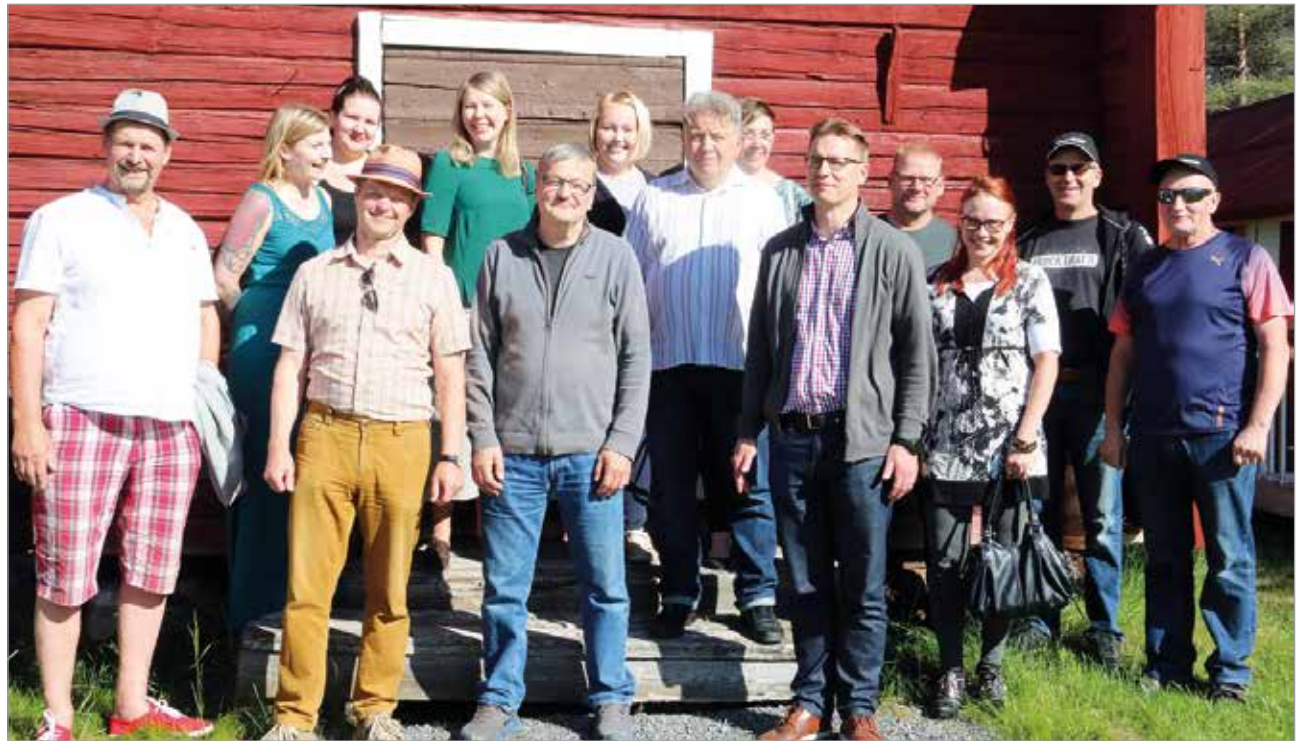
Iin kunnan johto, sekä Iin ja Kuivaniemen Yrittäjien hallituksen jäsenet pitävät säännöllisesti yhteyttä. Tällä kertaa kesäinen kokoontuminen oli Villa Kauppilassa.