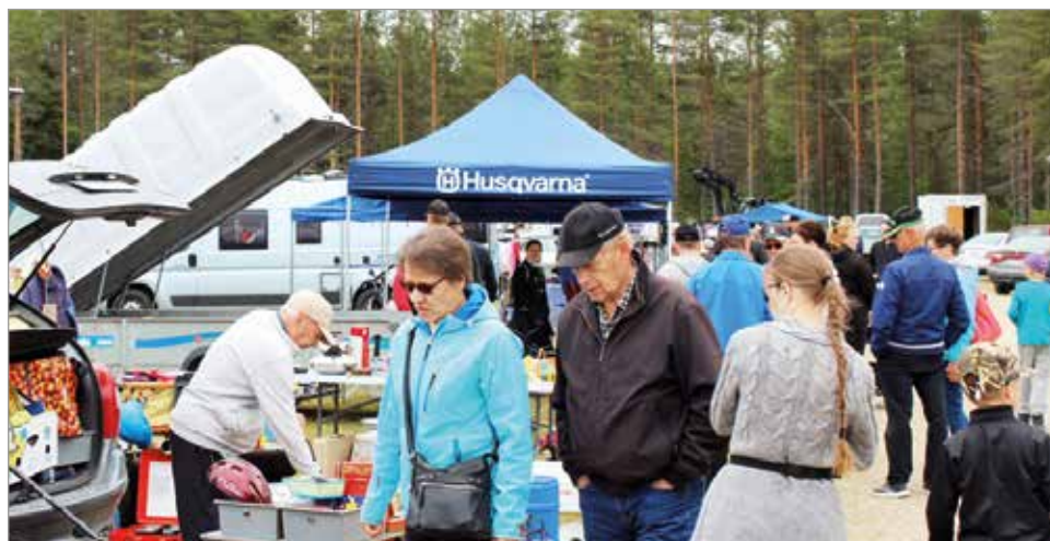
Rompotorilla riitti ostajia ja ostettavaa oli runsaasti tarjolla.