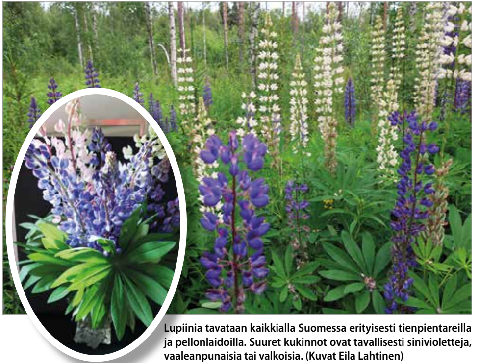
Lupiinia tavataan kaikkialla Suomessa erityisesti tienpientareilla ja pellonlaidoilla. Suuret kukinnot ovat tavallisesti sinivioletteja, vaaleanpunaisia tai valkoisia.

Monivuotinen, hernekasveihin kuuluva lupiini on kaunis kasvi, jonka kukintaa monet ihastelevat. Lupiini on kuitenkin erittäin haitallinen vieraslaji. Erilaisia lupiinilajeja on olemassa 150-200, mutta Suomessa komealupiini on aiheuttanut eniten ongelmia.