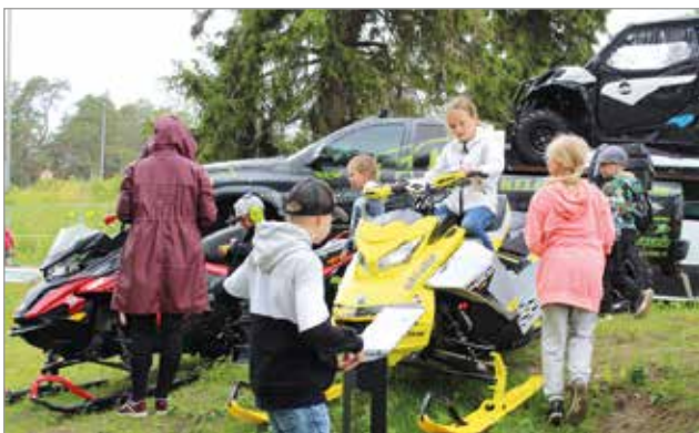
Näytteillä olleet kelkat ja mönkijät olivat etenkin lasten mieleen.