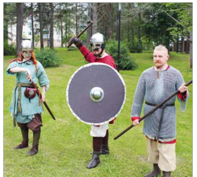
Viikinkimiekkailunäytös kiinnosti myös nuoria.