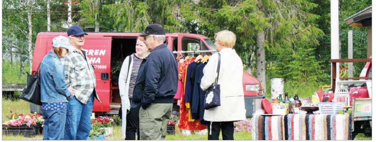
Toripäivän aikana tehtiin kauppaa ja tavattiin tuttuja.