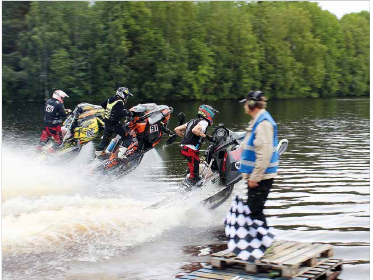
Lähtö saa veden ja hiekan lentämään ja on näyttävää nähtävää.

Iin seudun kelkkailijoiden isännöimä watercross järjestettiin toisen kerran Vihkosaaren uimarannalla 6.7. Kansallisena ajettu kilpailu keräsi osanottajia ympäri Pohjois-Suomea ja on ainoa Pohjois-Pohjanmaalla ajettava kisa lajissa.