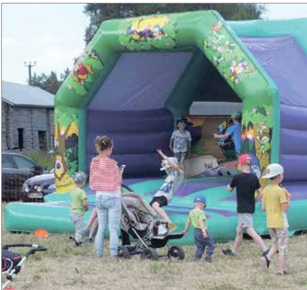
Tukkilaiskisoissa lapsille oli tarjolla vauhdikasta toimintaa.