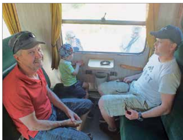
Ukki-Hannua ja isä-Jannea taisi lättähattukyyti jännittää enemmän kuin reipasta Niiloa.

päivästä riittää kertomista vielä kotonakin. MTR