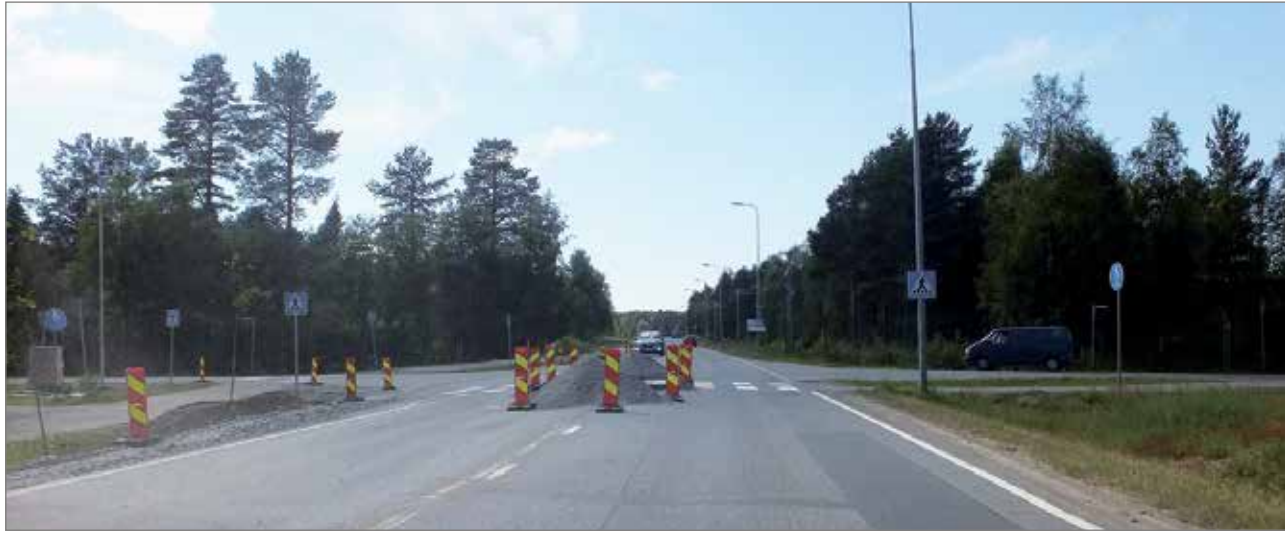
Alarannantien ja Hallitien risteyksen suojatie varustetaan turvasaarekkeilla.