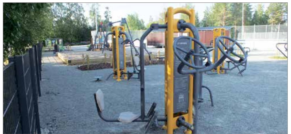
Valtari Areenan yhteydessä voi sekä kuntoilla, että leikkiä monipuolisilla välineillä.