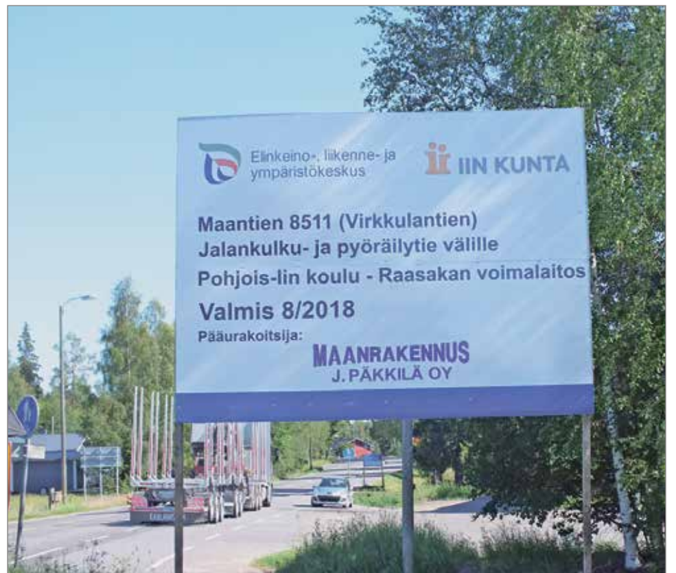
Virkkulantien jalankulku- ja pyörätien rakentaminen on alkanut.

Uusi kevyenliikenteenväylä parantaa muun muassa tiellä liikkuvien koululaisten turvallisuutta koulumatkoilla. MTR