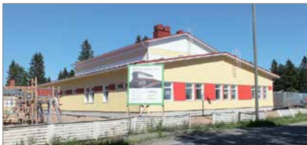
Pohjois-lin viimeistelyvaiheessa olevaan liikuntasaliin on pian turvallista tulla uutta kevyenliikenteen väylää pitkin.

Virkkulantien kevyenliikenteenväylän rakentaminen on alkanut.