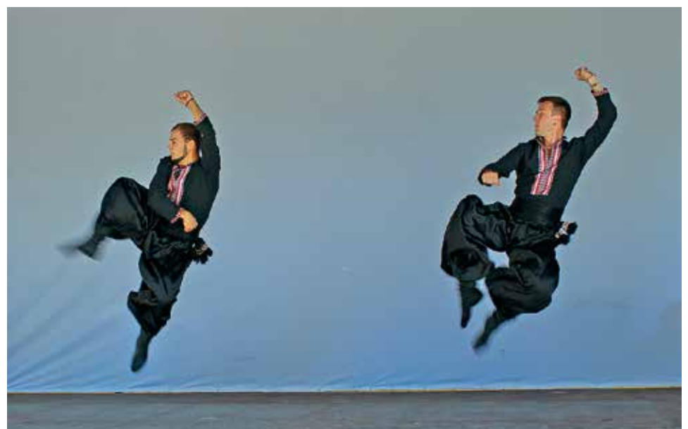
Näyttävät hyppy ja potkut kuuluvat olennaisesti perinteisiin kasakkatansseihin.

Keskiviikkona 11.7. nähtiin Huilingin näyttämöllä kasakkatanssiteatteri Artanian esitys. Aurinkoinen kesäpäivä houkutteli Huilingin toista sataa katsojaa. Teatterin ohjelma "Kasakkailotte-