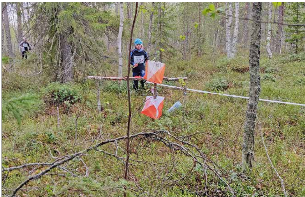
Suunnistus on löytämisen iloa, eikä se Olhavan haasteellisissa maastoissa ole aina helppoa.