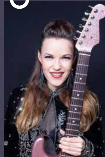
Pääesiintyjänä: Erja Lyytinen