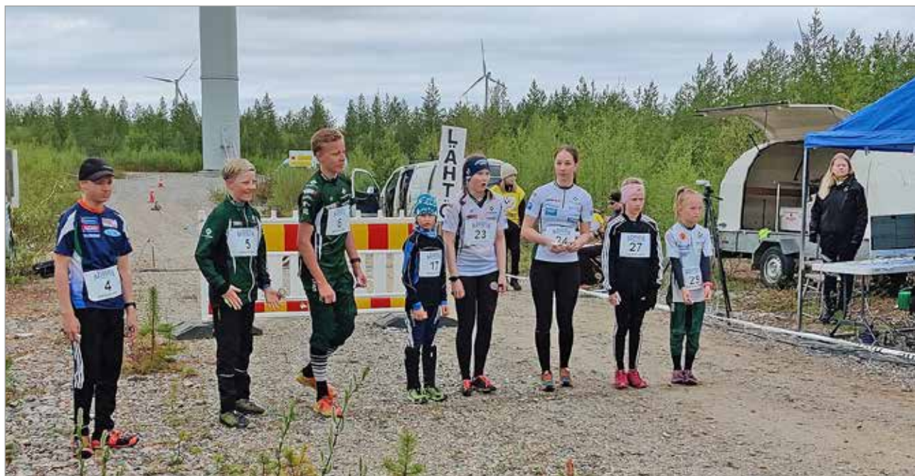
Kelterin viestin lähtö tuulimyllyjen katveesta.

Tulokset kokonaisuudessaan www.iisu.fi MTR