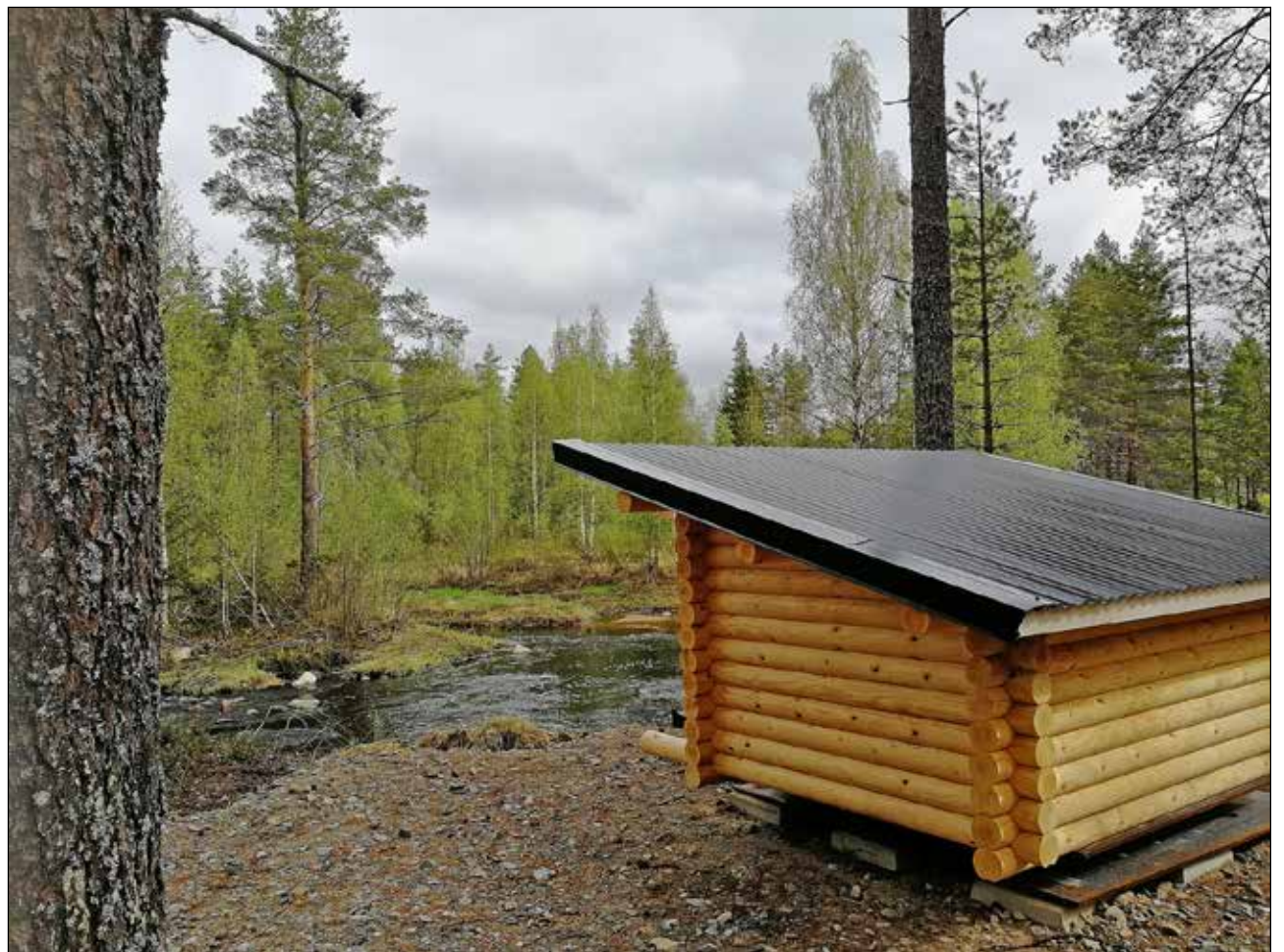
Olhavassa on upeat mahdollisuudet luonnossa liikkumiseen. Retkeilijöille on tarjolla useita kota- ja laavurakennelmia vesistöjen varrella.

Haja-asutusalueella elämänsä ja kotinsa saa rakentaa haluamallaan tavalla, ilman asemakaavan tuomia määräyksiä tai rajoituksia. Päätös maalle muuttamisesta oli loppujen lopuksi helppo. Mahdollisuus elää omannäköistä elämää keskellä luontoa lähellä turvaverkostoa sinetöivät päätöksen Yli-Olhavaan rakentamisesta. Kuntakeskus sijaitsee vajaan 30 kilometrin päässä ja kauppareisut ja muut juoksevat asiat hoituvat työmatkojen yhteydessä. Valokuitu mahdollistaa töiden tekemisen kotoakin käsin. Kuntosali Olhavassa on vapaasti käytettävissä ja mahdollisuudet luonnossa liikkumiseen