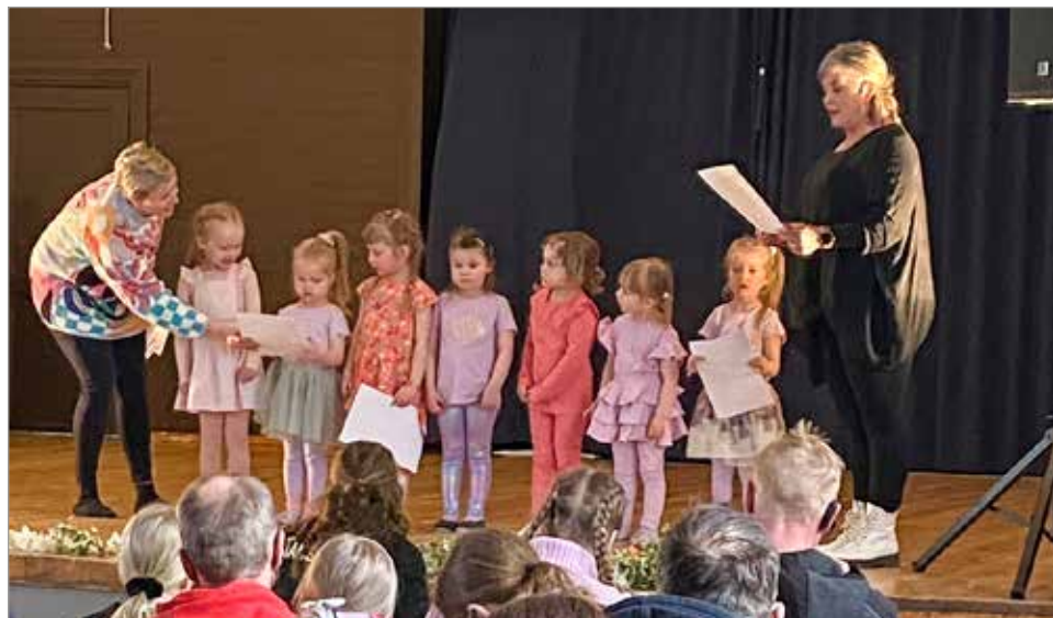
Taaperot (3-4 vuotiaat) saivat diplomit.