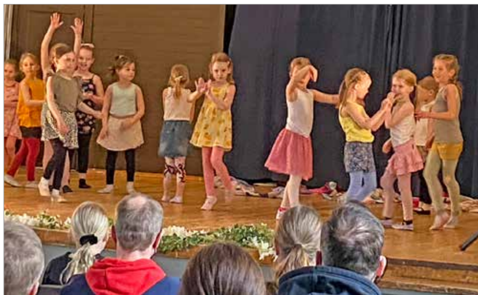
Tenavat (5-6 vuotiaat) olivat innoissaan.