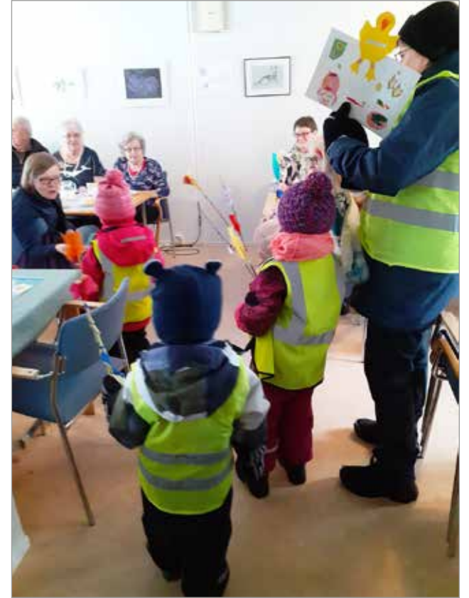
Yllä: Porinapiiriläisten toiveet toteutuivat kun Tenavatuvan lapset kävivät heille virpomassa.