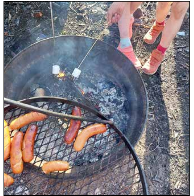
Tikkamäessä paistettiin lopuksi makkarat nuotiolla.

Suunnistuskoulua on jäljellä neljä kertaa 1.6. Illin-