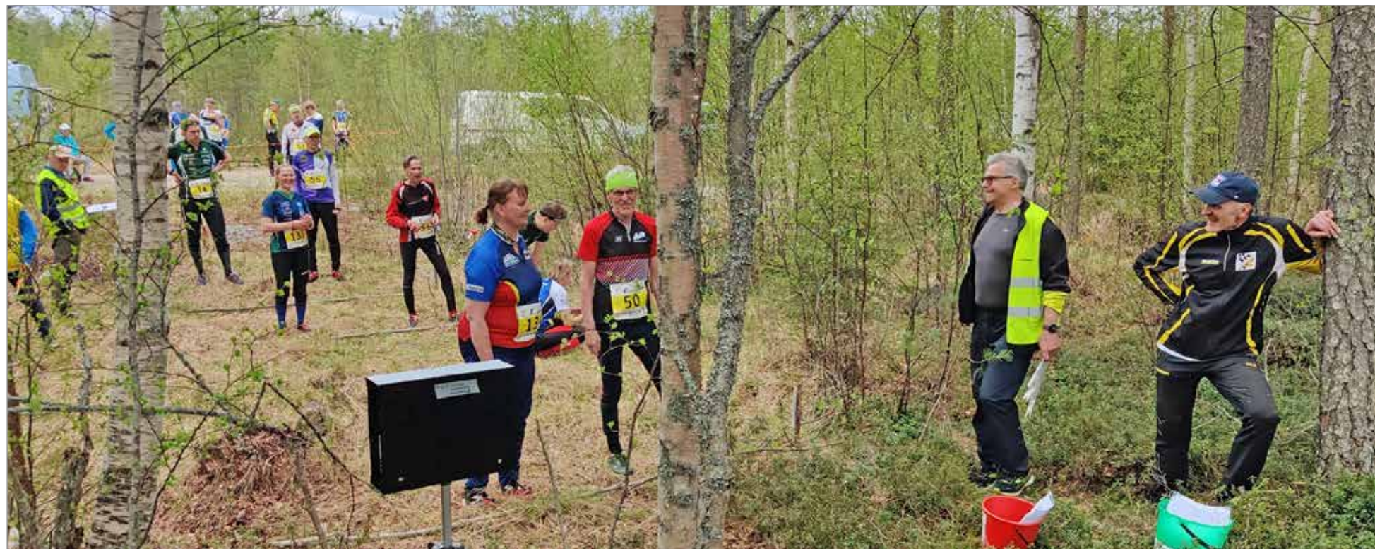
Suunnistajat ovat kuin yhtä perhettä ja lähtöpaikalla riittää juttua kilpailijoiden ja toimitsijoiden kesken.