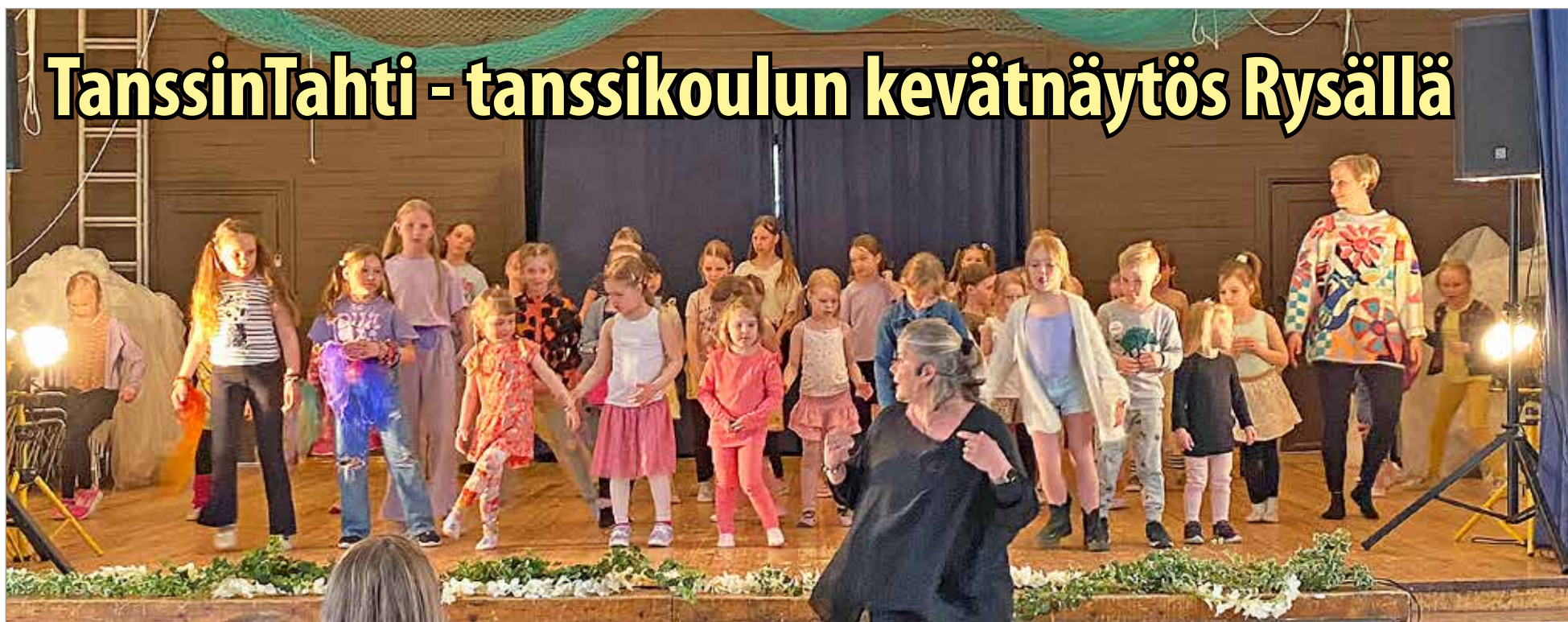
Kaikki tanssikoululaiset esiintyivät yhdessä