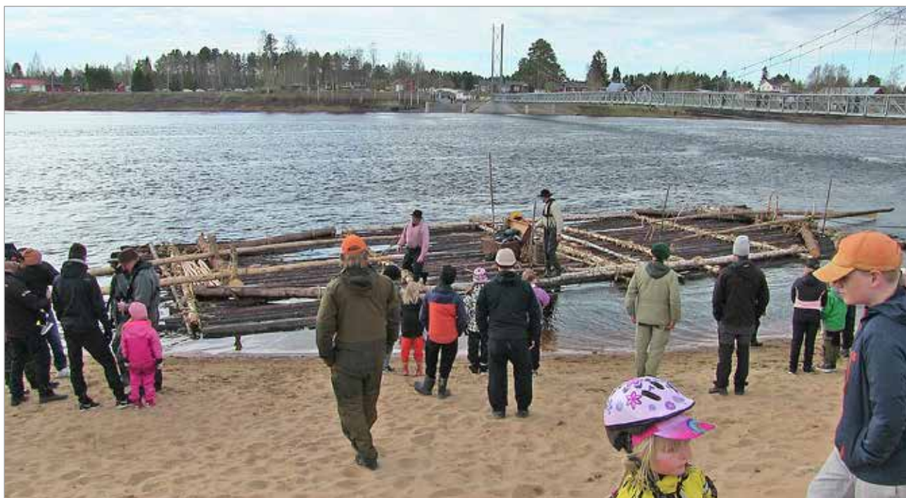
Jakkusuvanto toimi välietappina.