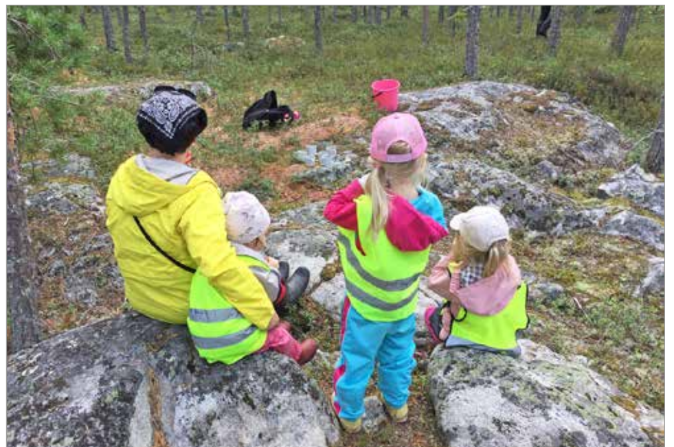
Tenavatupalaiset eväretkellä lähimetsässä.