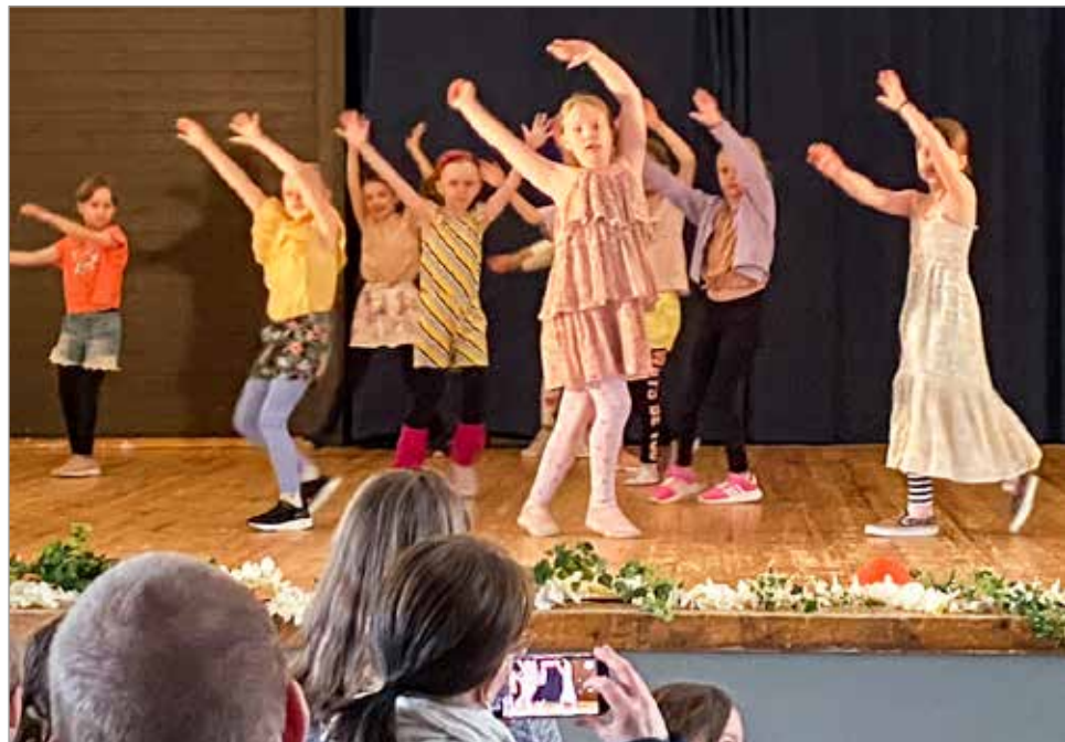
Show kids (10-12) vuotiaitten viehkeää esiintymistä.