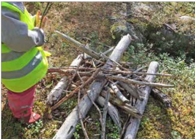
Lasten tekemä leikkinuotio metsässä.