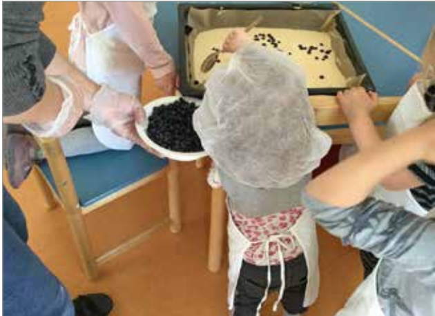
Lapset mukana leipomassa piirakkaa välipalaksi.