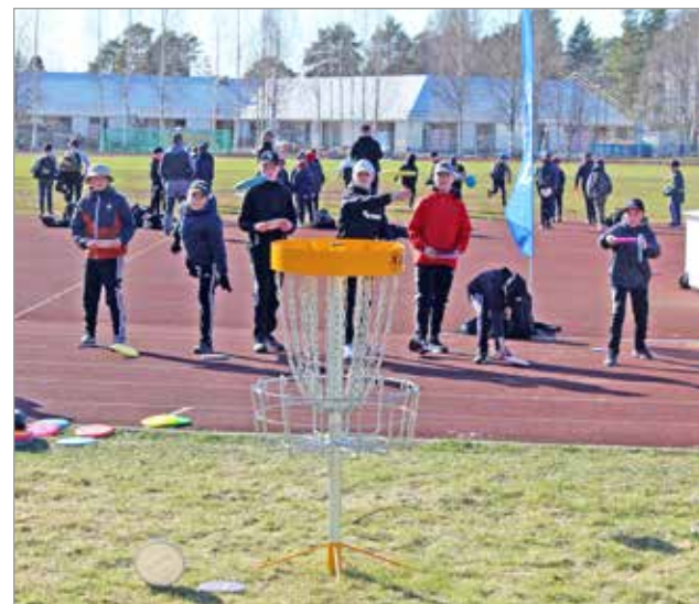
Tulevia mestareita harjoittelemassa Iin urheilukentällä.