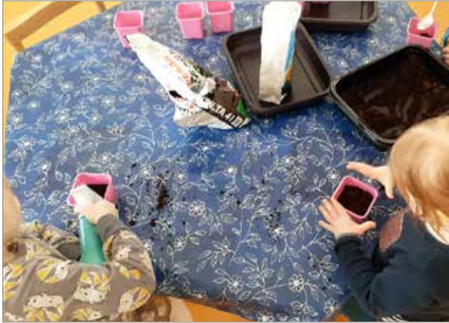
Lapset kasvattivat auriningonkukkia siemenistä lahjoiksi. Istuspuuhat meneillään.