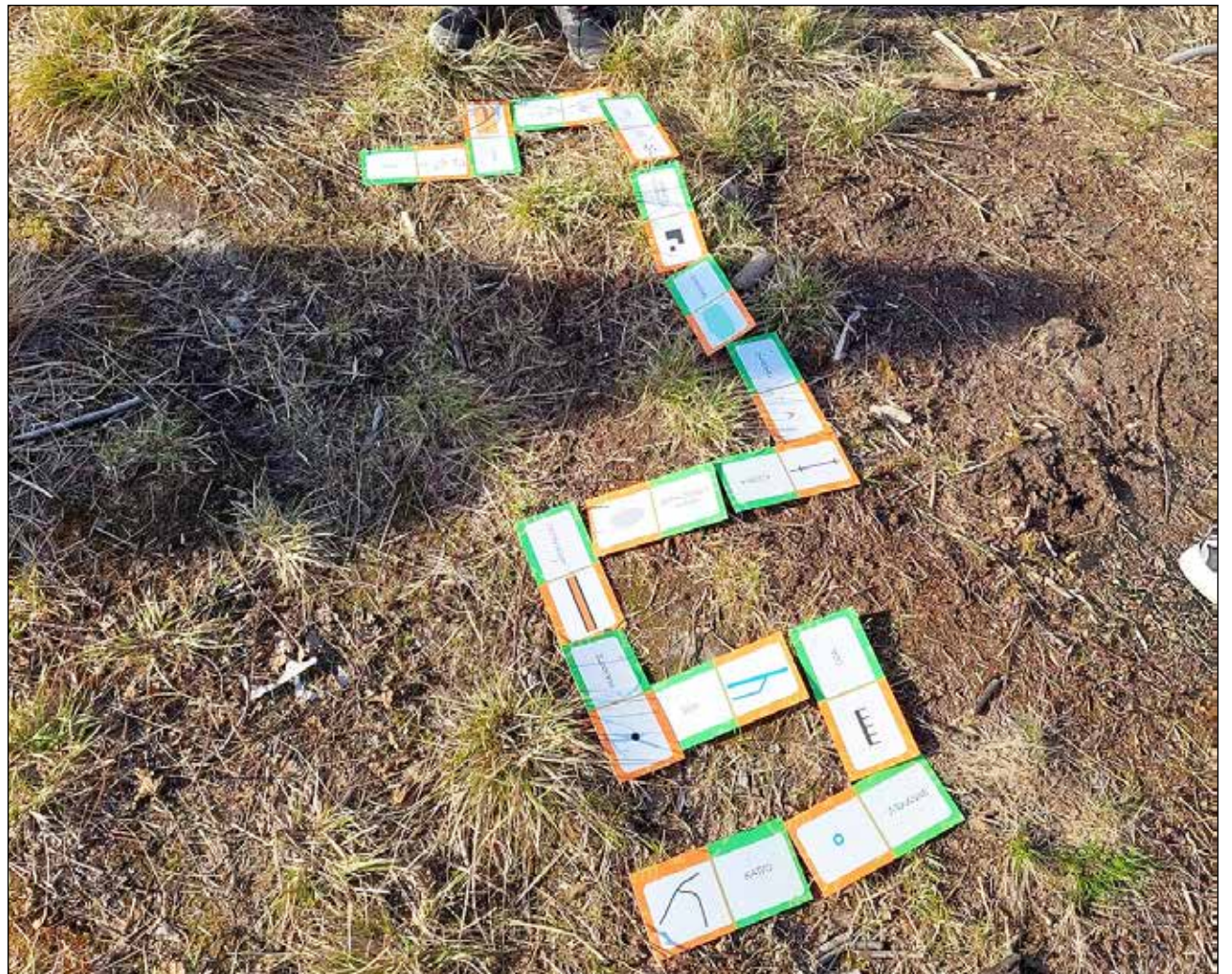
Suunnistusta voidaan opetella karttamerkkipelin avulla.

saari, 8.6. Tikkamäki, 15.6. Illinsaari ja 22.6. Huilinki. Mukaan mahtuu vielä ja osallistua voi silloin, kun ehtii eli joka kerran osallis-