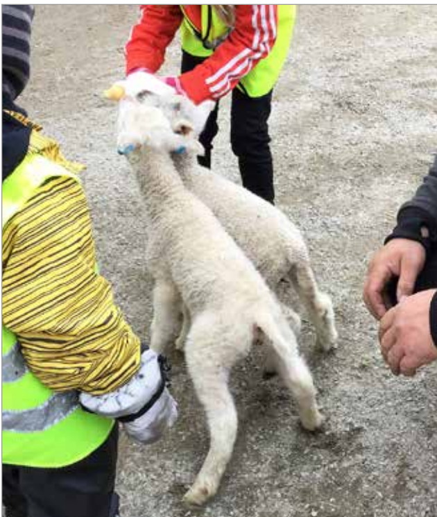
Eläinpuistoretkellä lapset saivat syöttää karitsoja tuttipulloilla.

Olhavan ryhmäperhepäiväkoti Tenavatupa on 12 paikkainen ryhmäperhepäiväkoti. Se toimii Iin kunnan omistamassa Olhavan vanhassa koulussa, joka on remontoitu täysin varhaiskasvatuskäyttöön sopivaksi kokonaisuudeksi. Tenavatuvalla työskentelee 1 varhaiskasvatuksen lastenhoitaja ja 3 varhaiskasvatuksen ryhmäperhepäivähoitajaa. Tenavatupa toteuttaa Iin kunnan varhaiskasvatuksen pedagogisia tavoitteita monipuolisesti. Lasten ja huoltajien osallisuus on tärkeä osa pedagogisen toiminnan suunnittelua.