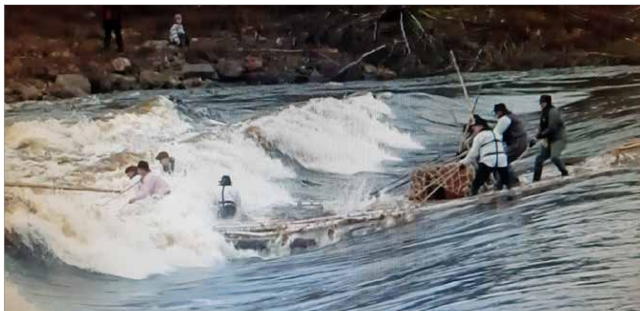
Tikkalankoski tarjosi laskijoille todellisen haasteen.