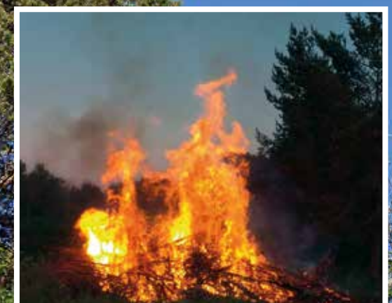
Perinteiseen tapaan kokko paloin lin keskuks-taajaman tuntumassa.