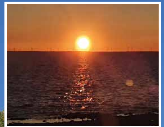
Pilvetön taivas mahdollisti keskiyön auringosta nauttimisen Laitakarissa.

Siniristiliput liehuvat saloissa läpi juhannusyön.