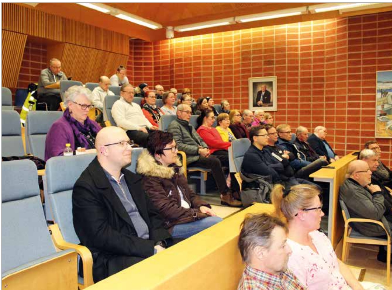
Pyöräilyn ja jalankulun verkko- suunnitelman yleisötilaisuus täytti Nätteporin auditorion.

Yhdyskuntalautakunta hyväksyi suunnitelman kokouksessaan toukokuun lopulla ja päätti käynnistää lautakunnan ohjauksessa erillisen, tarkemman suunnittelun, jonka perusteella määritellään kunnan alueelle rakennettavien kevyenliikenteenväylien rakentamisjärjestys. MTR