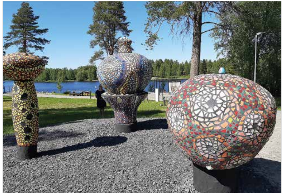
Kummalliset Kukat on Iin julkisen taiteen kokoelman uusin hankinta

Tapahtuma lähetettiin suorana nettiin ja sen voi myös katsoa tallenteena KulttuuriKauppilan YouTube-kanavalta. MTR