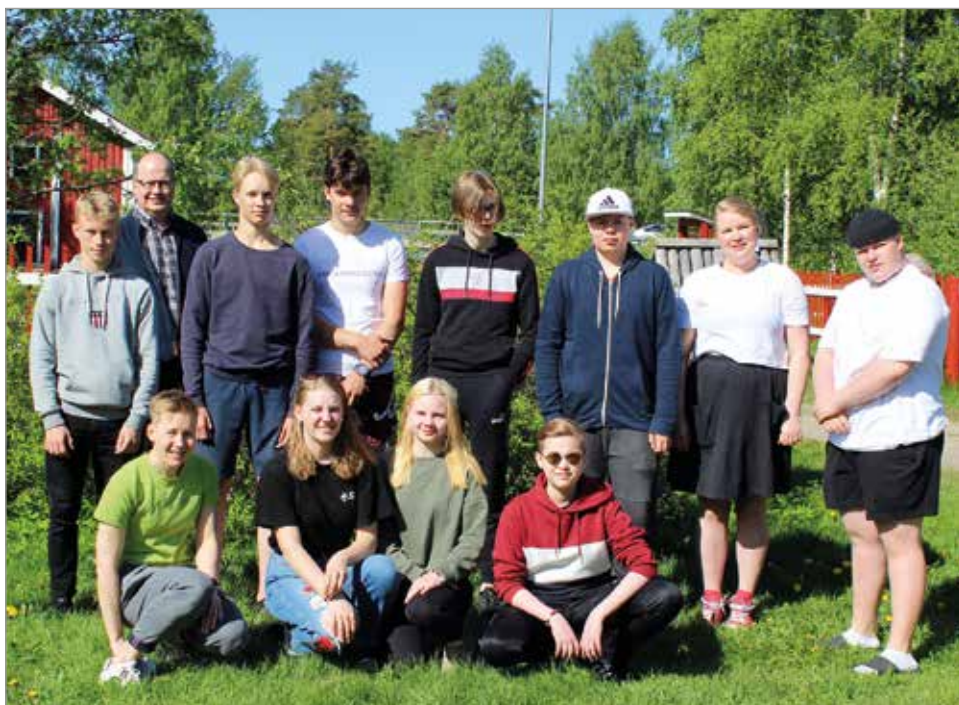
Rippikoulut toteutetaan tänä kesänä päivätoimintana pienryhmissä.

Tällä kertaa päivän ohjelmassa oli Jeesus-peli, jossa Jeesuksen elämään tutustuttiin pelin avulla. Pelissä opeteltiin raamatun lauseita ja laulun sanoja, jotka yhteen kokoamalla koettiin Jeesuksen elämän eri vaiheita. MTR