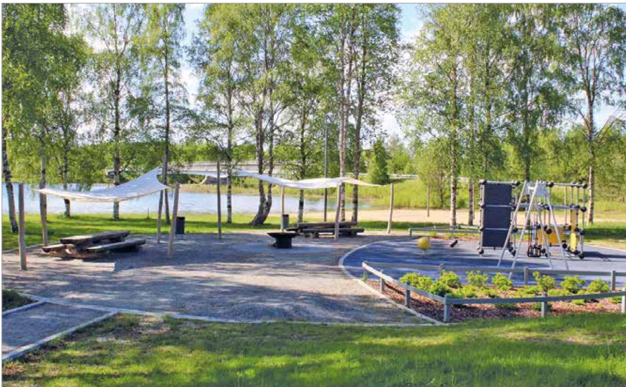
Viihtyisällä oleskelualueella on mahdollisuus myös tulistella ja vaikkapa nauttia nuotiomakkarat.

la sijaitsevista retki- ja luontokohteista. Esittelemme tulevissa numeroissa tarkemmin näitä eri puolilla Iitä sijaitsevia kohteita. MTR