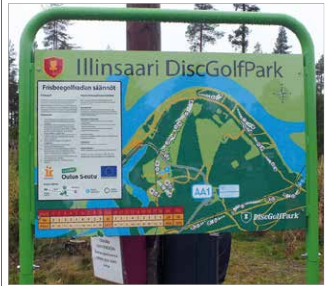
Iilinsaaren frisbeegolfrata soveltuu niin aloittelijoille kuin kilpailijoille. Radan myötä Iissä nähdään tänä kesänä frisbeegolfia Suomen huipulta.

tulossa yli sata kilpailijaa eri puolilta Suomea. Kisojen järjestämisvastuun kantaa ooululainen Hardcore Discgolf. MTR