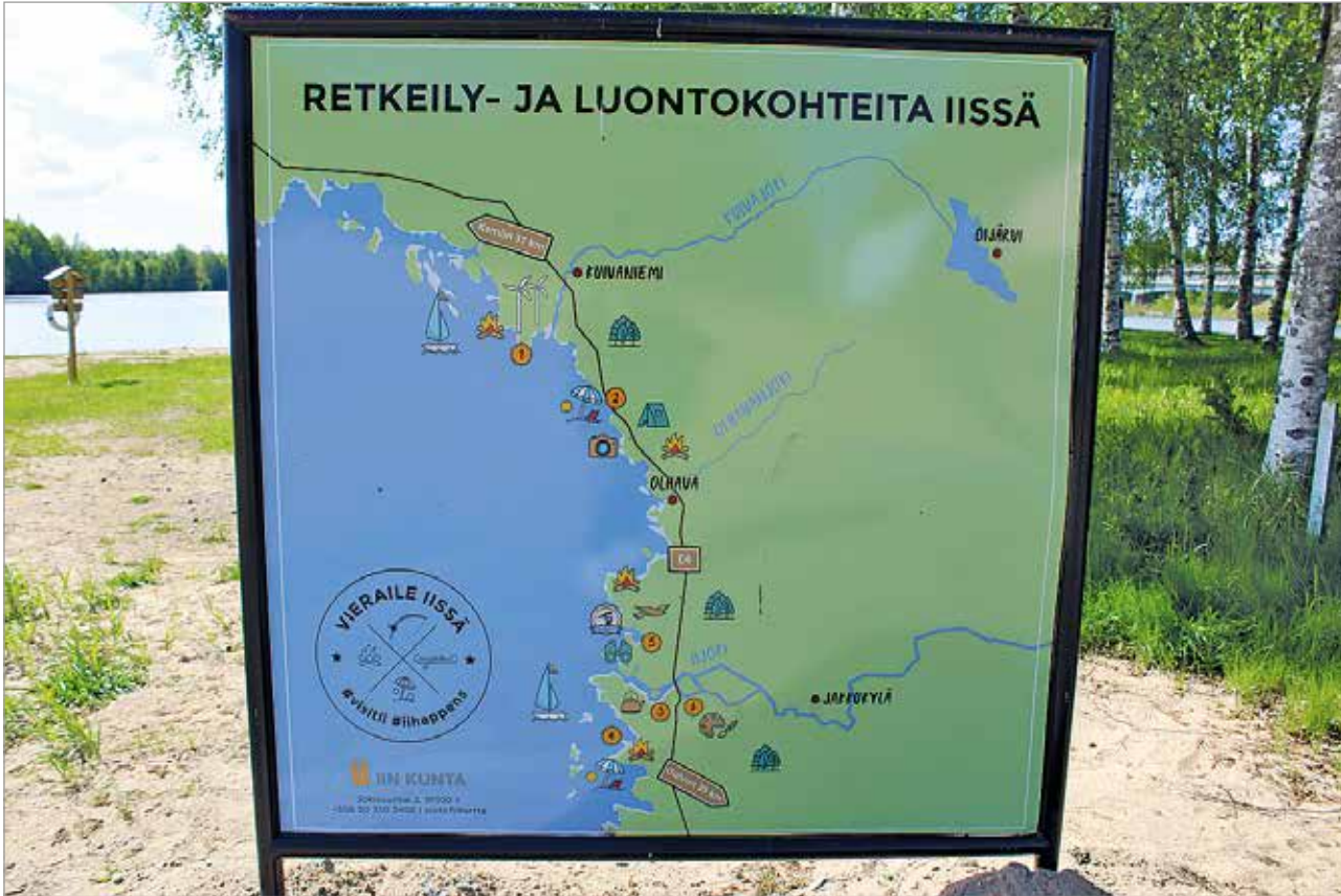
Iin kunnan alueella sijaitsee monia päiväretkeilyyn sopivia kohteita.