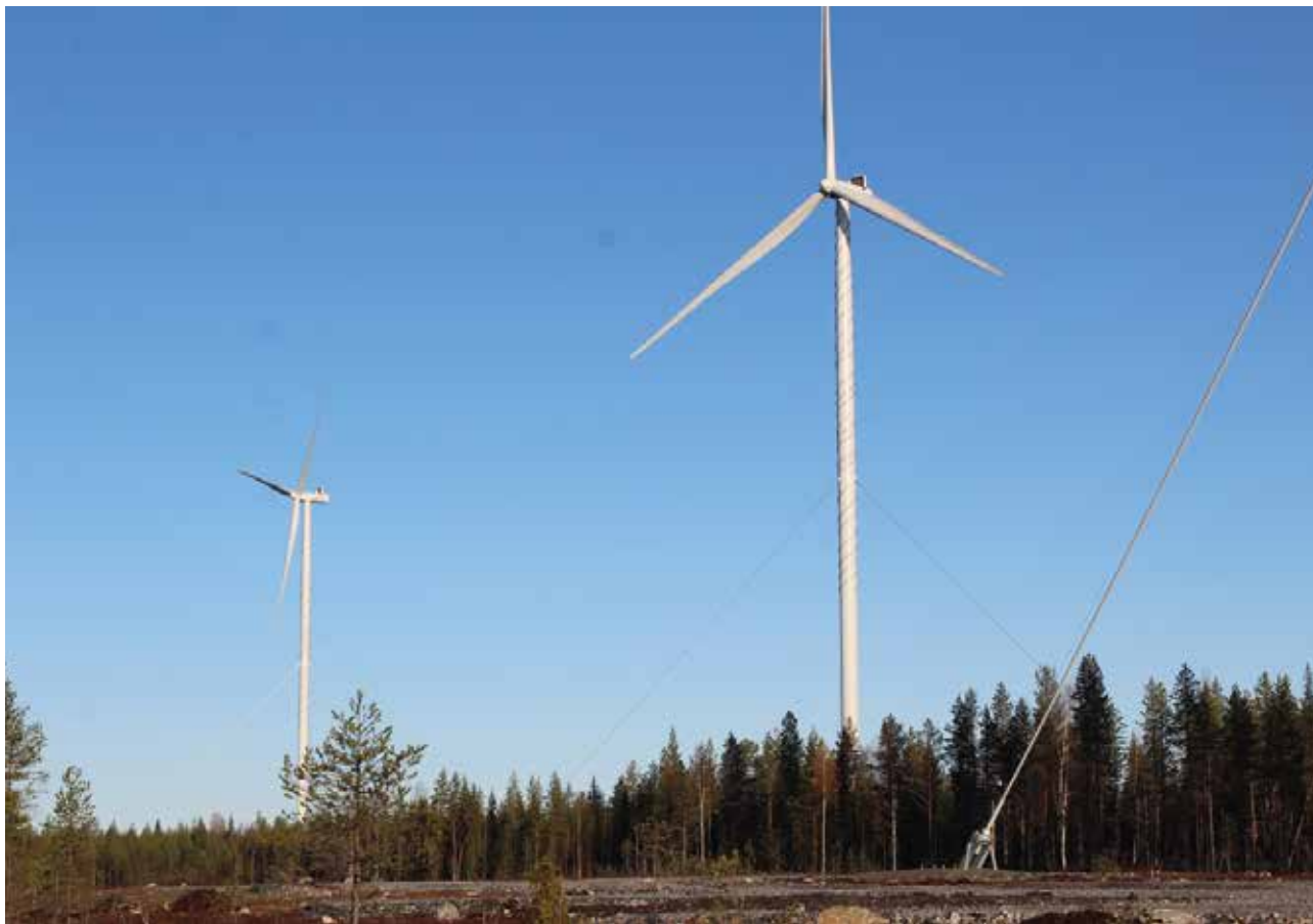
Iissä on paljon rakennettua tuulivoimaa ja useita tuulivoimahankeita on vireillä.

Määräaikaan mennessä saneeraustyön suunnittelusta jätettiin kolme tarjousta. Näistä vesiliikelaitoksen johtokunta hyväksyi PMP Oy:n (=Iin Pohjatutkimus- ja Mittauspalvelu Oy) tarjouksen 32.870 euroa (alv 0) Luola-aavan ja Yli-Olhavan vesijohtojen saneerauksesta. MTR