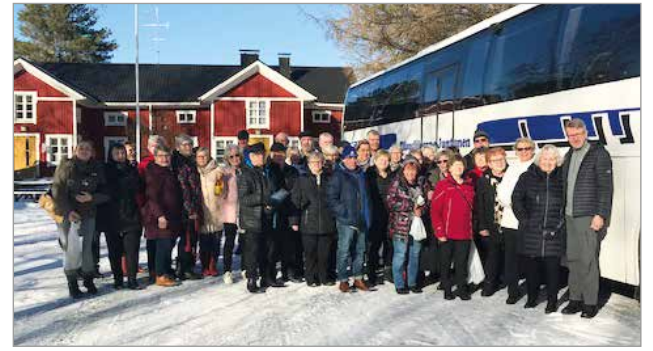
Kivitiipun reissulla yhteiskuva Punaisen Tuvan viinitilan edustalla.