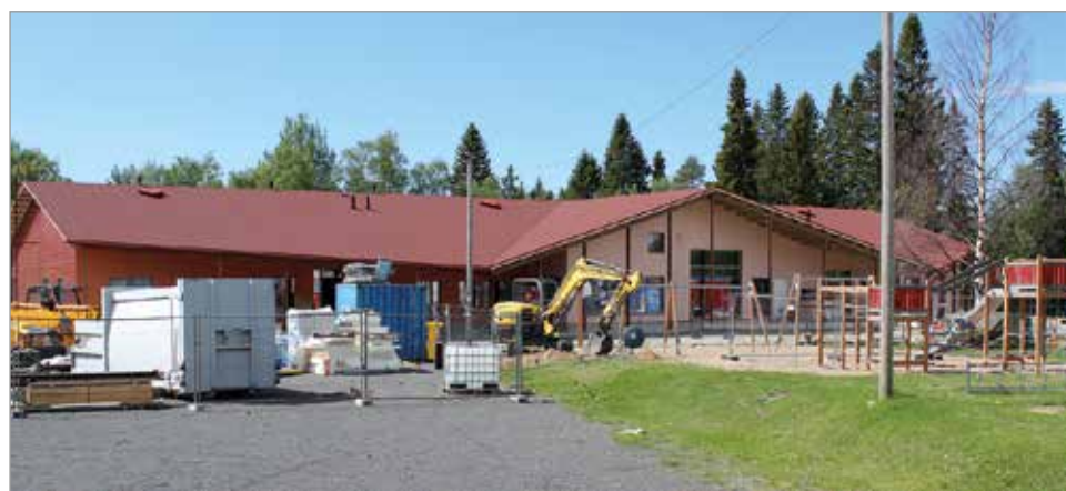
Alarannan koulu valmistuu jouluuksi mennessä, Kohde tavoittelee Joutsenmerkkiä, ollen valmistussaan Suomen ensimmäinen Joutsenmerkkitty koulurakennus.

vät aloittamaan koulutyön kevätlukukauden 2021 alusta uudessa Joutsenmerkki-koulussa. MTR