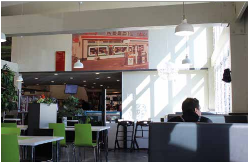
Nelosparkin viihtyisissä tiloissa on tilaa ruokailla terveysturvallisesti.

Ravintoloiden sulkeutuminen kesken kevään hiihtomatkailusesonkia vaikutti myös Kuivaniemellä toimivien ravitsemusliikkeiden toimintaan.