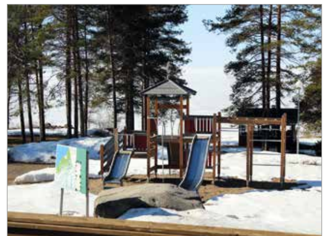
Merihelmi Campingistä on suora yhteys merelle.