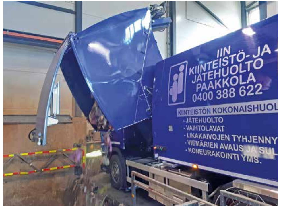
Iin Kiinteistö- ja jätehuolto Paakkolan jäteauto tyhjentämässä biojätettä sisältävää auton etusäiliötä Ruskossa.