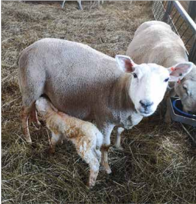
Emän suojaan on karitsan turvallista olla ja totutella maailmaan.

Eskolan lampolassa Simos- sa eletään vuoden kiireisin- tä aikaa. Lammastilan 550 uuhesta (yli vuoden ikäinen naaras) noin 300 karitsoi ja lampolaan syntyy reilut 400 karitsaa.