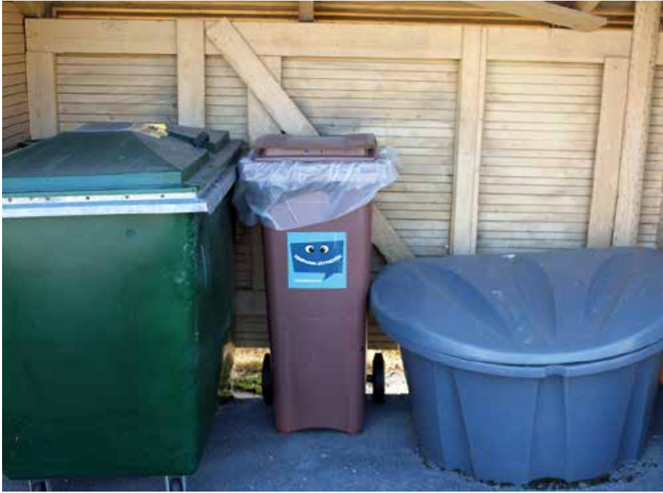
Biojäteastia ei vie paljon tilaa ja lajittelu on helppoa.