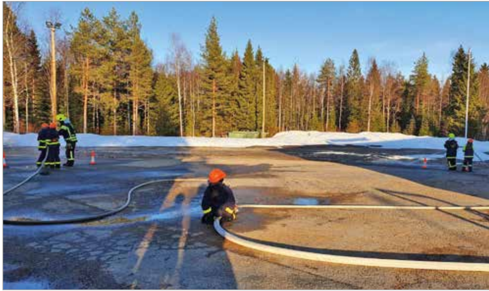
Kuivaniemen palokuntanuoret harjoittelemassa perusselvitystä 15.4.

Palokuntanuoret harjoittelevat pääosin Kuivaniemen paloasemalla.