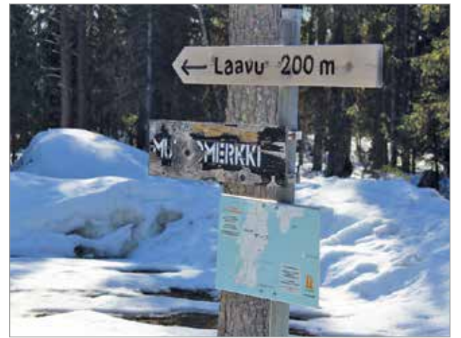
Oolannin laavulla on helppo vieraila ympäri vuoden.

- Kaikki tarmo suunnataan kesämatkailuun, kevätseurongin jäätyä sulun alle. MTR