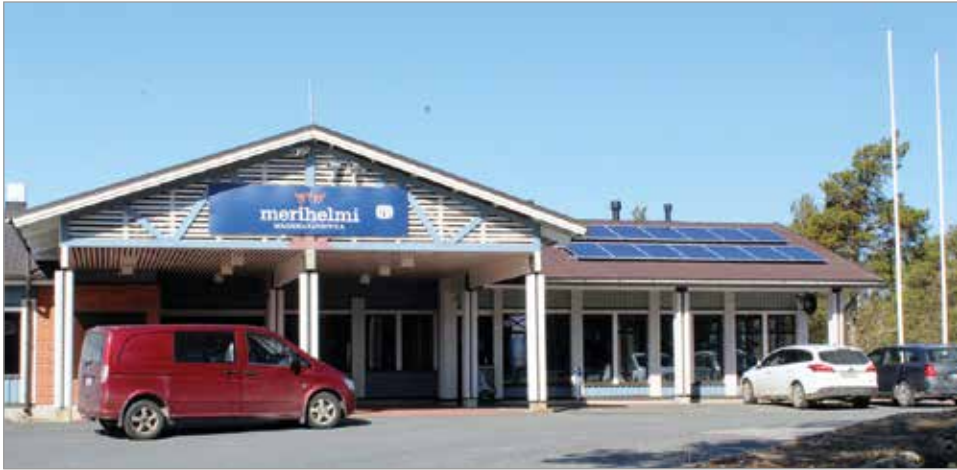
Maisemaravintola Merihelmessä valmistaudutaan kesäsesonkiin. Kuvassa oikealla näkyvien aurinkopaneelien kohdalle tulee katoksen alle jäätelökioski. Vappua voi juhlistaa vaikka maukkaalla jäätelöllä.