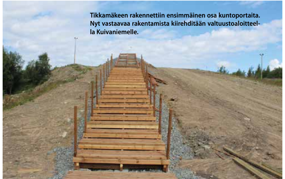
Tikkamäkeen rakennettiin ensimmäinen osa kuntoportaita. Nyt vastaavaa rakentamista kiirehdytään valtuustoaloitteella Kuivaniemelle.

"Kanta-lin Tikkamäen kuntoportaista on saatu erittäin hyvää palautetta liikuntakemusten myötä. Kuivaniemeläiset liikunnanharrastajat ovat toivoneet kuntoportaita myös Kuivaniemelle. Niiden rakentaminen lisää sekä monipuolistaa liikuntamahdollisuuksia. Esitän kuntoportaiden rakentamiseen tarvittavaa lisämäärärahaavarausta ja kuntoportaat rakennettavaksi jo tulevan kesäkauden aikana Kuivaniemen keskus-taajamaan sopivalle paikalle", Sanaksenaho toteaa aloitteesaan. MTR