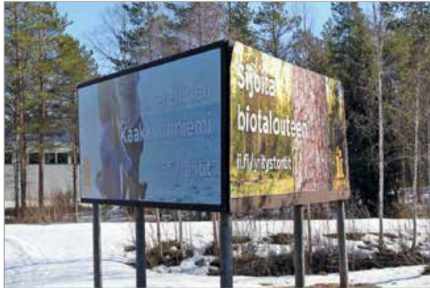
Ii panostaa jatkossakin biotalouteen ja haluaa tarjota monipuoliset vaihtoehdot asuinrakentamiseen.

- Veitsiluodon tehtaiden lakkauttamisaikheet tulivat pahaan saumaan, mutta uskoa tulevaan emme ole menettäneet. Päinvastoin pyrimme kaikin keinoin saamaan uutta yritystoimintaa ja asukkaita niin Iin kuin Kuivaniemen taajamiin. MTR