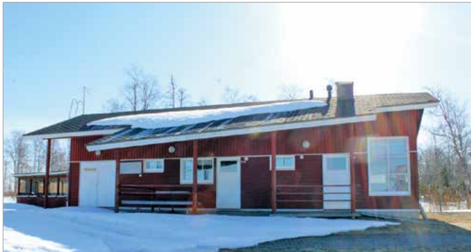
Vatungin sataman huoltorakennus tarjoaa hyvät tilat monenlaiselle toiminnalle. Kuivaniemen osakaskunta on vuokrannut tilat kahden vuoden koeajalle, saadakseen selville tilojen todelliset ylläpitokustannukset.

kuksessaan 21.4. hyväksyen huoltorakennuksen vuokraamisen Kuivaniemen osakaskunnalle kahdeksi vuodeksi 200 euron vuosivuokralla. MTR