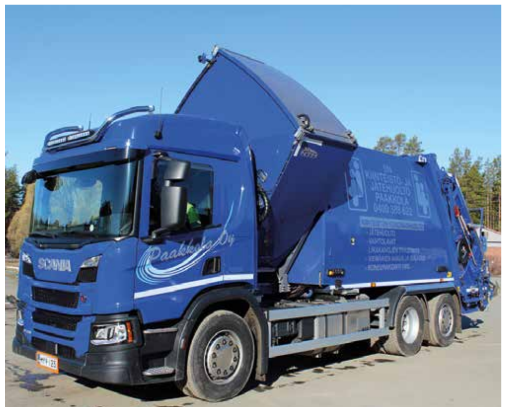
Jäteauton etusäiliö tyhjenetään sivulle kääntäen ja kaataen sisältö avautuvan kattoluukun kautta.