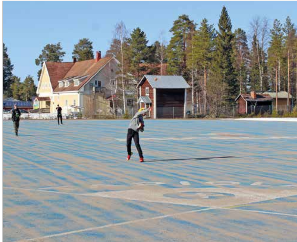
Yhtä tärkeää kuin on oppia lyömään, on taito saada pallo kiinni ja nopeasti kotipesään.