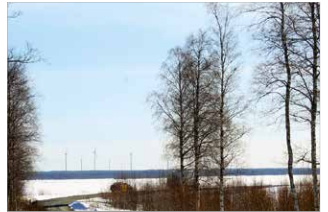
Vatuminnokasta merelle suunnistava voi nähdä kuinka paljon lin rannikolla on tuulivoimaloita.

ren jääulapoille. Merihelmi Campingin parkkipaikka ja Vatuminnokka ovat olleet etenkin kelkkailijoiden suosimia lähtöpaikkoja. Vatuminnokassa liikkuneet ovat samalla voineet hyödyntää lähistöllä olevaa Oolannin laavua, jossa myös lintujen kevätmuuttoa seuranneet ovat tuttu näky. MTR