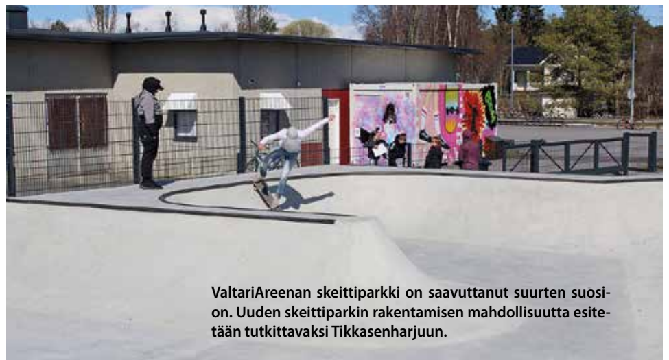
ValtariAreenan skeittiparkki on saavuttanut suurten suosion. Uuden skeittiparkin rakentamisen mahdollisuutta esitetään tutkittavaksi Tikkasenharjuun.