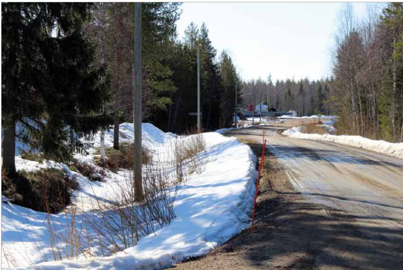
Kuivaniemen teollisuusalueelle toivotaan lisää yrityksiä. Sopivia tontteja löytyy hyvien kuluuyhteyksien varrelta.