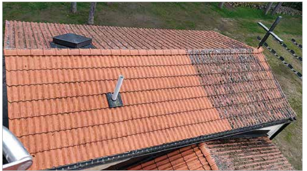
Iin kirkon katosta tuli kuin uusi sammaleen poiston ja pesun jälkeen.