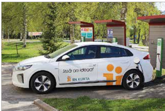
Yhteiskäyttöautojen määrä nousee syksyllä kolmeen ja autojen toimintasäde kasvaa sadalla kilometrillä yhtä latausta kohti.

Sähköautojen osalta Manninen kertoo, että kilpailutuksen voitti henkilöautojen osalta CarDen Oy ja pakettiautojen osalta autole.com.MTR