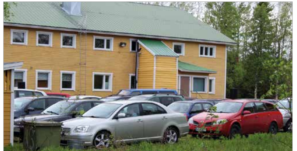
Suomen ensimmäinen autobingo keräsi mukavasti pelaajia.

- Olemme parikymmentä vuotta käyneet Haaparannan autobingossa, ja olen siitä tykännyt. Myös meidän autobingollemme bingolupaa haikissa vetosin Haaparannan