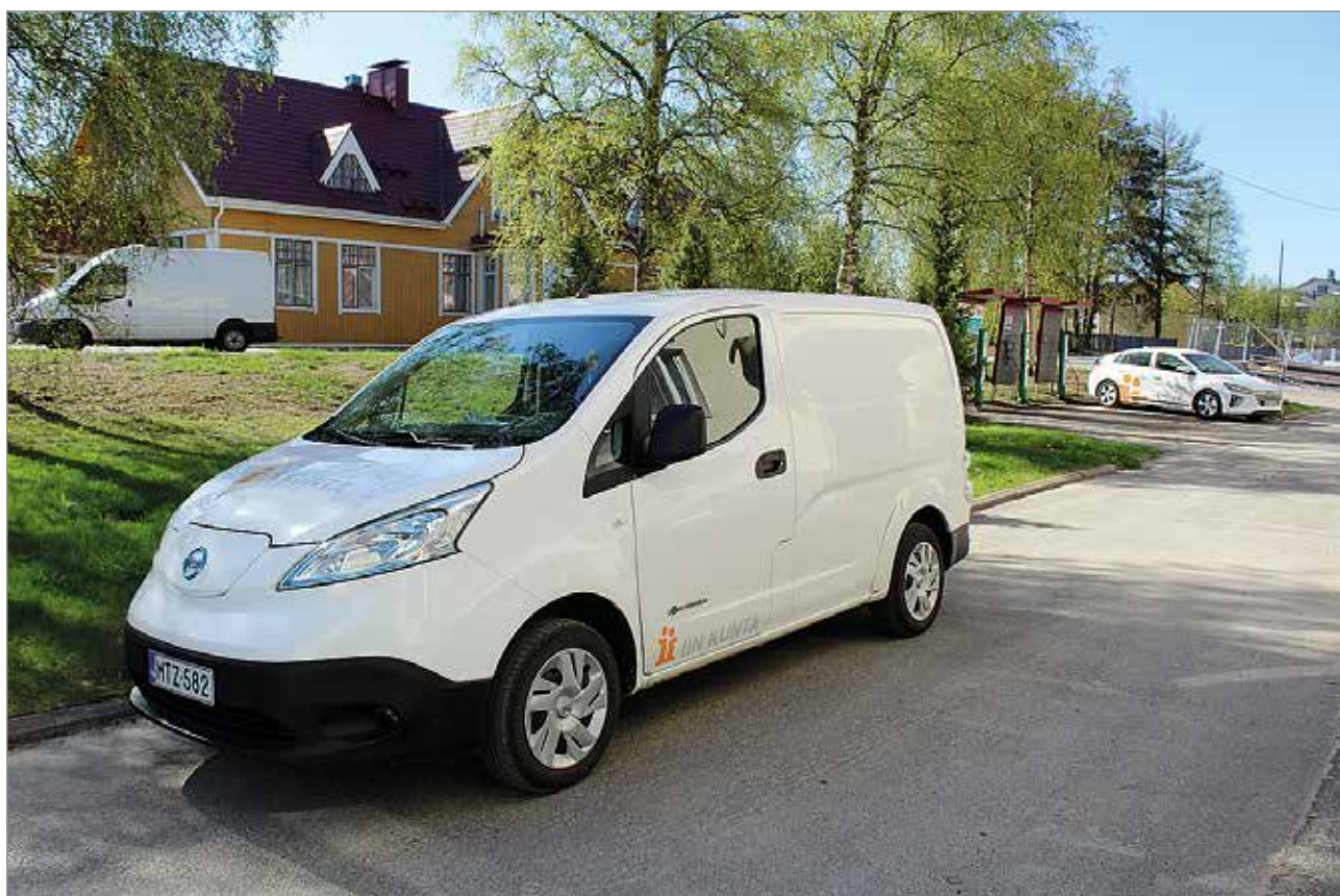
Kunnan kaksi sähköpakua saavat syksyllä seurakseen kaksi lisää.