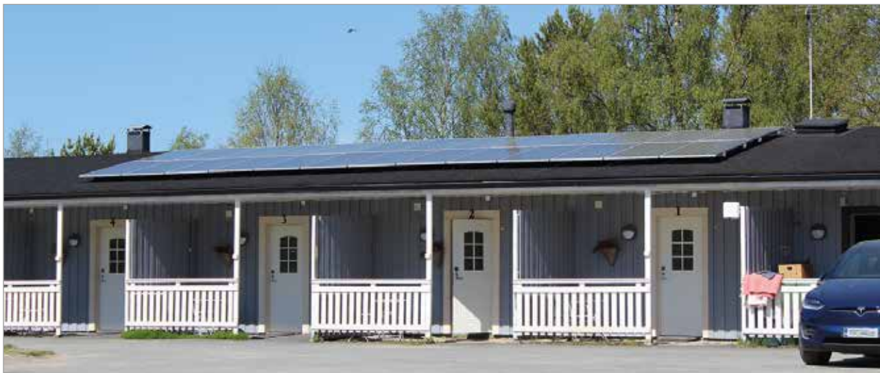
Rivitalon ja päärakennuksen katoille asennetut aurinkopaneelit tuottavat huomattavan osan Iin Siltojen tarvitsemasta sähköstä.