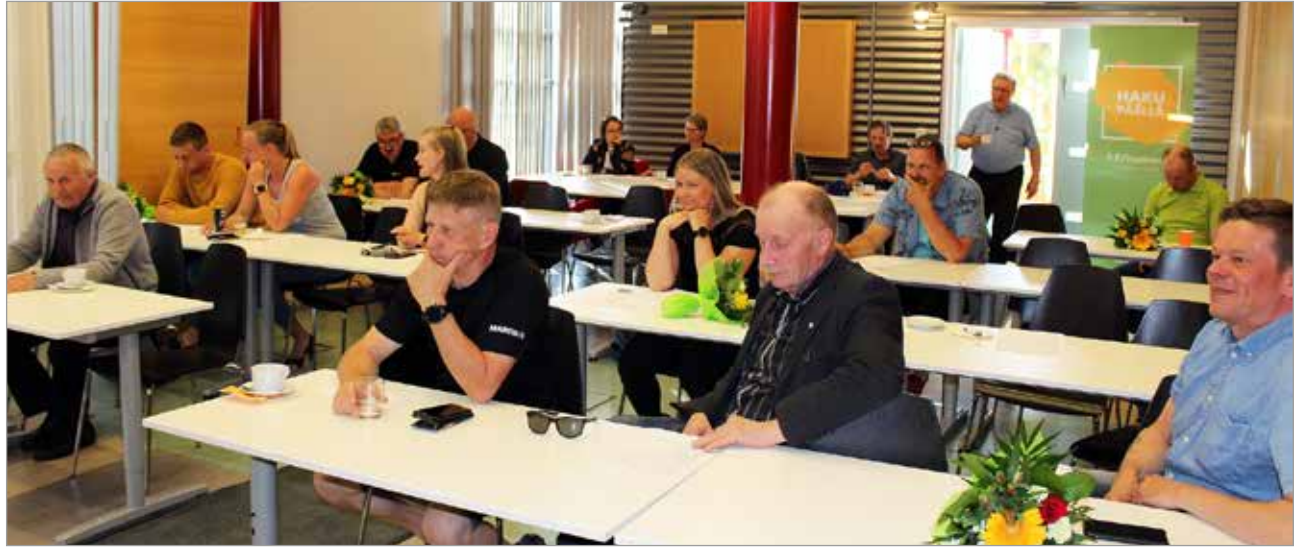
Iin Yrittäjien kevätkokoukseen osallistui runsaasti yrittäjiä.

Kokouksen loppuun Iin Yrittäjät suunnittelivat tulevaa toimintaansa, muun muassa virkistysmatkaa syksyille. MTR