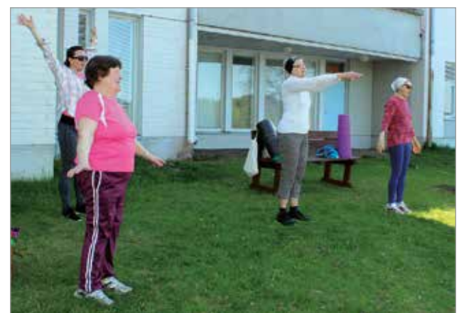
Pihajumppat mahdollistavat ohjatun liikunnan turvavälein kunnosta ja säästä nauttien.