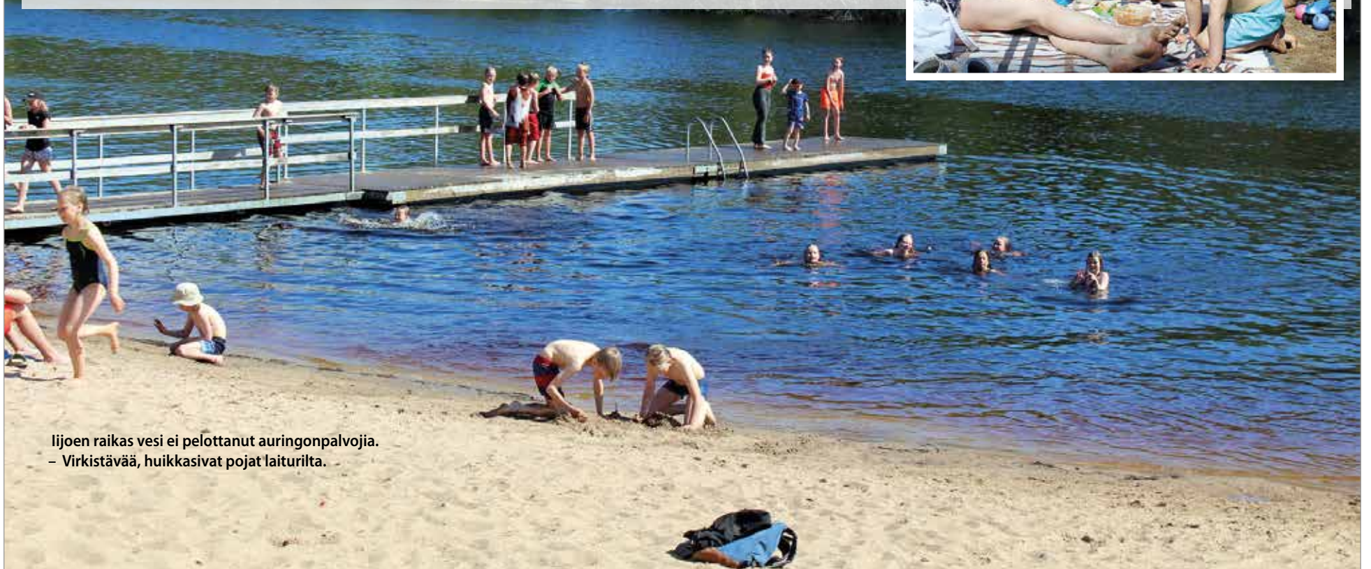
Iijoen raikas vesi ei pelottanut auringonpalvoja. - Virkistävää, huikkasivat pojat laiturilta.