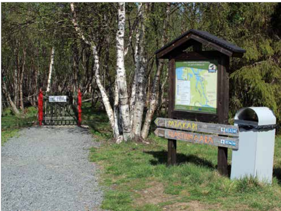
Hiastinhaaran luontopolku ja Patakarin lintutorni ovat suosittuja retkikohteita.

- Kyläyhdistys on tehnyt kummastakin laitumesta ELYn kanssa ympäristösopimuksen ja Korpiniityn lammastilan kanssa yhteistyösopimuksen lampaiden kesälaiduntamisesta. MTR