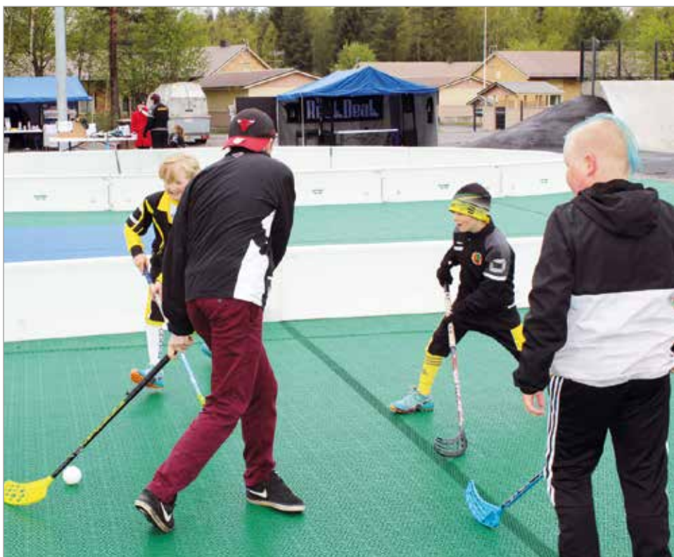
Päivän aikana oli mahdollista kokeilla vaikkapa sählyä.