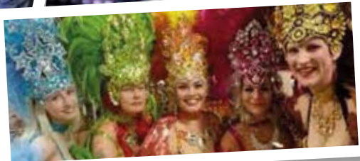
Fa Fuente sambaryhmä