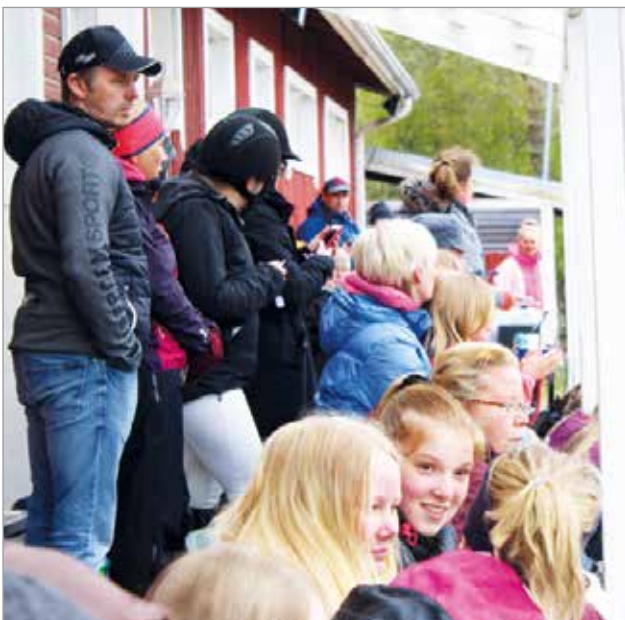
Ratsastus on etenkin tyttöjen suosiossa ja se näkyi katsomossakin.

Parhaan ratsastuskoulun palkinnon yhteismenestyksen perusteella voitti Turkan Ratsurinne. MTR