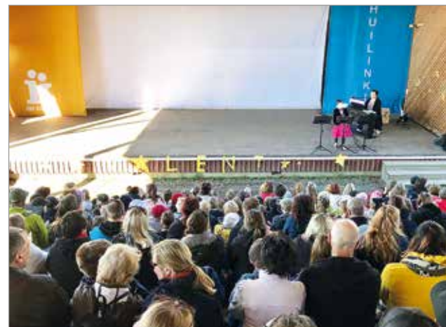
Oppilaiden taidokkaita esityksiä seurasi runsaslukuinen yleisö.

Esityksessä oli niin orkes- tereita, tanssijoita, yksin -ja ryhmälaulajia sekä runon- lausuntaa. MTR