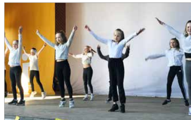
Tanssijat vauhdissa Huilingin lavalla.

Haminan koulun kevätjuhlaa vietettiin tänä vuonna oppilaiden talent-esitysten sikermänä. Paikalla oli katsomon täydeltä oppilaita, huoltajia ja isovanhempia, arviolta 650.