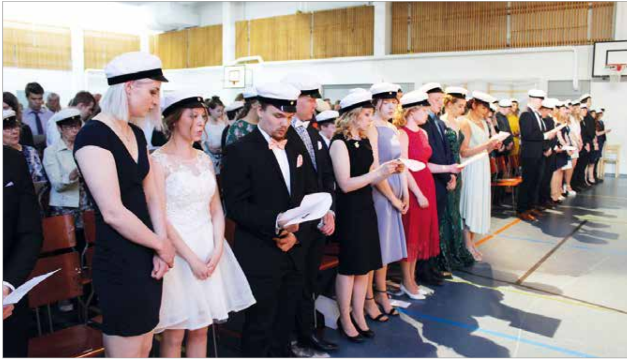
Iin lukiossa sai tänä vuonna valkolakin 36 uutta ylioppilasta.