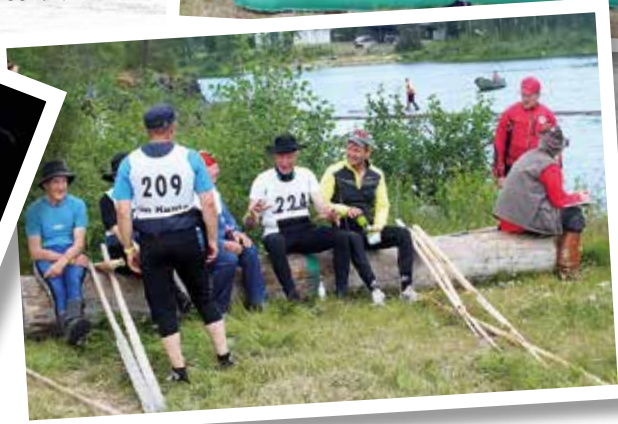
Perheen pienimmille alueella on monenlaista toimintaa.