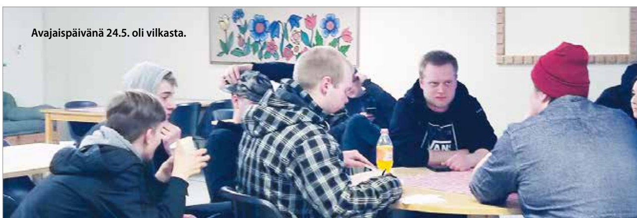
Avajaispäivänä 24.5. oli vilkasta.