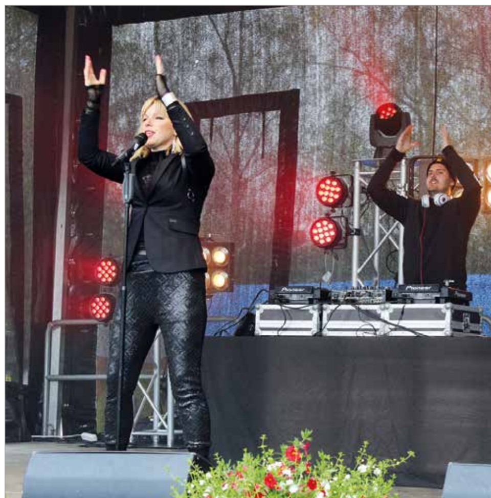
Pandoran esitys sai monet palaamaan muistoissaan 90-luvun tunnelmiin.