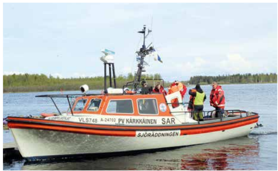
Iin Meripelastajien aluksella nuoret saivat tietoiskun turvallisesta vesillä liikkumisesta.