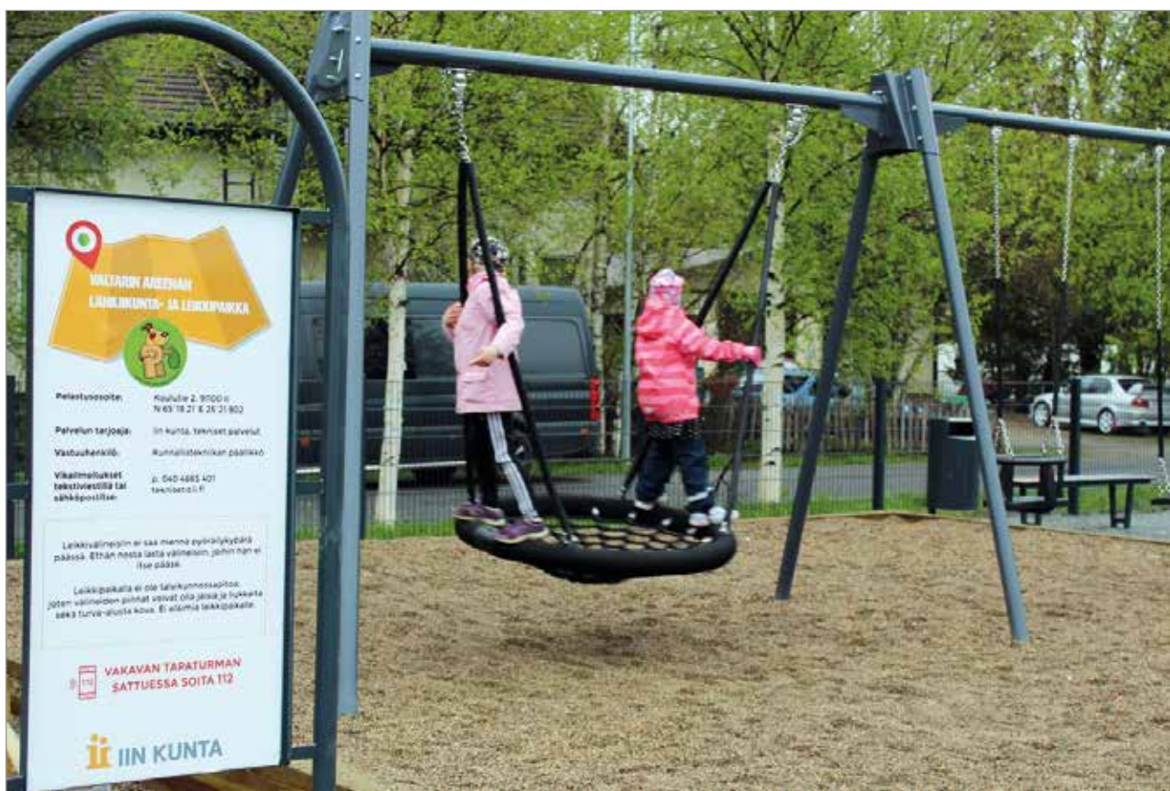
Valtari Areenan liikunta- ja leikkipaikka oli ahkerassa käytössä.