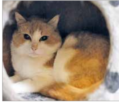
Bät, Mät ja Kät ovat majoitettu lihin ja tarvitsivat uuden kodin.