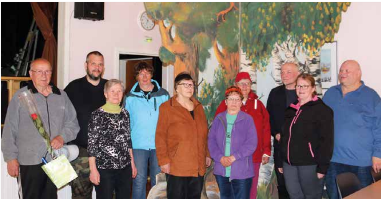
Kevätkokouksen osallistajat yhteiskuvassa Roolinvaihtajien kesänäytelmän lavasteen edessä.