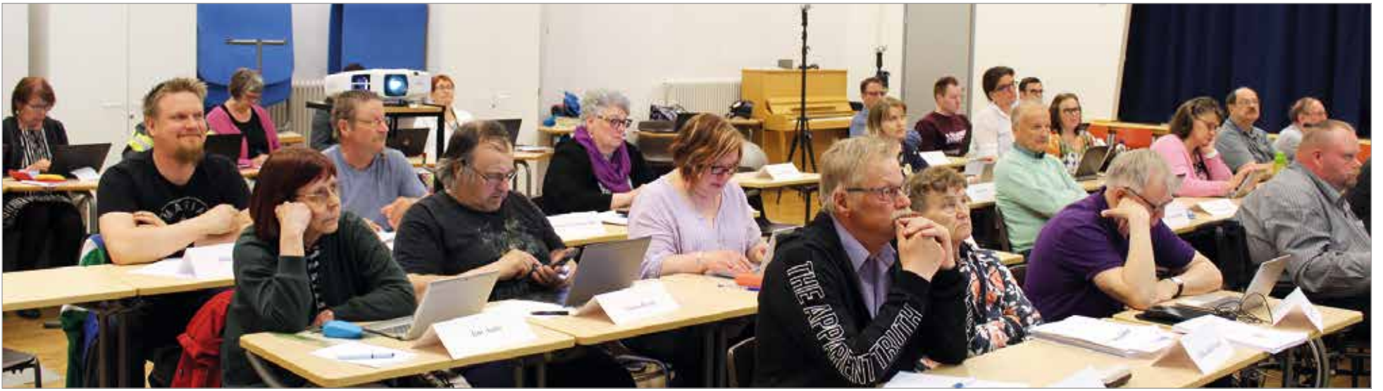
Kunnanvaltuusto kokoontui tilinpäätöskokoukseensa Valtarin koululle.