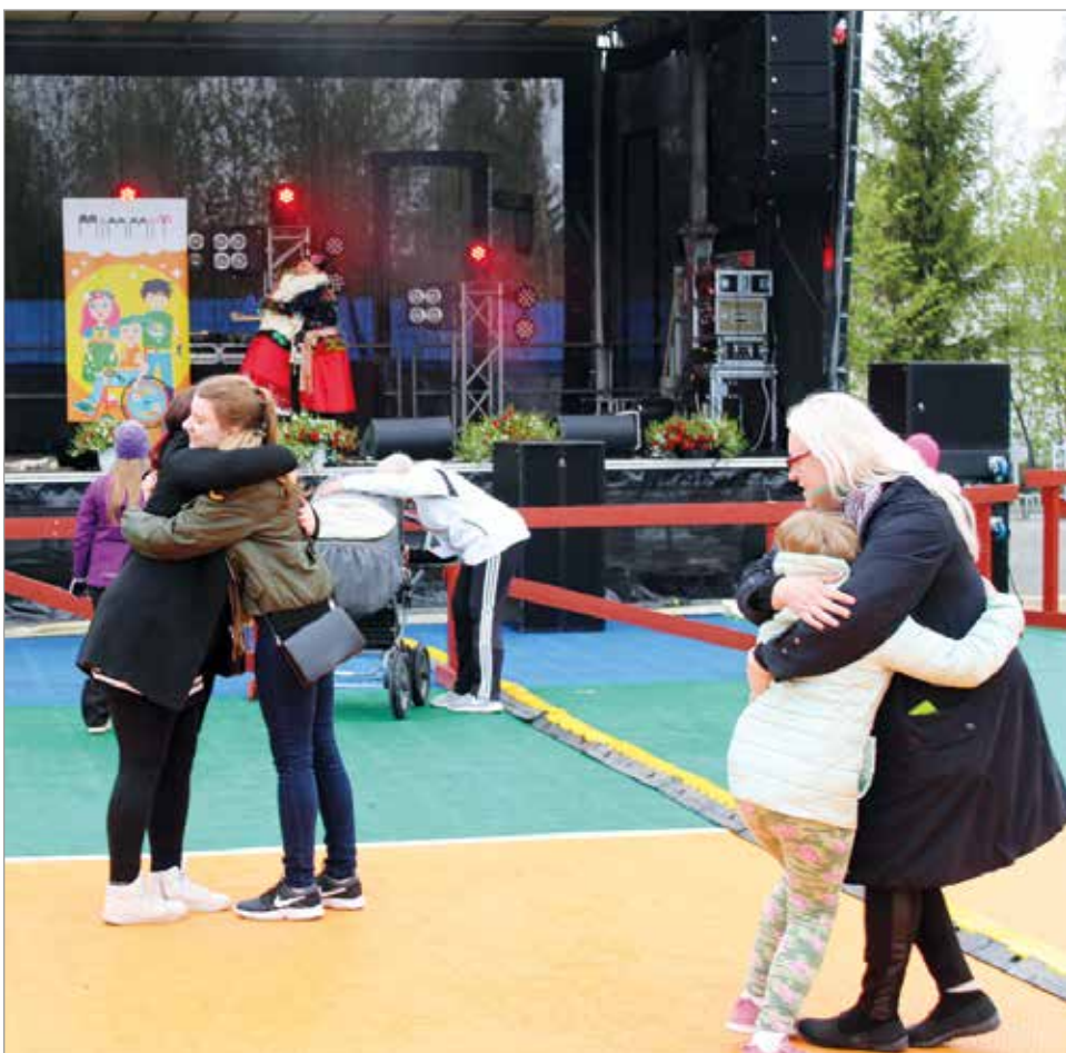
Mimmien esitys liikutti yleisöä halauksista hyppyihin.