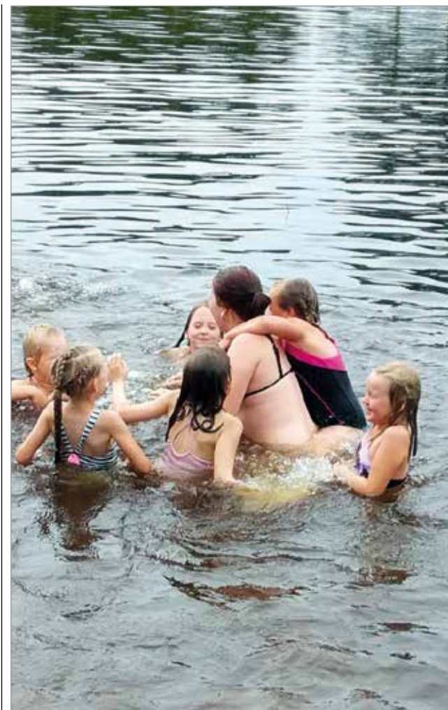
Perinteiset leirijutut kuten uinti löytyvät leiriohjelmasta.