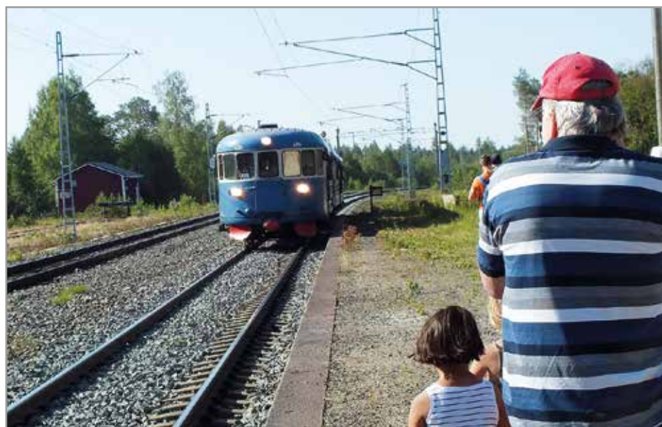
Tänä vuonna Pitäjämärkinoille pääsee Oulusta ja Kemistä lättähattulla lauantaina.