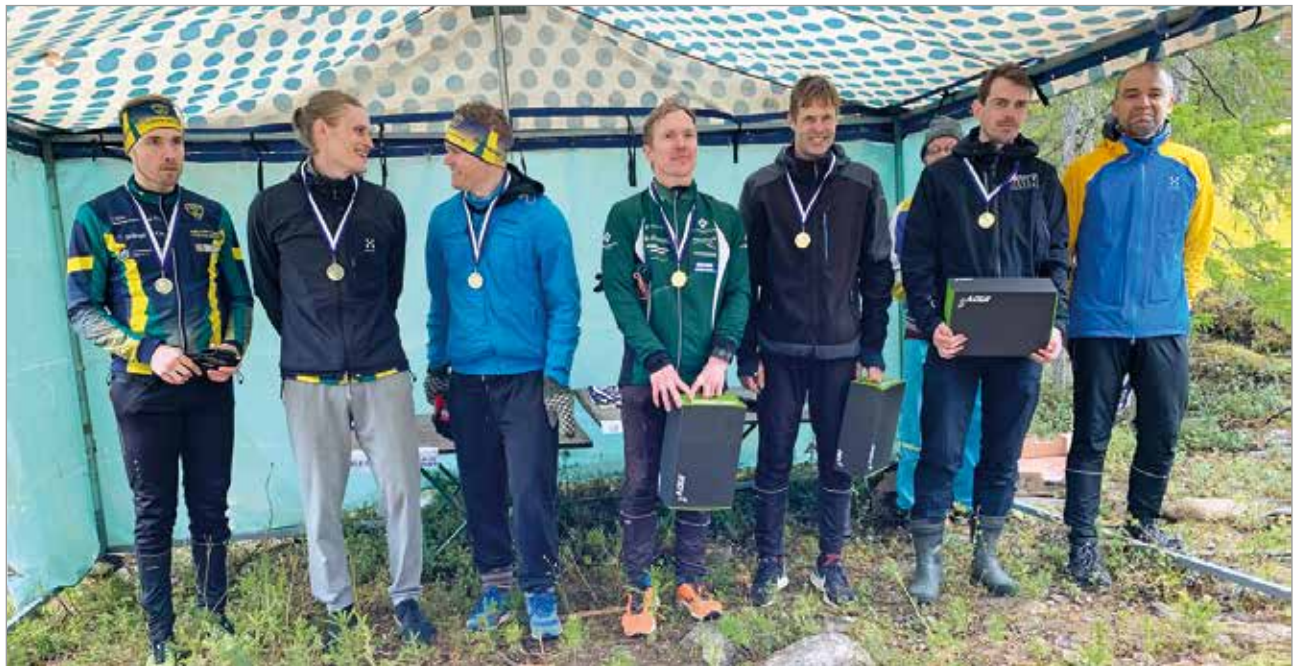
H21 sarjan kolme parasta joukkuetta. Vasemmalta Pellon Ponsi, SK Pohjantähti 1, sekä SK Pohjantähti 2, josta vain ankkuri ehti kuvaan.