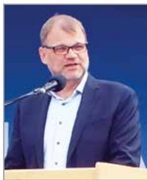
Vuosikymmenten varrella markkinoilla on nähty monia maan huippupoliitikkoja. Vuoden 2018 Pitäjämärkinat avasi pääministeri Juha Sipilä.