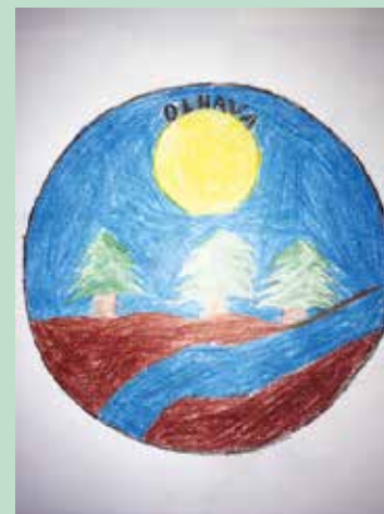
3. palkinto Leevi Ponto