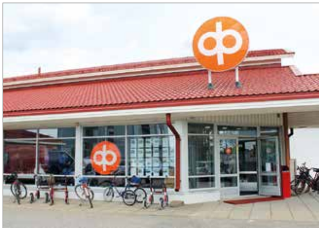
OP Oulu lin konttori sijaitsee Kirkkotiellä lin keskustassa.