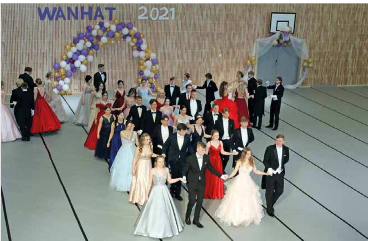
Vanhain tanssit ovat samalla suuri pukujuhla.