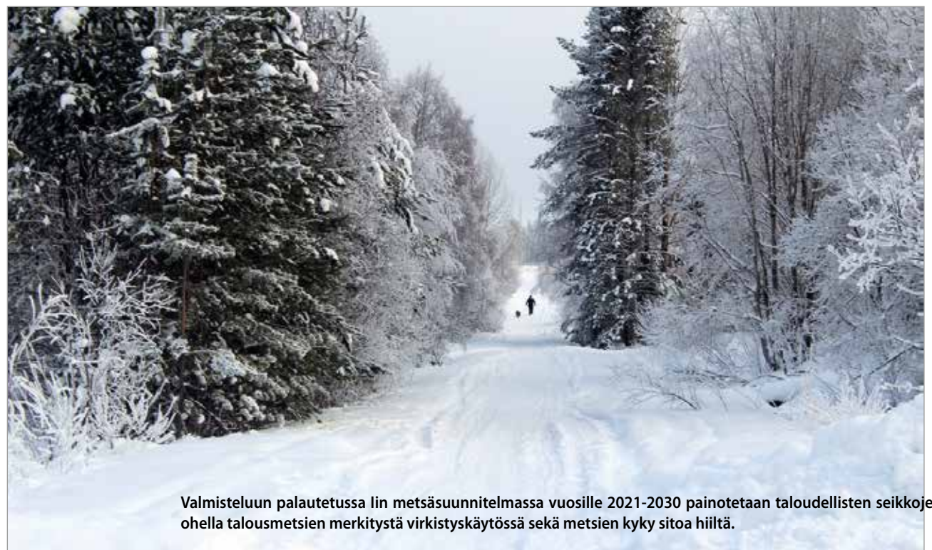
Valmisteluun palautetussa Iin metsäsuunnitelmassa vuosille 2021-2030 painotetaan taloudellisten seikkojen ohella talousmetsien merkitystä virkistyskäytössä sekä metsien kykyä sitoa hiiltä.