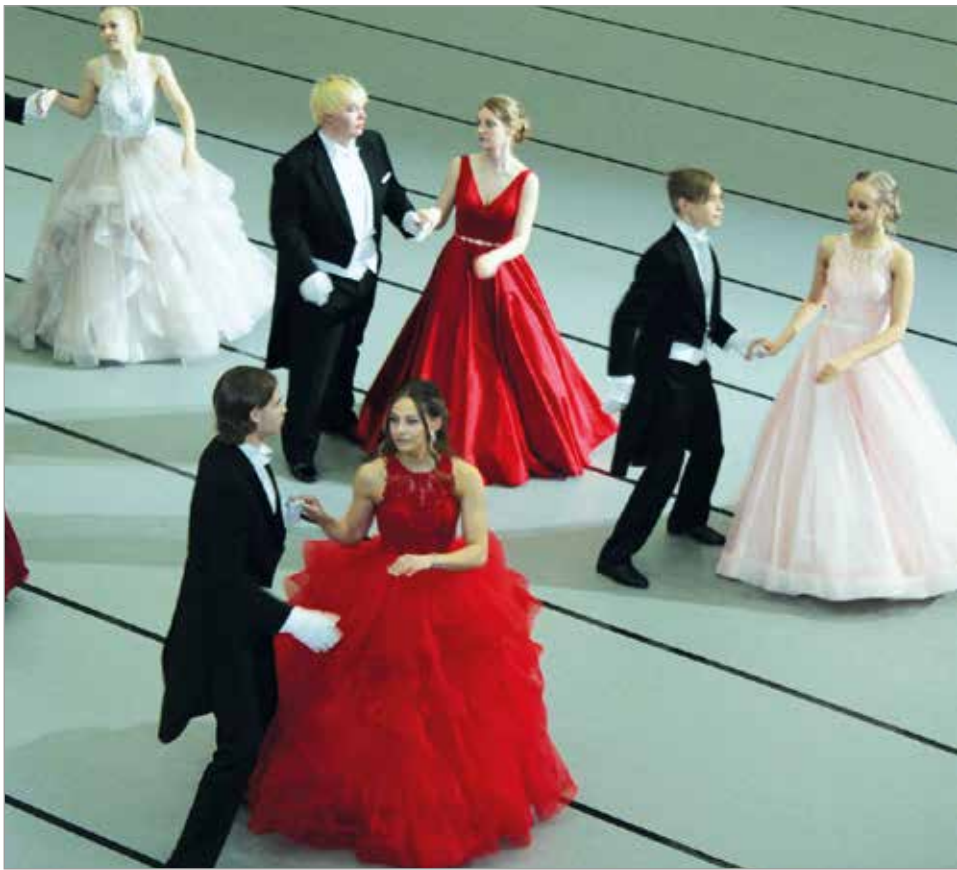
Valssi kuuluu ilman muuta vanhain tansseissa tanssittaviin tansseihin.