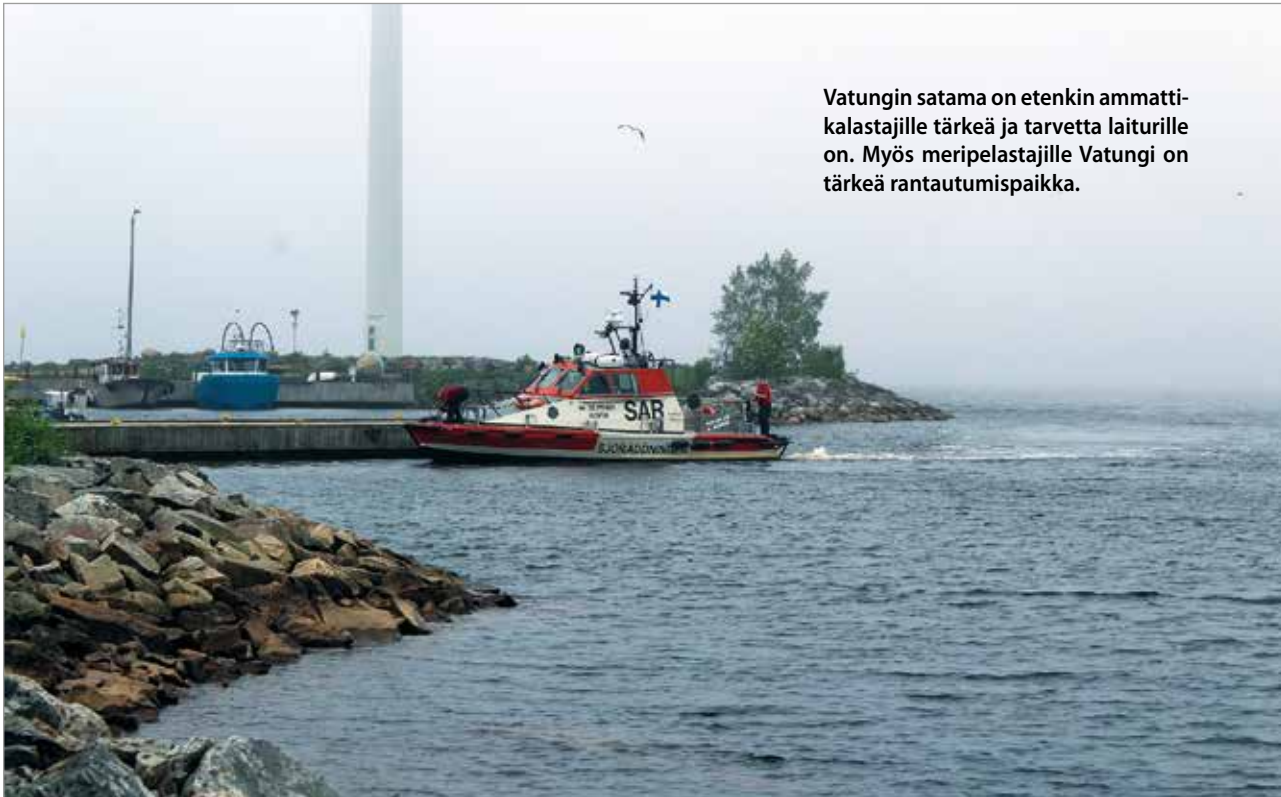
Vatungin satama on etenkin ammattikalastajille tärkeä ja tarvetta laitureille on. Myös meripelastajille Vatungi on tärkeä rantautumispaikka.

mattilaiturin toimittajaksi kokonaisedullisimman tarjouksen tehneen A-Laiturit Oy:n, jonka tarjoushinta on 95 739 euroa. MTR