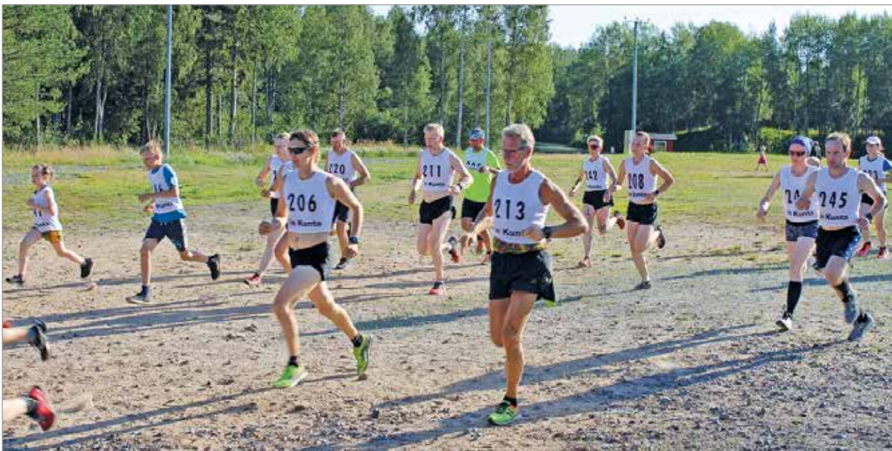
Perinteiset Illinjuoksut toteutuvat tänäkin vuonna.

Kansallisia GB-kilpailuja yleisurheilussa ei tänä vuonna koronatilanteesta johtuen järjestetä. MTR