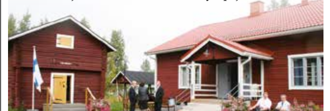
MUSEON AUKIOLOAJAT: KESÄKUU: Avoimna 8.6.-30.6 ti, ke ja to klo 12-17. HEINÄKUU: Avoimna 1.7.-31.7. ti-la joka päivä klo 11-18. Vapaa pääsy!

Lapset on erityisesti huomioitu uudessa näyttelyssä, ja sinne on esimerkiksi teetetty hurmaava minikokoinen leikkileivinuuni lasten leikkeihin. Leikkileivinuuni, kuten suuri osa muistakin näyttelyrakenteista on teetetty Iipajalla.