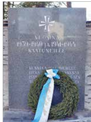
Kaatuneitten muistopäivän seppelä Iin sankaristilla.

Vallitsevista poikkeusoloista johtuen Kaatuneitten muistopäivän juhlallisuuudet järjestettiin tänä vuonna ilman yleisöä. Kaatuneitten muistopäivää vietetään vuosittain toukokuun kolmantena sunnuntaina kaikissa Suomen sodissa ja rauhan- turvaustehävissä menehtyneiden kunniaksi.