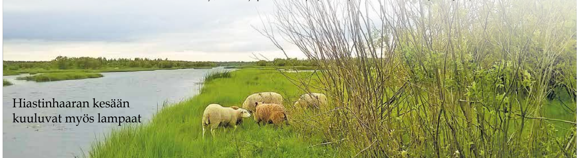
Hiastinhaaran kesään kuuluvat myös lampaat