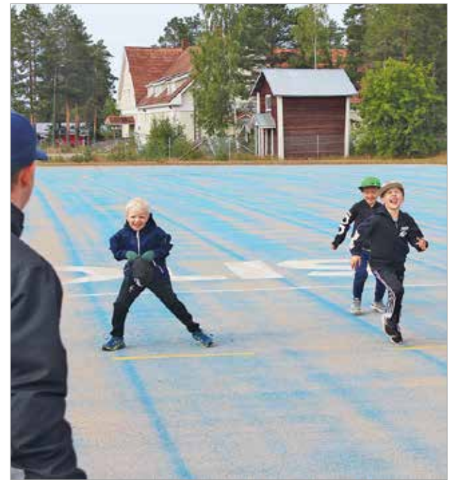
Tänäkin kesänä Iin pesäpallokentällä nähdään iloista pesäpallotoimintaa, kuten kesän 2019 pesiskoulussa.