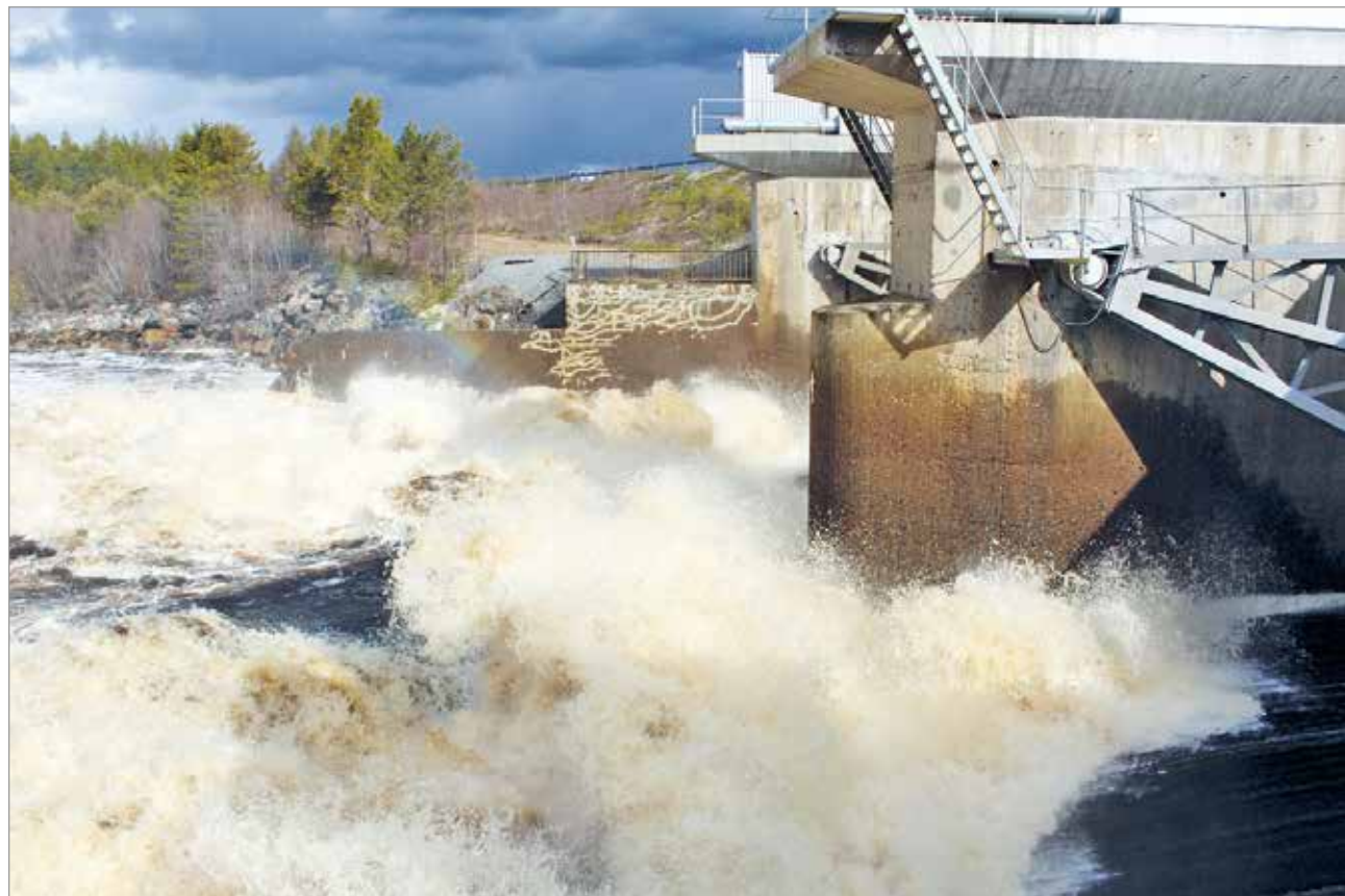
Raasakan säännöstelypadolta on vettä juoksutettu vanhaan uomaan 400 kuutiometriä sekunnissa. Hetkellisesti voidaan joutua juok- suttamaan jopa 1000 kuutiota.

- Hetkellisesti voimme joutua juoksuttamaan van- haan uomaan jopa 1000 kuutiometriä sekunnissa, Raasakan voimalaitoksen yläpuolen puhdistamisen ajaksi. Sinne kertyy tulvan mukana kaikenlaista roi- maa, Sipilä toteaa kevään etenemisestä voimayhtiön näkökulmasta. MTR