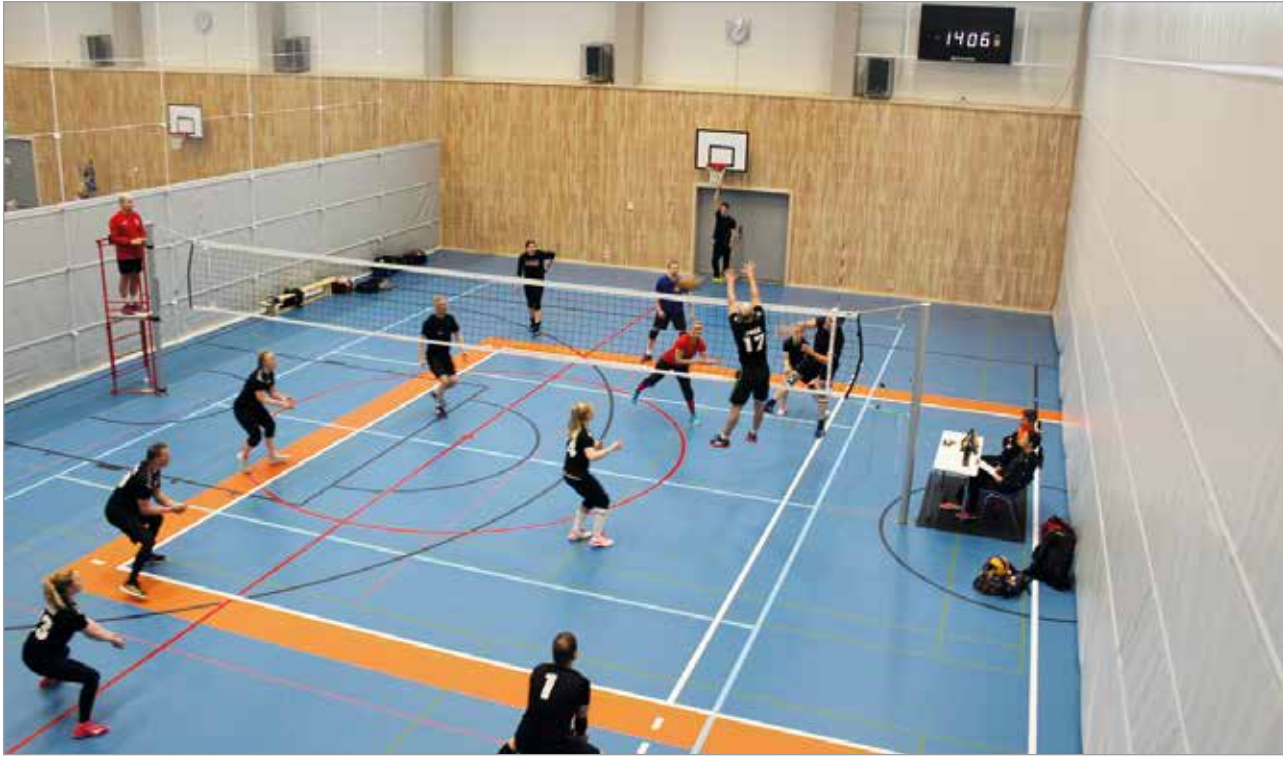
Kokoontumisrajoitusta salliessa 50 henkilön kokoontumiset, avautuu Iisi areena käyttöön kesäkuun alussa.

Liikuntahalli avautuu kesäkuun ajaksi arkipäiviksi, noudattaen valtioneuvoston ja aluehallintoviraston kokoontumis- ja hygieniaoheita. Museo avautuu kesäkuun alkupuolella ja kesän aikana yläkerrassa on esillä uusi näyttely. Jos tilanne normalisoituu, avautuvat toiminnot syksyllä normaaliin tapaan vapaa-aikapalveluiden eri sektoreilla. MTR