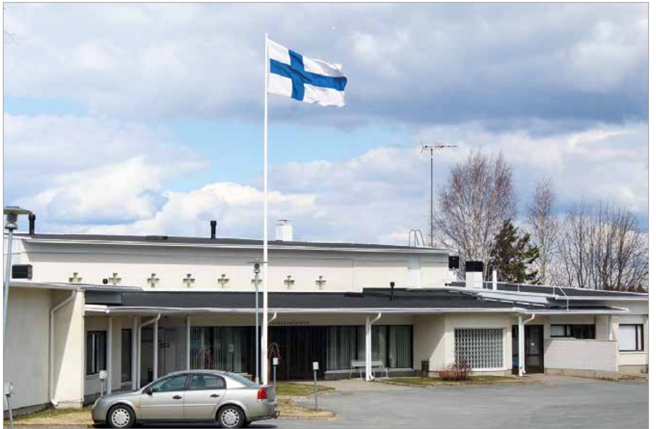
Sodissa kaatuneitten muistolle liputettiin myös Iin seurakunnan toimesta

YRITTÄJÄ! Ilmoita liSanomien Palveluhakemistossa.