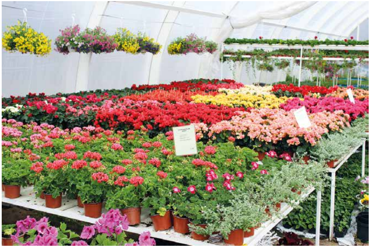
Jokivarren puutarha hehkuu kukkaloistoa, etualalla tulppaanipelargonioita.