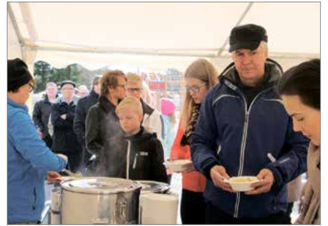
Juhlan jälkeen välittömästi alkoi lohikeiton tarjoilu useassa eri pisteessä ja jälkiruoaksi oli täytekakkukahvit.

Pohjois-lin koulun 120-vuotisjuhla ja Pohjois-lin Kyläyhdistyksen 30-vuotisjuhla vietettiin sunnuntaina 7.5. Pohjois-lin koululla. Koulun pihalle oli pystytetty suuri teltta istuimiseen ja esiintymislavoineen.