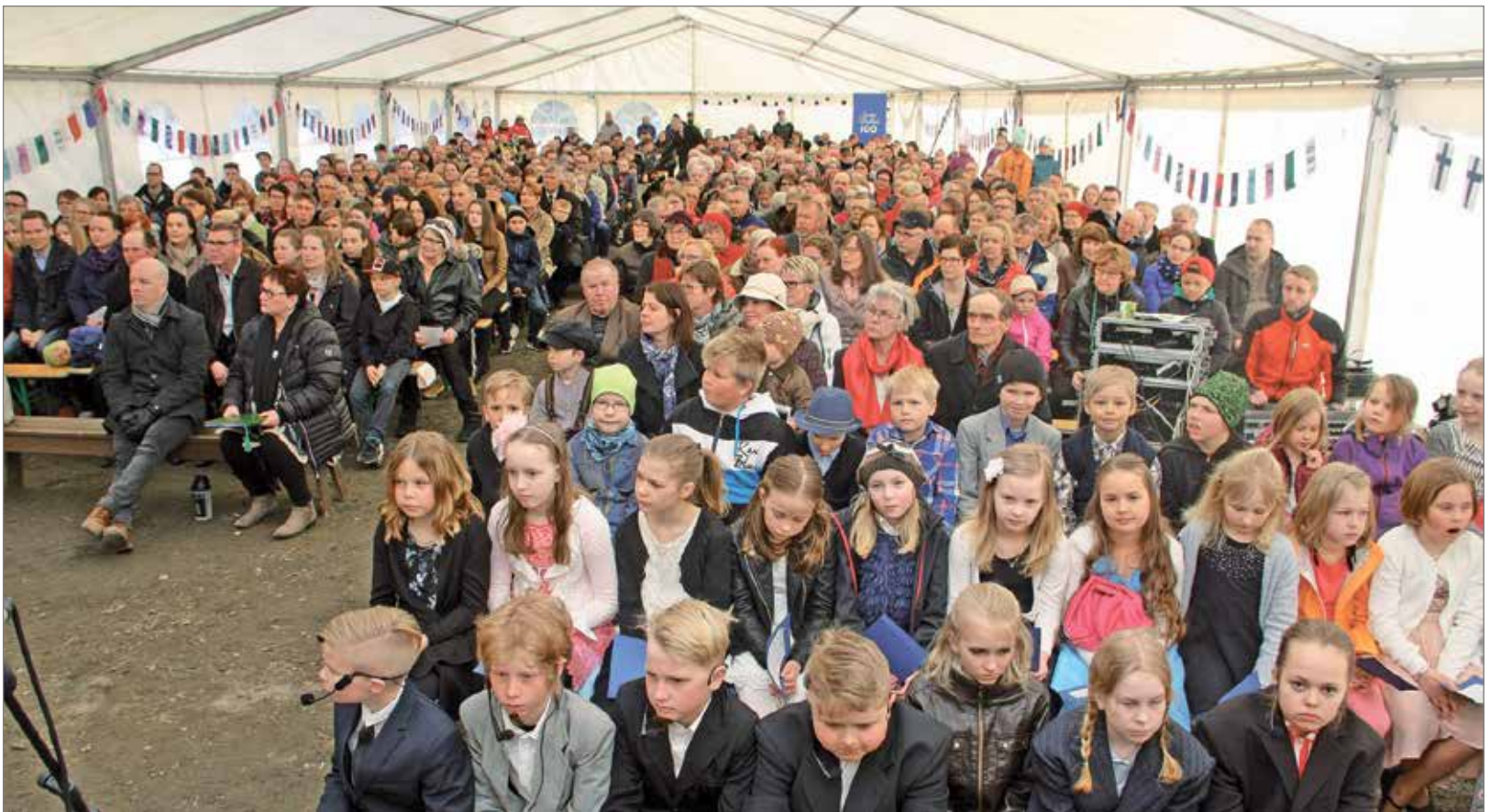
Juhlaleisöä oli juhlateltan täydeltä, noin 500 henkeä.

Näytelmän alkupuolella kerrotaan kuinka suomalainen ja sitä myöten Iiläinen kansakoulu perustettiin. Koulun perustaminen Iihin ei ollutkaan mikään helppo juttu, sillä ensimmäisen koulun perustamisesta käytiin kunnanvaltuustossa kova vääntö. Koulun rakentamisen kannattajat saivat