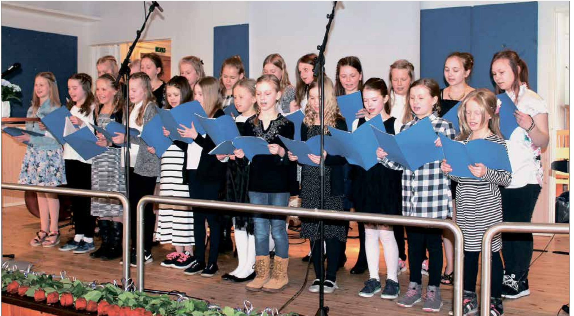
Haminan koulun kuoro esiintyi veteraanipäivän tilaisuudessa.