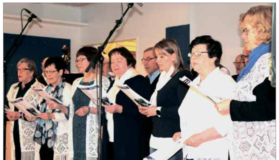
Iin ja Kuivaniemen pelimanneilla oli mukanaan paljon laulajia.