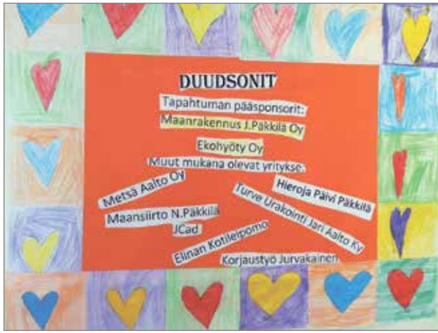
Koululaisten tekemä "sponsoritaulu". Siinä ovat yritykset jotka ovat tukeneet Duudson-tapahtumaa.

Jakun koululla kävi tiistaina 25.4. Duudsonit. He kertoivat Duudsonien syntytarinaa, että mistä kaikki on lähtenyt. Koululla oli H.P ja Jarppi, koska muilla oli töitä. Duudsonit kertoivat koulukiusaamisesta ja siitä, miten he tulivat ystäviksi. He kertoivat myös heidän tarinaa. Duudsonit käskivät haaveilla ja unelmoida sekä säilyttää lapsenmielisyyttä.