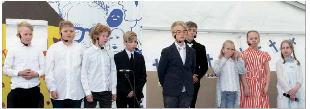
Oppilaiden esittämä "Juhlapuhe" eli muutama tarina menneistä.