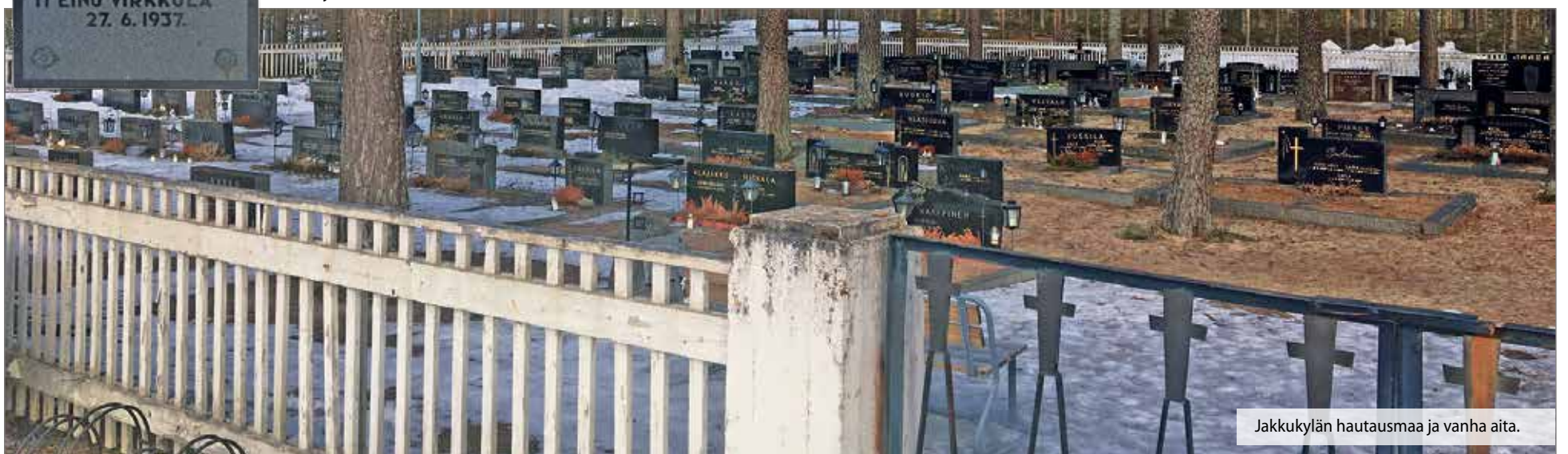
Jakkukylän hautausmaa ja vanha aita.