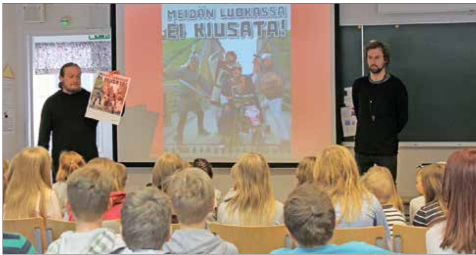
Koululaiset kuuntelivat kiinnostuneena Duudsonien Jarppia.