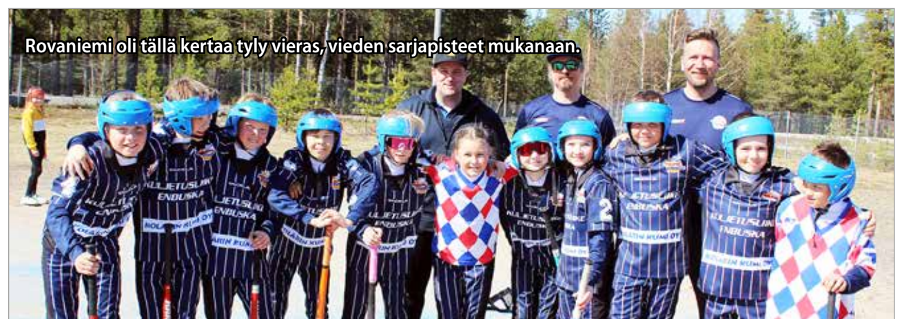
Rovaniemi oli tällä kertaa tyyli vieras, vieden sarjapisteet mukanaan.

hienoja suorituksia pystyivät molemmat joukkueet yleisölle esittämään. Taiston tauottua taululla olivat Rovaniemen voitonumerot 2-0 (8-3, 12-6). Iin joukkueen otteet antoivat kuitenkin lupausta hyvästä kaudesta, joka jatkuu kahden viikon kuluttua Kempeleessä. MTR