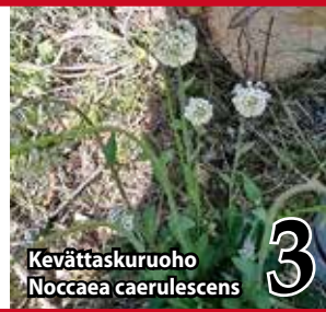
Kevättaskuruoho Nocca caerulea