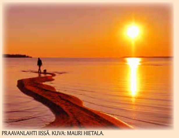
PRAAVANLAHTI IISSÄ.

lukijoiden palaute ja jutut: vkkmedia@vkkmedia.fi