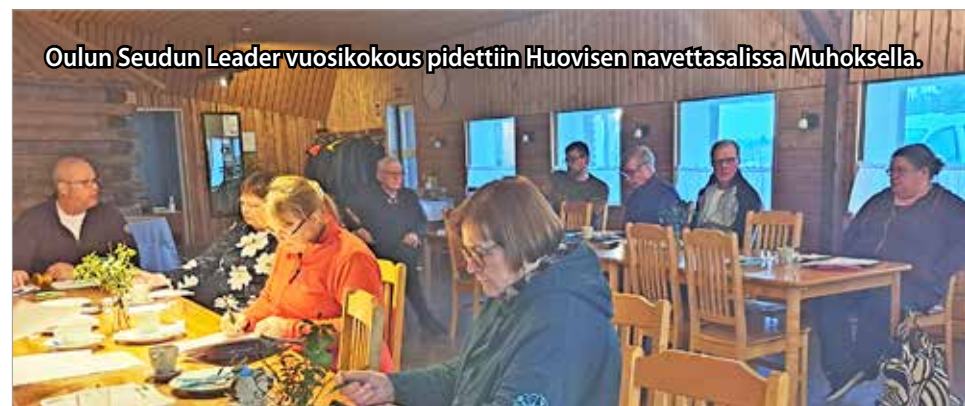
Oulun Seudun Leader vuosikokous pidettiin Huovisen navettasalissa Muhoksella.