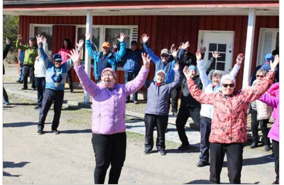
Kolmen eläkeläisyhdistyksen liikuntapäivä oli hyvin lämminhenkinen tapahtuma ja paikalla oli noin 80 eläkeläistä. Jumppatuokion loppuksi ilmaistiin iloa kehon avulla.