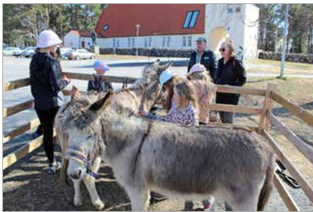
Aasit olivat lasten suosikkeja, joita rapsuteltiin porukalla.