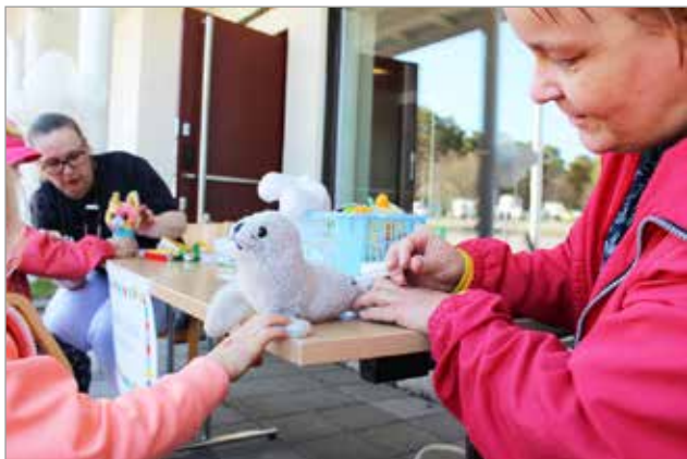
Pehmoneuvolassa Mimmi-hylkeellä todettiin kaiken olevan kunnossa.

pehmoneuvola, ongintaa ja arpajaiset. Lapset ja vanhemmat nauttivat tilaisuudesta, tuoton mennessä Yhteisvastuukeräykseen. MTR