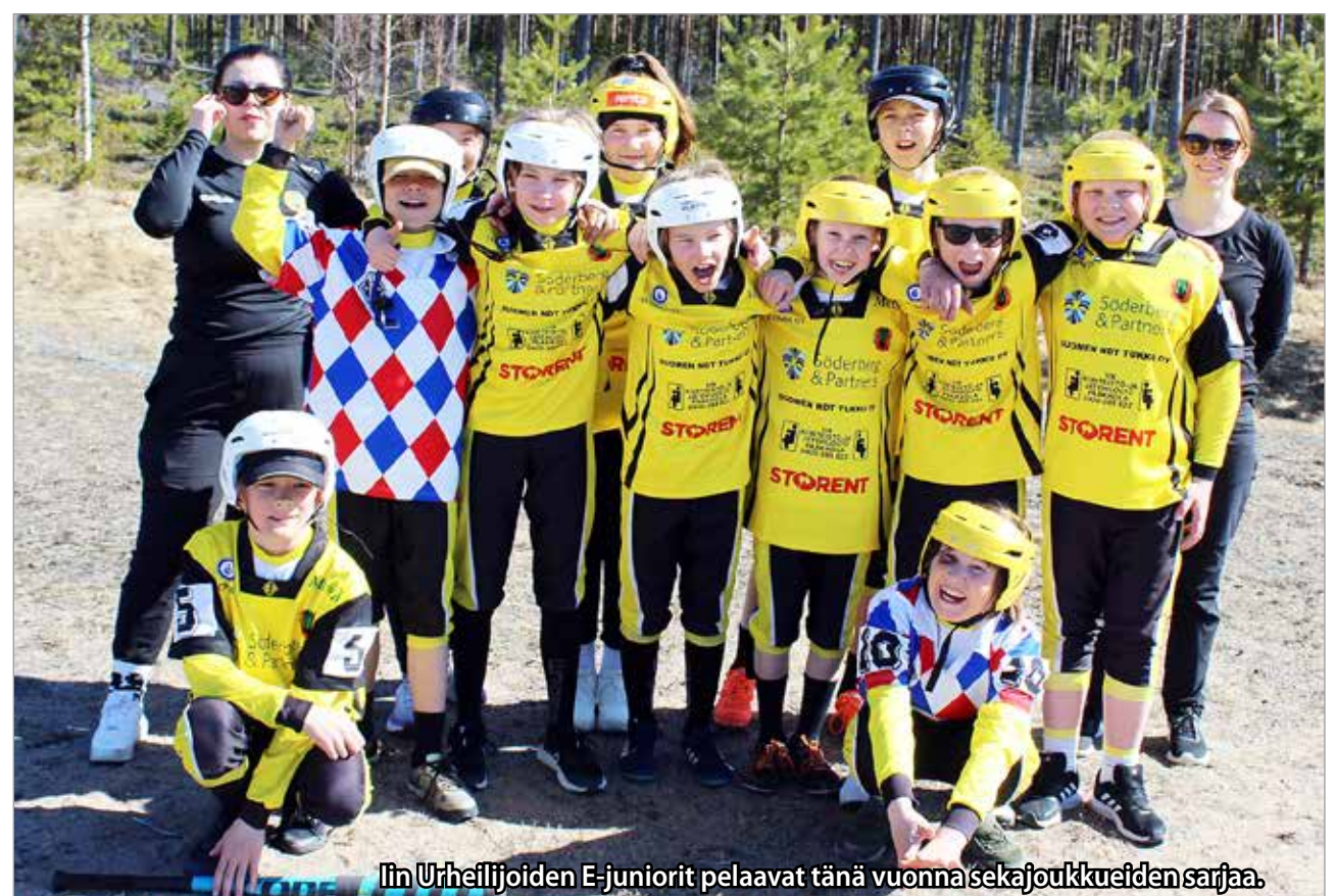
Iin Urheilijoiden E-juniorit pelaavat tänä vuonna sekajoukkueiden sarjaa.