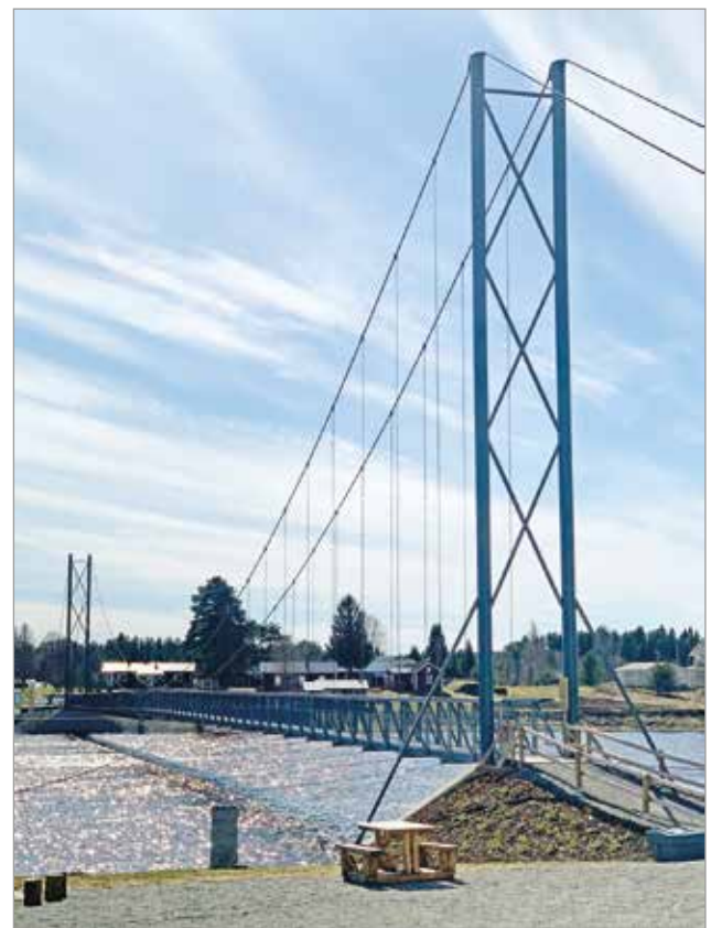
Siltakahvila sijaitsee Jakkukylän koulun ja sen viereen rakennetun riippusillan välittömässä läheisyydessä.

minut Siltakahvila, josta tuli nopeasti tykätty palvelu kyläläisten ja kauempaakin tutustumaan tulleiden kesäkuudessa. JK