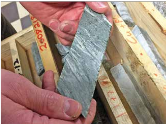
Sampolan tilaisuuteen oli otettu myös näytteille kairasydäntä, jota oli saatu Oijärven alueella aiemmin tehdyistä tutkimuksista.