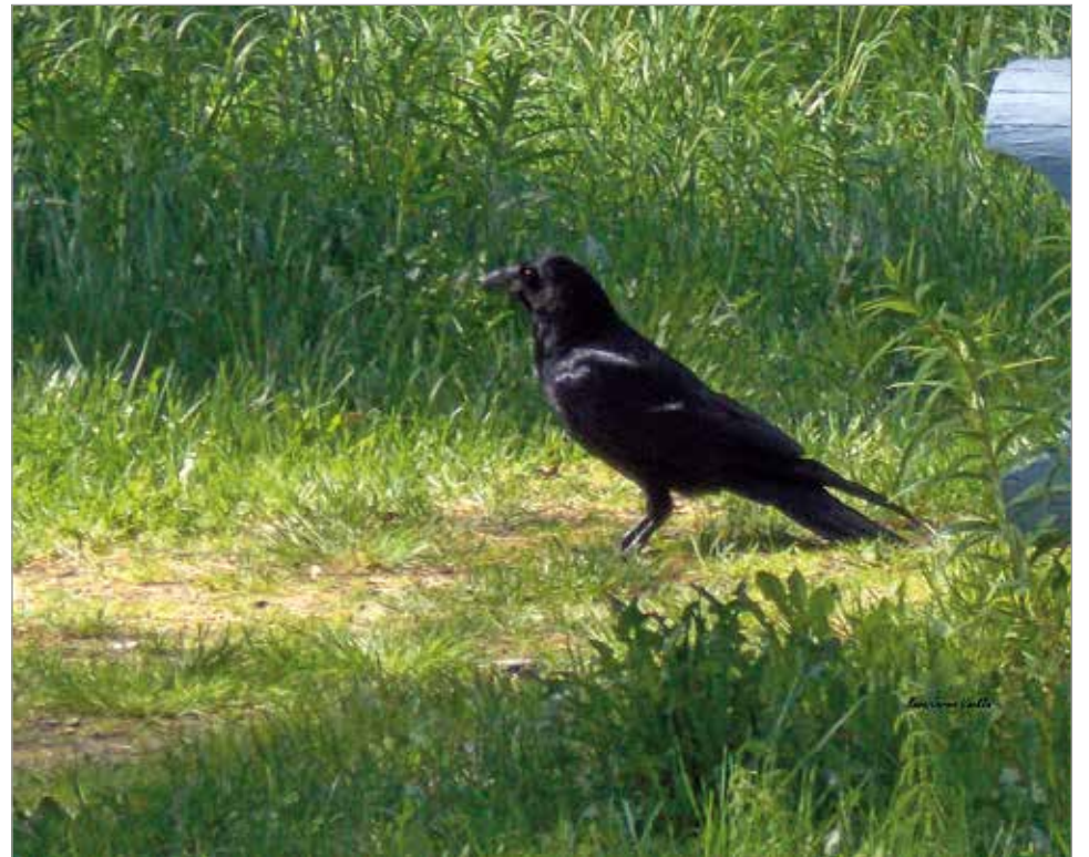
Korppien määrä on ilahduttavasti runsastunut viimeisten vuosikymmenien aikana.