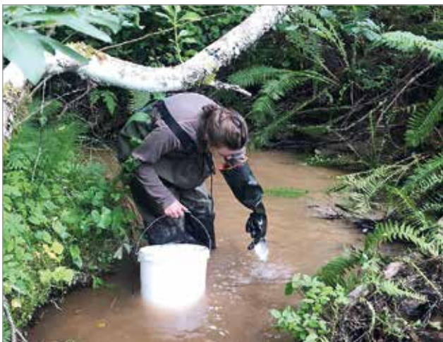
Maastossa voidaan kerätä näytteitä myös käsin, kuten tässä on esimerkki purosedimentin näytteenotosta käytännössä.