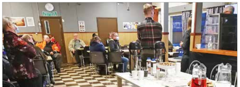
Tapahtuman kuulijoille oli tilaisuudessa tarjolla kahvia ja pientä purtavaa.