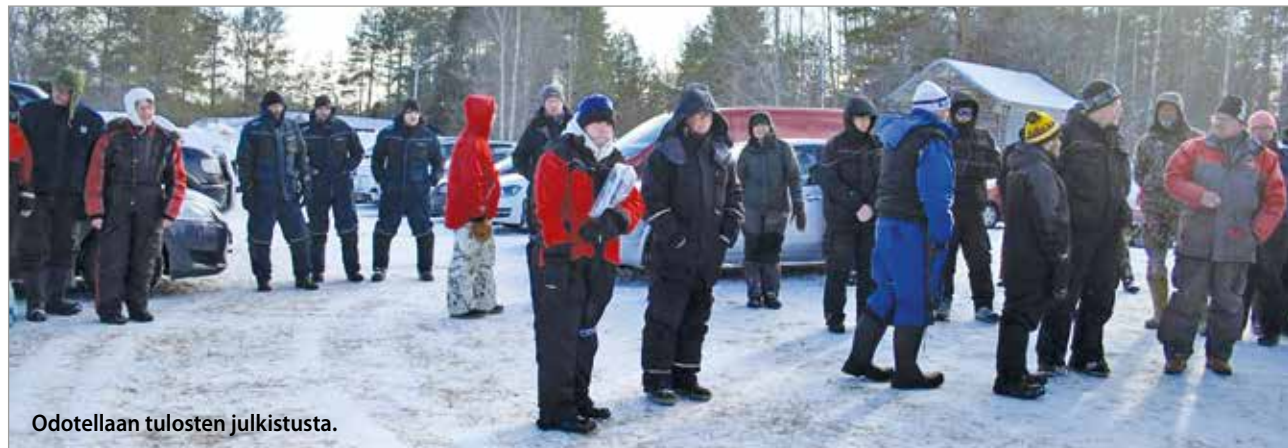
Odotellaan tulosten julkistusta.