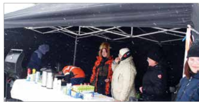
Buffetissa odotellaan asiakkaita.