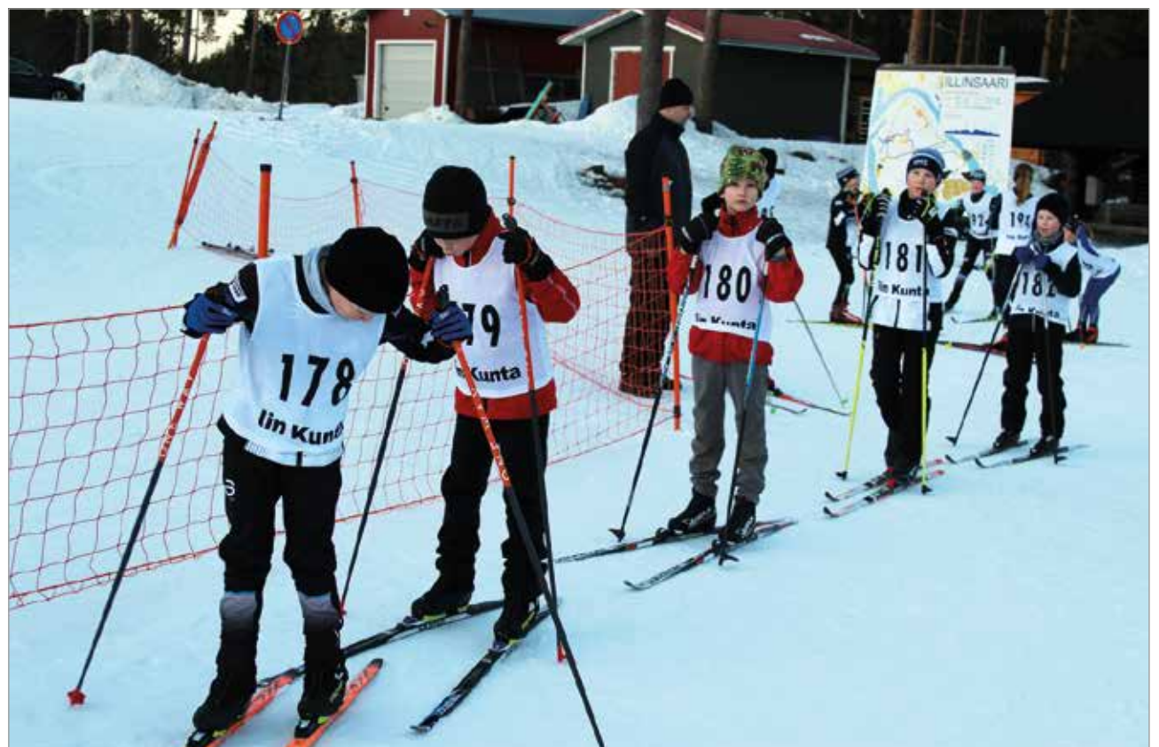
Lähtöpaikalla vaihdettiin kuulumiset ja aikaa oli katsoa kaverin siteiden olevan kunnossa ennen starttia.