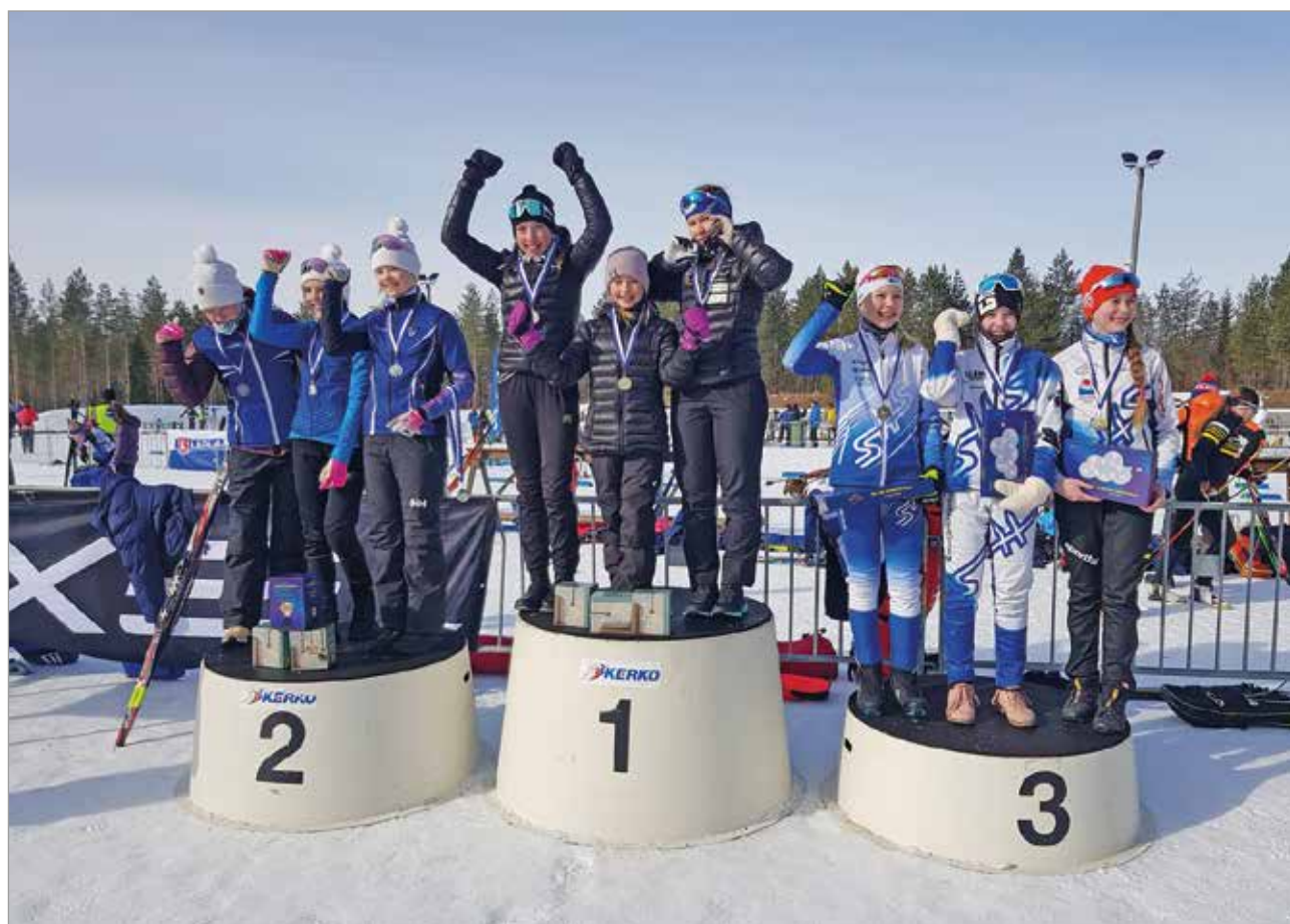
N13 3x3km ampumahihtoviestin mitalijoukkueet Tuusulan Voima-Veikot, Oulun Hiihtoseura ja Seinäjoen Hiihtoseura.