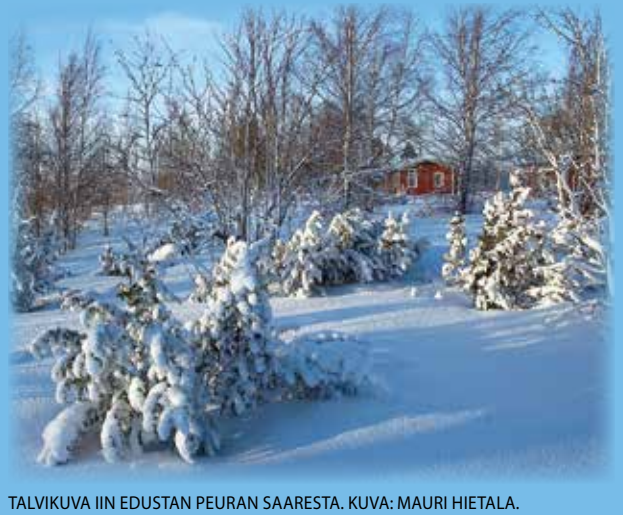
TALVIKUVA IIN EDUSTAN PEURAN SAARESTA.

lukijoiden palaute ja jutut: vkmedia@vkmedia.fi