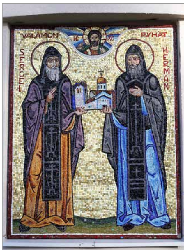
Pyhät Sergei ja Herman Valamolainen ovat Laatokan saarelle syntyneen ortodoksisen Valamon luostarin perustajat, arvonimeltään pyhittäjäisät, Valamon ihmeidentekijät, Karjalan valistajat.