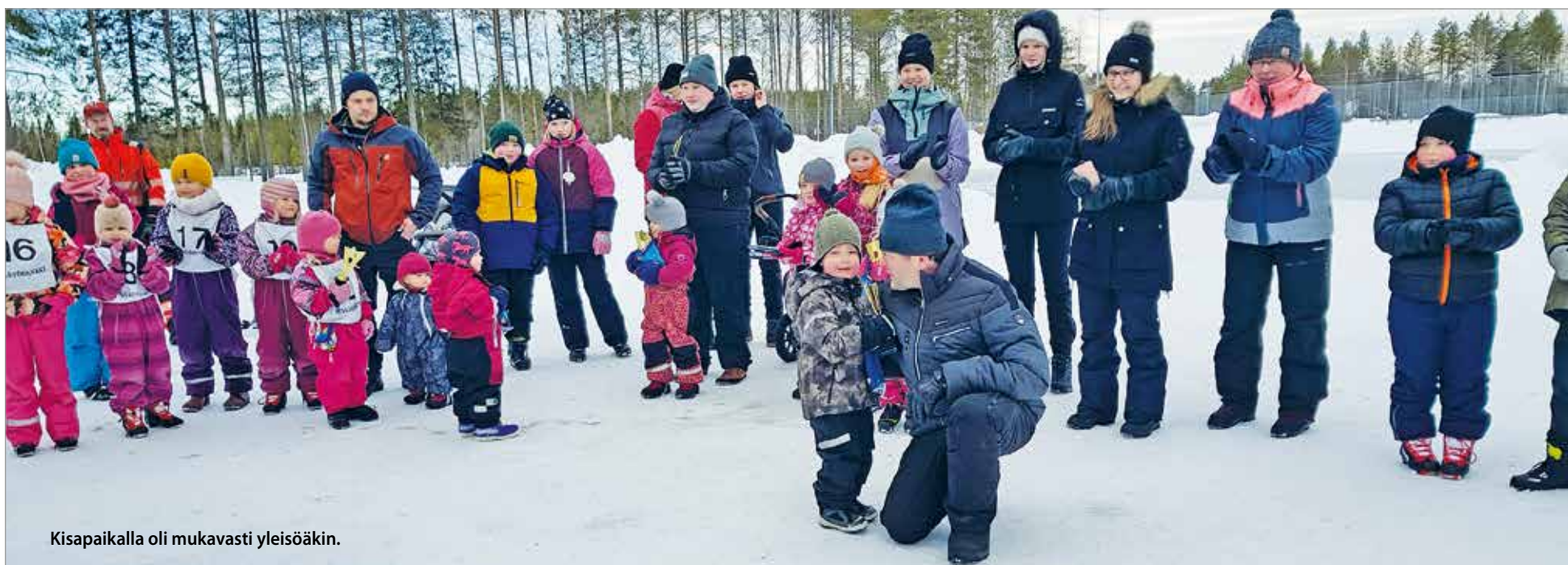
Kisapaikalla oli mukavasti yleisöäkin.