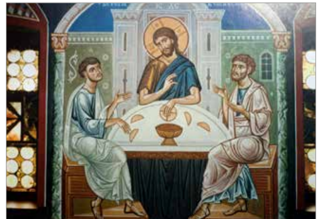
Pyhä lisak Syyrialainen: "Se, joka ei ole koskaan maistanut hunajaa, ei voi käsittää sen makua, vaikka hänelle sen kuinka selittäisi. Samoin hengelliset hyveet opitaan ymmärtämään vain kokemuksen kautta.