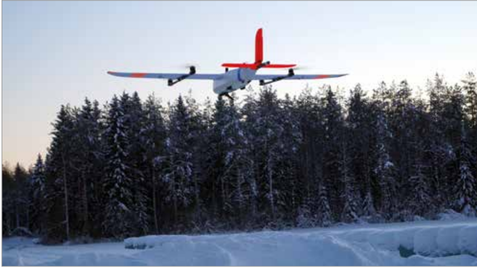
Kauko-ohjattavan koneen mukana ei ole ollenkaan kameraa, se kerää ainoastaan magneettista tietoa.