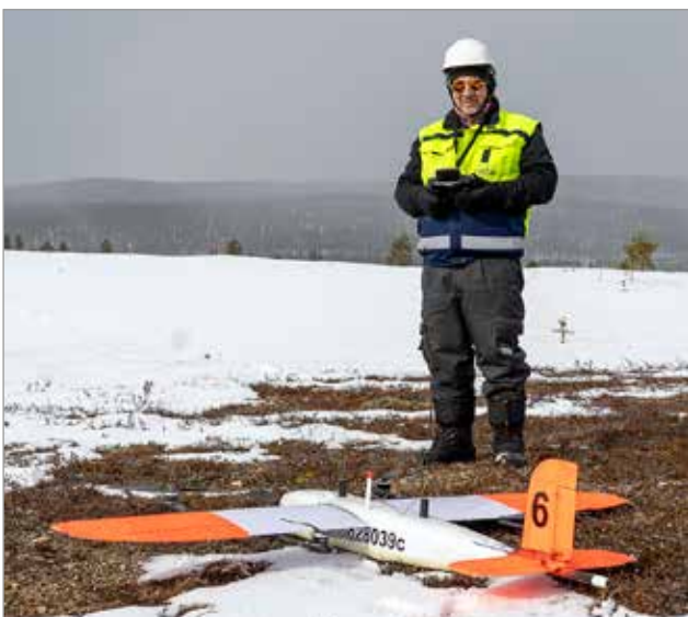
Tällaisilla drone-lennokeilla tehdään kartoituksia myös Oijärven geologisista ominaisuuksista tämän kevään aikana. Kuva otettu Ivalossa tehdyistä mittauksista.

Huhti- ja toukokuun aikana Oijärven alueella suoritetaan miehittämättömillä pienillä drone-aluksilla lentomittauksia, joilla on tarkoitus kartoittaa alueen geologisia ominaisuuksia. Aiheesta järjestettiin avoin info- ja keskustelutilaisuus Oijärven Sampolassa torstaina 17.3. Tapahtuma keräsi runsaasti osallistujia sekä paikan päälle että etäyhteyden välityksellä.