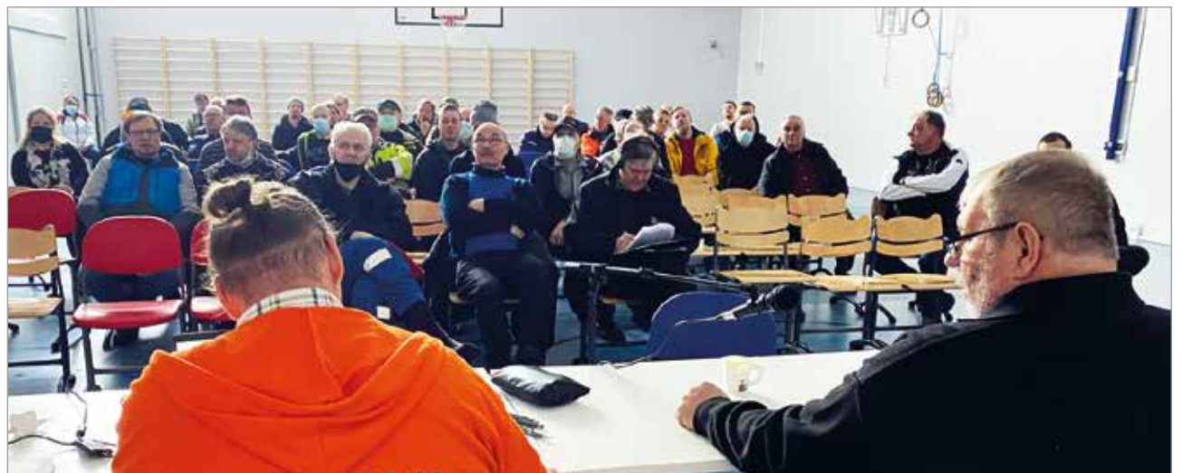
Yleisöä Kalastuspaikkojen huutokauppatilaisuudessa 26.3.2022.