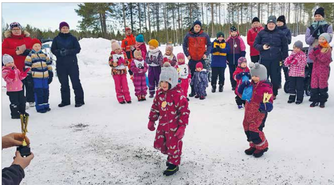
Palkintojen jako oli odotettu tapahtuma.