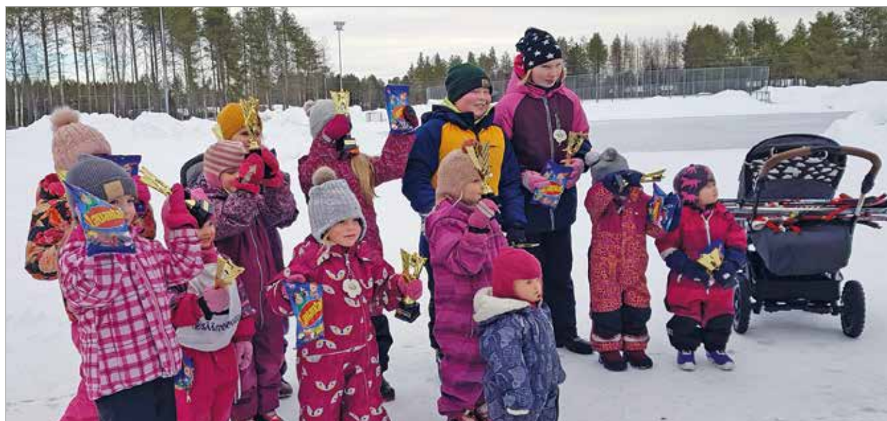
Osa palkinnon saajista.