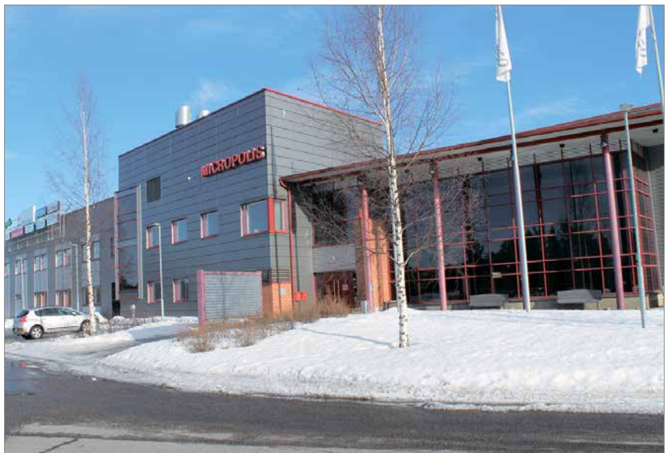
Iin Micropolis viettää tänä vuonna 20-vuotisjuhliansa.