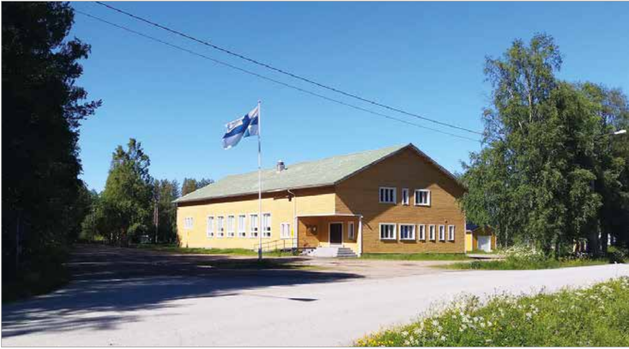
Kuivaniemen nuorisoseura sai alueemme suurimman korona-avustuspotin 5 000 euroa seurantalonsa ylläpitokuluihin.