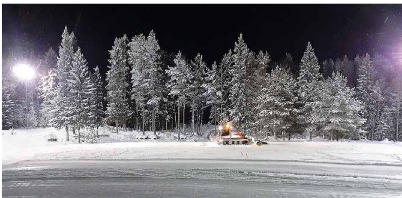
Hiihtämistä haitannut lumipula helpotti sopivasti mahdollistamaan lomalaisten hiihtoharrastusta.