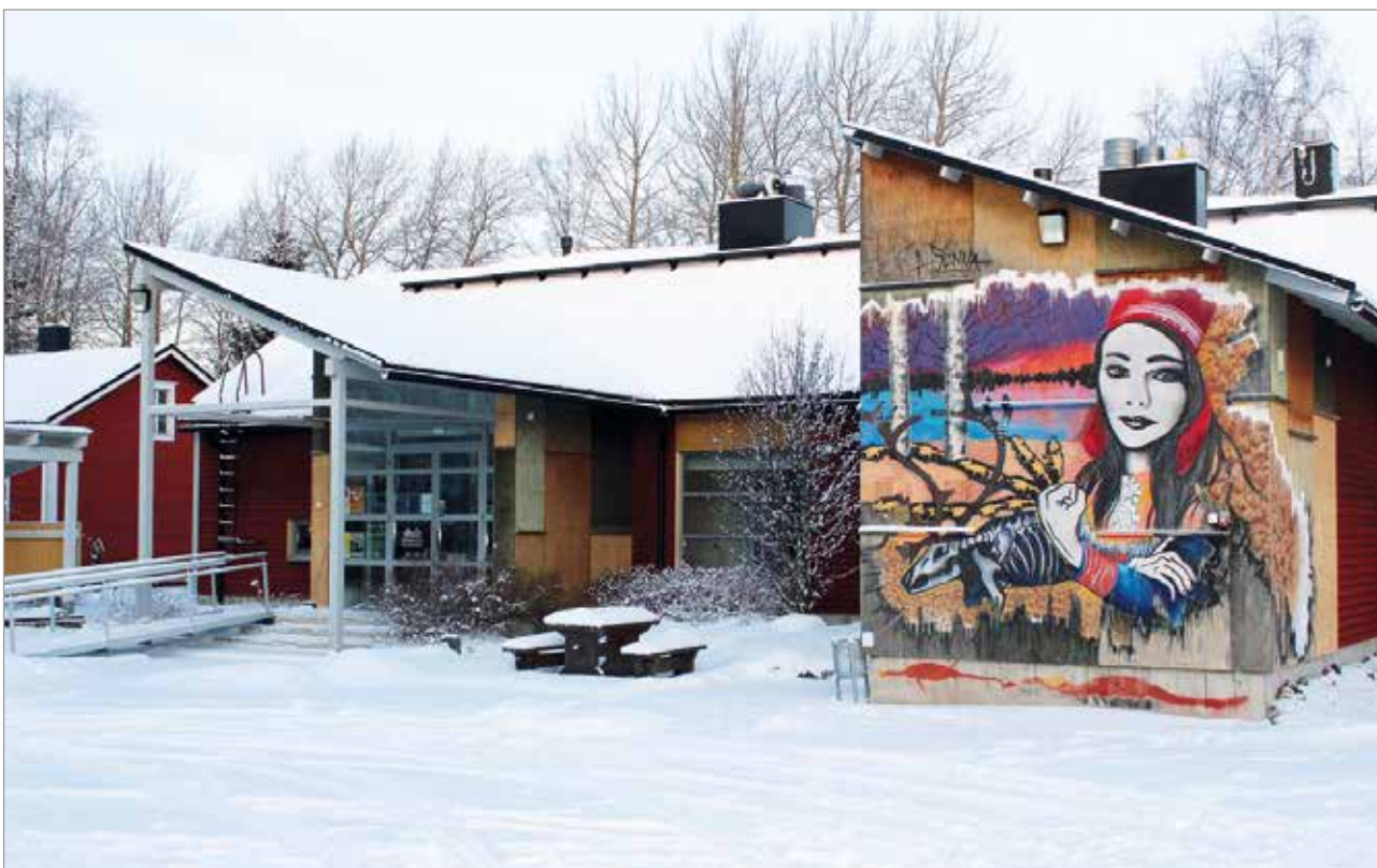
Taidekeskus KulttuuriKauppila osallistuu Pohjoinen kulttuurivirta -hankkeeseen.

Iin kunta/taidekeskus KulttuuriKauppila on ollut mukana suunnittelemassa Pohjoinen kulttuurivirta -hanketta yhteistyössä Oulun, Raahen, Haapaveden, Oulaisten, Taivalkosken, Pudasjärven, Kuusamon ja Limingan kanssa.