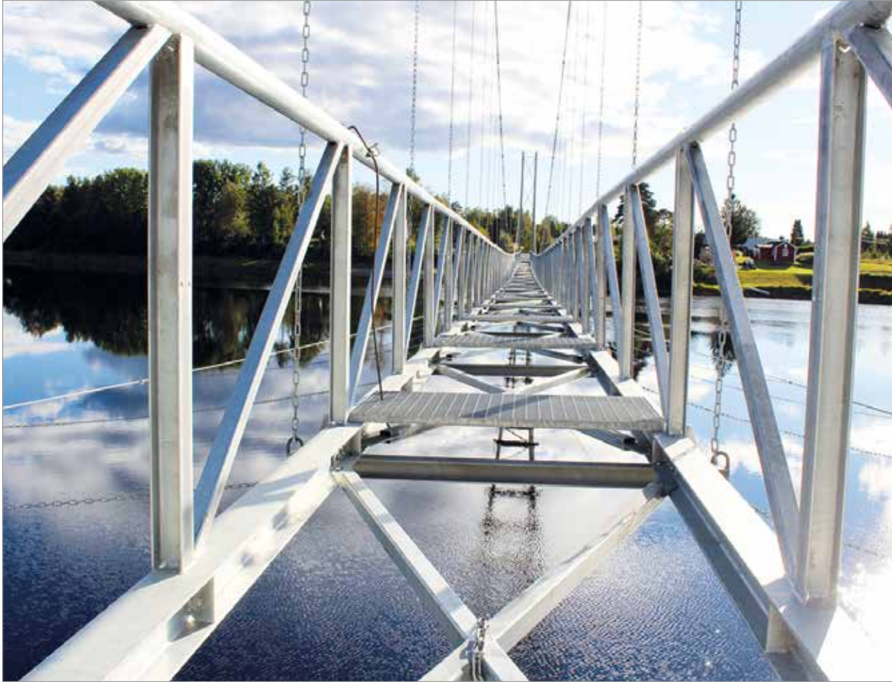
Jakkukylän riippusillan loppuun rakentamista ei kunnanhallituksen mielestä voida lykätä rahoituspäätöksestä tehdyn valituksen johdosta, vaarantamatta turvallisuutta.