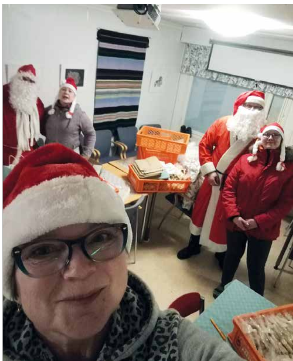
Pukki tonttuineen kierteli koko Olhavan seudun alueella.