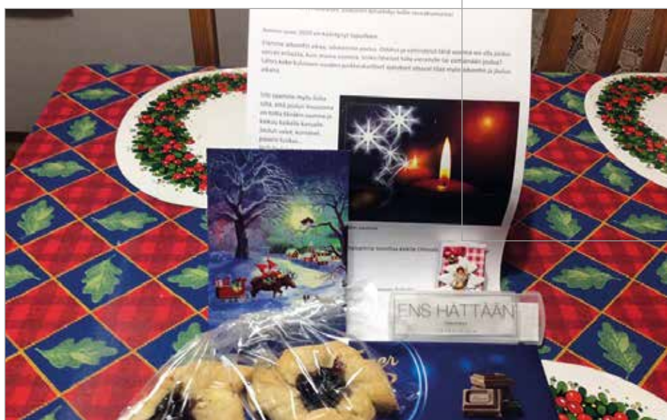
Olhavan seudun seniorit yllätettiin aattonaaton joulupusseilla.

Yllätyksenä tullut muistaminen lahjan kera sai lämpimän vastaanoton ja esimerkiksi Olhavan oma puskis täyttyi illan aikana kiitosviesteistä. MTR