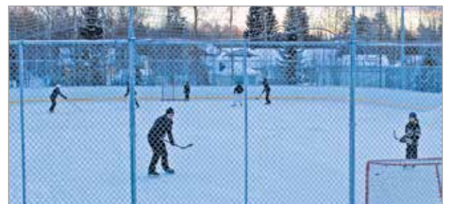
Valtari Areenan kaukalossa kokeiltiin joulupukin tuomia luistimia.

Nahkeasta pakkaskelistä huolimatta Illinsaaren laduilla riitti hiihtäjiä.