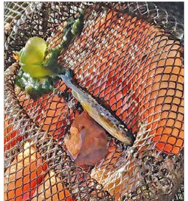
Luonnonuomasta löytynyt yhden kesän lohenpoikanen.