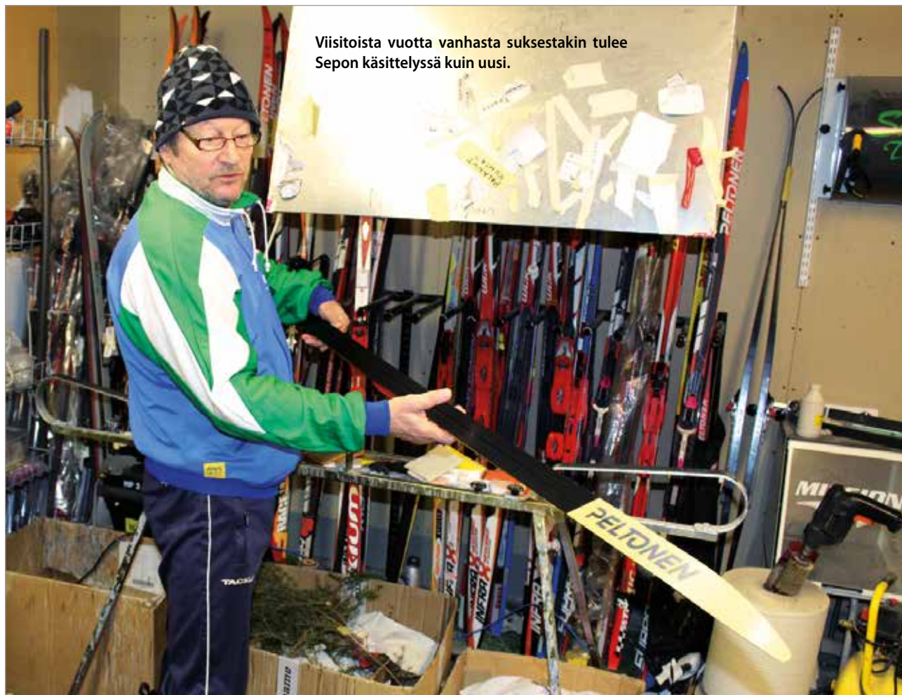
Viisitoista vuotta vanhasta suksestakin tulee Sepon käsittelyssä kuin uusi.