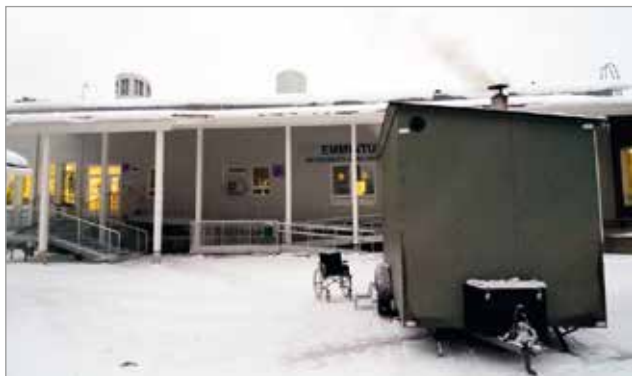
Pentti Hyryn sauna kulkeutuu auton perässä. Lähes minne tahansa.