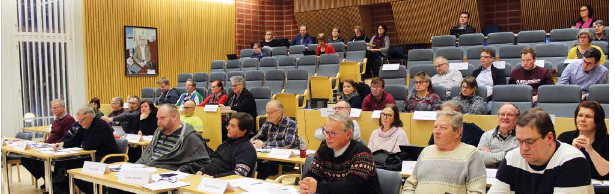
Iin kunnanvaltuusto istui 18.12.2018 lähes puolen vuorokauden mittaisen kokouksen.

Vuoden 2019 talousarvio osin talouden tasapainotustyöryhmän käsittelyyn