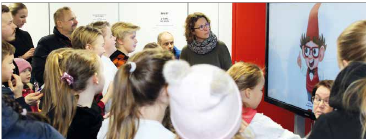
Leikkimielinen tietokilpailu kiinnosti etenkin nuoria, koska vastaamaan pääsi kännykällä.