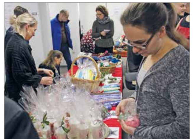
Vanhempainyhdistyksen myyjäisten tuotteita oli valmistettu yhteisissä työpajoissa.