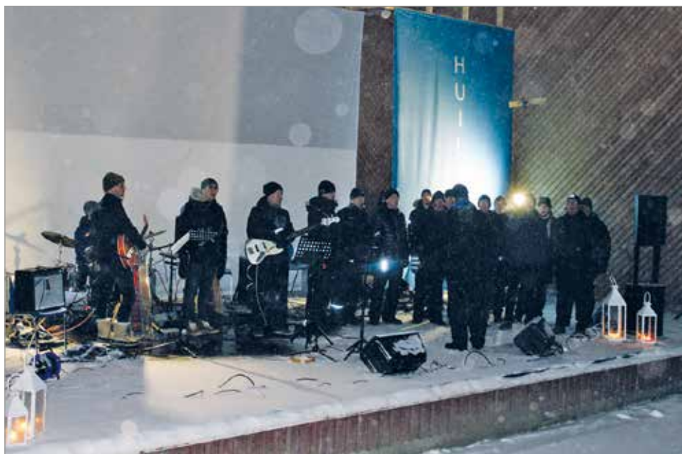
IiCoboy ja Finlandia-hymni kajahtaa komeasti.

Musiikista tilaisuudessa vastasi IiCoboy ja tilaisuus päättyi komeasti kajahtaneeseen Finlandiaan, myrskyn pauhatessa taustalla. MTR