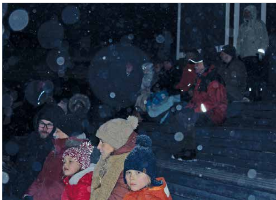
Viitisenkymmentä urheaa kokoontui myrskystä välittämättä juhlistamaan vuoden vaihtumista Huilingin tapahtuma-alueelle.