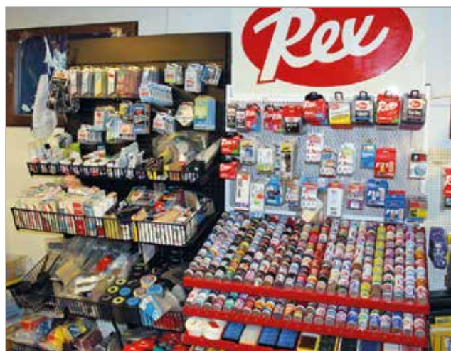
Sepolta löytyvät kaikki hiihtäjän tarvitsemat välineet ja tuotteet. Kesken suksihuoltoa kiireinen yrittäjä teki suksikaupat Haukiputaalle.

ta varten. Nanosukset eivät luista kuin kostealla nollakelillä, joten niiden suosio on hiipunut. Karvapohjat ja pitoteipit ovat lisänneet suosiotaan, Seppo toteaa hioessaan viisitoista vuotta vanhoja sukseja kohden talven latuja. MTR