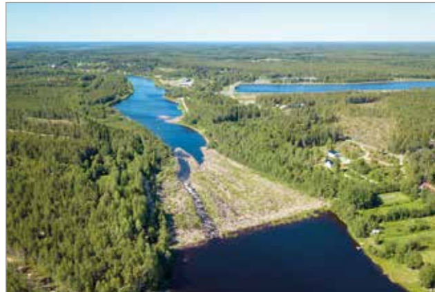
Uiskarin kalatie heinäkuussa 2018.