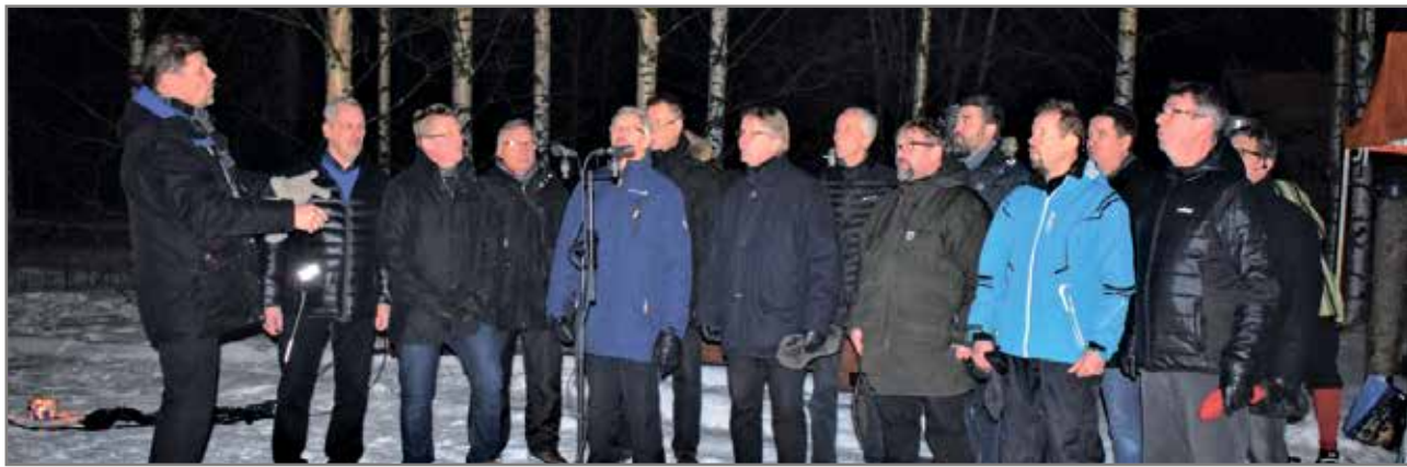
Mieskuoro Pohjan Laulu kajautti Suomen laulun ja Finlandia-hymnin.

- Mahtaa olla satoja ihmisiä. Näin kuvaili muuan Iin vuoden vaihdetta valvonut järjestysmies ihmismäärää, joka oli saapunut seuraamaan vuoden vaihtumista Iin ympäristötaidepuistoon.