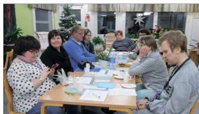
Kuvassa kehitysvammaisen omasta elämästä ja omasta kodista vilkaasti keskusteleva ryhmä.