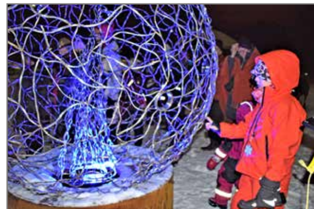
Loiistava-taideteos kiinnosti kansaa.