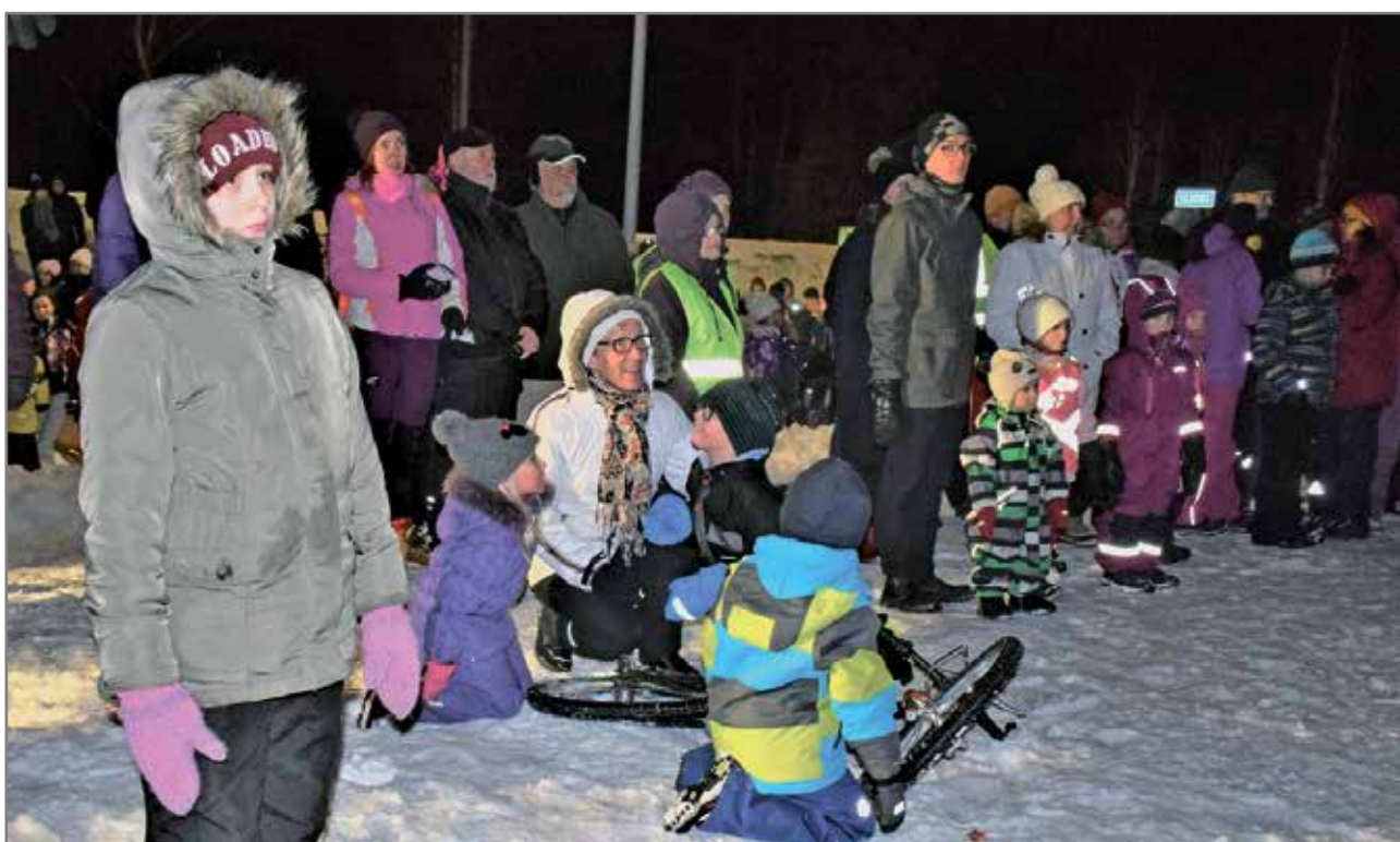
Ympäristötaidepuistoon oli kerääntynyt paljon väkeä. Mukana oli runsaasti lapsia.