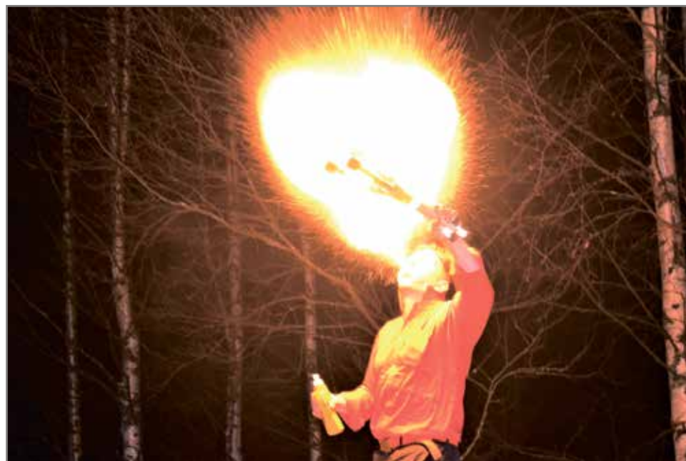
Taikuri Alfredon tulishowssa liekit leiskuivat.