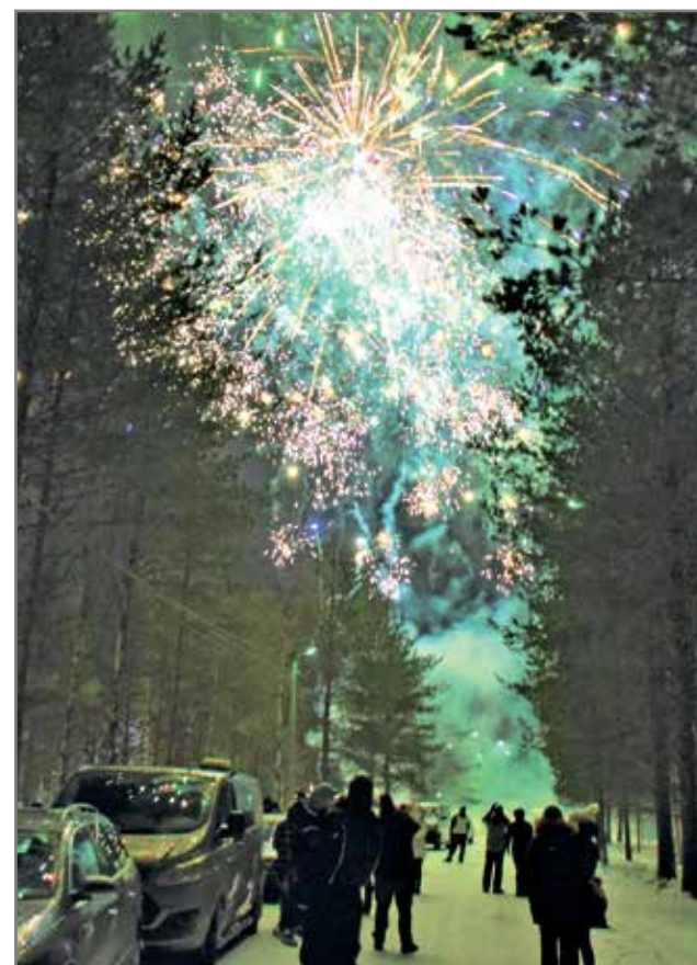
Ilotulitus oli tänä vuonna poikkeuksellisen näyttävä