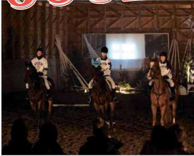
Kolme ratsastajaa pukeutui Suomi-paitoihin.