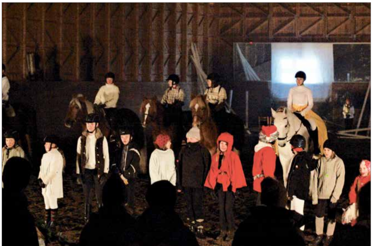
Mukana oli paljon esiintyjä.