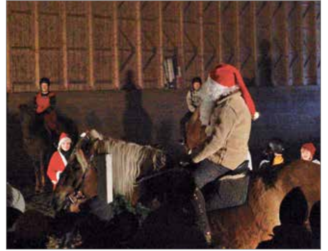
Joulupukki kävi vierailulla.

Joulukuussa Ylirannan Ratsutilalla oli tohinna, kun ratsastajat harjoittelevat esityksiään.