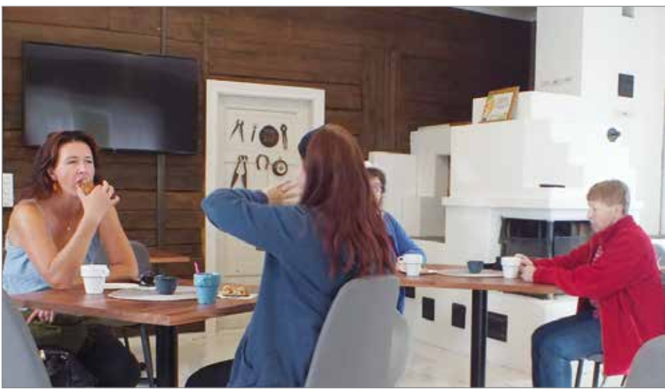
B&amp;B Villa Kauppilan avajaiskahveilla riitti kävijöitä.