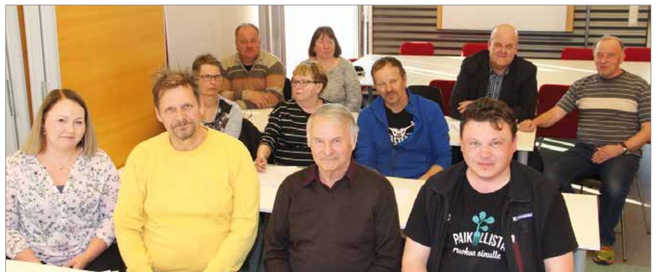
Vuosikokoukseen osallistui mukava määrä iiläisiä yrittäjiä.

Niskanen Pudasjärveltä. Hän pohti, miten yrittäjät saataisiin käyttämään yrittäjäjärjestön palveluja ja järjestön