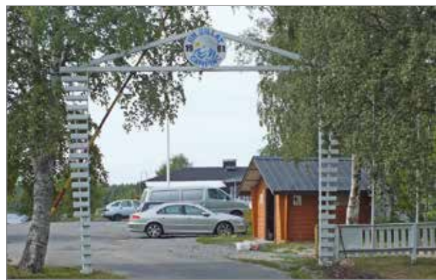
Camping Iin Siltojen uudistukset on toteutettu perinteitä kunnioittaen.

vuoden alueen yhdessä mökissä. Iisiverkon rakentamisen myötä koko Camping -alue tulee nopean nettiyhteyden piiriin.