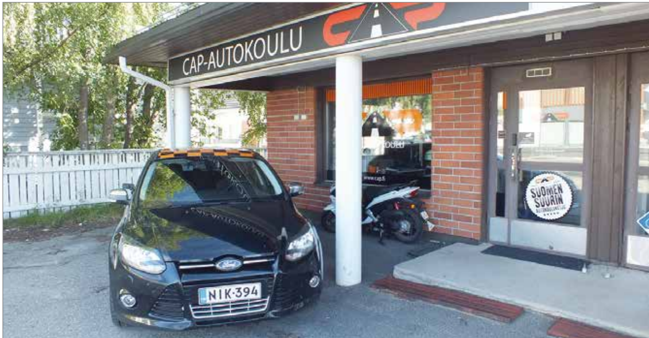
Cap-autokoulun lin toimipiste sijaitsee Haminantiellä.