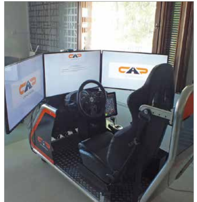
Ajo-opetuksesta voi halutessaan suorittaa jopa puolet ajosimulaattorilla.

Ajokorttilaki ja kuljettajantutkinto uudistuvat ja muutokset tulivat voimaan 1.7.2018. Uudistuksen myötä pakollisen opetuksen määrä vähenee ja tutkinnon merkitys kasvaa. Jatkossa tie ajokortin saamiseksi on yksilöllisemmin valittavissa.