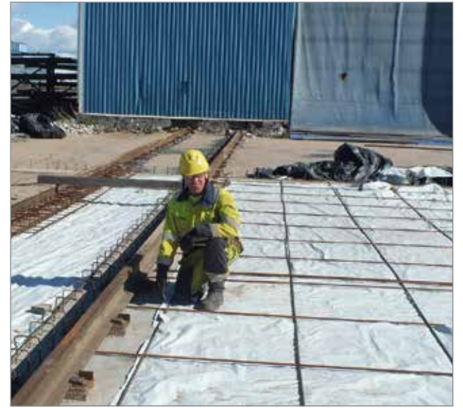
Tiiron Raudoituspalvelu Oy raudoittaa Iin Konepajan pihalle rakentuvaa 95-metristä piharataa.

Politiikassakin pistäytynyt mies on tällä hetkellä Rannikon Hevosseuran puheenjohtaja ja Iin Hiihtoseuran varapuheenjohtaja. Hevosista hän kertoo aina olleensa kiinnostunut, vaikka varsinaisesti päätyi-