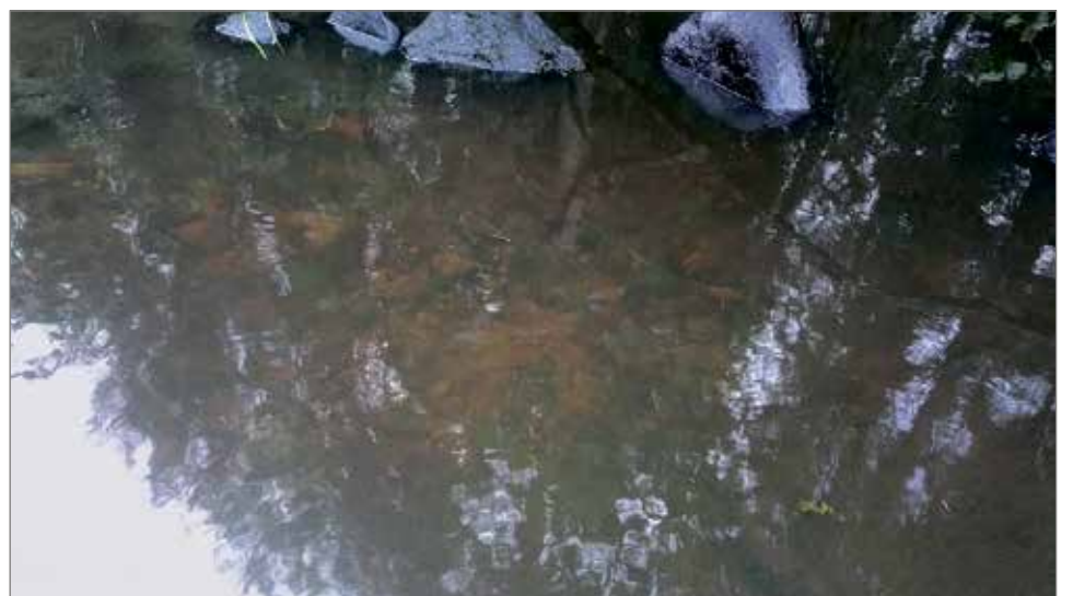
Työn tulos. Siihen on hyvä kalalla tulla kutemaan.