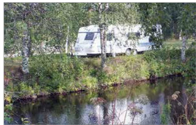
Camping Iin Silloilla voi majoittua aivan veden ääreen.