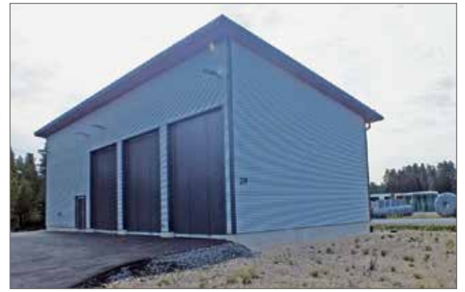
Iin jäteasema muuttaa uusiin tiloihin Yrittäjäntielle.