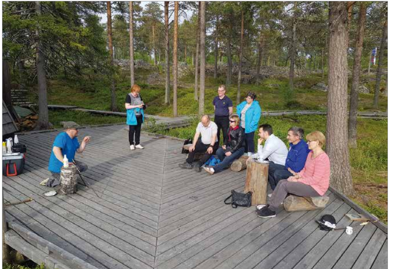
Kuva verkoston tapaamisesta kesäkuussa Merihelmessä.