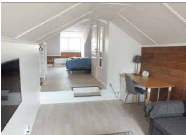
Yläkerran perhehuoneeseen majoittuu mukavasti neljä henkilöä.

Avajaisvieraiden määräästä ja kommentteista päätellen B&B Villa Kauppilan kaltaiselle majoituspaikalle on tilausta lissä. Maisemat ovat upeat ja perinteikäs talo on kunnostettu pietteillä u-