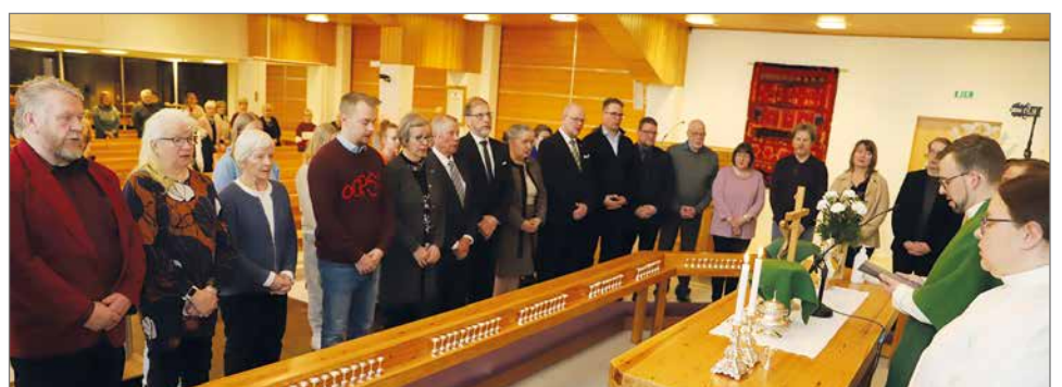
Seurakuntaelämässä eri tehtäviin kutsuttujen ja nimettyjen siunaaminen on kaunis ja arvokas perinne.