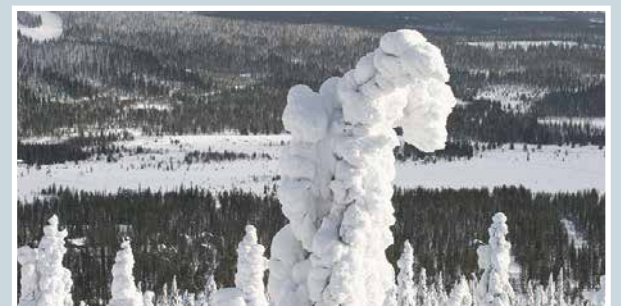
Hiihtolomalle mahtavat maisemat.

Martti Kähkönen lukijoiden palaute ja jutut: vkkmedia.fi