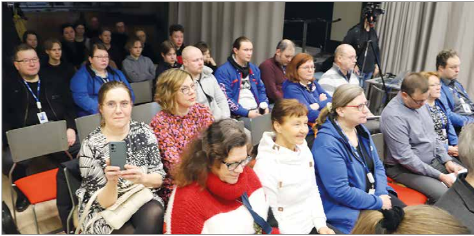
Aamuriihen osallistui yrittäjiä sekä OSAOn opettajia ja oppilaita. Osallistuminen oli mahdollista seurata myös etänä kaupungin webmasteri Juha Nymanin välittämänä.

Yrittäjien Aamuriihen tilaisuudessa keskiviikkona 15.2. OSAOlla kaupungintalossa oli esillä osaavan työvoiman saaminen yrityksiin, työnantajamielikuva ja työnantajien, opiskelijoiden ja opettajien odotuksia yhteistyölle yritysten kanssa. Tilaisuuden järjestivät yhteistyössä Pohjois-Pohjanmaan Yrittäjät ja OSAOn Pudasjärven yksikkö.