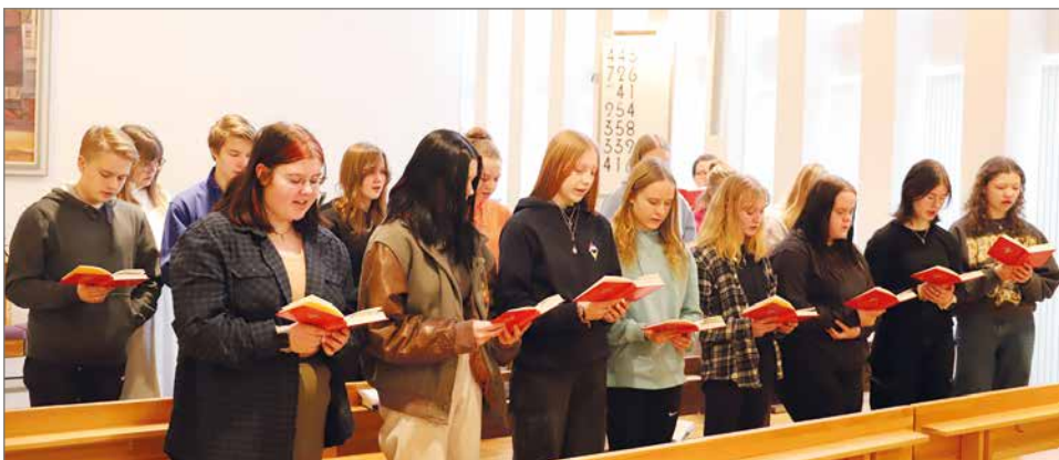
Rippikoulun ensi kesän ja seuraavan kesän isosilla oli viikonvaihteessa tehtävään perehdyttämiseen viikonloppuleiri Hilturannassa. Siihen kuului myös messussa avustaminen.