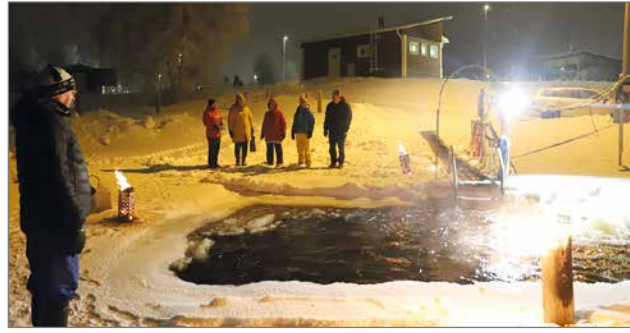
Pietarilan uintipaikka on tänä talvena tilava, jossa mahtuu ottamaan uintiliikkeitäkin ja jalat yltävät tarvittaessa myös pohjaan. Täydenkuun ja kynttilänpäiväuintille ehdotettiin myös jatkoa.

-Mukava täydenkuun tapahtuma ja kiva oli käydä avannossa. Tästä pitää tehdä perinne, tuli palautetta ja toivomusta osallistujilta. HT