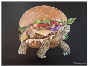
Tämän vuoden taidetta.