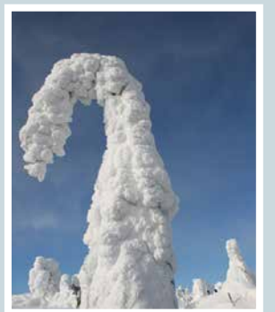
Tykkä Iso-Syötteellä.