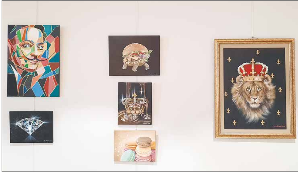
Valon päivä-näyttelyn teoksia.