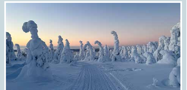
Kuva: Jorma Terentjeff: Iso-Syöte

lukijoiden palaute ja jutut: vkkmedia.fi