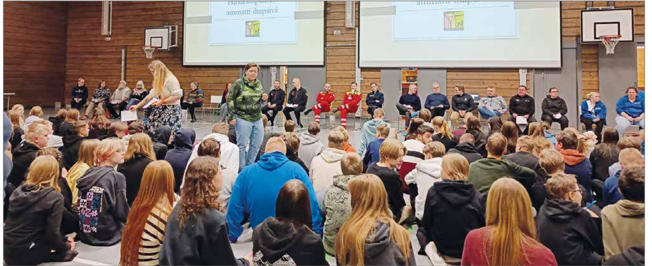
Hirsikampuksen ammatti-iltapäivässä lukion ja yläasteen oppilaat (josta kuva) saivat runsaasti tietoa eri ammateista.

Työmotivaatioina toimivat muun muassa kollegat, työpaikka ja asiakkaat. Yksi