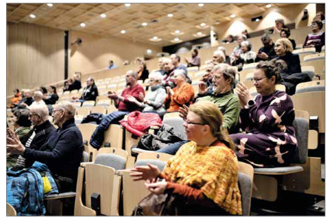
Yleisöltä tuli pontevat taputukset heti ensimmäisestä laulusta lähtien.