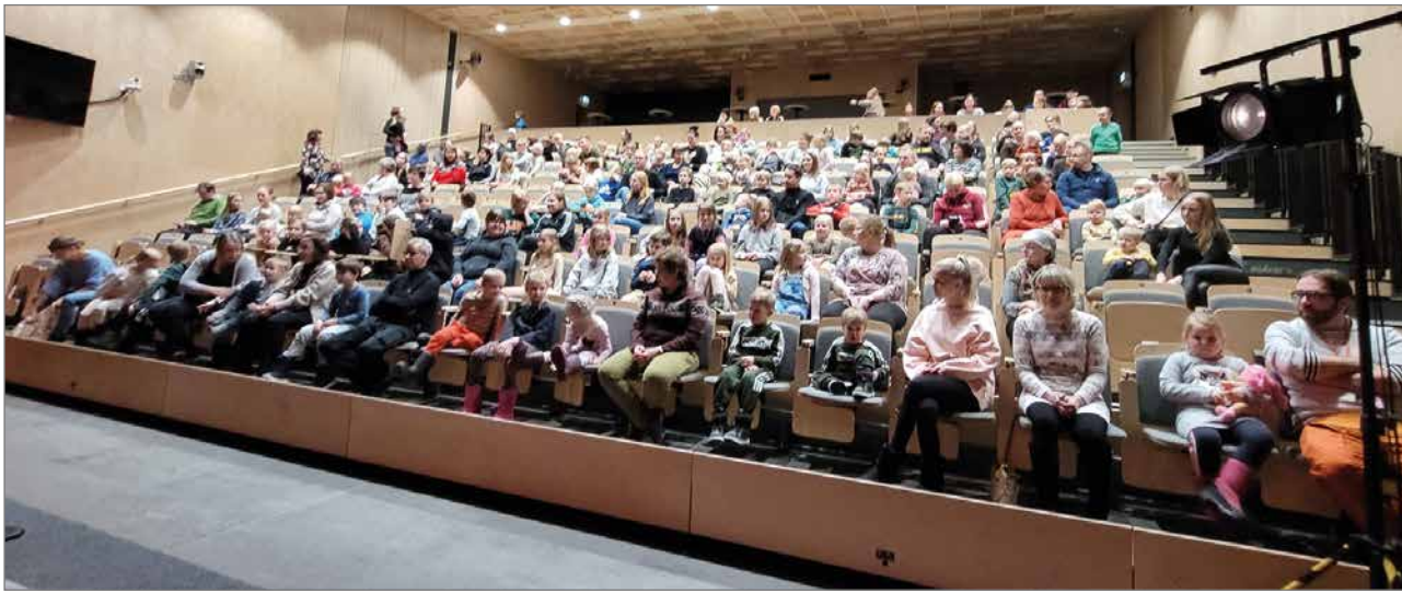
Kurkisasi oli täynnä yleisöä katsomassa lastennäytelmää. Tällaisia esityksiä halutaan lisää Pudasjärvelle, oli katsojien kommentti.