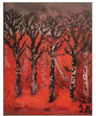
Jukka Ahonen maalasi öljyväreillä Lehtensä pudottaneen koivun vuonna 2020. Jukka ei halua taiteellaan loukata ketään.

Taiteilija Tykkyläisen mielestä erityisryhmien taiteilijoiden pitäisi enemmän saada henkilökohtaista vapautta luoda taidetta. "Enempi sotkua vaan". Oh-