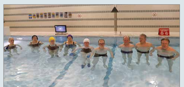
Tämän talven viimeiseen vesijumppaan torstaiamuna osallistui yhdeksän hengen vakioporukka.