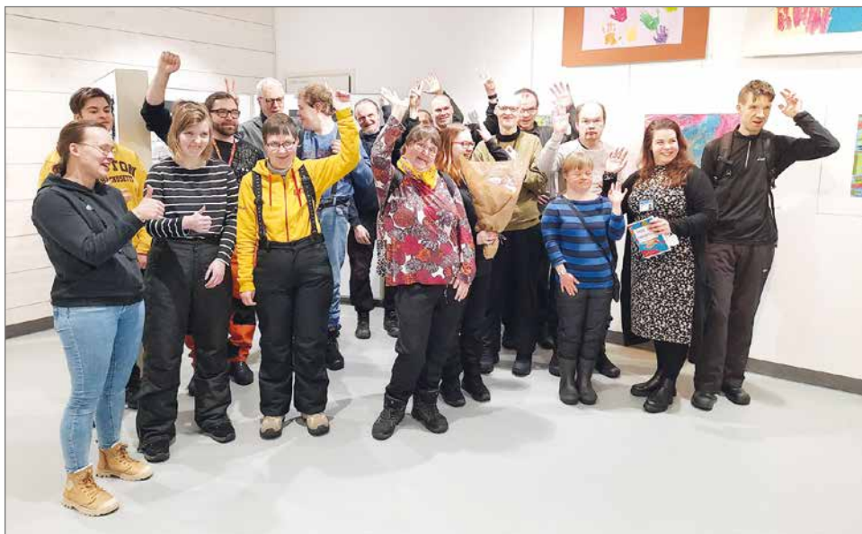
Työkeskuksen erityisryhmän taiteilijat olivat odottaneet oman näyttelypäivän avajaisia innolla. Avajaispäivä kokosi avajaisiin nelisenkymmentä juhluvieraista.