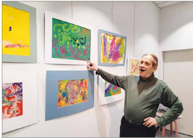
Aarne Isolan maalaama taulu kuvaa maisemaa Pudasjärveltä.