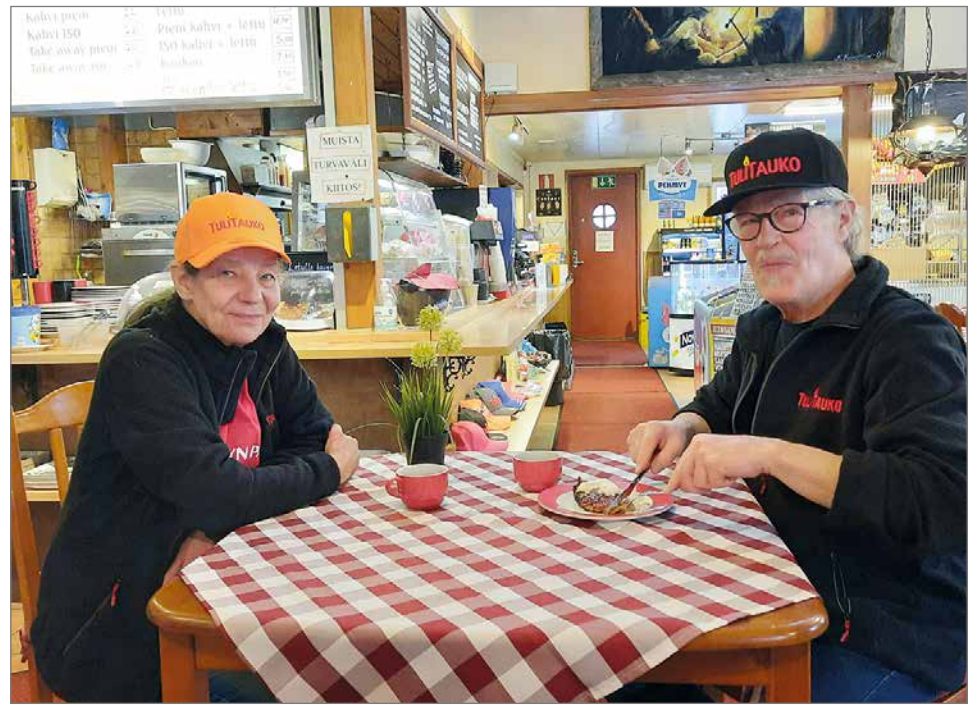
Miljoonan räiskälelen raja on rikkoutunut jo ajat sitten. Resepti taikinaan on salaisuus.