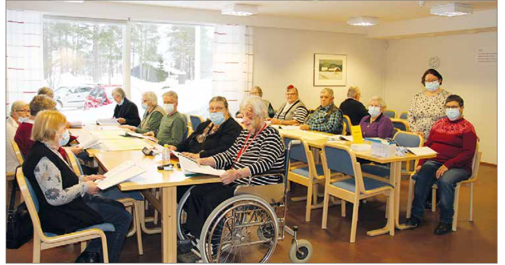
Kevään ensimmäisen kerhotapaamisen osallistujia.

Pudasjärven Invalidit ry pääsi aloittamaan kevätkauden kerhotapaamiset torstaina 10.2. ystävänpäivän merkeissä.