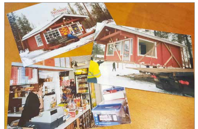
Ensimmäisessä kahvilassa oli vain pöytä ja kaksi penkkiä.

– Kerran meille tuli iso mies syömään. Oli pakkasta lä-