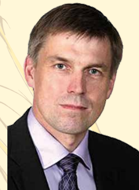
tulevien sukupolvien hyväksi.

Tämä EU:n metsähäiriköinti on saatava poikki jo ensi vuoden alussa. Suomessa tiedämme, mitä tehdä luonnon, ilmaston, talouden ja ihmisten hyvinvoinnin kannalta. Harhateillä oleva EU ei saa pilata vuosikymmenten työtä, jota tehdään