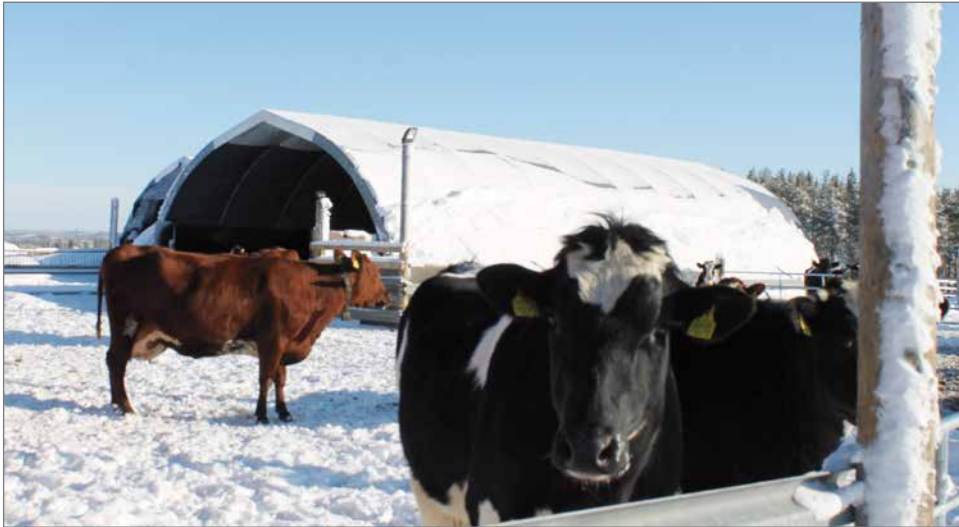
M&T Laihorinne Oy valmistaa pressuhalleja M&T Farms tuotemerkillä Lantmännen Agron myyntiin. Pressuhalleja on myynnissä muun muassa Pudasjärven K-Rauta Lantmännen Agressa.

Olemme valmistaneet pressuhalleja reilun 13 vuoden ajan ja hallivalikoimistamme ehdottomasti suosituin on maataloille ja pienyrityksille suunniteltu kaarihalli. Kaarihallit ovat 100 prosenttisesti kotimaisia ja ne valmistetaan Etelä-Pohjanmaalla Evijärvellä. Runkomateriaalina käytämme SSAB:n double grade laatuista 60,3 mm vahvaa kaksoisrakenne putkea