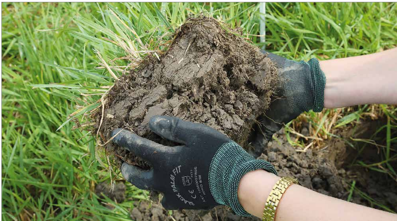
Kun turvepelloilla viljellään etupäässä nurmea, sen voi katsoa ilmastonmuutoksen kannalta hyväksyttäväksi, etenkin kun lohkot säilytetään talven yli kasvipeitteisenä ja vältetään ravinnehuuhtoumia.