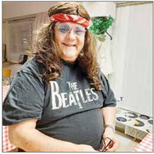
"Pitkätukkasoittajakin" oli paikalla.