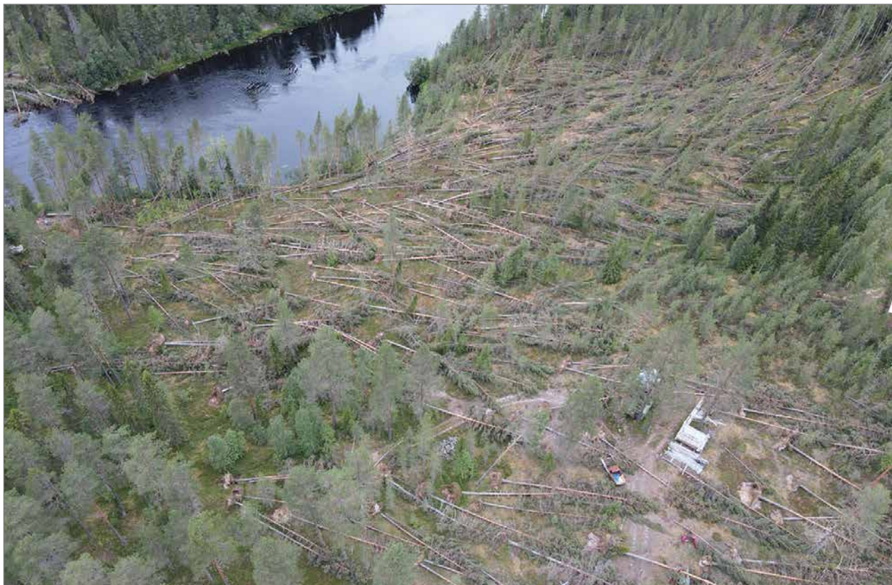
Aino myrsky kaatoi laajoilta alueilta metsää Pudasjärven, Puolangan ja Taivalkosken alueilla. Joillakin alueilla tuho oli totaalinen, kuten eräässä kohtaa Taivalkoskella.